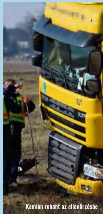
Kamion rohant az ellenőrzésbe

A baleset Gyál határában, a sztráda Szeged felé vezető oldalán történt. A híradásokból kiderül, hogy a rendőrautó fény- és hangjelzéssel haladt az autópályán. Leállítottak egy Toyotát, hogy igazoltassák a sofőrt. Ekkor egy kamion rohant a két kocsi közé, elsodorva az éppen intézkedő rendőrnőt is. A szolgálatot teljesítő fiatal nő olyan súlyos sérüléseket szerzett, hogy a helyszínen életét veszítette. A halálos áldozat mellett a balesetben ketten megsérültek, egyikük szintén rendőr.