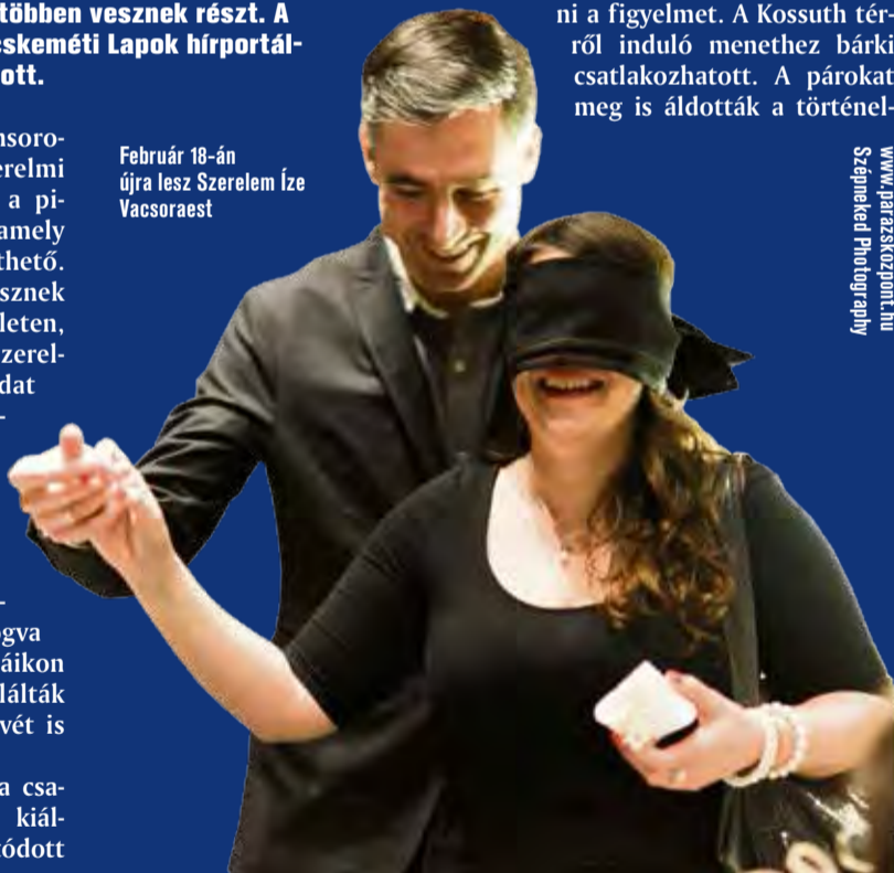
www.parazskozpont.hu Szepeneked Photography

Február 18-án újra lesz Szerelm Íze Vacsoraest