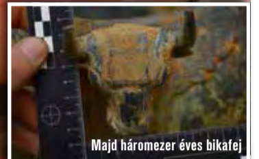
Majd háromezer éves bikafej

Egyedülálló ókori keleti műkincseket találtak tavaly ősszel a megyei vámosok és rendőrök egy török csempészkamionon. Bronztárgyak, szobrok, pénzek, pecséthengerek lapultak a nyergesvontatón, az egyik üstből például csak néhányat ismernek az egész világon. Persze a „Dárius kincse” inkább a lelet gazdagságára utal, nem konkrétan a nagy perzsa királyra, hiszen a lelet java része az Urartu nevű királyságból származik.