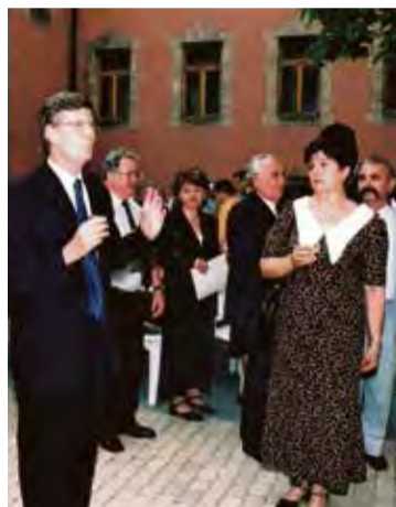
Pedagógusnapi ünnepségen, a Városháza díszudvarán