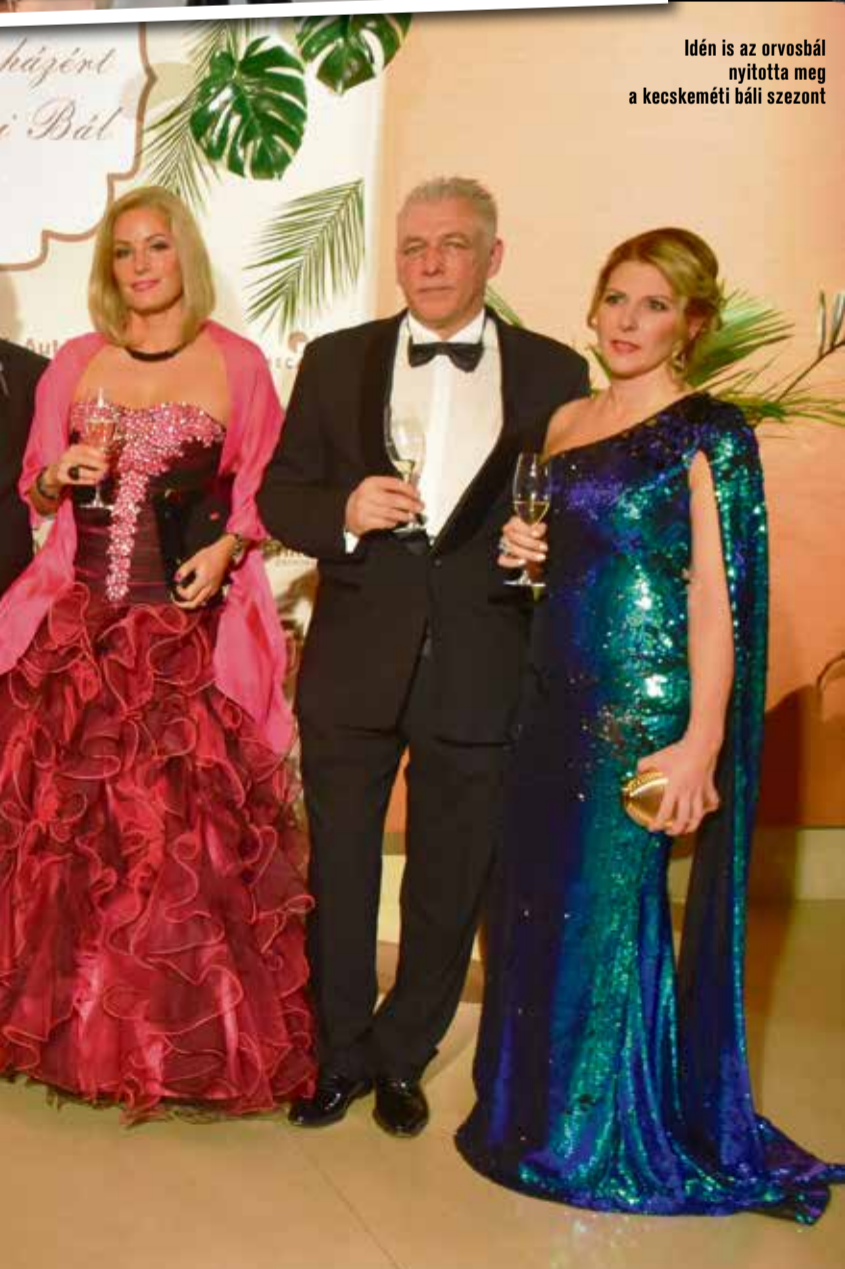
Idén is az orvosbál nyitotta meg a kecskeméti bál szezon