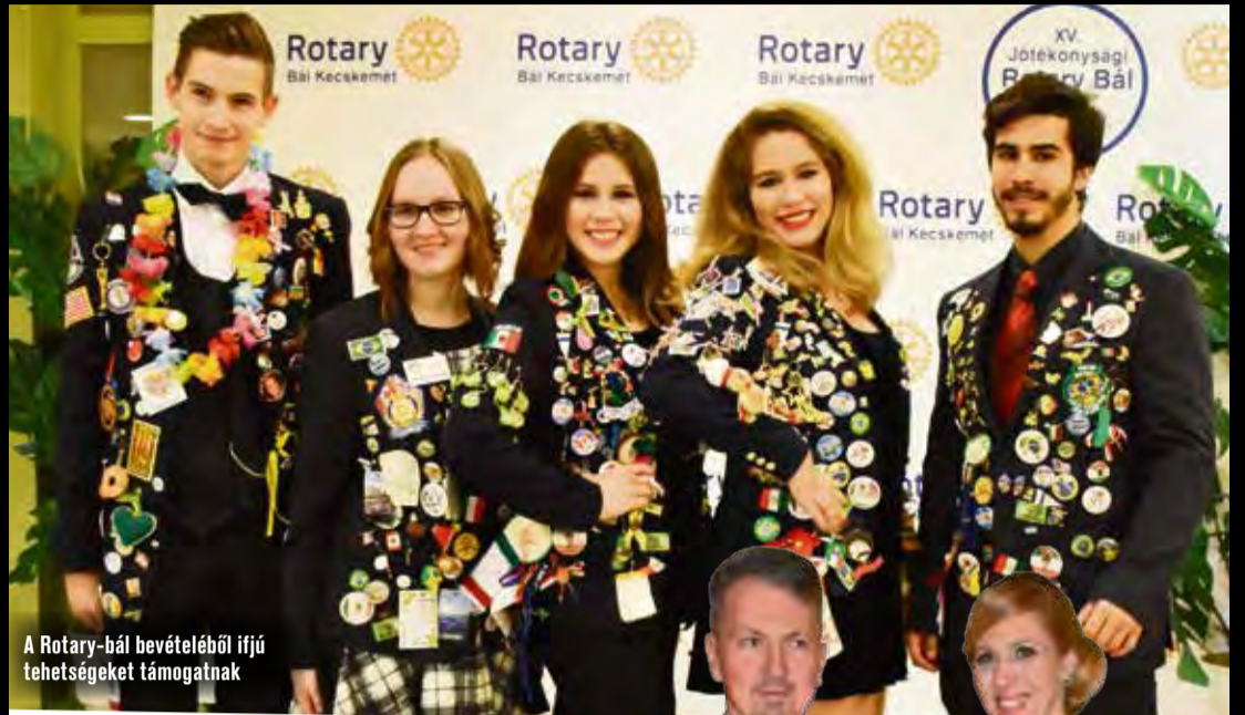
A Rotary-bál bevételéből ifjú tehetségeket támogatnak

Január és február hagyományosan a jó hangulat, a finom falatok, a mulatozás, a szépség és elegancia, egyszerűen a bálók időszaka. Kecskeméten sincs ez másképp, kicsik és nagyok is megtalálhatták a kedvükre való murit a bőséges 2017-es bál palettáról. A korábbi évekhez hasonlóan most is az orvosbál volt az első a sorban. Ezúttal azonban vetélytársa is akadt, hiszen ugyanarra a szombat estére esett a Három Gúnár Rendezvényházba szervezett Sportbál is. A Bács-Kiskun Megyei Önkormányzat Kórházáért Alapítvány bálját minden évben valamilyen nemes cél érdekében szervezik meg