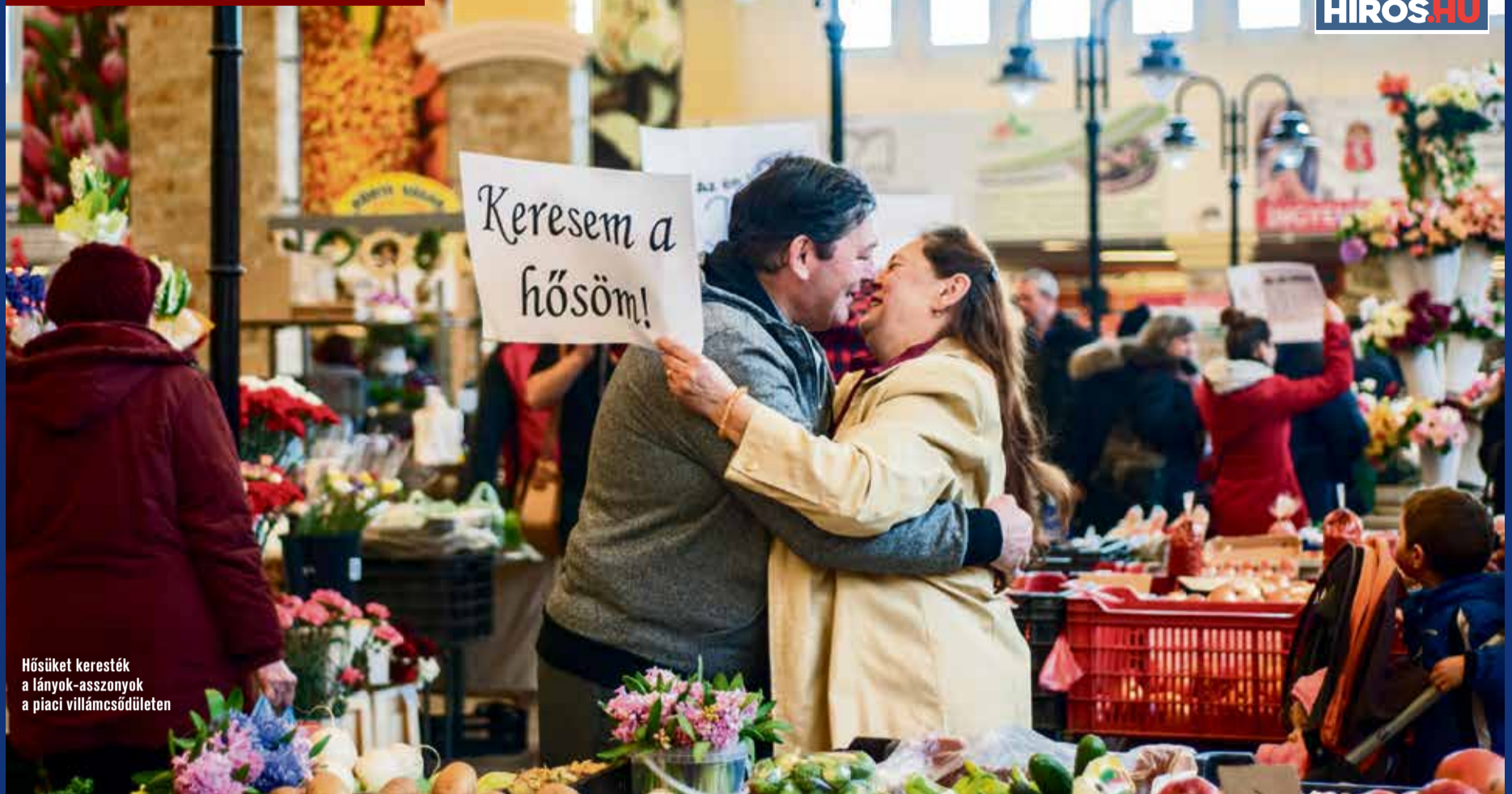
Hősüket keresték a lányok-asszonyok a piaci villámcsődületen