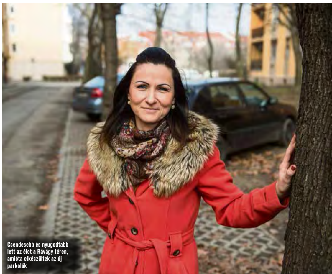
Csendesebb és nyugodtabb lett az élet a Rávágy téren, amióta elkészültek az új parkolók

– Van itt egy üzenőfalnak használatos, omladozó trafóház, amivel nagyon szeretnénk valamit kezdeni.