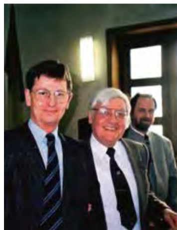
Fodor Imrével, Marosvásárhely polgármesterével