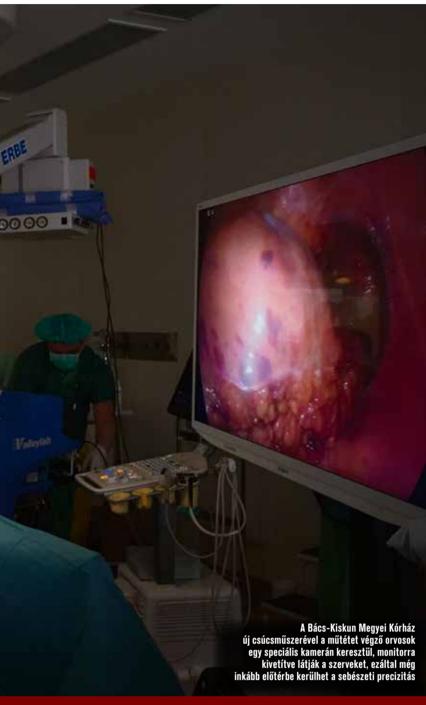
A Bács-Kiskun Megyei Kórház új csúcsműszerével a műtétet végző orvosok egy speciális kamerán keresztül, monitorra kivételesen látják a szerveket, ezáltal még inkább előtérbe kerülhet a sebészeti precizitás