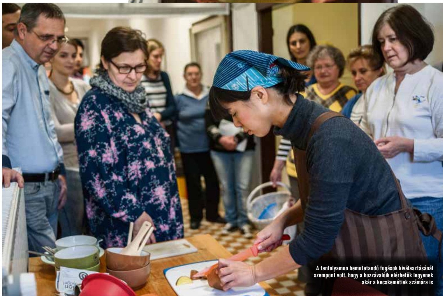
A tanfolyamon bemutatandó fogások kiválasztásánál szempont volt, hogy a hozzávalók elérhetőek legyenek akár a kecskemétiak számára is

A Junko konyhája gasztrónómiai tanfolyam következő részét február 18-án, szombaton tartják. Helyszíne a Kecskeméti Tánics Mihály Középiskolai Kollégium, Kecskemét, Nyíri út 28. A tanfolyam díja 1.500 Ft. Jelentkezés, kapcsolat, információk a kecskemet.aomori@gmail.com címen érhetőek el. Az esemény támogatója a Kecskemét-Aomori Baráti Kör és Kecskemét Megyei Jogú Város.