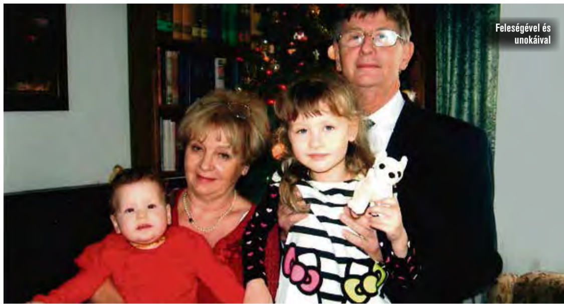
Feleségével és unokáival