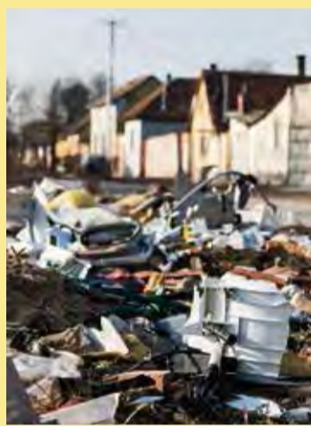
azon dolgozunk, hogyan lehetne a Kórház utca hátsó részét megtisztítani a rengeteg szeméttől.

A másik súlyos problémánk a köztisztaság. Szerencsére ma már egyre többen ismerik fel, hogy a gyerekeknek nem szabad szeméthegek között felnőniük. Több hulladékgyűjtési akciót is szerveztünk, képviselőnk is velünk együtt takarított. Persze nagyon sok még a feladat, most is