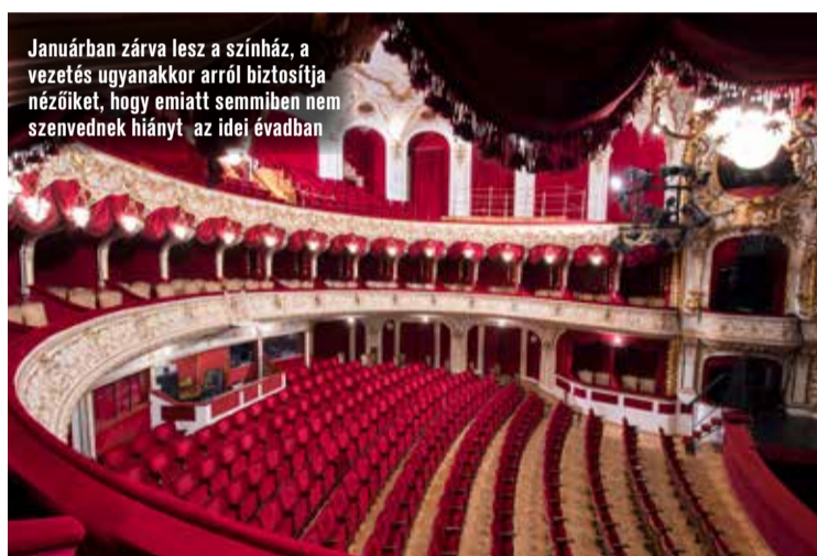
Januárban zárva lesz a színház, a vezetés ugyanakkor arról biztosítja nézőiket, hogy emiatt semmiben nem szenvednek hiányt az idei évadban

cember-januárban – több kulturális intézményt bezárnak, ugyanakkor változatlan formában – de takarékosági intézkedésekkel – működhetnek tovább a bölcsődék, óvodák, szociális és egészségügyi intézmények, valamint a Kecskeméti Fürdő és a többi sportlétesítmény is.