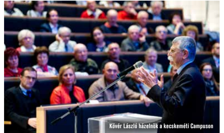
Kövér László házelnök a kecskeméti Campuson

Kiszivárgott információk szerint az Oroszország elleni 9. uniós szankciós csomag tartalmazná a szankciók nukleáris fűtőelemekre vonatkozó kiterjesztését is, ami egyértelmű csapás lenne Magyarország energiaellátására, ezért hazánk ezt semmiképpen nem fogja támogatni – hangsúlyozta Kövér László, az Országgyűlés elnöke nemrég a Mondjunk nemet a szankciókra! című országjáró sorozat keretében.