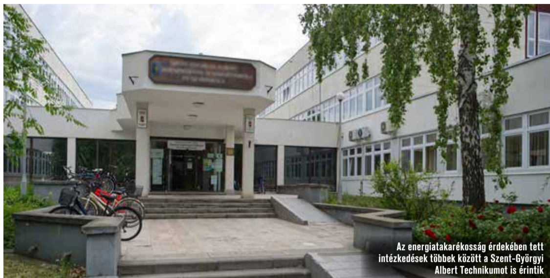
Az energiatakarékoság érdekében tett intézkedések többek között a Szent-Györgyi Albert Technikumot is érintik