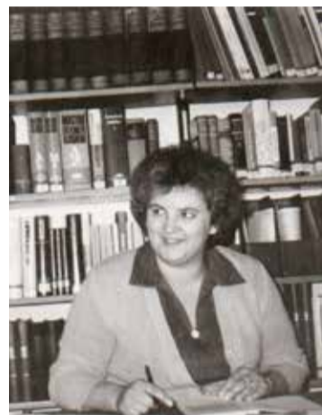
Könyvtárosi munkája közben

– Könyvtáros kollégáin kívül kikkel tart még szorosabb kapcsolatot?