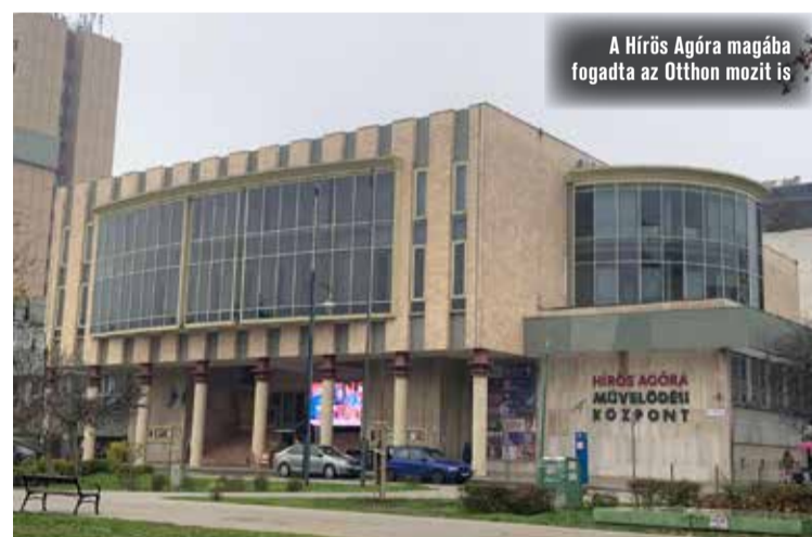
A Hírös Agóra magába fogadta az Otthon mozit is

Szintén jelentős változás, hogy a fűtésszezon idejére az Ifjúsági Otthon és vele együtt az Otthon mozi programjai és jegypénztára a Hírös Agóra központi, Deák téri épületébe kerültek át. Az Otthon mozi filmvetítései zavartalanul folytatódnak az évben az agóra tágas színháztermében. A Hírös Agóra Kulturális Központ vasárnaponként zárva tart, majd a takarékoság