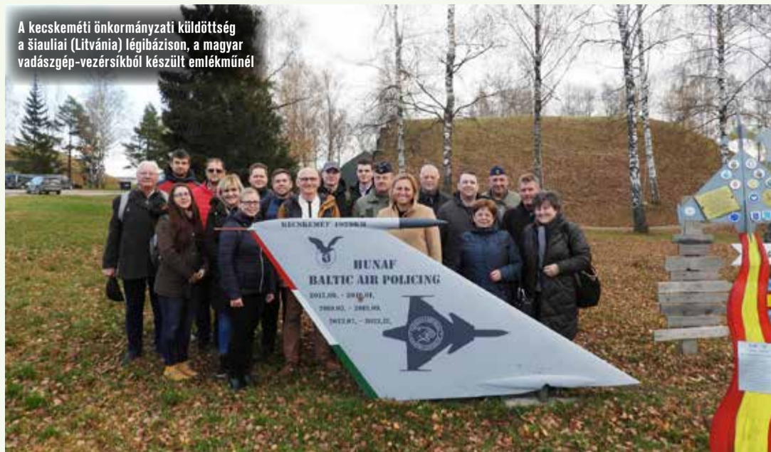
A kecskeméti önkormányzati küldöttség a šiauliai (Litvánia) légibázison, a magyar vadászgép-vezérsíkból készült emlékműnél