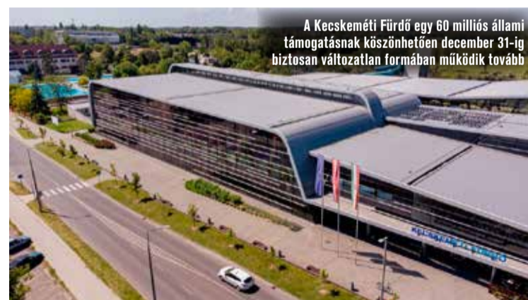
A Kecskeméti Fürdő egy 60 milliós állami támogatásnak köszönhetően december 31-ig biztosan változatlan formában működik tovább

A Kecskeméti Tankerületi Központ-hoz tartozó iskolák esetében nem terveznek intézményi összevonásokat, a fenntartásukban működő köznevelési intézmények fűtéséről a meglévő fűtési rendszerek használatával gondoskodnak, egyedileg határozva meg az épületek fűtési protokollját.