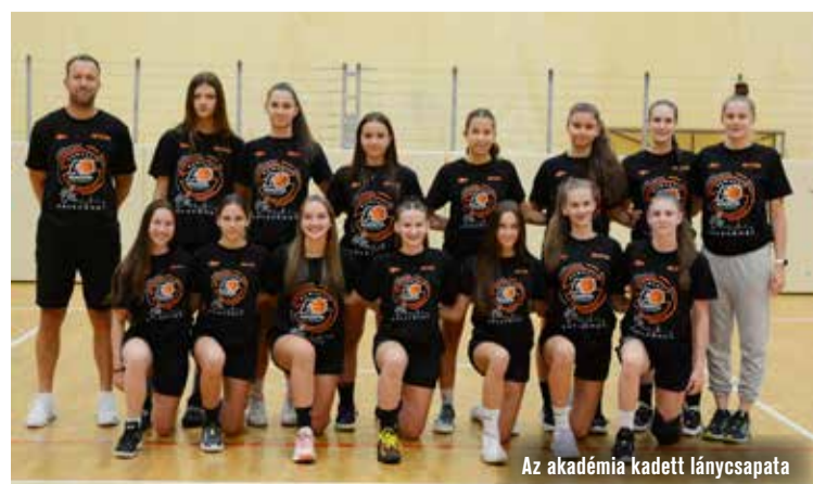
Az akadémia kadett leánycsapata

a válogatottba, de sérülés miatt nem tudott játszani. Remélem, hogy most azt a jó formát tudja tovább vinni, amit a bajnokságban mutatott eddig, és hasznos tagja lesz ő is a nemzeti gárdának.