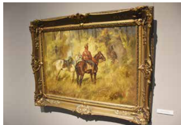
A magyar huszár Munkácsyja c. kiállítás a Cifrapalotában

Két évvel ezelőtt csak online lehetett megtartani, tavaly pedig védettségi igazolvánnyal volt látogatható a Múzeumok Éjszakája. Idén végre újra korlátozásoktól mentesen tobzódhattak a kultúrszerető kecskeméti a programkavalkádban: több mint 30 helyszín kínált izgalmasabbnál izgalmasabb eseményeket, ráadásul a szombat esti Múzej időben beleesett Kecskemét új művészeti és gasztrfesztiválja, a Street Food & Street Art és Borsétány öt napjába is.