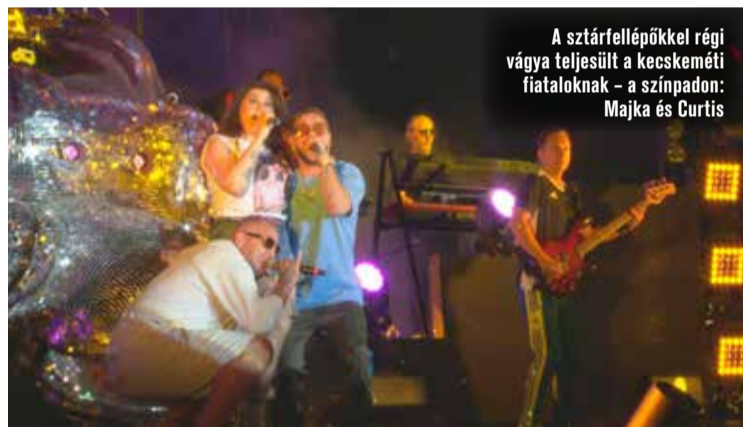
A sztárfellépőkkel régi vágya teljesült a kecskeméti fiataloknak – a színpadon: Majka és Curtis

Az önkormányzati képviselő elmondta azt is, ötödik alkalommal ren-