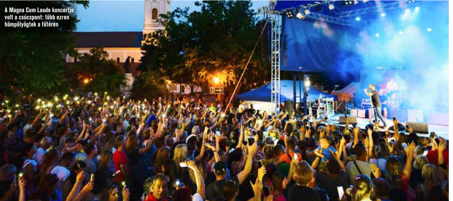
A Magna Cum Laude koncertje volt a csúcspont: több ezren hömpölyögtek a főtéren