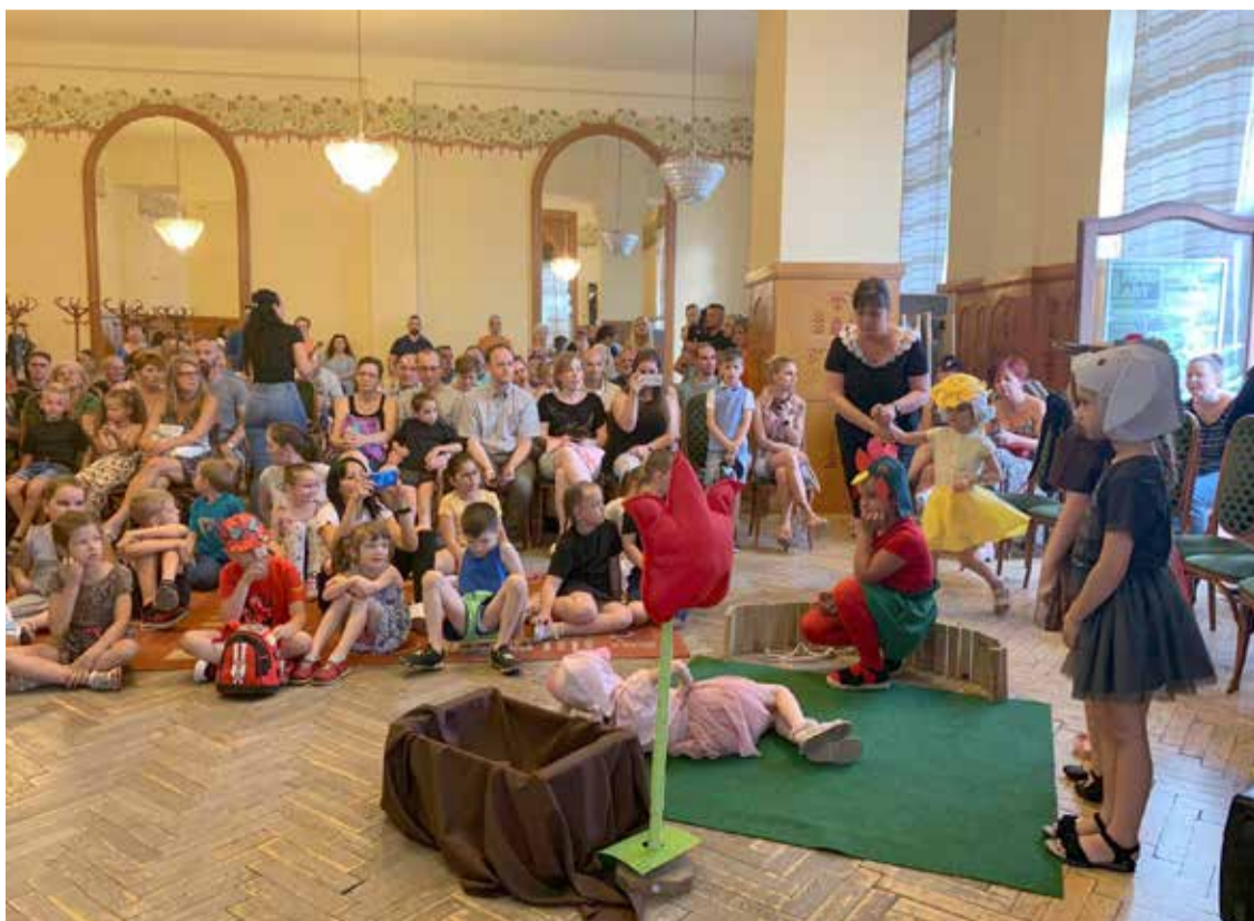
Gyógyító lámpamesék a KIO-ban

A Múzeumok Éjszakája talán leglátványosabb, legtöbb érdeklődőt vonzó rendezvénye volt a szokásos tűzugrás. A jó hangulatról ezúttal is a Kecskemét Táncegyüttes gondoskodott.