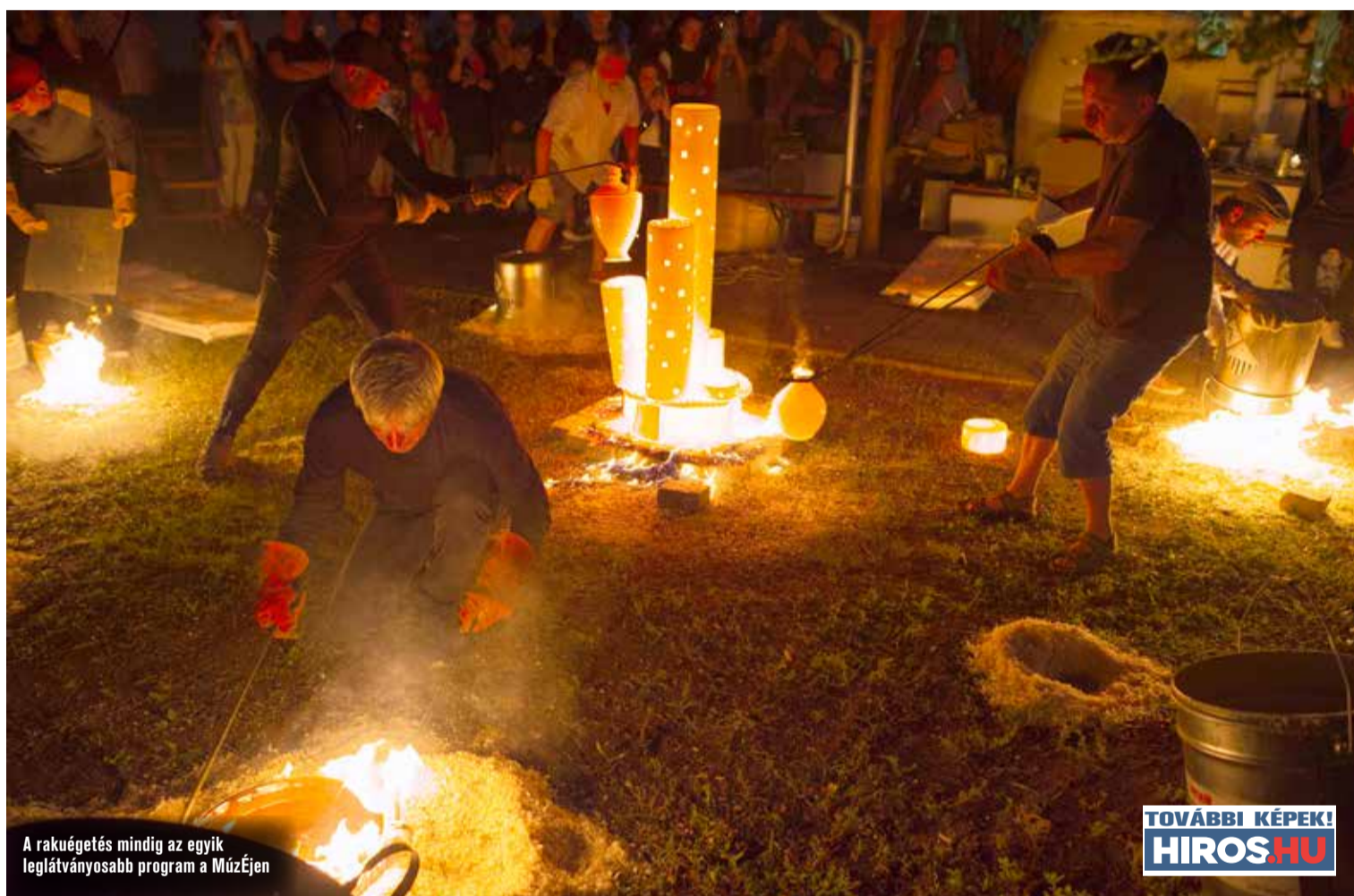
A rakuégetés mindig az egyik leglátványosabb program a Múzején