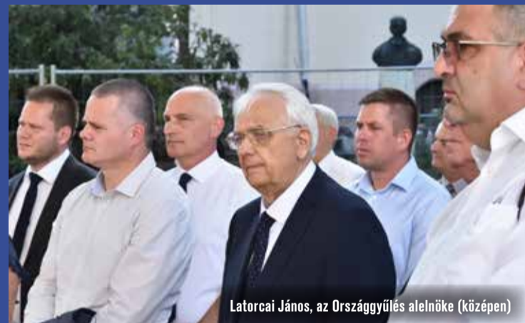
Latorcai János, az Országgyűlés alelnöke (középen)