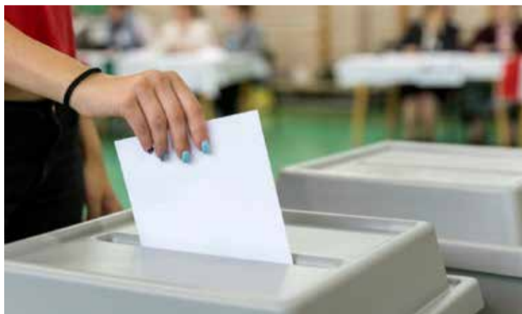
Kétnik illusztráció

tér, illetve a Mezei utca páratlan oldala. (Részletesen lásd a mellékelt térképen.)