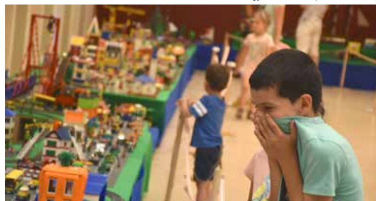
Lego-kiállítás a Hírös Agórában