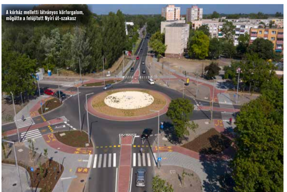
A kórház melletti látványos körforgalom, mögötte a felújított Nyíri út-szakasz

A belvárosban két másik felújítás is elkészült nemrég, mindkettő jelentős forgalmat bonyolít, és mindkettő esetében kicserélték a szegélyt, az útalapot, a burkolatot és a járdát is. A Budai utcát az Erdősi Imre utca keresztezésétől a Kada Elek utca