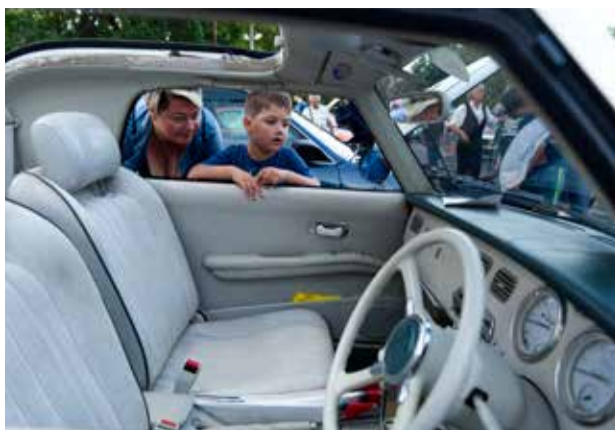
Veterán autók a Neumann János Egyetemen