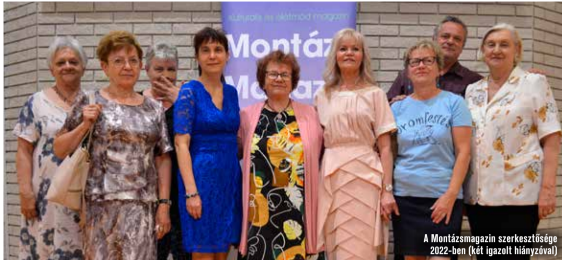
A Montázs Magazin szerkesztősége 2022-ben (két igazolt hiányzóval)