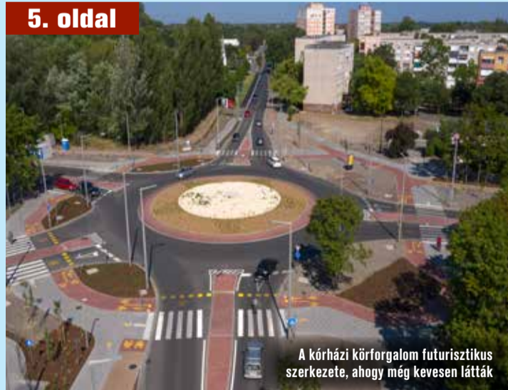
A kórházi körforgalom futurisztikus szerkezete, ahogy még kevesen látták

A kecskeméti közlekedésben meghatározó útszakaszok, fontos csomópontok felújítása és fejlesztése zárult le a városban. A közelmúltban fejeződött be a Petőfi Sándor utca – Kőhid utca kereszteződésének fejlesztése, ami jelzőlámpát, új aszfaltburkolatot és zebrát kapott. Emellett például Széchenyivárosban, Hunyadi városban, Műkertvárosban és Rendőrfaluban is több helyen új utakon járhatnak az autók. A munkák azonban nem álltak meg, számos helyen jelenleg is tartanak az útépitések, felújítások.