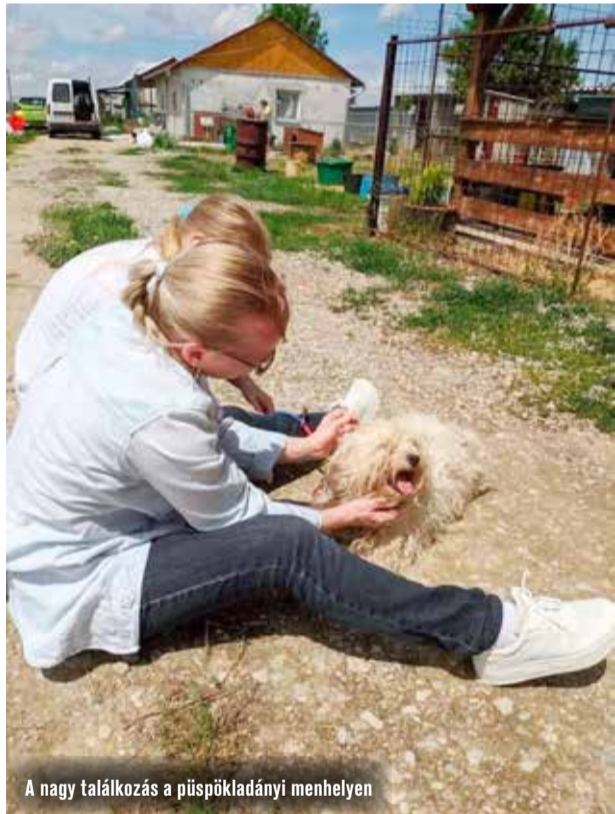
A nagy találkozás a püspökladányi menhelyen