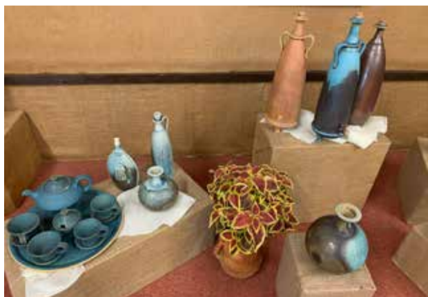
Bánföldi Ferenc kiállítása a népi iparművészetiben