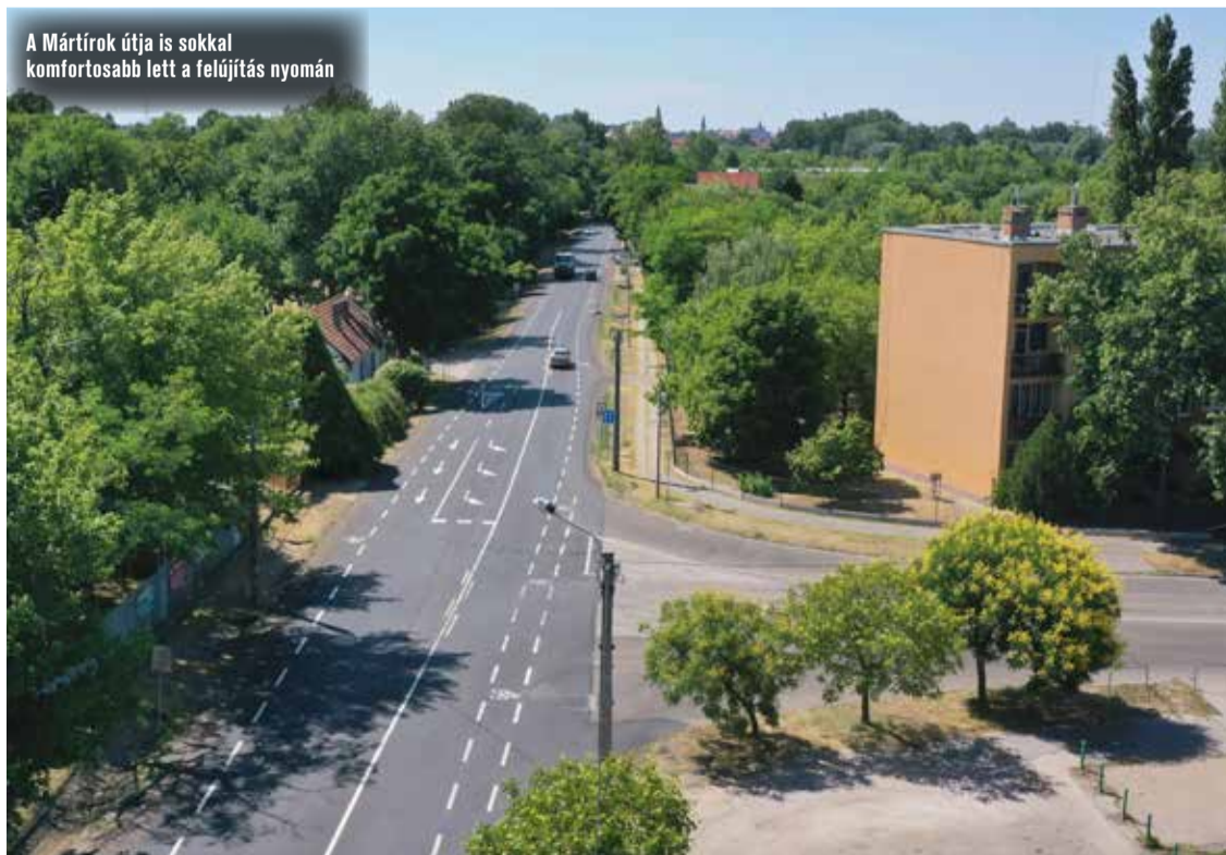
A Mártírok útja is sokkal komfortosabb lett a felújítás nyomán

Szintén új burkolatnak örülhetnek a Mártírok útján közlekedők. A városrész egyik meghatározó útszakaszának felújítása június végén fejeződött be. A több mint bruttó 235 millió forintból elkészült új burkolat a Műkert sétánytól indul és a Klebelsberg Kunó utcáig tart. A munkálatok során megtörtént az útalap és a burkolat bontása, építése és a buszöblök is új aszfaltot kaptak.