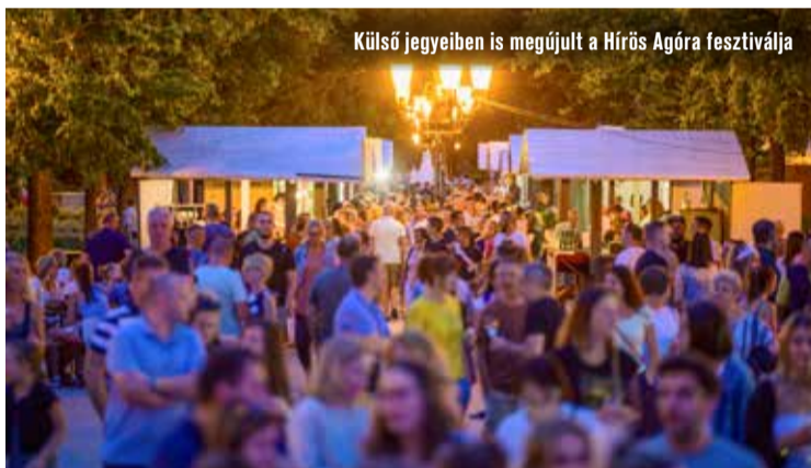
Külső jegyeiben is megújult a Hírös Agóra fesztiválja

kedvű lazítás került előtérbe. Előbbiről gondoskodtak a sztárfellépők, utóbbiról pedig a 11 minőségi borá-