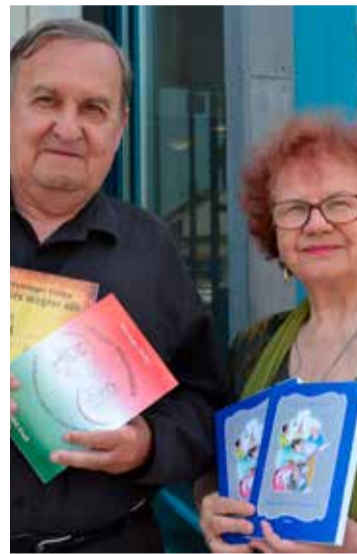
Férjével az Ünnepi Könyvhétén, könyveik dedikálása után, 2022. június 9-én