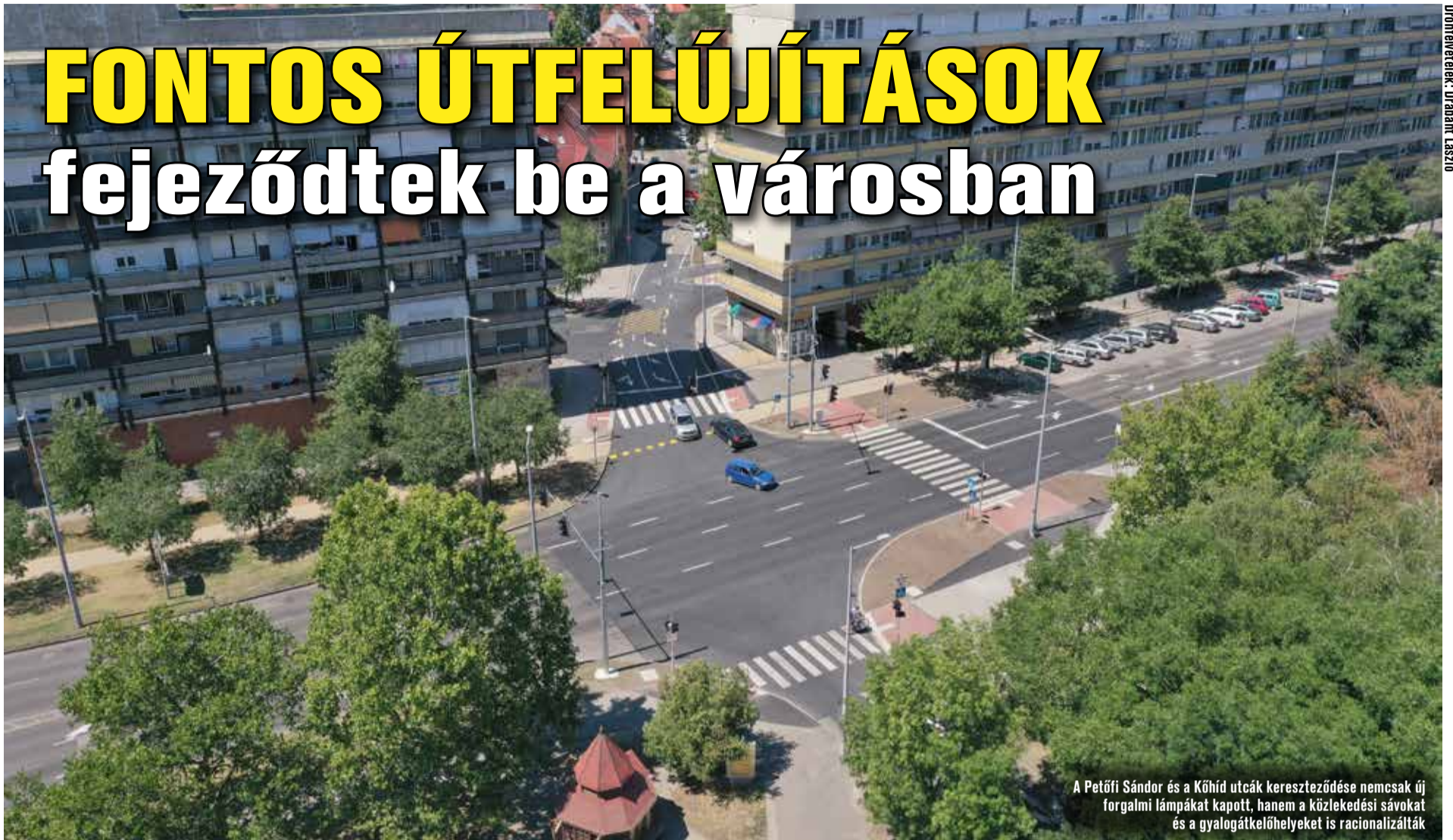
A Petőfi Sándor és a Kőhíd utcák kereszteződése nemcsak új forgalmi lámpákat kapott, hanem a közlekedési sávokat és a gyalogátkelőhelyeket is racionalizálták

A kecskeméti közlekedésben meghatározó útszakaszok, fontos csomópontok felújítása és fejlesztése zárult le a városban. A közel-múltban fejeződött be a Petőfi Sándor utca – Kőhíd utca kereszteződésének fejlesztése, ami jelzőlámpát, új aszfaltburkolatot és zebrát kapott. Emellett például Széchenyivárosban, Hunyadvárosban, Műkertvárosban és Rendőrfaluban is több helyen új utakon járhatnak az autósok. A munkák azonban nem álltak meg, számos helyen jelenleg is tartanak az utépítések, felújítások.