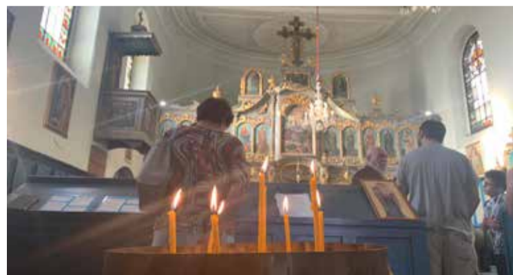
Ortodox egyházművészet