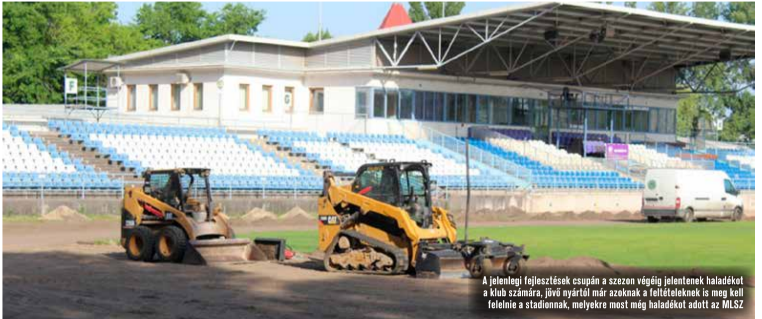
A jelenlegi fejlesztések csupán a szezon végéig jelentenek haladékat a klub számára, jövő nyártól már azoknak a feltételeknek is meg kell felelnie a stadionnak, melyekre most még haladékat adott az MLSZ

A KTE ügyvezetője elmondta, az MLSZ jelenleg türelmi időt adott több kötelezően előírt feltétel megvalósítására is.