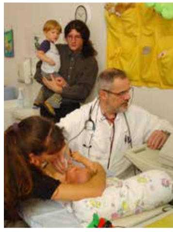
A Bethesda Gyermekkórházban