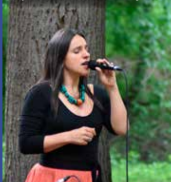
Palya Bea elvarázsolta a közönséget