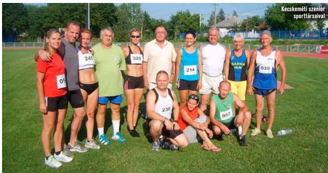
Kecskeméti szenior sporttársaival

– Egy sportolóknak két halála van: amikor elkezdődik és amikor befejeződik. A kettő közül az első a könnyebb, mert ugyan nagyon nehéz az indulás és sok-sok lemondással jár együtt, hiszen rengeteg időt és energiát vesz el a családtól, a tanulástól, a munkától és persze a szórakozástól, de ott van benne az eljövendő sikerek ígérete is. A sportpályafutás lezárása ugyanakkor egy teljesen más érzés, legalábbis számomra ez így volt: mintha sűrű fehér ködbe ugrottam volna, és csak toltak föl bennem a kérdések, hogy mi lesz velem, hogyan tovább, mit fogok csinálni stb. Mégis ezt az utat választottam, aminek elsősorban egészségügyi okai voltak. A versenyeken és az edzéseken végrehajtott számtalan dobás, az erős igénybevétel elköptatta a szervezetem. Orvosi beavatkozásra lett volna szükségem a folytatáshoz, én azonban – látva néhány hasonló helyzetben lévő sporttársam és ismerősöm sikertelen mütétjét – ezt nem vállaltam. Döntésemet – melyet a 2012-es Európa-bajnokságon balszerecsés körülmények között szerzett térd sérülésem is megerősített – nem bántam meg, mert azóta is jól megvagyok, a legfeljebb havi rendszerességgel jelentkező kisebb fájdalmaimmal már megbarátkoztam. Így teljes életet élek, tudok dolgozni és legfőképp együtt lehetek a családommal. Egyik unokám kérésére egyébként később még két nagy nemzetközi versenyen részt vettem, a Speciális Dobószámok Világbajnokságán 2017-ben és 2019-ben egy-egy érmet szereztem.