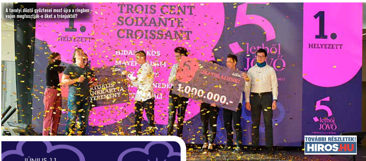
A tavalyi döntő győztesei most újra a ringben – vajon megfosztják-e őket a trónjuktól?