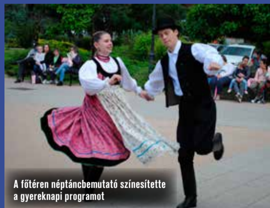
A főtéren néptáncbemutató színesítette a gyereknap programot