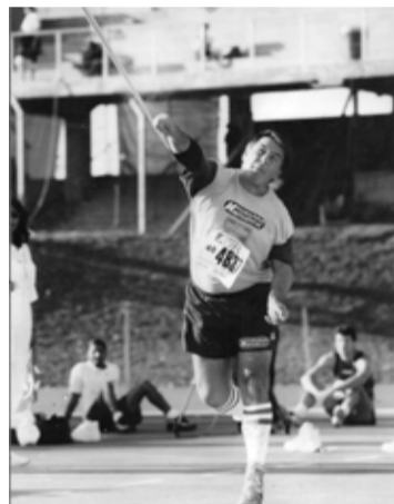
1994-ben Hamburgban, az Allianz Olimpián gerelyhajításban aranyérmet szerzett

– Mennyiben változott meg az élete 2012 után?