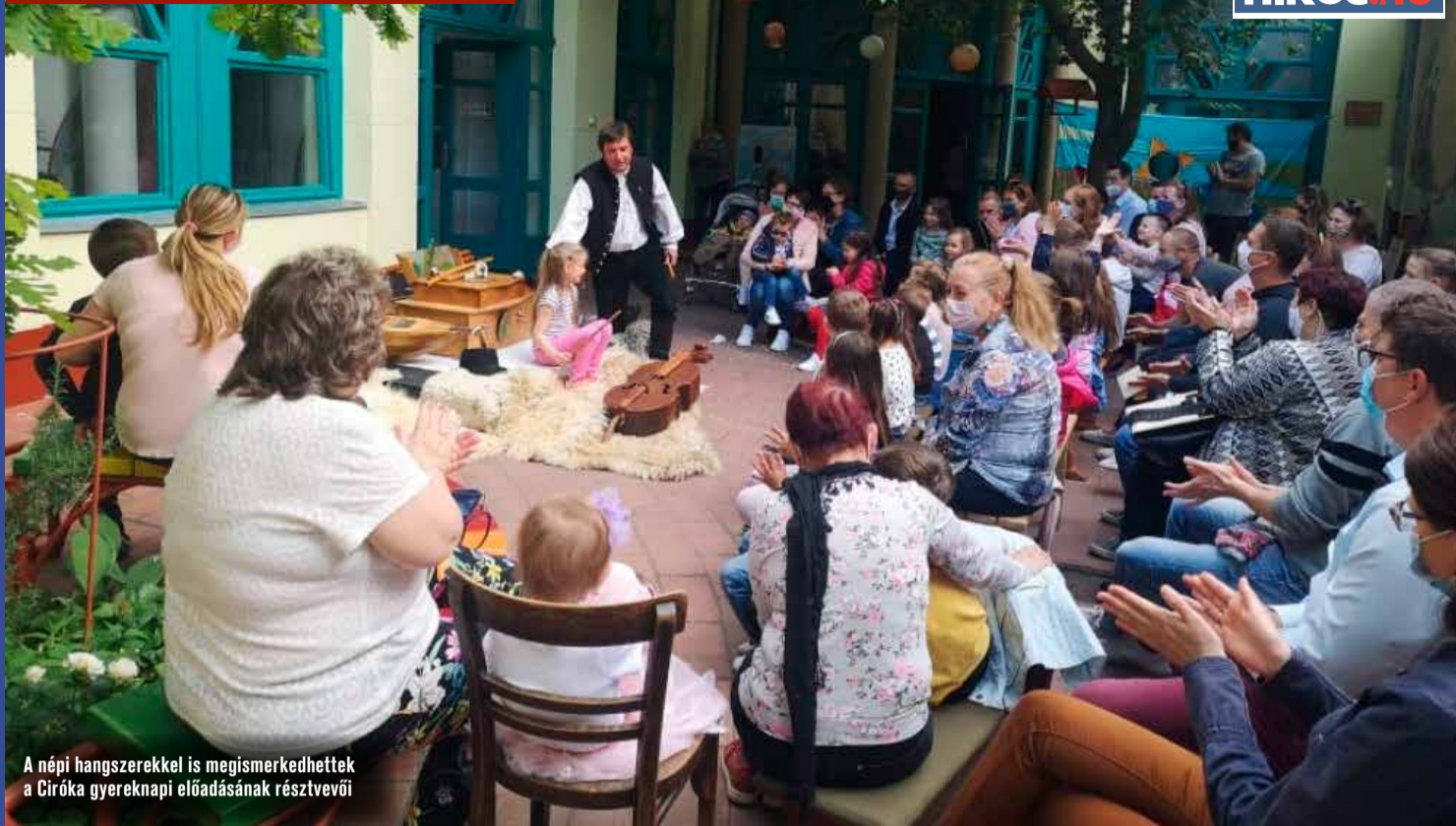
A népi hangszerekkel is megismerkedhettek a Círóka gyereknap előadásának résztvevői