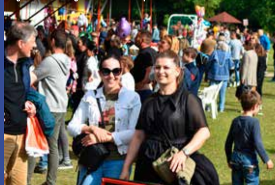
Igazi vásári hangulat volt vasárnap Tőserdőn