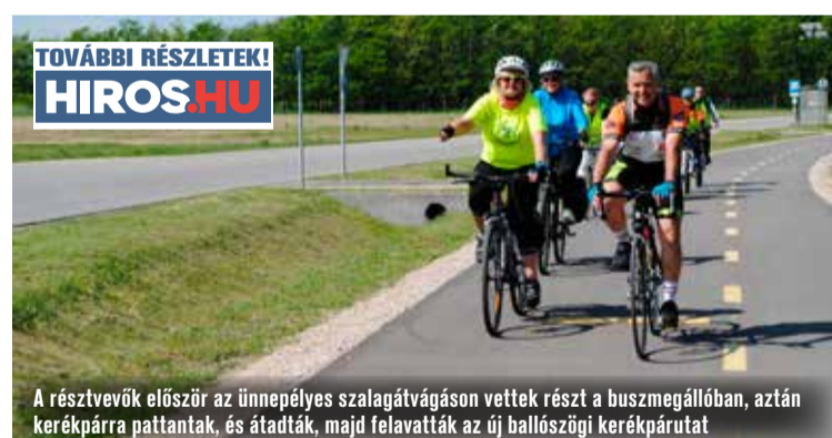
A résztvevők először az ünnepélyes szalagátvágáson vettek részt a buszmegállóban, aztán kerékpárra pattantak, és átadták, majd felavatták az új ballószögi kerékpárutat

Ünnepélyes keretek között adták át a ballószögi központi buszmegállót és a települést Kadafalvával összekötő kerékpárutat múlt szombaton. Az eseményen részt vett Somogyi Lajos polgármester, Szeberényi Gyula Tamás, Kecskemét alpolgármestere és dr. Mák Kornél, a Bács-Kiskun Megyei Közgyűlés alelnöke.