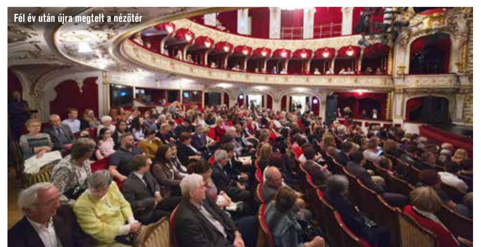
Fél év után újra megtelt a nézőtér

A színházban speciális légsterilizáló készülék gondoskodik a nézők egészségének megóvásáról. A jelenleg érvényben lévő kormányrendelet szerint az előadásokat a védettségi igazolvánnyal rendelkezők látogathatják. Belépésnél a színház munkatársai a védettségi igazolványt és a személyi igazolványt együttesen ellenőrzik. Az előadásra érkezők a színház területén maszkhasználat nélkül tartózkodhatnak. Az előadásra érkező 18 éven aluliak csak védettségi igazolvánnyal rendelkező felnőtt kíséretében léphetnek be az épületbe.