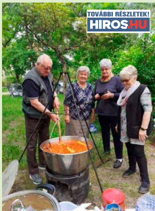
TOVÁBBI RÉSZLETEK! HIROS.HU