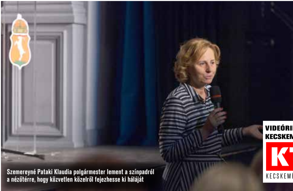
Szemereyné Pataki Klaudia polgármester lement a színpadról a nézőtérre, hogy közvetlen közelről fejehesse ki háláját

VIDEÓRIPORTUNK A KECSKEMETITV.HU-N KTV KECSKEMÉTI TELEVÍZIÓ