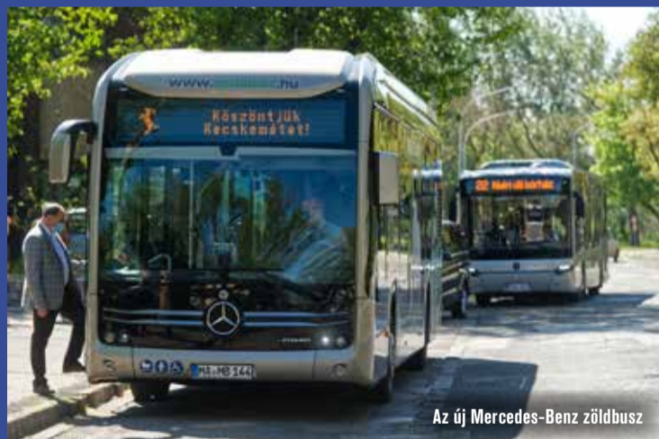
Az új Mercedes-Benz zöldbusz