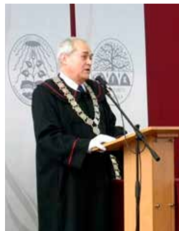
Rektorhelyettesként a Kecskeméti Főiskola diplomaosztó ünnepségén 2011-ben

marosan érkezik, mert nálunk ebédel, utána meg viszem majd edzésre.