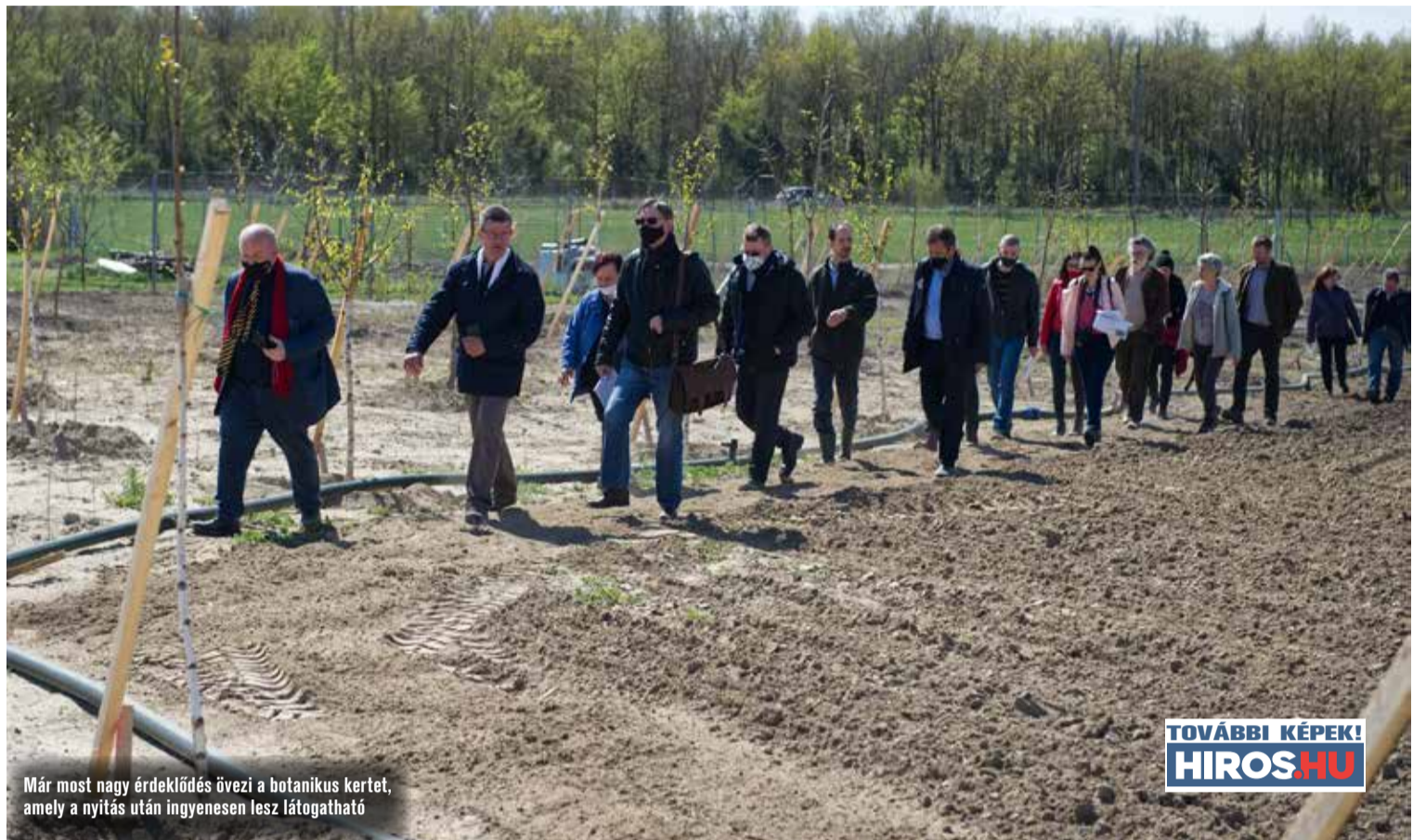
Már most nagy érdeklődés övezi a botanikus kertet, amely a nyitás után ingyenesen lesz látogatható