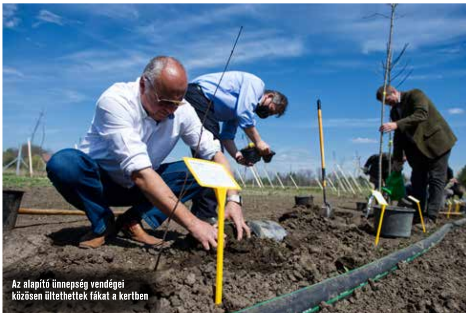
Az alapító ünnepség vendégei közösen ültethettek fákat a kertben