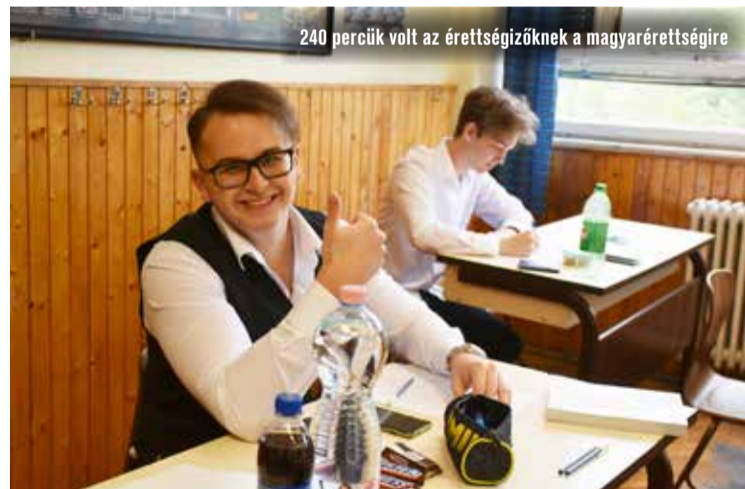
240 percük volt az érettségizőknek a magyarérettségire