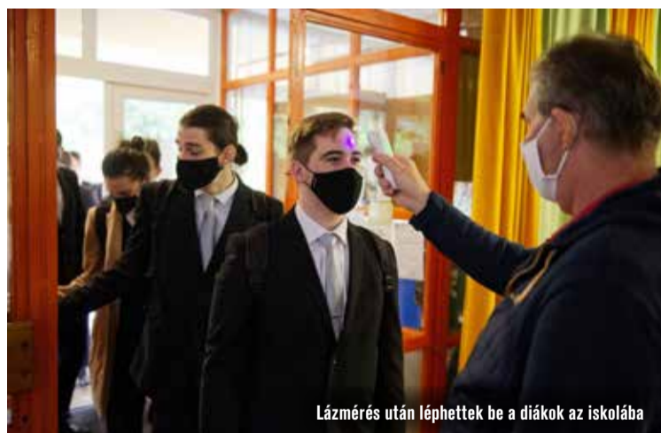
Lázmérés után léphettek be a diákok az iskolába

A tantárgyak száma főként a szakmai érettségik miatt ilyen magas, a legtöbbben azonban idén is magyarból írásbeliztek: középszinten 71 121-en, emelt szinten 2380-an. Kedden matematikából több mint 73 ezren, szerdán történelemből 74 ezren, csütörtökön angolból 68 ezren, pénteken németből 15 ezren tettek érettségi vizsgát a végzősök.