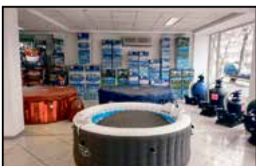
30 év tapasztalat