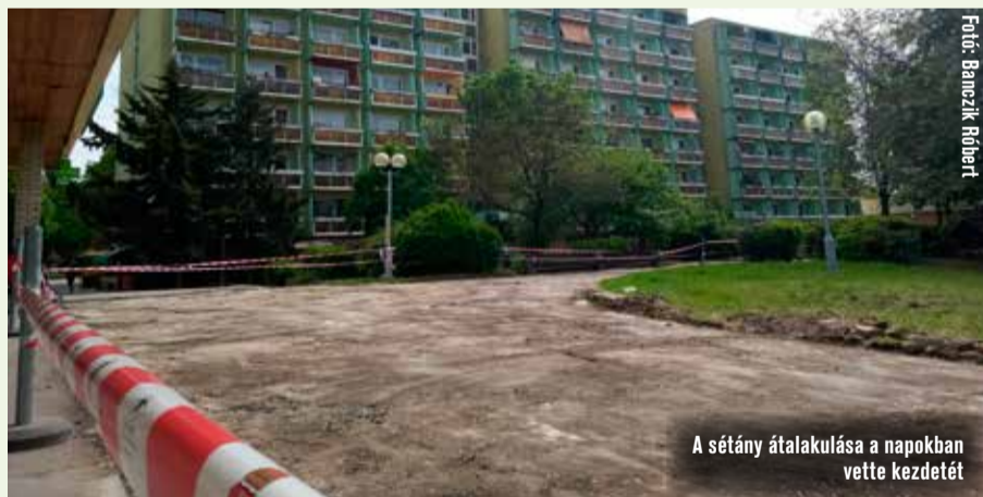
A sétány átalakulása a napokban vette kezdetét

Az aszfaltburkolat és a járólapok bontásával kezdődött meg a Széchenyi sétány Széchenyivárosi Fiókkönyvtár melletti részének felújítása. Ezzel az „Arany-szarvas és környékeként” ismert terület Széchenyiváros újabb zöld szigetévé válik.