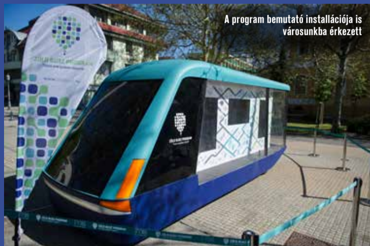
A program bemutató installációja is városunkba érkezett