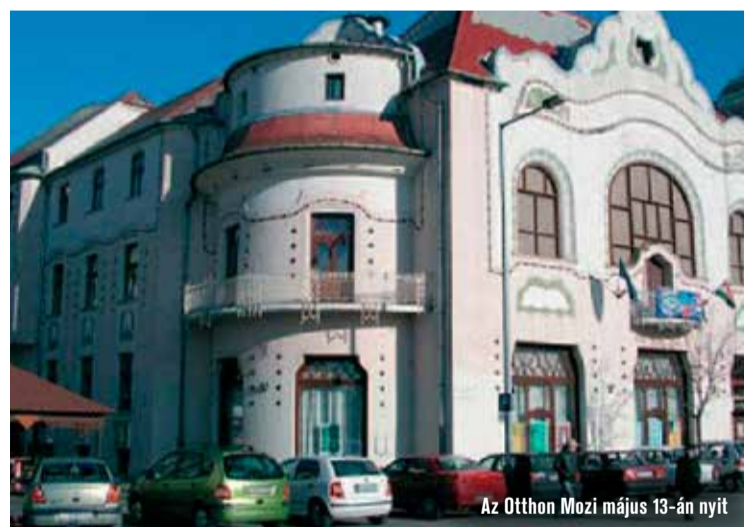
Az Otthon Mozi május 13-án nyit