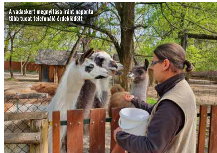
A vadaskert megnyitása iránt naponta több tucat telefonáló érdeklődött

nia-bérletek az év végéig, vagyis 2021. december 31-ig beválthatók. A mozivezető felhívta a figyelmet arra, hogy a webes foglalás mellett a honlapon lehetőség van jegyvásárlásra, de utóbbit csak azoknak javasolják, akik biztosak benne, hogy megfelelnek a jogszabályban leírt követelményeknek.