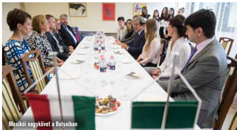
Mexikói nagykövét a Bolyaiban