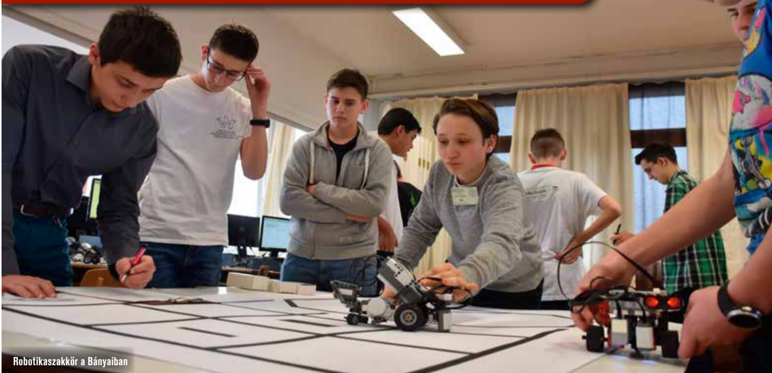
Robotikaszakkör a Bányaiban