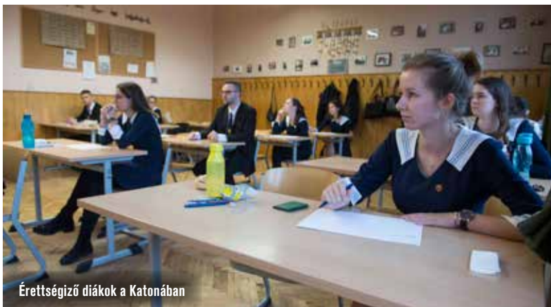
Érettségiző diákok a Katonában

Az idei tanévben kifejezetten nagy a középiskolai rangsor szerepe, hiszen a továbbtanulási döntés meghozatala a szokásosnál is nehezebb. A vírus miatt a diákok felkészülése is körülményes, a legtöbb esetben az intézmények sem látogathatóak, illetve azt sem lehet még tudni, hogy hogyan fognak zajlani a felvételik.