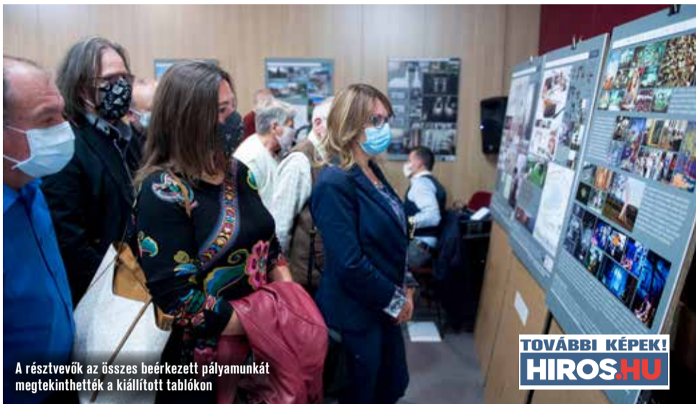
A résztvevők az összes beérkezett pályamunkát megtekinthették a kiállított táblákon