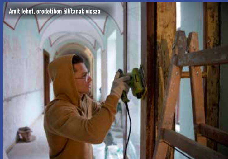
Amit lehet, eredetiben állítanak vissza

A lecserélt, vissza nem kerülő épületelemekből a polgármesteri hivatal kiállítást szervez október végén, az épület országzászló felőli sarkán. A különleges díszeket itt megtekinthetővé és akár megtapinthatóvá teszik szervezők.