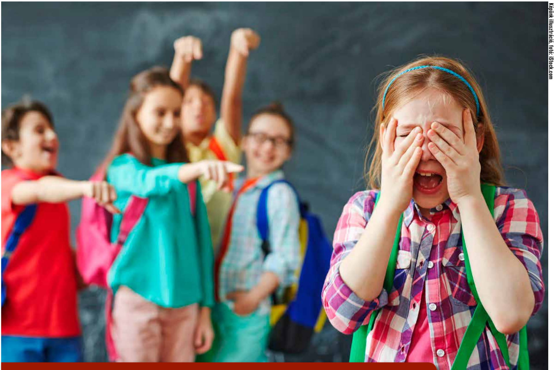
Képek illusztráció