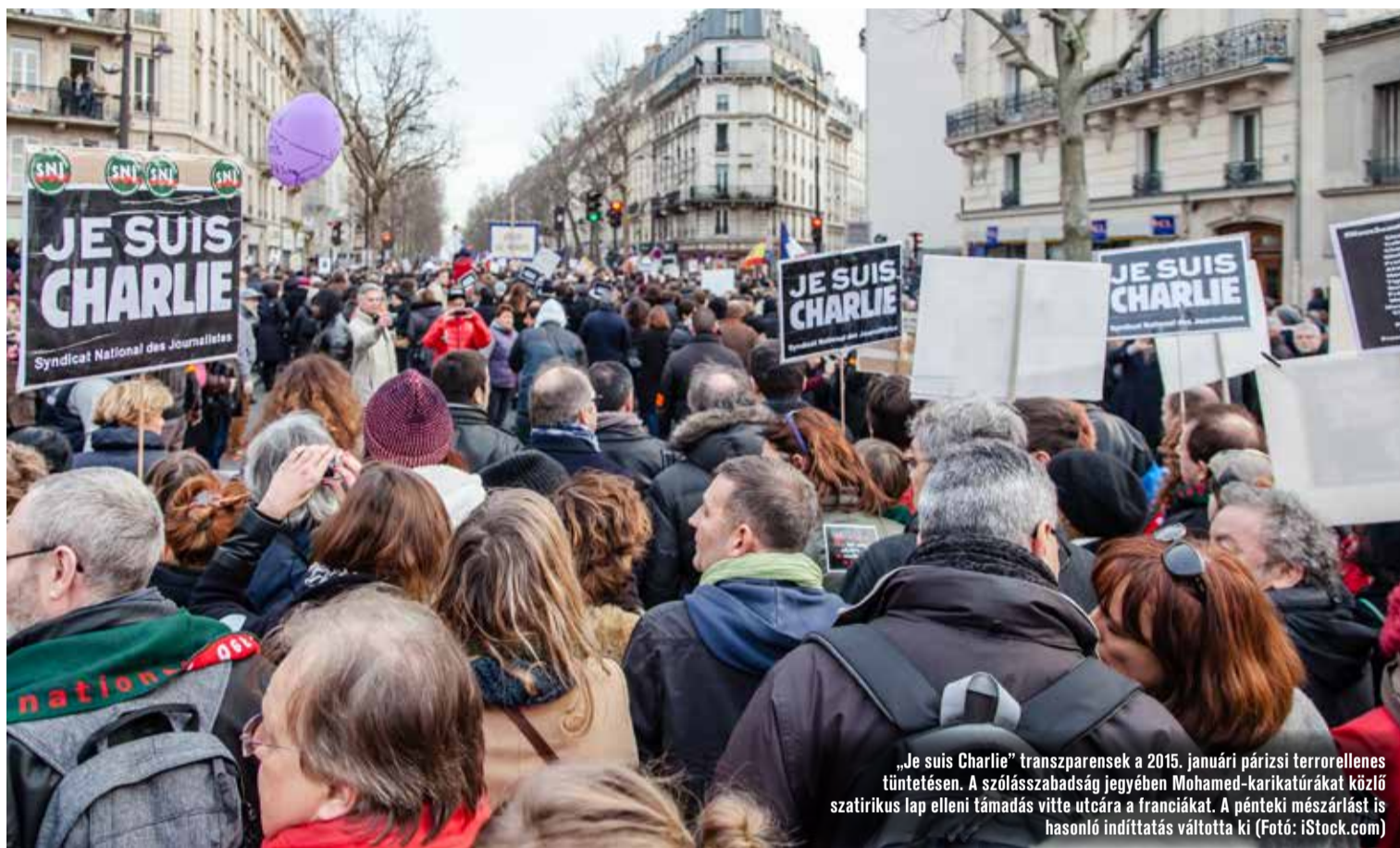
„Je suis Charlie” transzparens a 2015. januári párizsi terrortelenes tüntetésen. A szólásszabadság jegyében Mohamed-karikatúrákat közlő satirikus lap elleni támadás vitte utcára a franciákat. A pénteki mészárlást is hasonló indíttatás váltotta ki

– A politika hogyan tudná támogatni ezt?