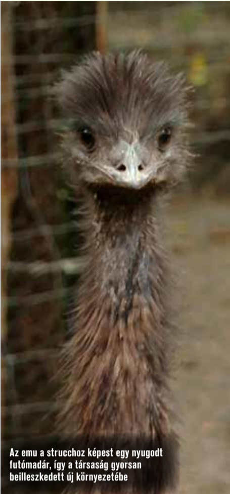
Az emu a strucchoz képest egy nyugodt futómadár, így a társaság gyorsan beilleszkedett új környezetébe