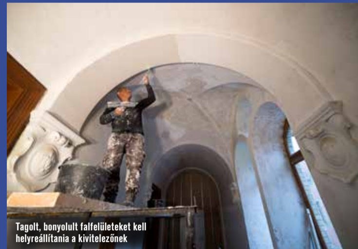
Tagolt, bonyolult falfelületeket kell helyreállítani a kivitelezőnek