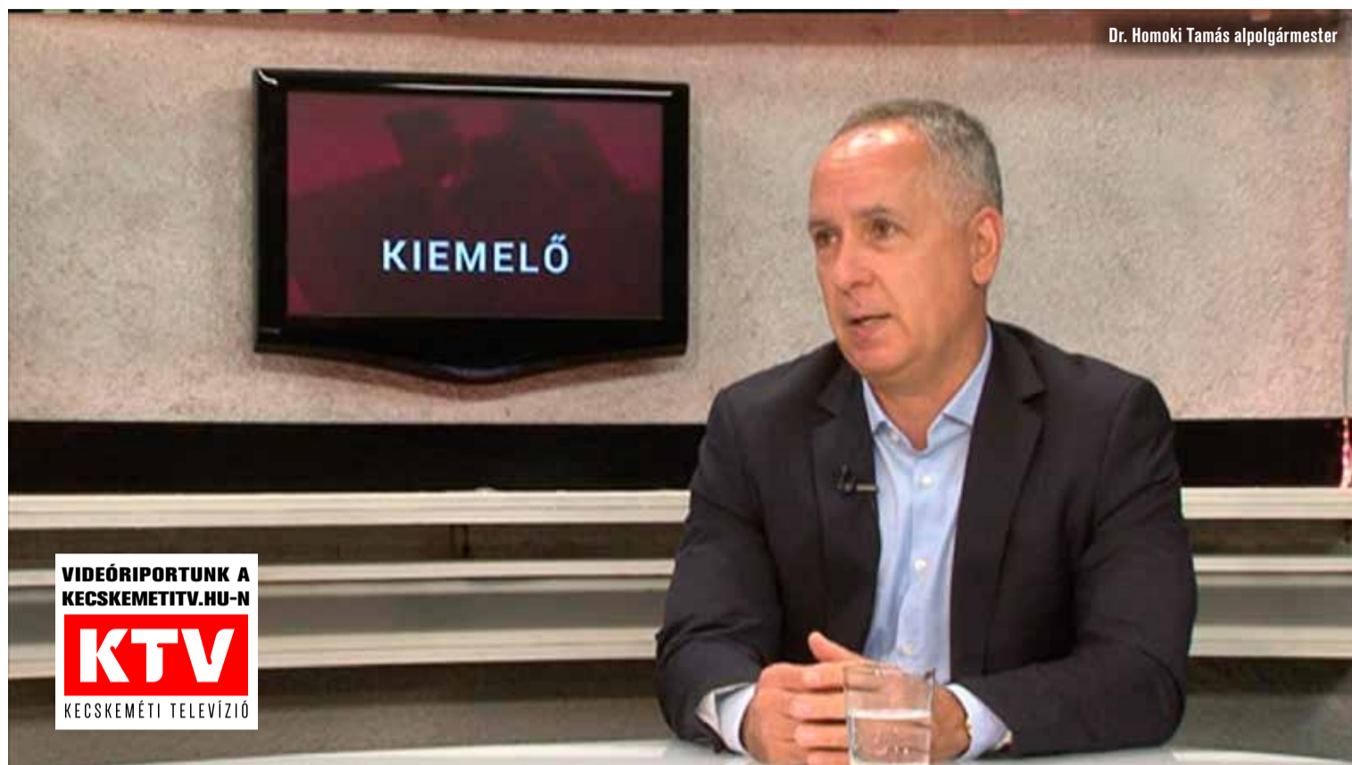
Dr. Homoki Tamás alpolgármester

fiatalabb buszparkkal. A 70 járműből 25 darab 4-5 éves, 45 pedig vadonatúj Euro 6-os dízelbusz, amelyek az elektromos buszokat követően a második helyen levő legmodernebb, környezetkímélőbb típusnak felelnek meg.