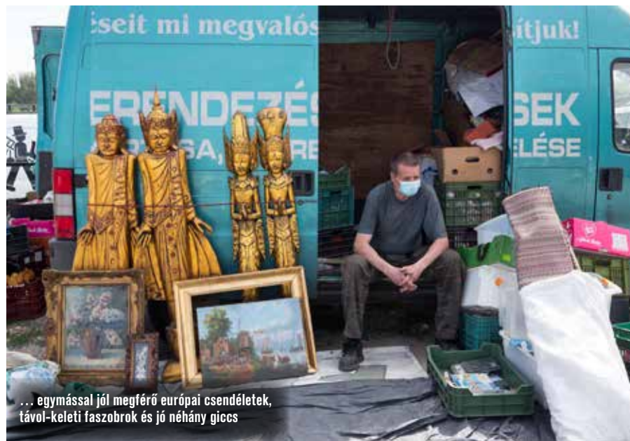
... egymással jól megférő európai csendéletek, távol-keleti faszobrok és jó néhány giccs