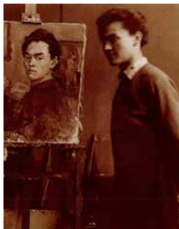
Őnarcképével a képzőművészeti főiskolán, 1955-ben