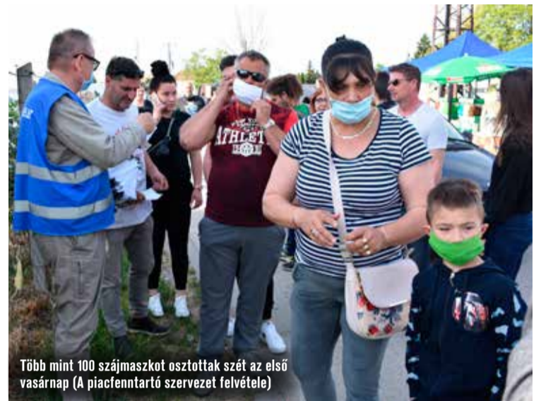
Több mint 100 szájmazskot osztottak szét az első vasárnap