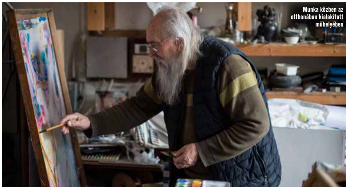
Munka közben az otthonában kialakított műhelyében

A tágabb értelemben vett szakmától sem szakadtam el teljesen. Bár a nemzetközi zománcművészeti életben már nem veszek részt, a Tűzzománcmű-