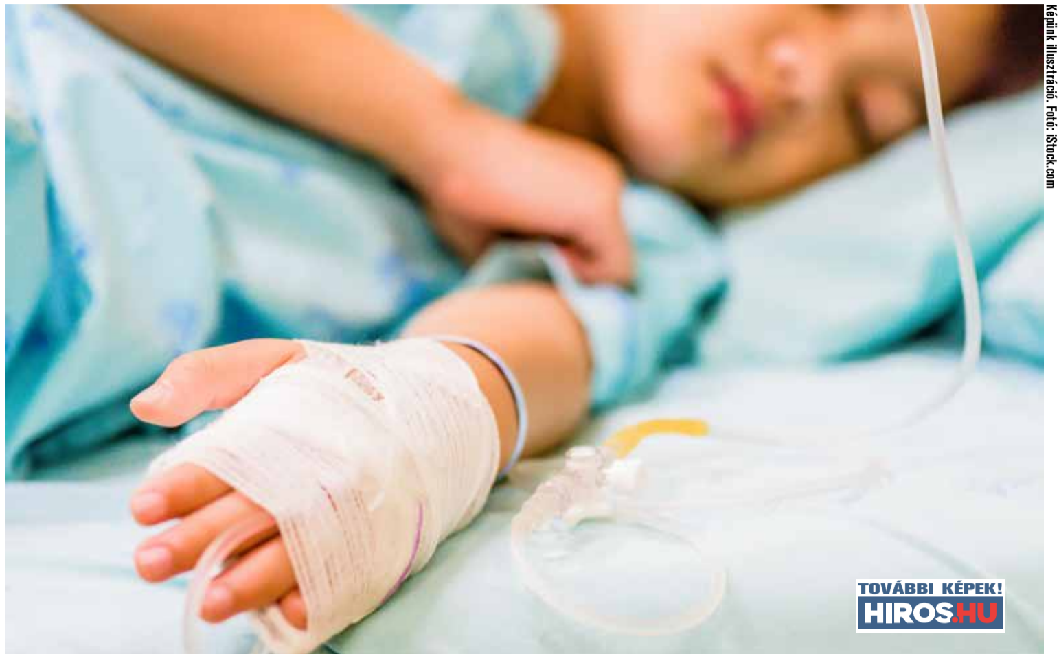
Képek illusztráció