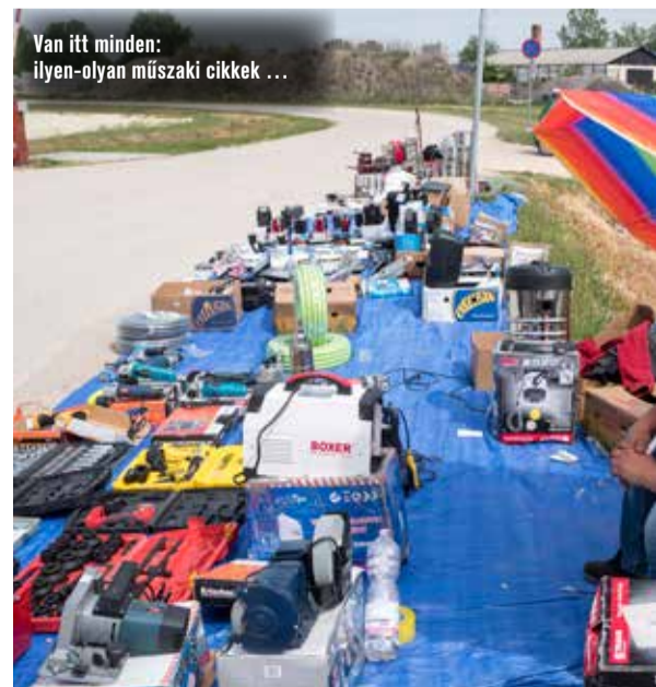
Van itt minden: ilyen-olyan műszaki cikkek ...