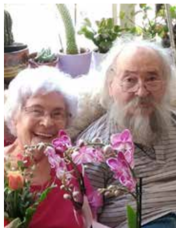
Feleségével a házassági évfordulójukon, 2018-ban

szek Magyar Társaságának mind a mai napig aktív tagja vagyok. Az új magyar zománcművészeti alkotások létrehozatalát, valamint azok széles körű bemutatását, népszerűsítését próbáljuk segíteni.