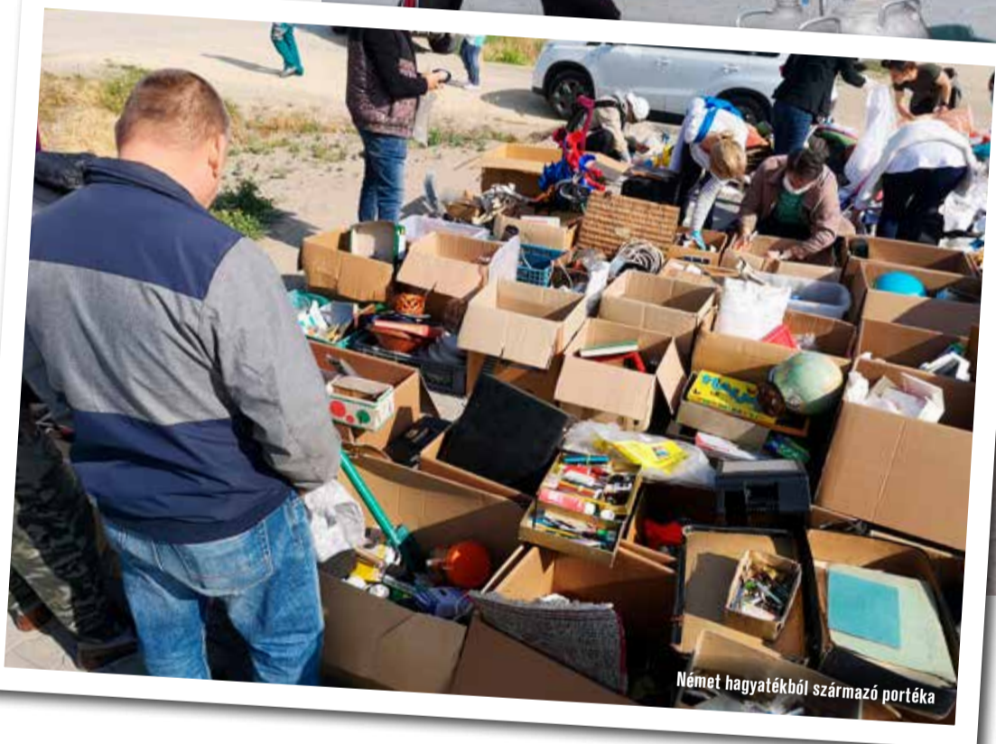
Német hagyatékból származó portéka