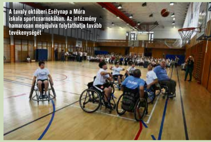
A tavaly októberi Esélynap a Móra iskola sportcsarnokában. Az intézmény hamarosan megújulva folytathatja tovább tevékenységét