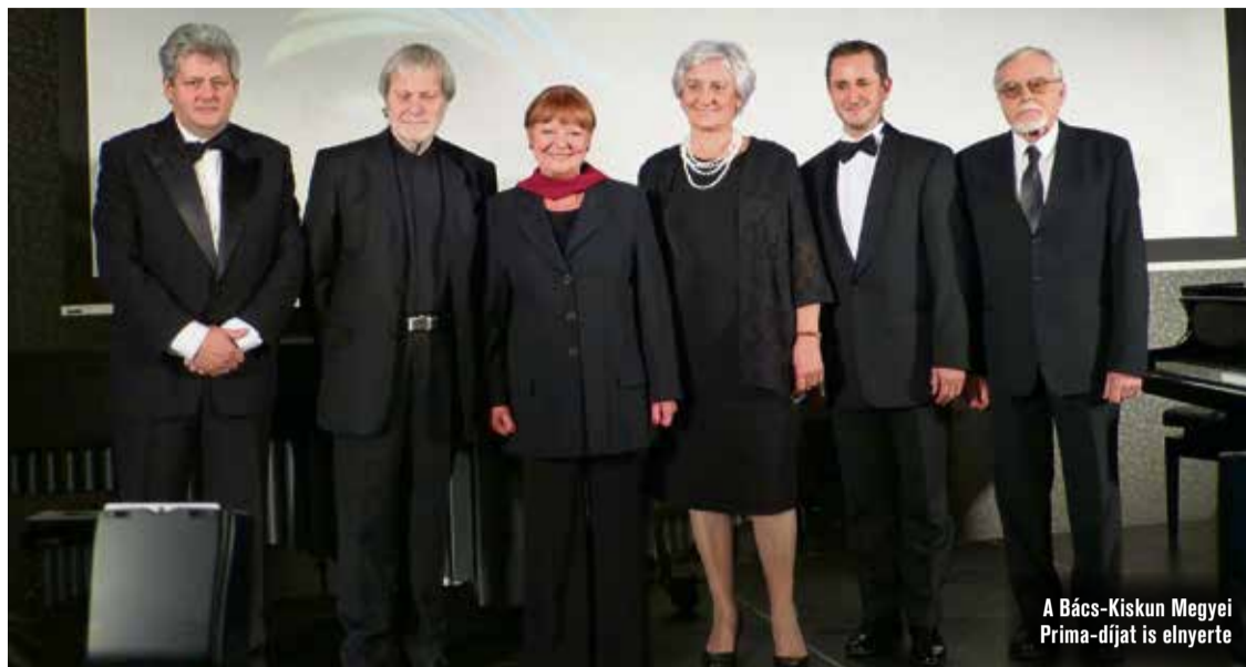
A Bács-Kiskun Megyei Prima-díjat is elnyerte