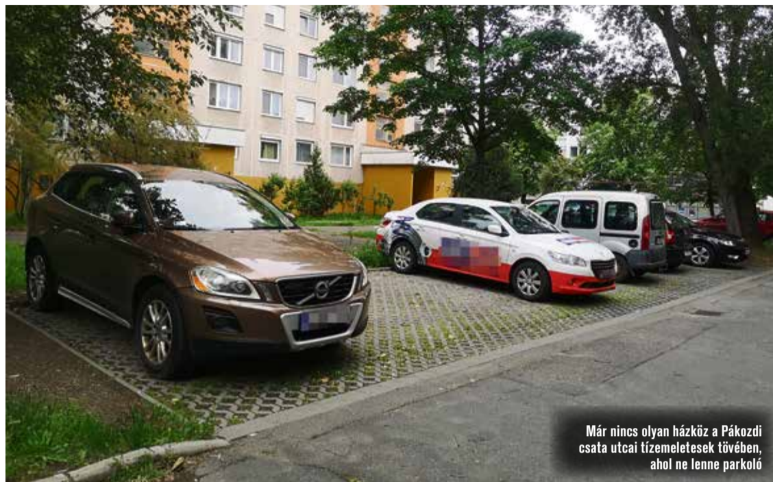
Már nincs olyan házköz a Pákozdi csata utcai tízeletek tövében, ahol ne lenne parkoló