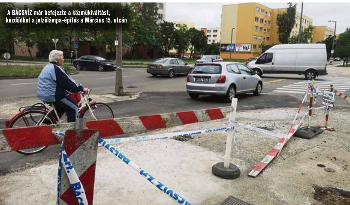
A BÁCSVÍZ már befejezte a köz-műkiváltást, kezdődhet a jelzőlámpa-építés a Március 15. utcán