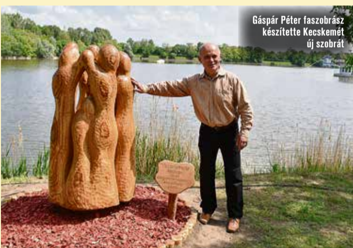
Gáspár Péter faszobrász készítette Kecskemét új szobrát

– Azért választottuk ezt a helyet a szobornak, mert ezt az utat még sok más hasonló alkotás díszítheti majd a jövőben. Bízom abban, hogy a kecskeméti képzőművészek, civil szervezetek, művészeti műhelyek, akik/amelyek fontosnak tartják az értékek megőrzését,