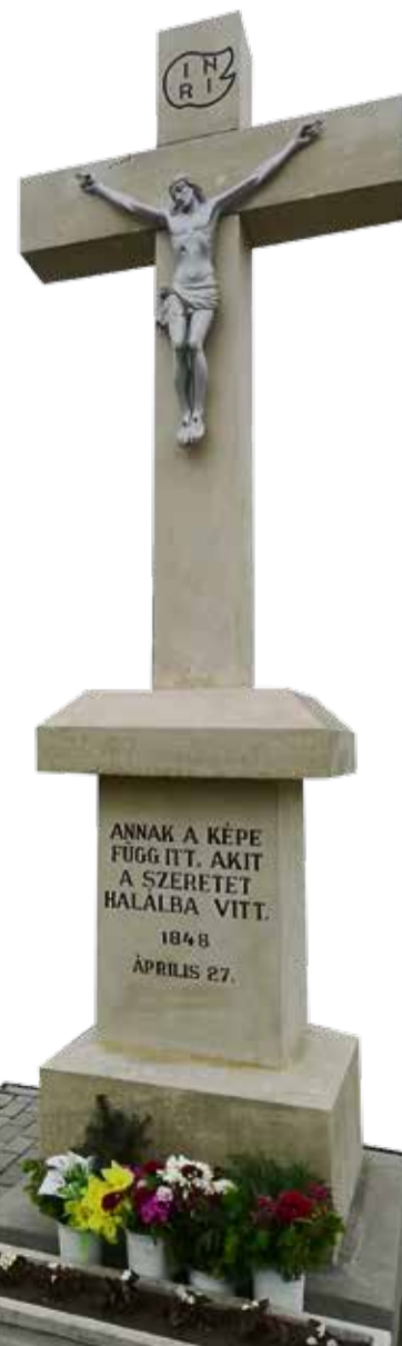
A kőkereszt a hagyományörzés fontos jelképe