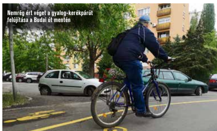
Nemrég ért véget a gyalog-kerékpárút felújítása a Budai út mentén

körútnak fejlesztése is. Előbbinek az építése – egy körforgalommal együtt – már el is kezdődött. Utóbbira, amely összeköti majd az arborétumot az 5-ös számú főúttal, már rendelkezésre áll az 1,7 milliárdos forrás, a projekt 2022 tavaszára készül el.