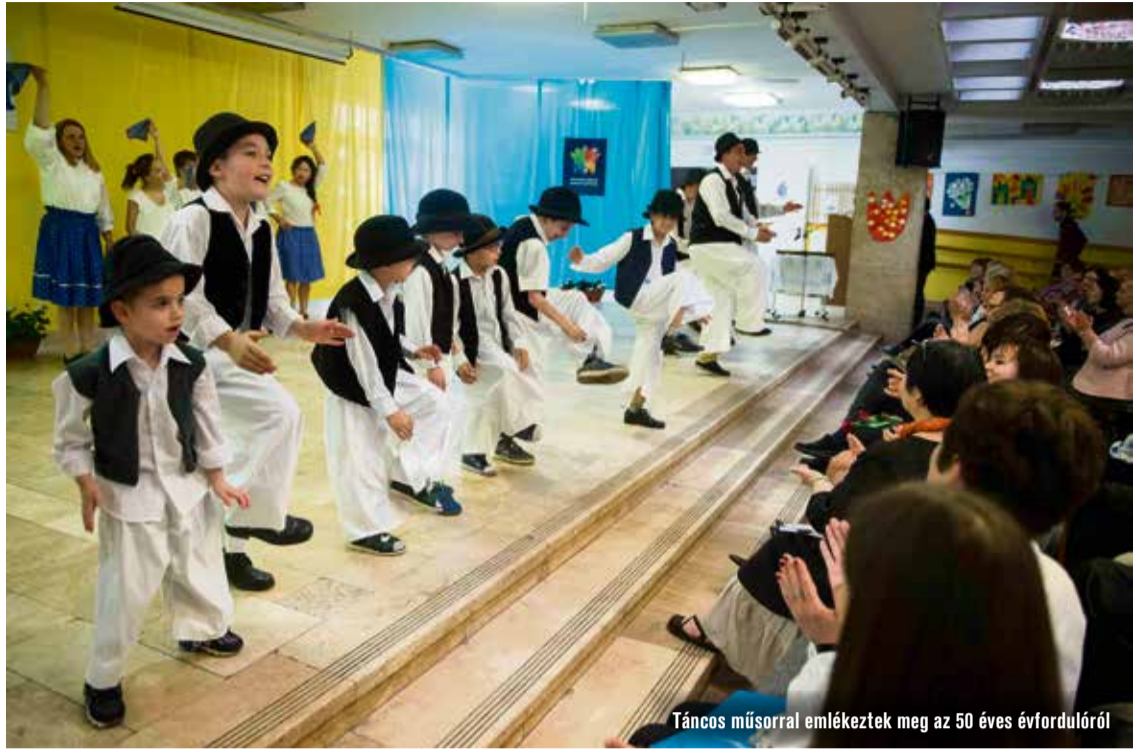
Táncos műsorral emlékeztek meg az 50 éves évfordulóról

Az intézmény alapvető célkitűzése, hogy az itt gondozott gyermekeket képességeik csúcsára juttassák el. A pedagógusok olyan készségeket fej-