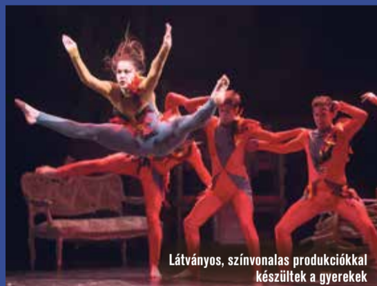
Látványos, színvonalas produkciókkal készültek a gyerekek