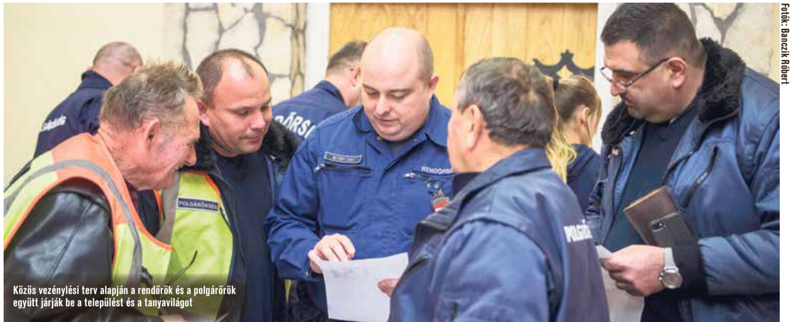
Közös vezénylési terv alapján a rendőrök és a polgárőrök együtt járnak be a települést és a tanyavilágot

Kecskemét alpolgármestere elmondta, a településen és a környező tanyavilágban fölmerült az igény, hogy érdemes lenne háromhavonta a rendőrséggel karöltve közös akciót, ellenőrzéseket tartani. Ez két éve indult el. Az akciókat úgy szervezik meg, hogy mindig más és más település a vendéglátó. Ez azt jelenti, hogy a rendőrséggel történő közös akció a vendéglátótól indul. Most Ballószög adott otthont ennek a kétnapos akciónak.