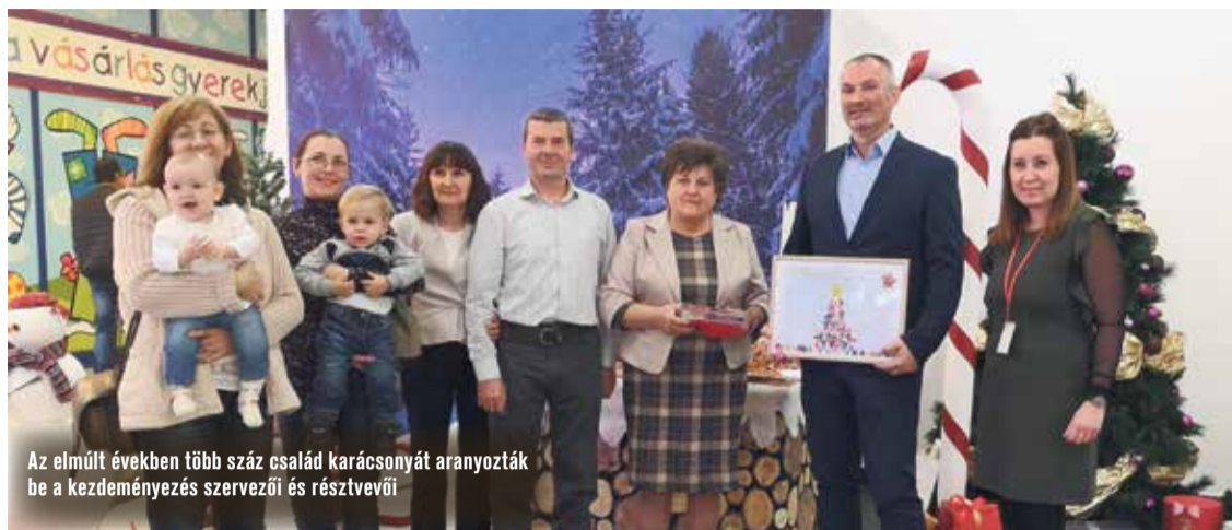
Az elmúlt években több száz család karácsonyát aranyozták be a kezdeményezés szervezői és résztvevői