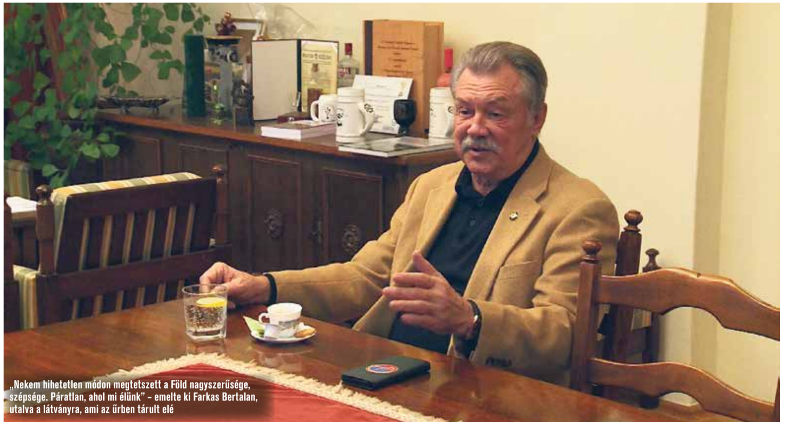
„Nekem hihetetlen módon megtetszett a Föld nagyszerűsége, szépsége. Páratlan, ahol mi élünk” – emelte ki Farkas Bertalan, utalva a látványra, ami az űrben tárult elé

– Nekünk, magyaroknak hihetetlen tekintélyünk van a világban. A magyar kutatók, mérnökök letették a névjegyüket. Bárhol vagyok, bármelyik kontinensen, mosolyogva fogadnak. Külön öröm számomra, hogy két olyan műszert vittem fel a világűrbe, amelyek a magyar kutatók, orvosok,