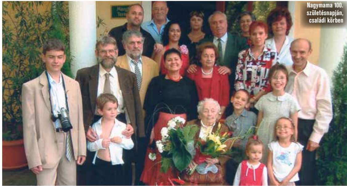
Nagymama 100. születésnapján, családi körben