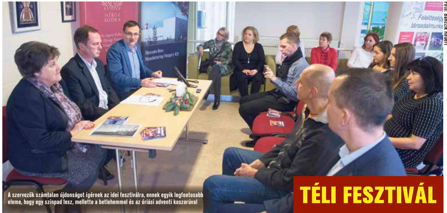
A szervezők számtalan ajándékot ígérnek az idei fesztiválra, ennek egyik legfontosabb eleme, hogy egy színpad lesz, mellette a betlehemmel és az óriási adventi koszorúval