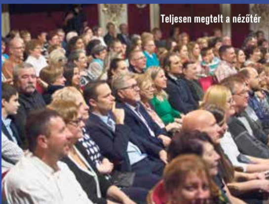
Teljesen megtelt a nézőtér