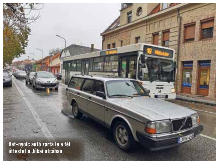
Hat-nyolc autó zárta le a fél utat a Jókai utcán

A közgyűlés végül úgy döntött, továbbra is a Jókai utcán közlekednek azok az autóbuszjáratok, amelyeket a Rákóczi út páros oldalára július 1-jétől bevezetett forgalmi korlátozás érint. Ugyanakkor határozott arról is, hogy március végéig készüljenek alternatív javaslatok az autóbuszok közlekedési útvonalára vonatkozóan annak érdekében, hogy rendezni lehessen a felmerülő munkáltatói és lakossági észrevételeket.