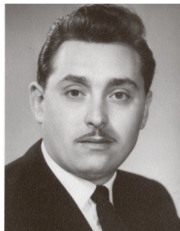
Pályakezdő pedagógusként, 1956-ban