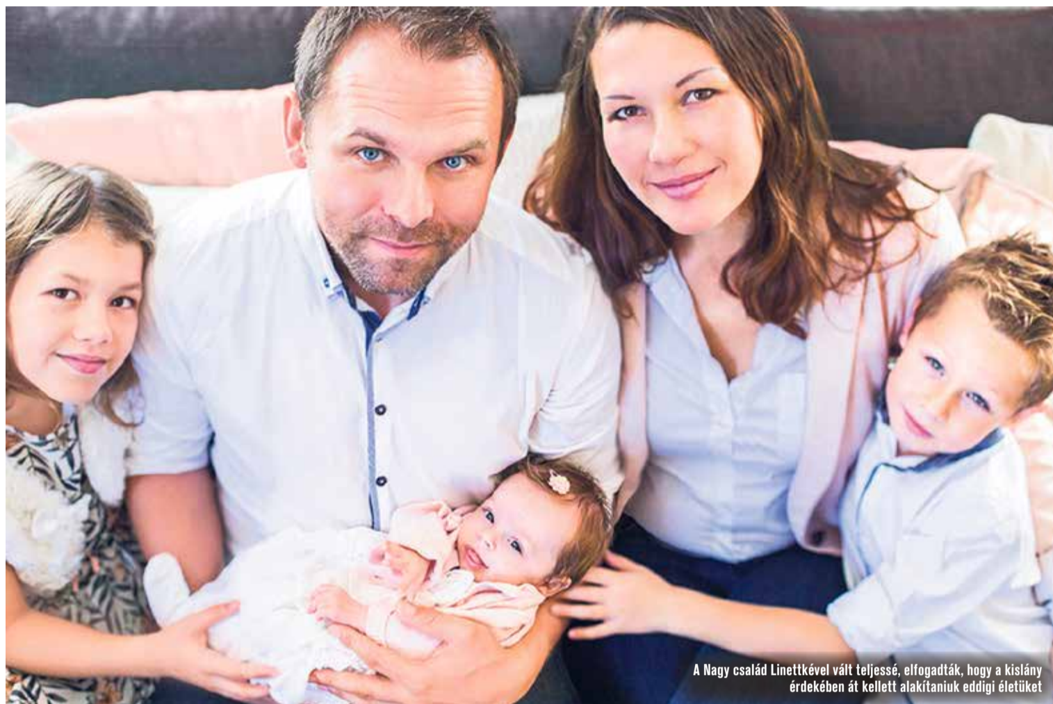
A Nagy család Linettével vált teljessé, elfogadták, hogy a kislány érdekében át kellett alakítaniuk eddigi életüket

ugyanis szembesülnünk kellett azzal, mi okozta a problémát.