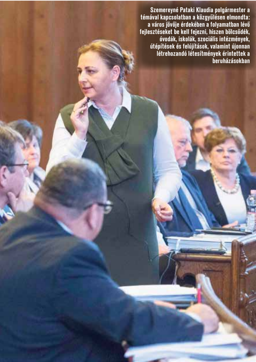
Szemereyné Pataki Klaudia polgármester a témával kapcsolatban a közgyűlésen elmondta: a város jövője érdekében a folyamatban lévő fejlesztéseket be kell fejezni, hiszen bölcsődék, óvodák, iskolák, szociális intézmények, útépitések és felújítások, valamint újonnan létrehozandó létesítmények érintettek a beruházásokban