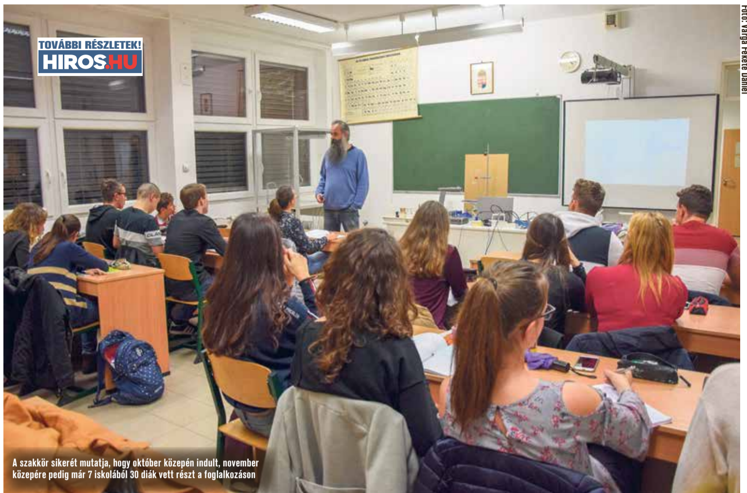
A szakkör sikerét mutatja, hogy október közepén indult, november közepére pedig már 7 iskolából 30 diák vett részt a foglalkozáson

Nagy segítségünkre van, hogy az UNIVER Zrt. mellé állt a kezdeményezésnek, s támogatja anyagilag is a szakkör megvalósulását. Ezenkívül – mivel elég sok bányais diák is van az érdeklődők között – a Bányai Júlia Gimnázium egyik alapítványa is támogatja a szakkört.