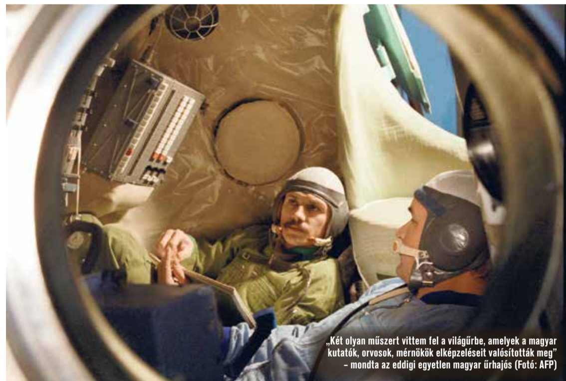
„Két olyan műszert vittem fel a világűrbe, amelyek a magyar kutatók, orvosok, mérnökök elképzeléseit valósították meg” – mondta az eddigi egyetlen magyar űrhajós

– Azt hiszem, aki felkerül a világűrbe és kinéz az illuminátoron keresztül – hiszen a Föld mindig alattunk van, csak körbepölylünk –, az semmi mást nem csinálna, csak fényképezne vagy filmezne állandóan. Az is egy csodálatos házi feladat lenne. Nekem hihetetlen módon megtetszett a Föld nagyszerűsége, szépsége. Páratlan, ahol mi élünk. Végső soron mindannyian űrhajósok vagyunk, önmagunkkal együtt, csak mi a nagy vilárendszerben gondolkodunk. Amikor visszajöttem a világűrbe, úgy döntöttem, hogy támogatni fogom a környezetvédelmet. Valóban így lett. A műszaki egyetemem is ebből írtam a diplomamunkámat. Hogy unokáink és unokáik 500 év múlva egy fantasztikus, nagyszerű bolygón élhessenek, ahhoz majdnem azt mondom, hogy a 24. órában vagyunk. Minden évben van egy kongresszusa az Űrhajósok Nemzetközi Szövetségének, és ott ilyenekről beszélgetünk, űrhajósok egymás között. Kutatómérnököket hívunk meg, és bizony valóban óriási problémát jelent a klímaváltozás. Ezt a televízióban, újságokban, a rádióban halljuk nap mint nap, és meg kellene tanítani az ifjúságot a környezet- és természetvédelem fontosságára.