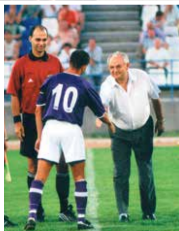
A KTE támogatójaként

tőipari vállalkozást és a külföldi kézből visszavásárolt Kecskeméti Konzervgyár Szolnoki úti telepét, amely beolvadt az élelmiszer-ipari társaságunkba, az Univer Productba és ahol a cégcsoport központja is működik.