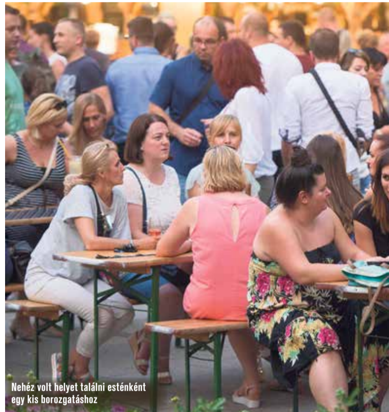
Nehéz volt helyet találni esténként egy kis borozgatáshoz