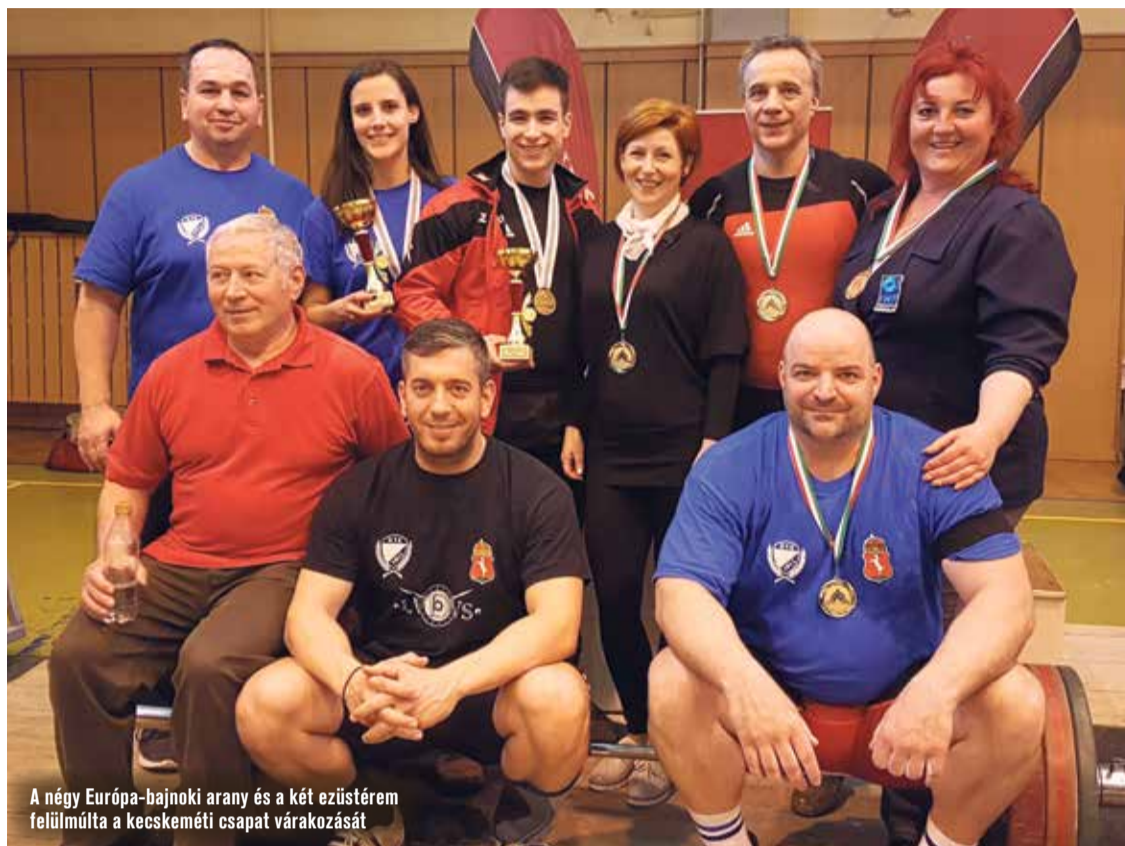
A négy Európa-bajnoki arany és a két ezüstérem felülmúlta a kecskeméti csapat várakozását

ig (110; 129) jutott, és súlycsoportja aranyérmese lett.