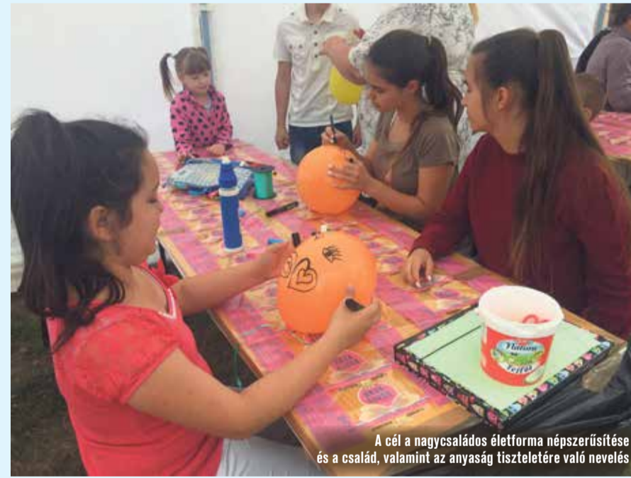
A cél a nagycsaládos életforma népszerűsítése és a család, valamint az anyaság tiszteletére való nevelés

Ma már saját székházzal rendelkezik az KINCS Kecskeméti Nagycsaládosok Egyesülete, ami lassan képes komolyabb társasági összejöveteleket is kiszolgálni. A mai születésnap egyben az új, szépülő közösségi ház ünnepe is volt. A jövőben szeretnék a Váci köz 11. szám alatt akár heti rendszerességgel jelentkező programokat is szervezni. A születésnapra körülbelül 130 főt vártak, de az évek során duzzadó teljes taglétszám ma már eléri a 800 főt is.