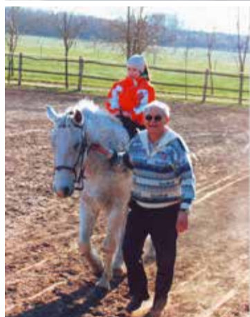
Tanyáján lovagoltatás közben