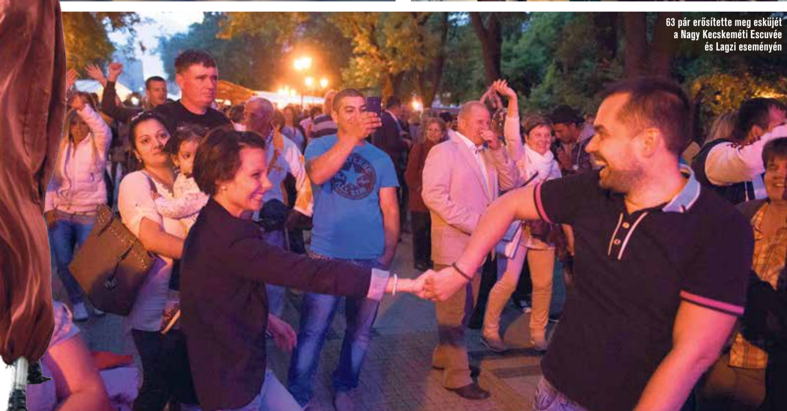
63 pár erősítette meg esküjét a Nagy Kecskeméti Escuvée és Lagzi eseményén

Múlt hétfőtől vasárnap estig tartott a III. Barackpálinka- és Borfesztivál Kecskemét főterén. A Hírös Agóra Nonprofit Kft. szervezésében idén minden eddiginél sokszínűbb programok közül válogathattunk, miközben megköszönhattuk az ország legkiválóbb borait, pálinkáit. A város 650. évfordulójához kapcsolódva állították össze a programokat, a születésnapra ünnepi műsorral készült a Kecskeméti Táncegyüttes a megnyitó napján. A híros városhoz szoros szálakkal kötődő fellépők szórakoztatták a közönséget, minden este megtelt a főtéren koncerteken, de nagyon népszerűek voltak a kísérő programok is. A rendezvény a kezdetektől fogva a családokat szólította meg, nemcsak a felnőttek borozgattak szívesen zenét hallgatva, de a gyerekek szórakozásáról is gondoskodtak a szervezők. A Békás-kútnál különleges játékok várták a kicsiket, a Kálvin tér felőli kis színpad pedig gyerekelőadásoknak adott helyet. Így idén is színvonalas és gazdag volt a fesztivál, amely három év alatt igazi közösségi ünnepévé nőtte ki magát.