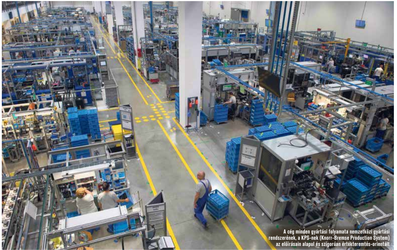
A cég minden gyártási folyamata nemzetközi gyártási rendszerének, a KPS-nek (Knorr-Bremse Production System) az előírásain alapul és szigorúan értéktérmetés-orientált

Az eseményen részt vett Palkovics László innovációs és technológiai miniszter is, aki elmondta: a Knorr-Bremset a kezdetektől a folyamatos innováció jellemezte, amely nemcsak a termékfejlesztésre, hanem a gyártás folyamatos megújítására is kiterjed. Emellett a cég évek óta nagy hangsúlyt fektet termelékenységének, hatékonyságának növelésére is. A tárca vezetője kiemelte, a vállalatnál zajló