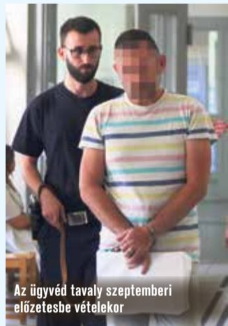
Az ügyvéd tavaly szeptemberi előzetesbe vételekor

Megkezdődött annak a kecskeméti ügyvédnek a tárgyalása, aki 114 millió forint kárt okozott ügyfeleinek 2015 és 2017 között. A férfi okiratszerkesztő és letétkezelő ügyvédként dolgozott, de a vád szerint a letétként nála levő pénzzel a sajátjaként rendelkezett.