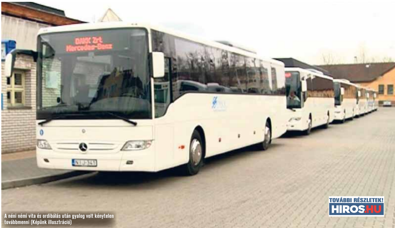
A néni némi vita és ordibálás után gyalog volt kénytelen továbbmenni (Képiünk illusztráció)

„Szürreális jelenet volt. Jó pár perc eltelt, az utasok egy része leszállt, illetve átszállt egy másik buszra. Végül a néni kénytelen volt otthagyni a buszt, és némi vita és ordibálás után gyalog volt kénytelen továbbmenni. A sofőrnek ezután mondta az egyik utas, hogy most már induljon, mert a néni leszállt. A fiatal sofőr ezután visszaült és hajlandó volt elindulni” – írják a posztban.