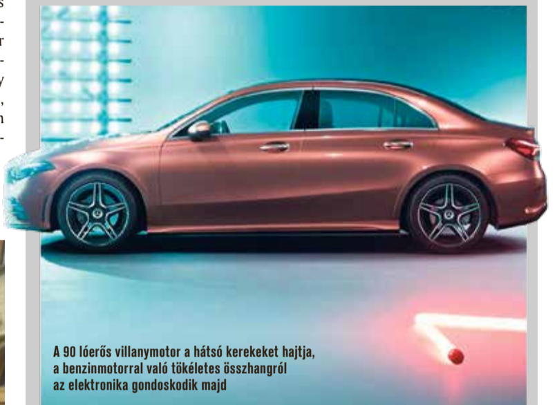
A 90 lóerős villanymotor a hátsó kerekeket hajtja, a benzinmotorral való tökéletes összhangról az elektronika gondoskodik majd

Az új kompakt Mercedes-Benz modellek számára kifejlesztett, hálózatról tölthető hibrid hajtás a Kecskeméten is gyártott A-osztályban debütál majd. A hírek szerint két változatban is kínálják majd a zöld rendszám használatára jogosult autót.