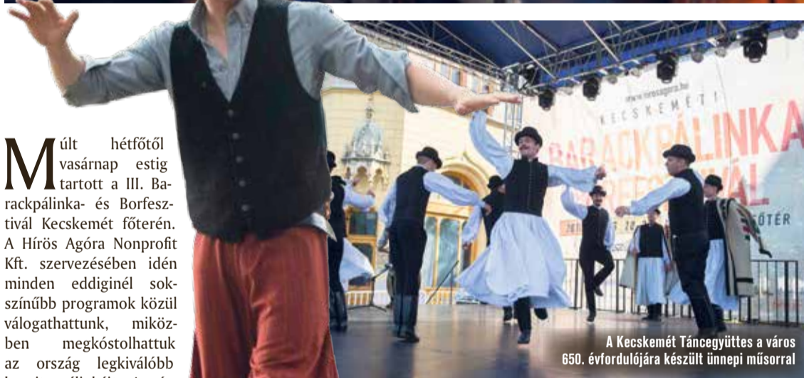
A Kecskeméti Táncegyüttes a város 650. évfordulójára készült ünnepi műsorral