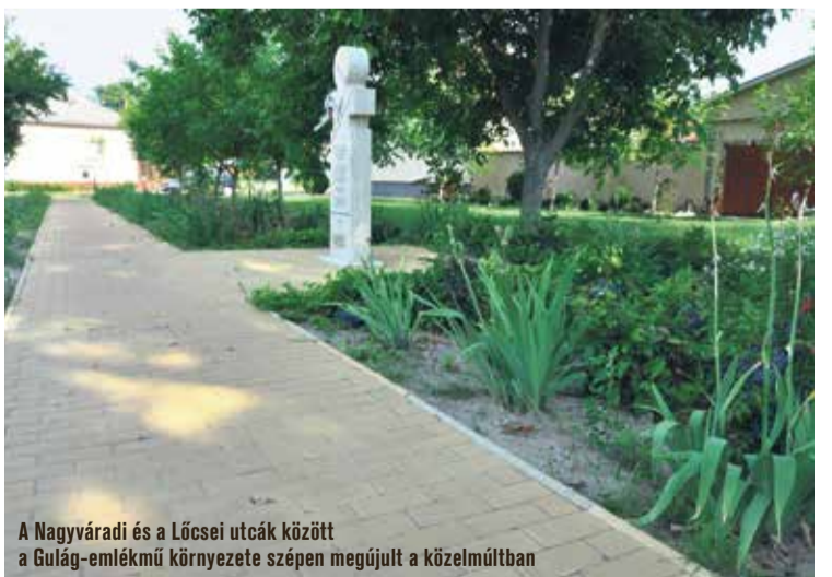
A Nagyvárdi és a Lőcsei utcák között a Gulág-émlékmű környezete szépen megújult a közelmúltban

Mint mondta, ettől eltekintve nagyon szeretnek Rendőrfaluban élni, öt percre van a város, jó a közösség, és a képviselő is sokat tesz a fejlődésért. A Nagyvárdi és a Lőcsei utcák közrefogta kis téren például a Gulág-émlékmű környezete szépen