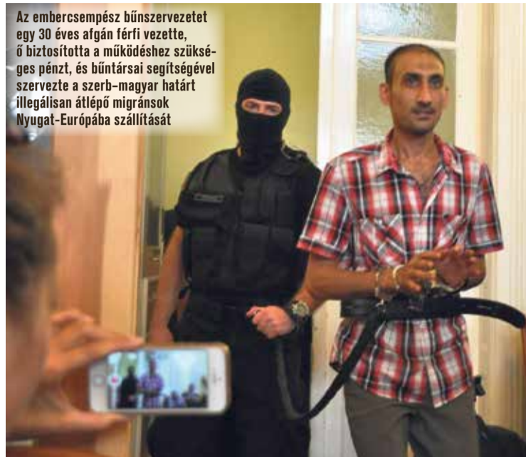
Az embercsempész bűnszervezetet egy 30 éves afgán férfi vezette, ő biztosította a működéshez szükséges pénzt, és bűntársai segítségével szervezte a szerb-magyar határt illegálisan átlépő migránsok Nyugat-Európába szállítását

Az elsőrendű vádlottat ezen felül 94 millió 128 ezer forint vagyonekbezársra is ítélték, társait néhány száz ezer forintra több millióig terjedő bírsággal sújtotta a bíróság.