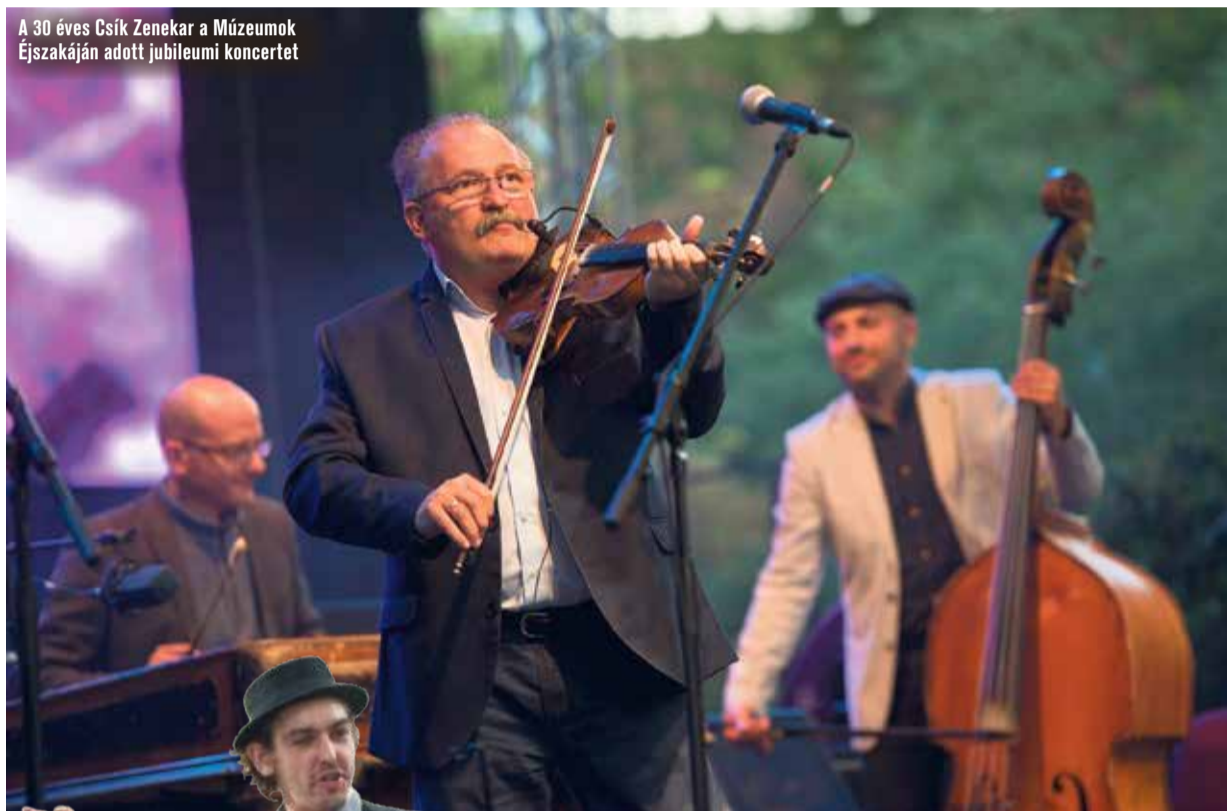
A 30 éves Csík Zenekar a Múzeumok Éjszakáján adott jubileumi koncertet