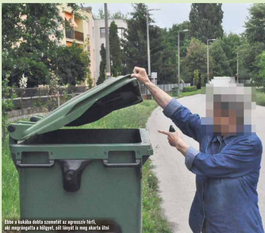
Ebbe a kukába dobta szemetét az agresszív férfi, aki megrángatta a hölgyet, sőt lányát is meg akarta ütni

metét ez a 45 év körüli férfi. Mi jöttünk haza és szoltunk neki, hogy ne dobálja be, mert azért a kukáért fizetünk. Nagyon trágáru beszélt velünk, engem meg is rángatott. A