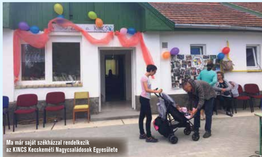
Ma már saját székházzal rendelkezik az KINCS Kecskeméti Nagycsaládosok Egyesülete

Mára már több mint nyolcszáz főre duzzadt a KINCS Kecskeméti Nagycsaládosok Egyesülete. A szervezet 30. születésnapját ünnepelte szombaton délután. Játékokkal, vicces versenyekkel, tortával és kiadós beszélgetéssel töltötték az időt a nagycsaládosok.