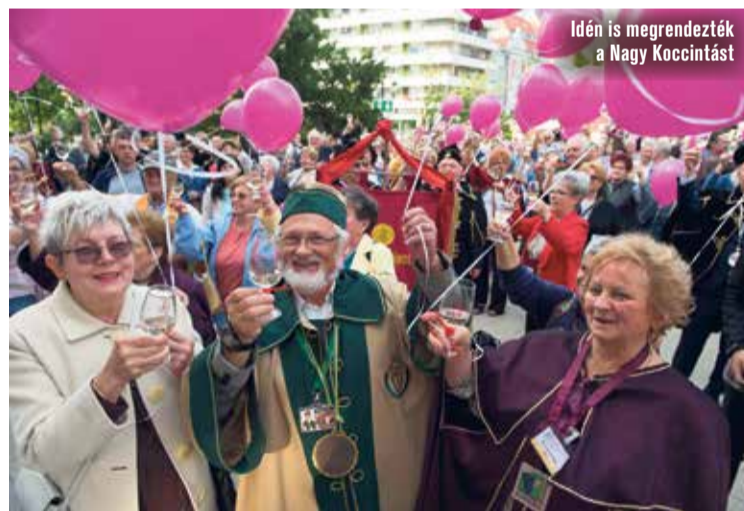
Idén is megrendezték a Nagy Koccintást

Múlt hétfőtől vasárnap estig tartott a III. Barackpálinka- és Borfesztivál Kecskemét főterén. A Hírös Agóra Nonprofit Kft. szervezésében idén minden eddiginél sokszínűbb programok közül válogathattunk, miközben megköszönhattuk az ország legkiválóbb borait, pálinkáit. A város 650. évfordulójához kapcsolódva állították össze a programokat, a születésnapra ünnepi műsorral készült a Kecskeméti Táncegyüttes a megnyitó napján. A híros városhoz szoros szálakkal kötődő fellépők szórakoztatták a közönséget, minden este megtelt a főtéren koncerteken, de nagyon népszerűek voltak a kísérő programok is. A rendezvény a kezdetektől fogva a családokat szólította meg, nemcsak a felnőttek borozgattak szívesen zenét hallgatva, de a gyerekek szórakozásáról is gondoskodtak a szervezők. A Békás-kútnál különleges játékok várták a kicsiket, a Kálvin tér felőli kis színpad pedig gyerekelőadásoknak adott helyet. Így idén is színvonalas és gazdag volt a fesztivál, amely három év alatt igazi közösségi ünnepévé nőtte ki magát.