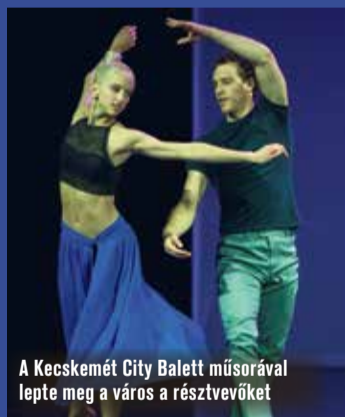
A Kecskemét City Balett műsorával lepte meg a város a résztvevőket