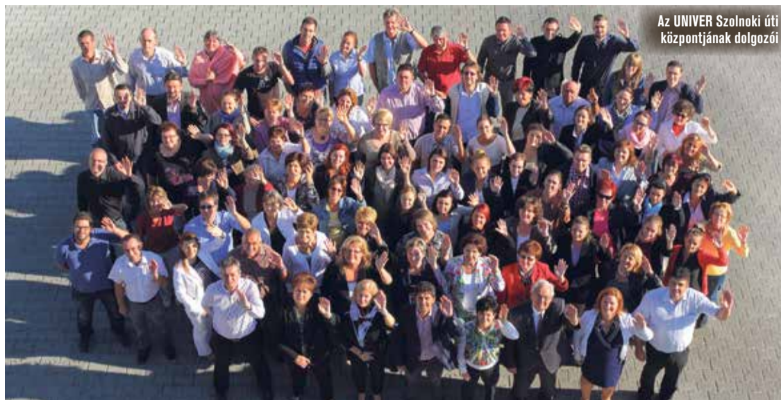
Az UNIVER Szolnoki úti központjának dolgozói