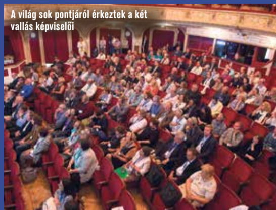
A világ sok pontjáról érkeztek a két vallás képviselői