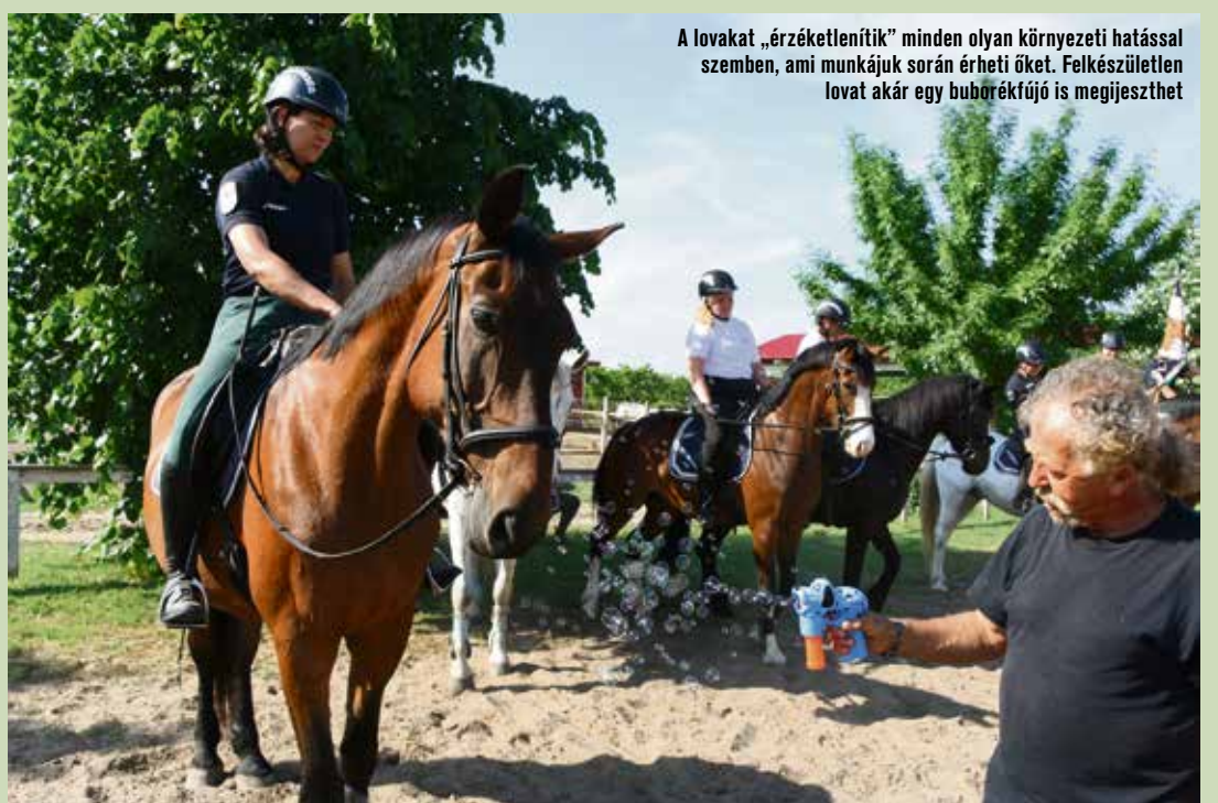
A lovakat „érezketlenítik” minden olyan környezeti hatással szemben, ami munkájuk során érheti őket. Felkészületlen lovat akár egy buborékfújó is megijeszthet