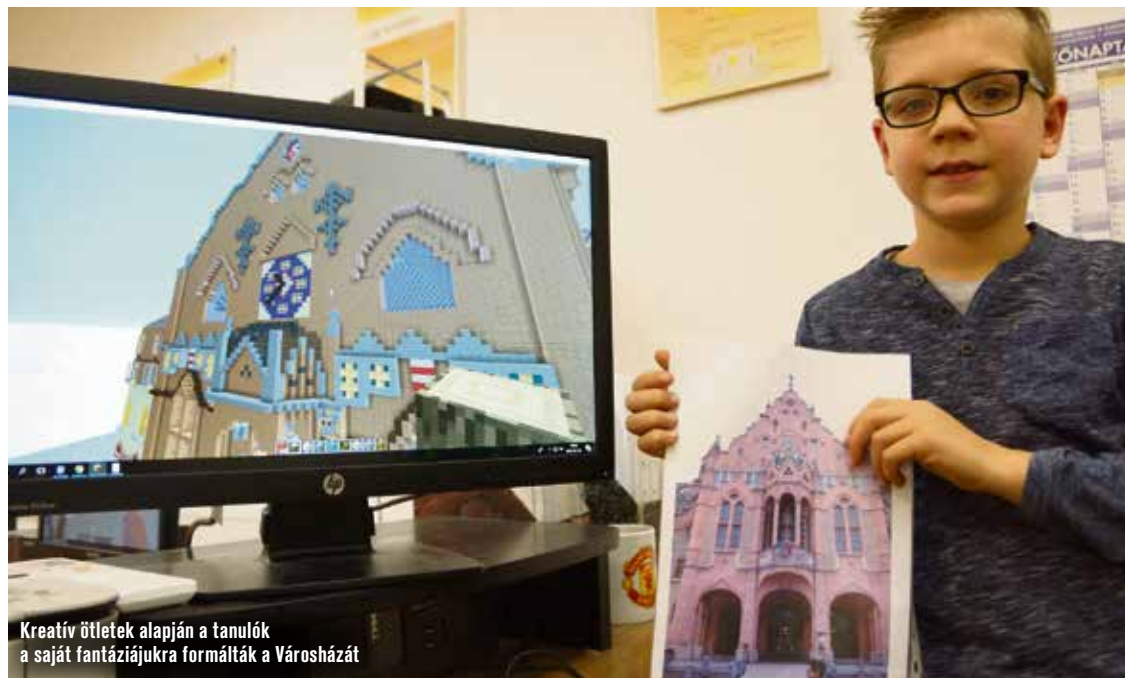
Kreatív ötletek alapján a tanulók a saját fantáziájukra formálták a Városházát

A videóból kiderül az is, nem használtak kiindulásként 3D-s modellt. Alaposan tanulmányozták az épületet, majd fotók és a Google Maps segítségével dolgoztak.