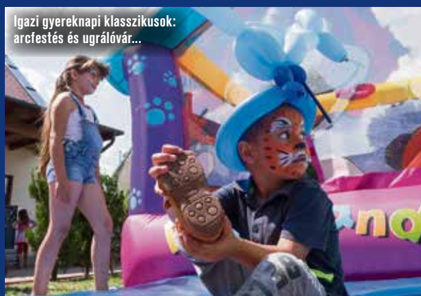
Igazi gyereknap klasszikusok: arcfestés és ugrálóvár...