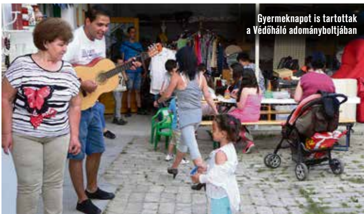
Gyermeknapot is tartottak a Védőháló adományboltjában