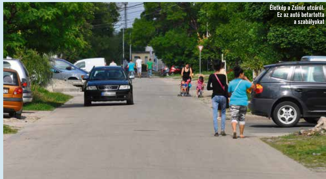
Életkép a Zsinór utcáról. Ez az autó betartotta a szabályokat

A helyi képviselő elmondta, a balesetek elkerülése érdekében lassító szintkiemeléseket telepítenek az úttestre, a beruházás még a nyáron megvalósulhat.