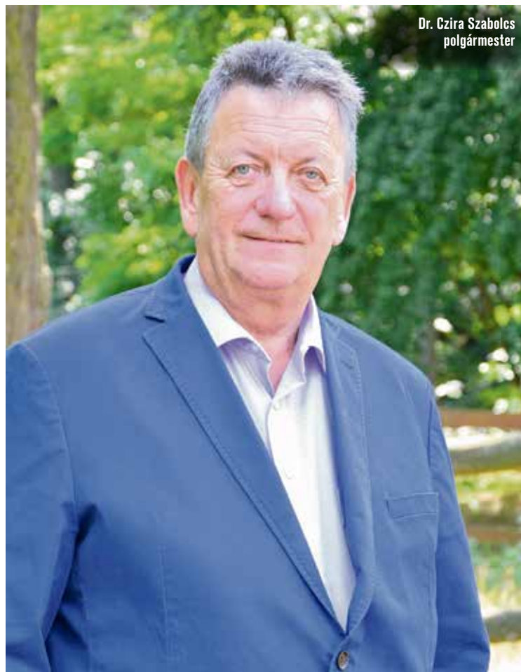
Dr. Czira Szabolcs polgármester

– Úgy gondolom, nagyon fontos a megelőzés. A legfőbb cél az lenne, hogy minél többeket lehessen bevonni, és ne csak azok menjenek el a szűrésekre, akik eddig is eljártak azokra, hanem minél többeket lehessen rábírni a megelőző cselekvésekre. Az egészséges emberek, vagy legalábbis akik úgy érzik, egészségesek, nem járnak ki a prevenció rendezvényekre. Pedig úgy gondolom, a lényeg az lenne, hogy már akkor elmenjenek szűrésekre az emberek, amikor úgy érzik, nincs semmi bajuk, vagy még csak a probléma kezdetén vannak. Ez a betegségek kezelését is segítené. Hosszú távon annak a tudatosságának