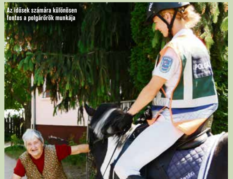
Az idősek számára különösen fontos a polgárőrök munkája