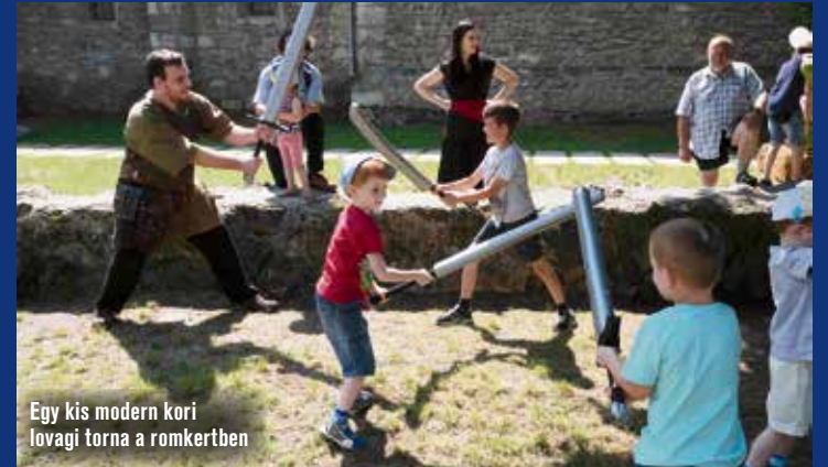
Egy kis modern kori lovagi torna a romkertben

Lovagok, hercegnők, bajvívók és mindenféle arcra festett kedvencek lepték el a főteret a vasárnapi gyereknapon, amelyet a város 650 éves évfordulója alkalmából a retró jegyében rendeztek meg. Este pedig szokás szerint Kecskemét is csatlakozott az Ezer Lámpás Éjszakájához, amely az eltűnt gyerekekre hívja fel a figyelmet.