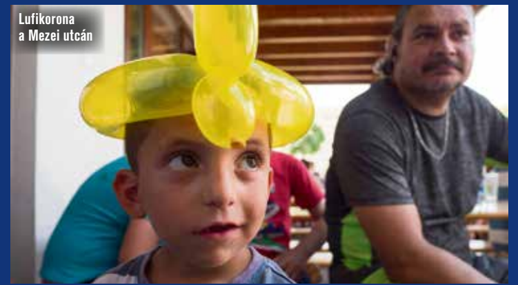
Lufikorona a Mezei utcán

A kampányt 2011-ben indították el. Az akkori rendőrségi statisztikák szerint 10 400 fiatalkorú eltűnését jelentették be a nyomozhatóságoknál az előző évben, vagyis 2010-ben. Ez a szám már akkor is sokkoló hatású volt, de azóta ez a folyamat évről évre romlik. Viszont az Ezer Lámpás Éjszakája kezdeményezésnek, a programjainak, főleg a tejes doboz kampányuknak igenis van fogatja. A kezdeményezésnek köszönhetően több száz gyerek talált vissza a családjához. Az eltűnt gyermekek világnapjához kapcsolódóan 8. alkalommal rendezték meg az Ezer Lámpás Éjszakája jótékonyági koncert- és programsorozatot országsszerte.