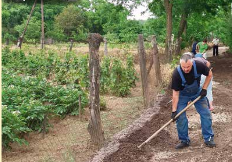
A helyiek nem először tettek tanúbizonyságot példaértékű összefogásról

A lakosok, a polgárőrök önkéntes alapon hozták helyre az utakat. De máskor is voltak már hasonló magánakciók, például az egyik játszótér kertjét is gondozzák, fákat ültetnek, és mindezek mellett védik a városrészben élőket éjszakai őrjárátaikkal. Kósa József képviselő azt is elmondta kérdésünkre, hogy bár nem tudják mennyi időbe telik, de biztosan helyre fogják hozni az utakat, valamint tervben van a közvilágítás és a csatornázás kiépítése is.