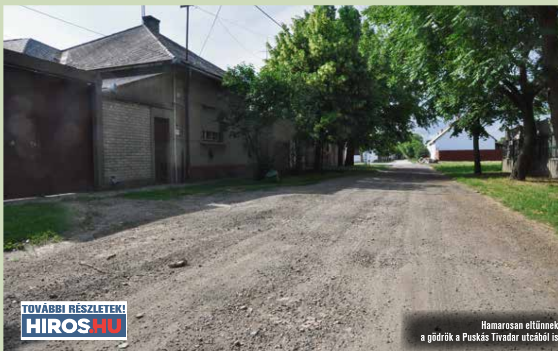
TOVÁBBI RÉSZLETEK! HIROS.HU

A Zápolya utca Penny Market felőli részén is meglehetősen rossz