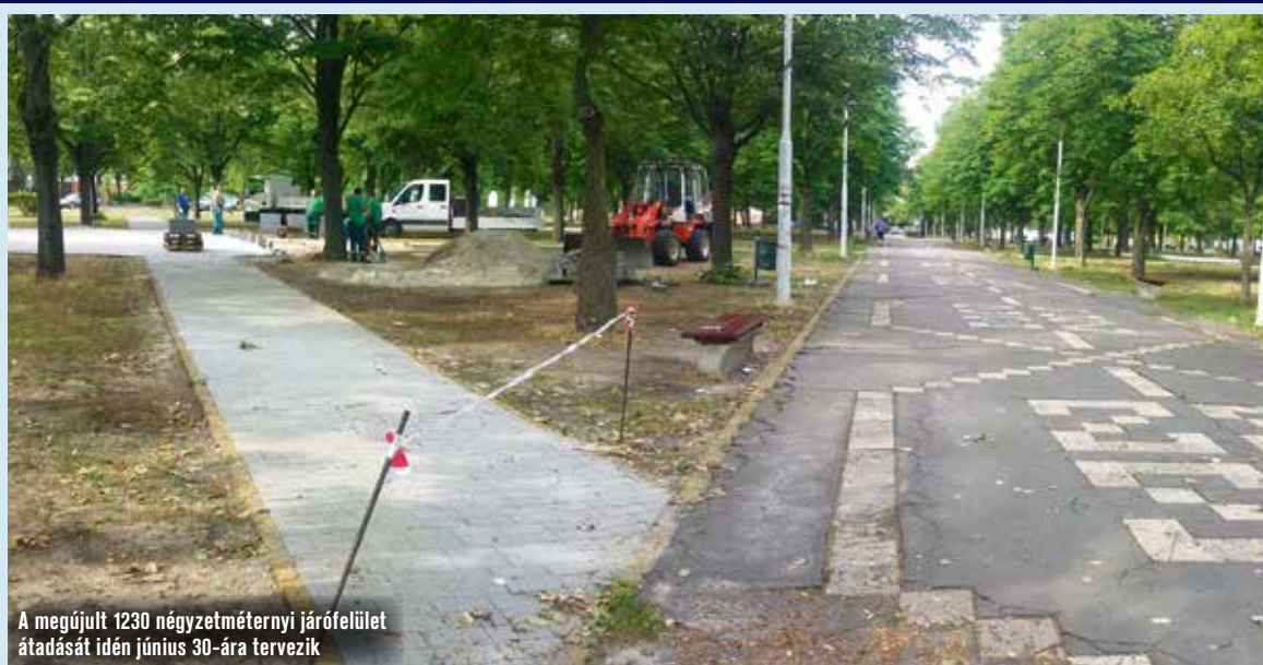
A megújult 1230 négyzetméternyi járőfelület átadását idén június 30-ára tervezik

Kavics helyett térkövön sétálhatunk majd: több mint 13 millió forintból újulnak meg az Aradi vértanúk terének járőutjai a széchenyivárosiak nagy örömeire. A felújítási munkálatok két hete kezdődtek el és várhatóan június 30-ig tartanak.