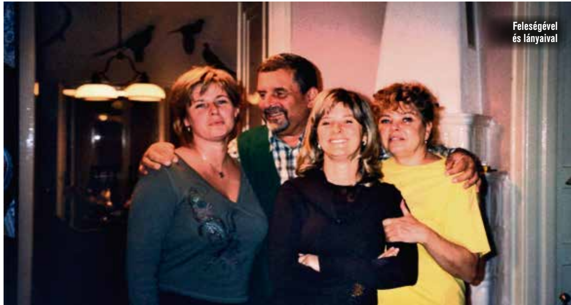
Feleségével és lányával

– 2005-ig, bízam ugyanis abban, hogy fiatal kollégáim tapasztalata beért, és át tudják venni a cég vezetését. Úgy gondoltam, az lesz a legjobb, ha egy kicsit hátrébb vonulok. Azt terveztem, hogy immár kevesebbet vállalva ugyan, de még 4-5 évig, főleg a már folyamatban lévő saját beruházásainkra rá-ránézek, azokat még levezényelem, ellenben a Piramis irányítását már rájuk bízom. 2010-ben akartam végleg felállni, az élet azután másképp alakult: 2010-ben nemcsak a cég vezetése szállt vissza rám, hanem a kármentés is a feladataim közé került. Emögött egyrészt a 2008-as világválság, másrészt hibás lépések sorozata állt. Korábban soha egyetlen fillér bankhitelt sem vetünk fel. Amikor azonban átadtam a zrt.-t, akkor utódom – bár tiltakoztam ellene – ezt mégis megtette. Sajnos, hozott más rossz döntéseket is, így a bankhitelt és a beruházás veszteségét is a cég vagyonából kellett rendeznem. Nem volt könnyű, de ma már elmondhatom, hogy valamennyi part-