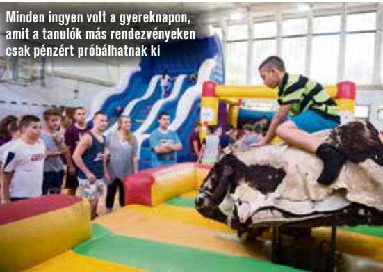
Minden ingyen volt a gyereknapon, amit a tanulók más rendezvényeken csak pénzért próbálhatnak ki

elemeink már túl vannak, de várhatóak még további érdekességek is. – Valamikor ősszel egy tankertet valósítunk meg a kilencven négyzetméteres tetőteraszunkon, speciális gyümölcsfákkal, növényekkel. Ezt azért tartom fontosnak, mert városi iskola lévén az idejéről gyerekek többsége nem rendelkezik konyhakerttel, kertess házzal. Ezért szeretnénk nekik már ebben a korban megmutatni, hogy ahhoz, hogy egy-két saját növénye legyen, nem feltétlenül kell nagy területben gondolkodni. Ez már egy okosan kialakított helyen, akár egy erkélyen is megvalósítható.