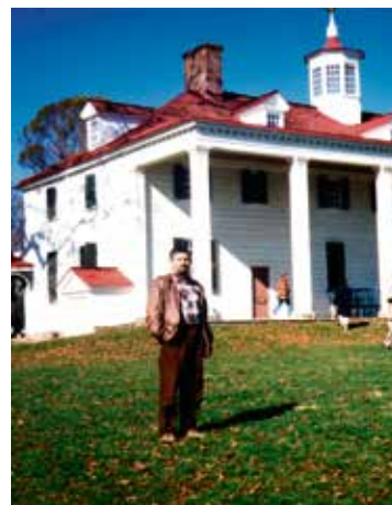
Tanulmányúton az USA-ban, George Washington háza előtt

nerünkkel kiegyeztem, mindenkivel elszámoltam, senkinek sem maradtunk adósai. A Piramis több mint 30 évre tehát sikertörténetként tekintek, de az utolsó évek már nehezek voltak. A zrt. jelenleg fölszámolás alatt áll, ez egy hosszabb távú stratégiai lépéssorozat egyik eleme. A jelenlegi több mint tíz vállalkozásunkat soknak tartom, ezek közül néhányat összevonunk, párat értékesítünk, és a jövőben a cégstruktúrát már úgy alakítjuk ki, hogy a gyermekeink, unokáink jövőjét segítsék.