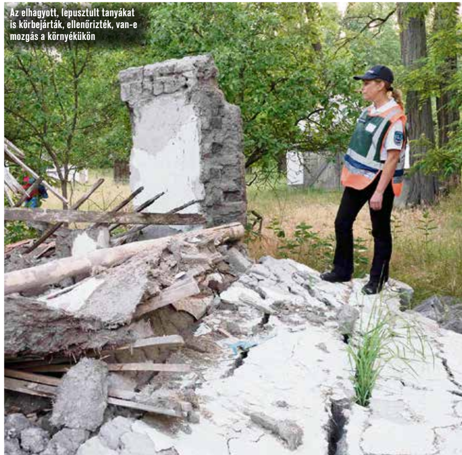
Az elhagyott, lepusztult tanyákat is körbejárták, ellenőrizték, van-e mozgás a környékükön