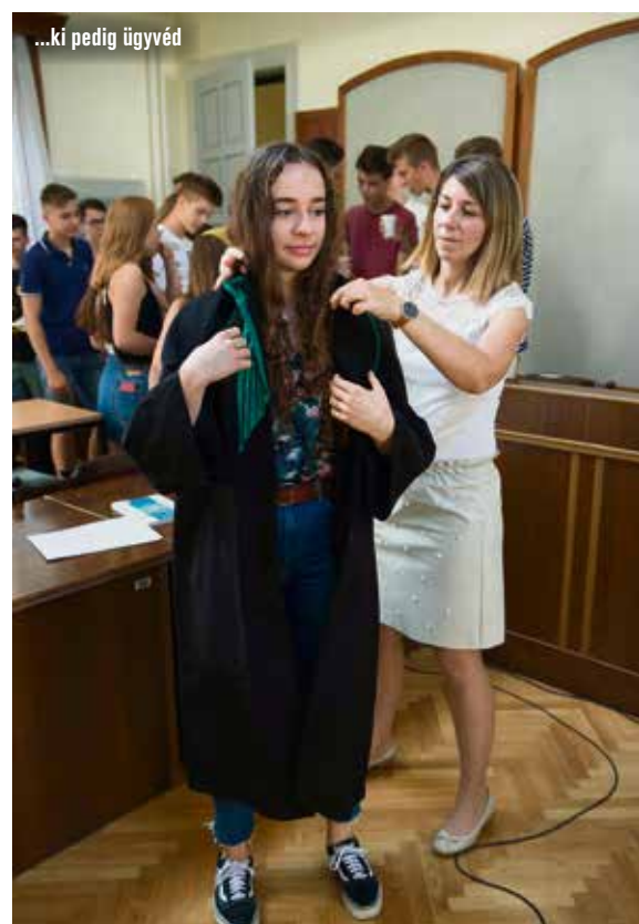
...ki pedig ügyvéd

Szimulált bírósági tárgyaláson vett részt a Katona József Gimnázium egyik kilencedikes osztálya kedd reggel a Kecskeméti Járásbíróság Dísztermében. A fiatalok maguk játszották el a büntetőeljárásban részt vevő személyeket.