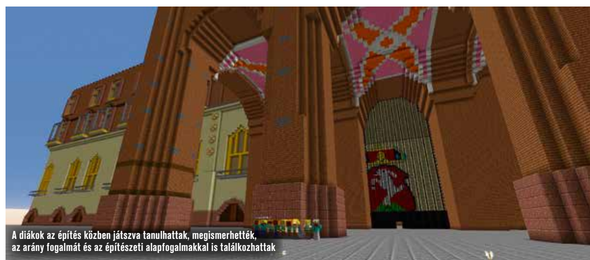
A diákok az építés közben játszva tanulhattak, megismerhették az arány fogalmát és az építészeti alapfogalmakkal is találkozhattak

Láthatóan nagy gondot fordítottak a részletekre, a Városháza udvarát is gyönyörűen újraalkották. A tér kitöltése a fantáziájukra volt bízva, ezért nagyon élvezték a munkát a gyerekek. Sok helyre tettek információs pontokat, hogy mindent megtudhassanak az érdeklődők az adott helyszínnel kapcsolatban, de titkos helyeket, meglepetéseket is készítettek a látogatóknak!