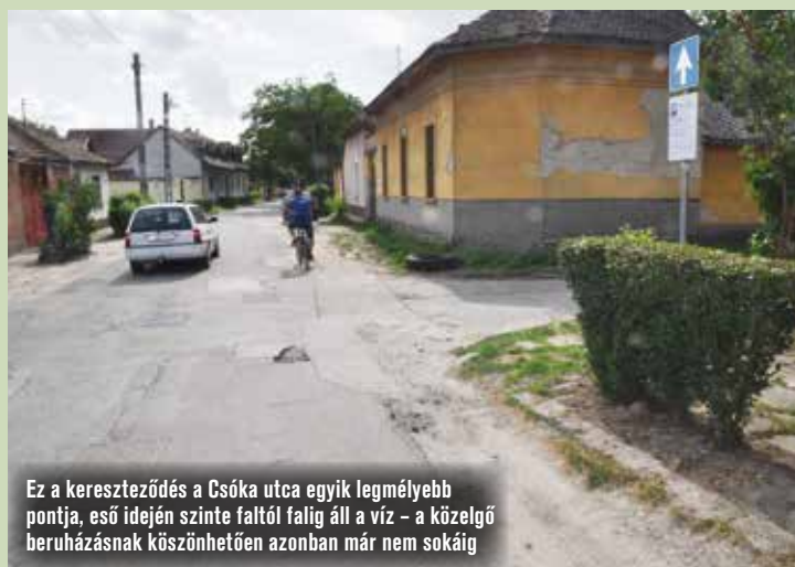
Ez a kereszteződés a Csóka utca egyik legmélyebb pontja, eső idején szinte faltól falig áll a víz – a közelgő beruházásnak köszönhetően azonban már nem sokáig