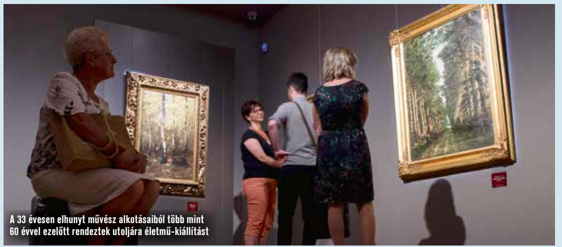
A 33 évesen elhunyt művész alkotásaiból több mint 60 évvel ezelőtt rendeztek utoljára életmű-kiállítást

A fiatalon, 33 évesen korában, egy baleset következtében elhunyt Paál Lászlónak utoljára több mint 60 évvel ezelőtt, 1954-ben rendeztek életmű-kiállítást a Szépművészeti Múzeumban. A Bozsó Gyűjtemény hiányt pótló tárlata augusztus 26-áig látogatható.