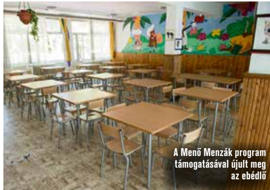
A Menő Menzák program támogatásával újult meg az ebédlő