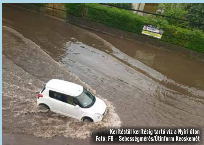
Kerítéstől kerítésig tartó víz a Nyíri úton

Kecskemét déli és középső részét sújtotta főként az az özönvízszerű esőzés múlt szombaton, amely közel két órára megbénította a város közlekedését. Volt, ahol a vízelvezető csatornarendszerről folyt vissza a csapadék, volt, ahol teljes utcaszakaszokat változtatott pillanatok alatt kisebb tóvá. De a gyalogosok-