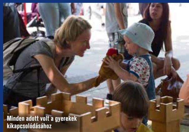
Minden adott volt a gyerekek kikapcsolódásához