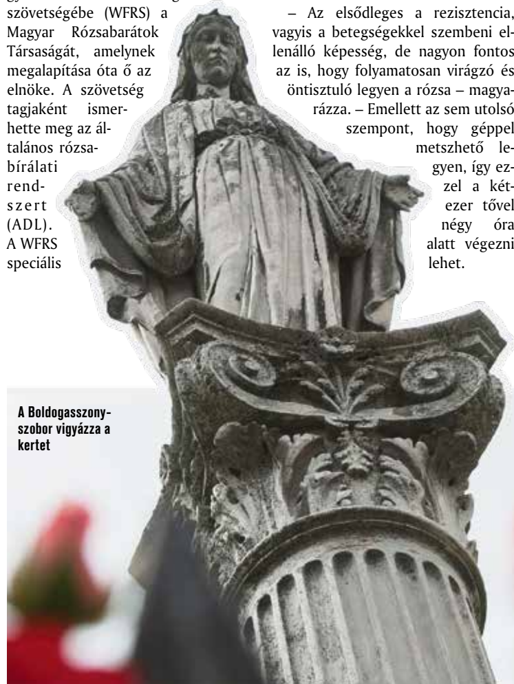
A Boldogasszony-szobor vigyázza a kertet