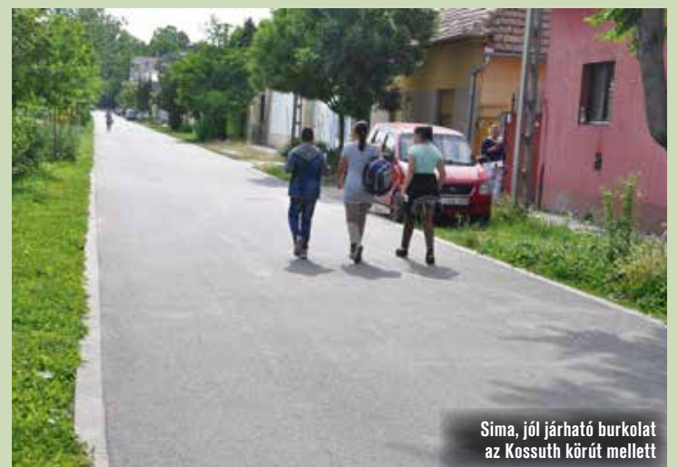
Sima, jól járható burkolat az Kossuth körút mellett