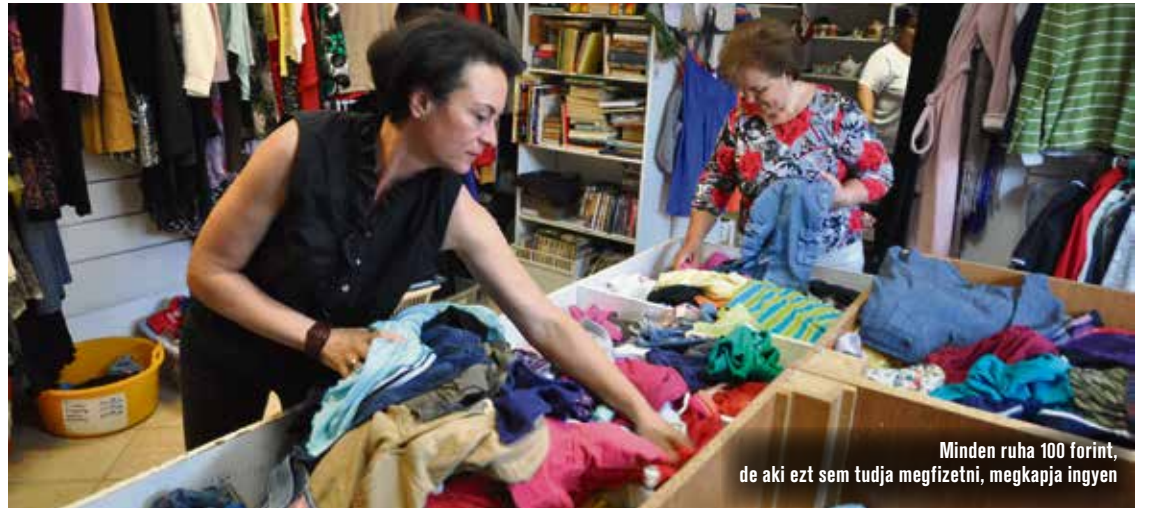
Minden ruha 100 forint, de aki ezt sem tudja megfizetni, megkapja ingyen