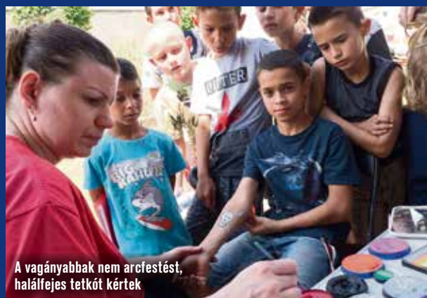
A vagányabbak nem arcfestést, halálfejes tetkót kértek