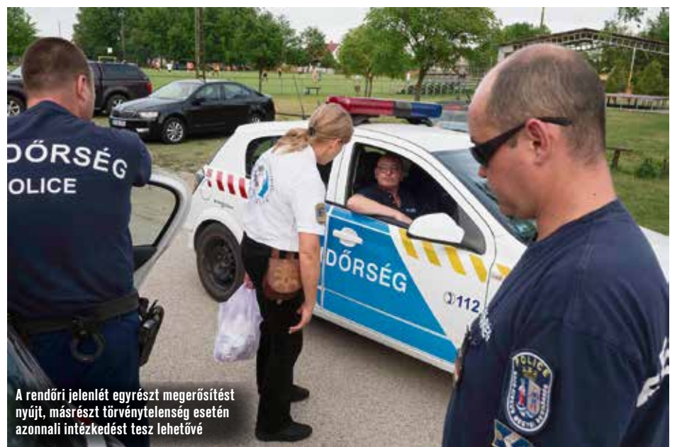
A rendőri jelenlét egyrészt megerősítést nyújt, másrészt törvénytelenység esetén azonnali intézkedést tesz lehetővé