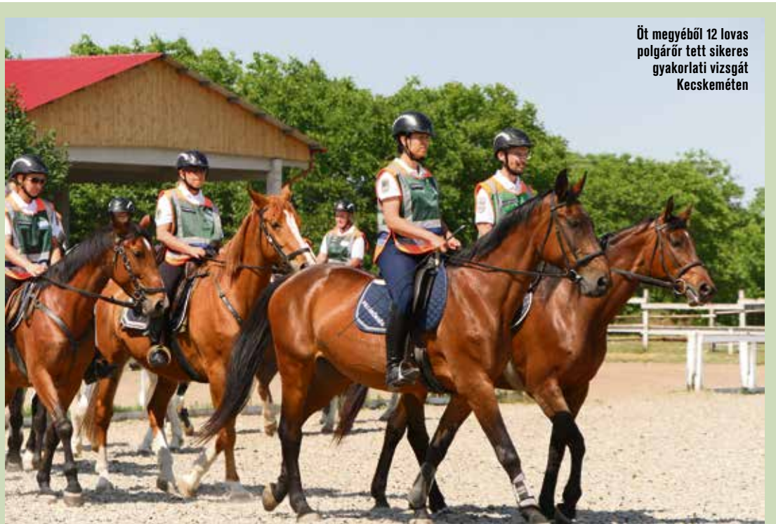
Öt megyéből 12 lovas polgárőr tett sikeres gyakorlati vizsgát Kecskeméten