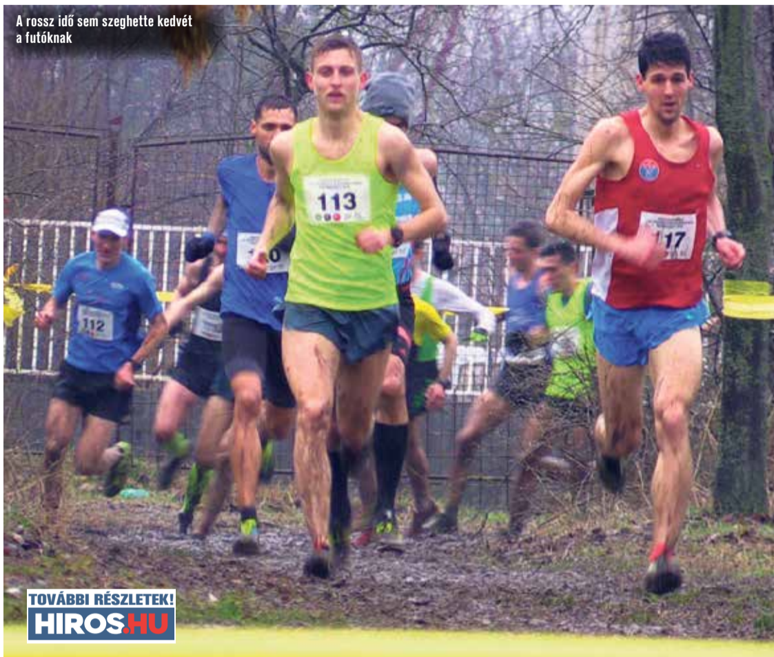
A rossz idő sem szeghette kedvét a futóknak