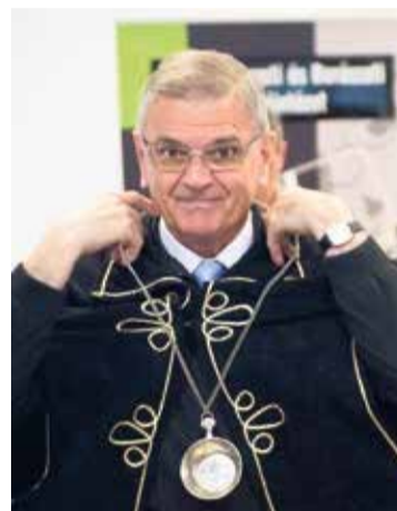
2017-ben, a „Kecskemét város bora” verseny bírálójaként

vágytam magasabb pozíciókra. Azután abban is láttam nem kevés igazságot, hogy az idő eltelt felettem. Mindez együtt segített abban, hogy el tudjam engedni életemnek ezt a kétségkívül szép és eredményes szakaszát.