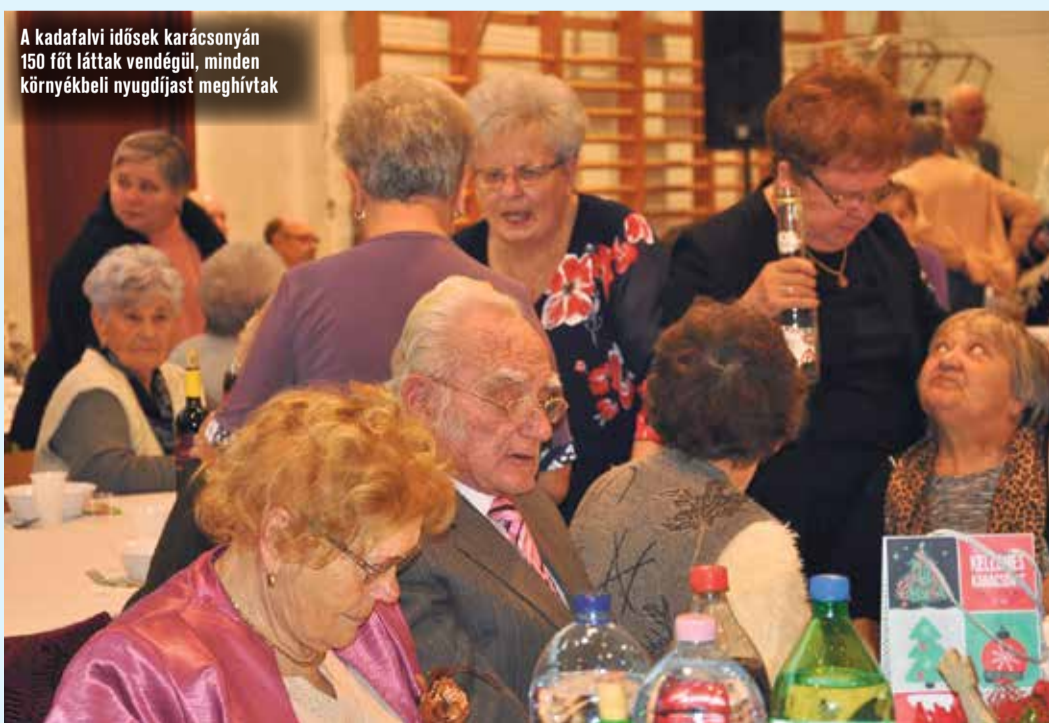
A kadafalvi idősek karácsonyan 150 főt láttak vendégül, minden környékbeli nyugdíjast meghívtak