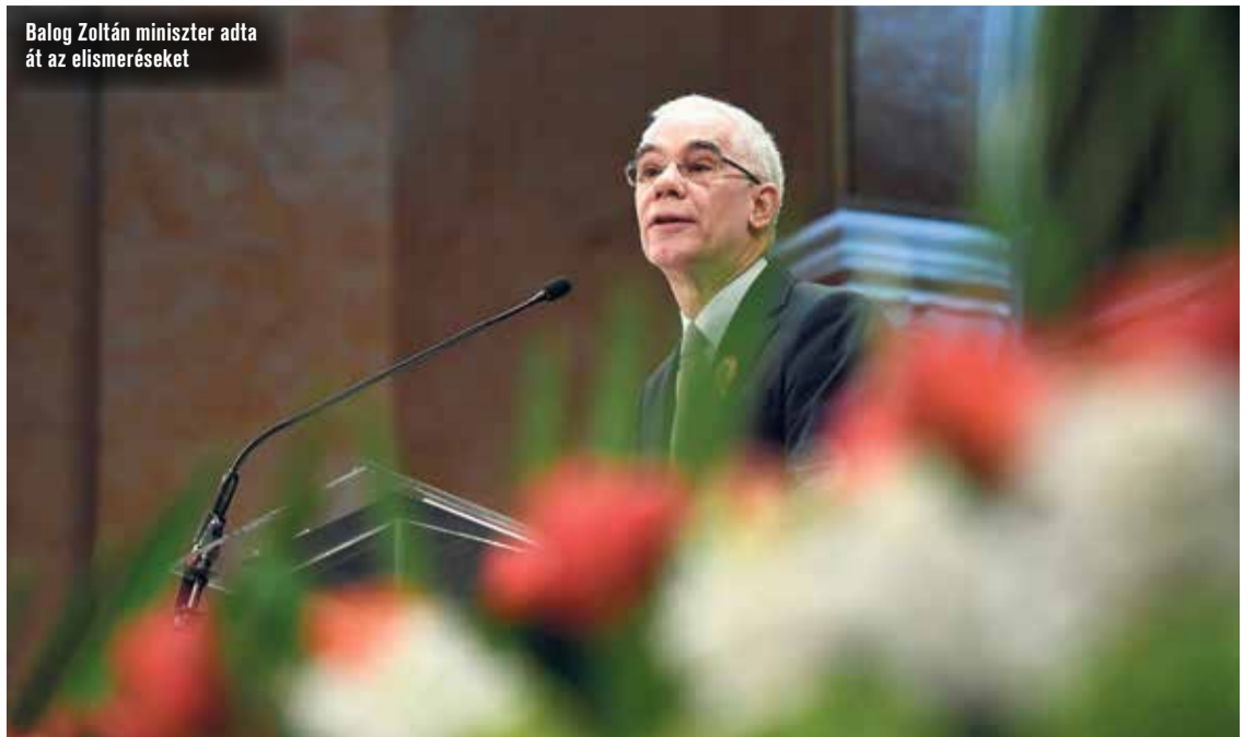
Balog Zoltán miniszter adta át az elismeréseket