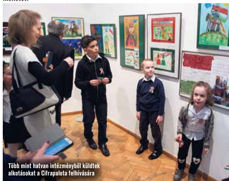
Több mint hatvan intézményből küldtek alkotásokat a Cifrapalota felhívására

Már hagyomány, hogy a március 15. előtti napokban nemzetünk legifjabb tagjai is csoportosan elszállnak a Kossuth-szoborhoz, és a virágágyásba tűzik a kis lobogókat, papírkokárdákat, huszárokat vagy nemzeti színű virágokat, melyek apró kezek munkáit dicsérik. Ezt követően vigyázzban állva elszavalják a Nemzeti dalt, az óvó nénik vagy dadusok csoportképet készítenek, majd visszaszállnak a jó levegőn az ovikba, bölcsikbe, hogy kipihenhessék a hősiességet.