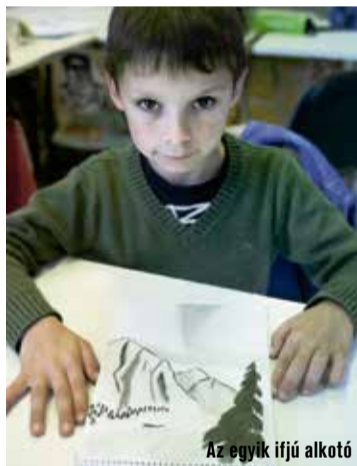
Az egyik ifjú alkotó

– Ez egy nagyon fontos, s ugyanakkor nehezen megválaszolható kérdés. Az elmúlt 16-17 év alatt ugyanis nagyon nagy változást látok az idejáró, különböző gyerekgenerációk között. A generációk között csupán 3-4 év korkülönbségről beszélünk – ez már a harmadik generáció, amelyek a szemünk előtt nő fel, s lép meg minket újabb szokásaival. A mostani gyermekek teljesen más habitussal rendelkeznek, mint az előzők. Mintha egy másik bolygóról jöttek volna. A mozgóképhez való kötődésük, anélkül, hogy ez tudatos lenne, szinte már az eszmélésük pillanatától jelen van az életükben. Számukra a mozgókép egy sokkal természetesebb és magától értetődőbb dolog, műfaj, nyelv, mint volt az elődeik vagy akár a szüleik számára