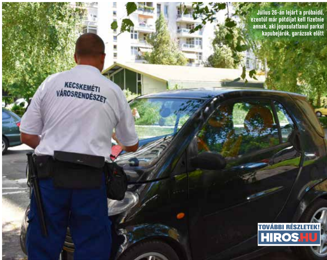
Július 26-án lejárt a próbaidő, ezentúl már pótdíjat kell fizetnie annak, aki jogosulatlanul parkol kapubejárók, garázsok előtt