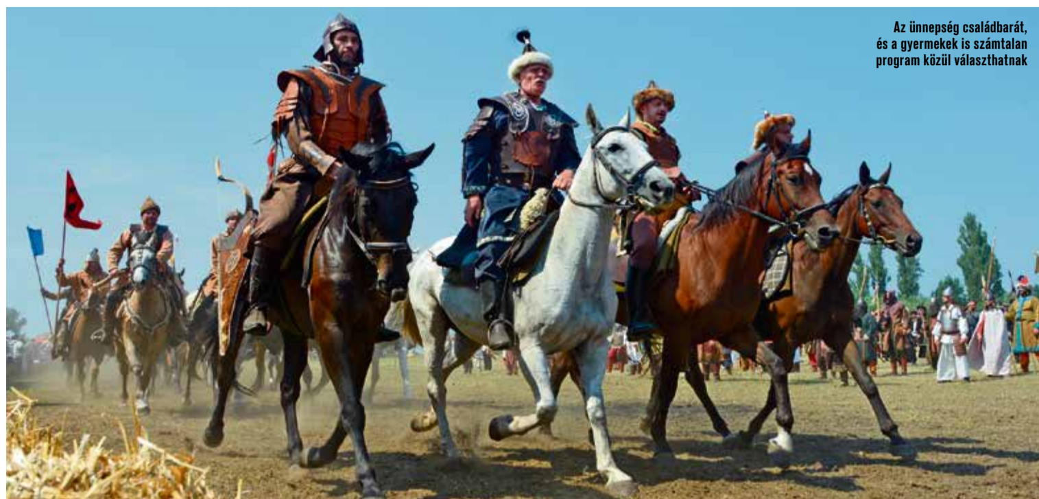
Az ünnepség családbarát, és a gyermekek is számtalan program közül választhatnak

Külön érdekessége a rendezvénynek, hogy már az utazási irodák kí-