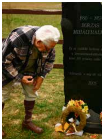
A borzasi pusztán álló emlékkönel