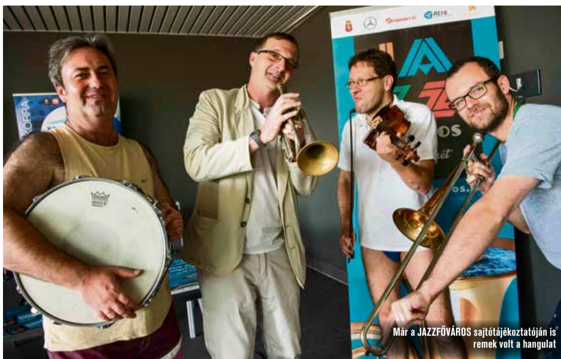
Már a JAZZFŐVÁROS sajtótájékoztatóján is remek volt a hangulat

– Szerencsére mindenki nagyon lelkes volt. A magyar fellépők nagy örömmel mondtak igent. Mivel ebben a stílusban nem volt még ilyen fesztivál, így ők is érzik, hogy ez most valami különleges lehet. Külföldi sztárjaink közül többen svájci, francia fellépés helyett döntöttek a JAZZFŐVÁROS mellett, ugyanis borzasztóan szeretik a magyar közönséget. Az is motiválta őket, hogy sokat