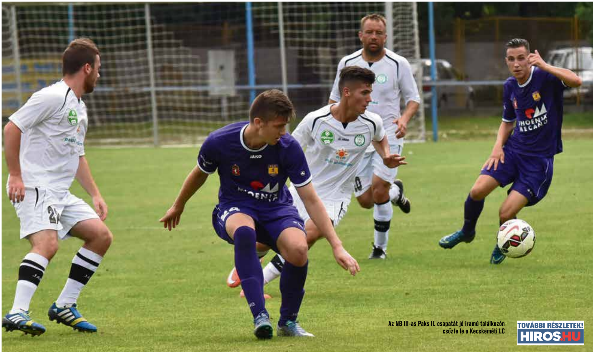
Az NB III-as Paks II. csapatát jó iramú találkozón csőzte le a Kecskeméti LC