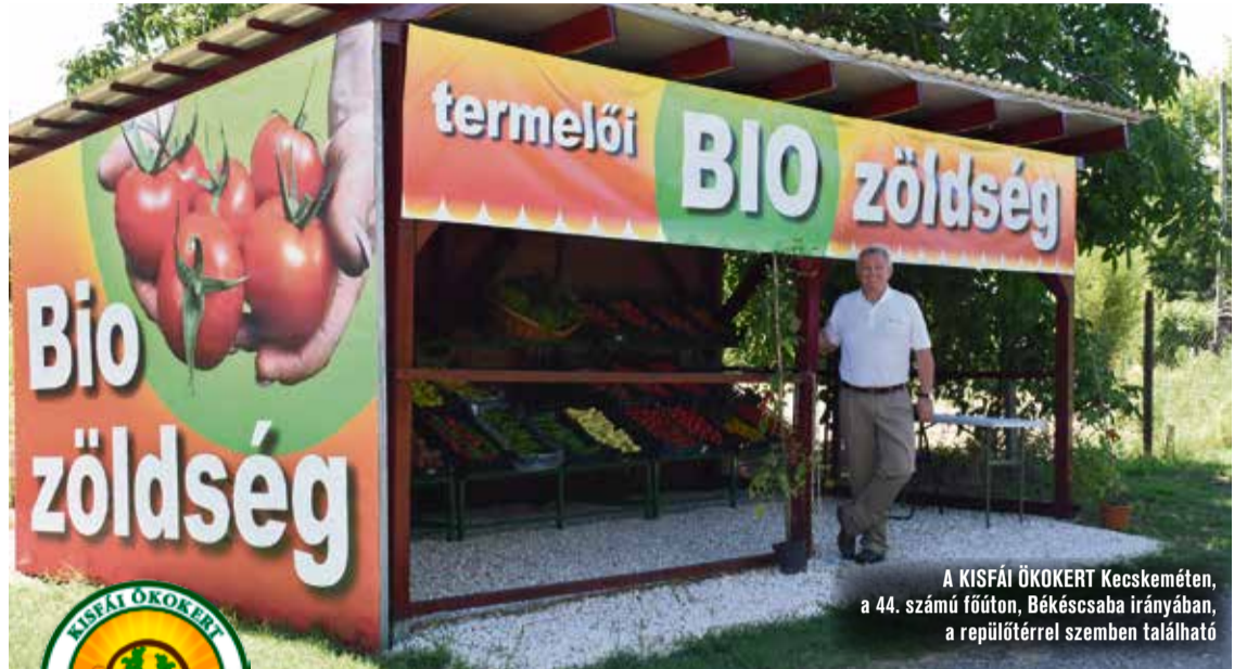
A KISFÁI ÖKOKERT Kecskeméten, a 44. számú főúton, Békéscsaba irányában, a repülőtérrel szemben található

– Szerintem a környezettudatosságra nevelést már az óvodában el kell kezdeni , ezzel együtt az egészségtudatos táplálkozás igényének csiráját is el kell ültetni. A KISFÁI ÖKOKERT nyitottságával újabb lehetőséget szeretnénk teremteni az egészségtudatos fogyasztónak, mindazoknak, akik biozöldséghez szeretnének hozzájutni. Pedagógusoknak is nyitva áll az ajtó. Ugyanakkor a kifizái stand megnyitása azért is nagy jelentőségű, mert egy élő, modern biogazdaság modelljét láthatja az érdeklődő. Itt bárki személyesen meggyőződhet a kémiai növényvédelem teljes körű mellőzéséről és arról, hogy hasznos rovarokkal, rovarcsalogató virágok kombinációjával hogyan termelünk egészséges zöldséget, gyümölcsöt. Azt az élményt szeretnénk visszaadni a fogyasztónak, hogy aki szeretné, az – ha csak egy rövid időre, például egy órára – részese lehessen a termeszési folyamatnak. Ráadásul az ökokertet felkereső – az itt dolgozók kíséretében – kedvére válogathat és szedhet