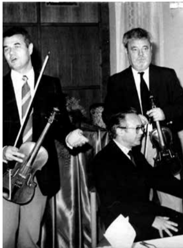
A zongora mellett zenész társaival egy nyugdíjas találkozóán, 1984-ben