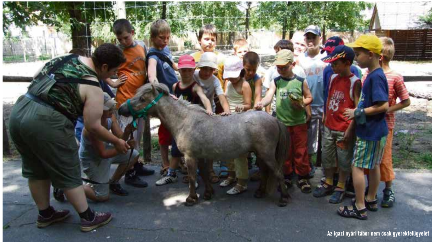
Az igazi nyári tábor nem csak gyereklügyelet

Az Ifjúsági Otthon főként kreatív, kézműves és ismeretterjesztő programokkal vár, a Kulturális Központ a táncos, zenés táborok színhelye, a HELPI-ben (a Kék Elefántban és az Elevenben) a kalandoké a főszerep, míg a Hetényegyházi Közösségi Házban sok-sok mese és kézművesség dominál. Az ötödik helyszínre kicsit messzebb kell utazni, az ugyanis a Mátrában található. A Parádi Tábor a többivel ellentétben bentlakásos, nehéz is lenne minden nap 8 óráig leadni a gyermeket, aztán 17 óráig elhozni őket. A Hírös Agóra Kulturális és Ifjúsági Központ színes és élménydús programjait 21-en szervezték, akik maguk is részt vesznek a táborvezetésben, 80-90 szakemberrel együtt. Munkájukat 20-30 önkéntes, diáksegí-