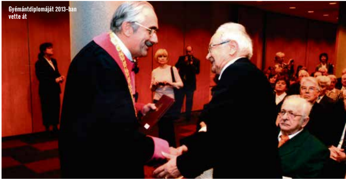
Gyémántdiplomáját 2013-ban vette át