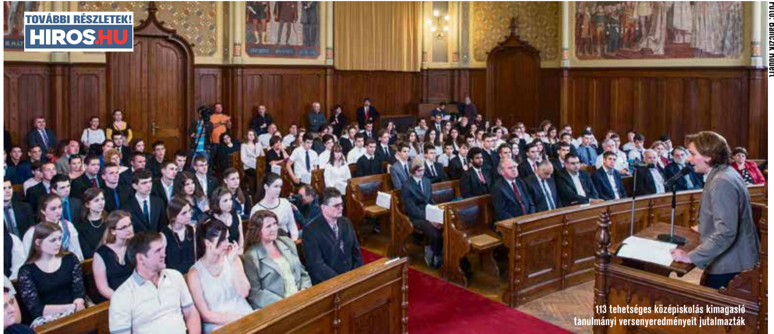
113 tehetséges középiskolás kimagasló tanulmányi versenyeredményeit jutalmazták

Kecskemét Megyei Jogú Város Önkormányzata az idei költségvetésben külön figyelmet szentelt a kecskeméti középiskolások jutalmazásának. A döntéshozókat a javaslat kialakítása során az a cél vezérelte, hogy odafigyelve a kecskeméti tehetségekre, kiválóságokra, ösztönzést próbáljanak kialakítani számukra. Megjutalmazni azokat a kiemelkedő tehetségeket, akik kiváló országos eredményeket értek el tanulmányi-, szakmai és sportversenyeken, és motiválni azokat, akik képesek meghatározó eredmények elérésére. Hiszen a város számára nagy büszkeség, hogy kiválóságok kerülnek ki a kecskeméti iskolapadokból. Ennek egyik eleme a kreatív és innovatív oktatási területek fejlesztése. Ez pedig nemcsak a helyi középiskolákat jelenti, hanem az országos szinten is egyre meghatározóbbá váló Kecskeméti Főiskolát, az annak alapjaira épülő új egyetemet, egyetemi várost is. Ez a rendszer pedig már Kecskemét városa és gazdasága számára is kiművelt emberfőket termel. Ők lesznek a fejlődés záloga. Az idetelepülő neves cégeknek ugyanis világszínvonalú termékeik előállításához világszínvonalú munkaerőre is szükségük van,