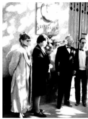
Feleségével és gyermekeivel édesapja csongrádi emléktáblájának avatásán, 1996-ban