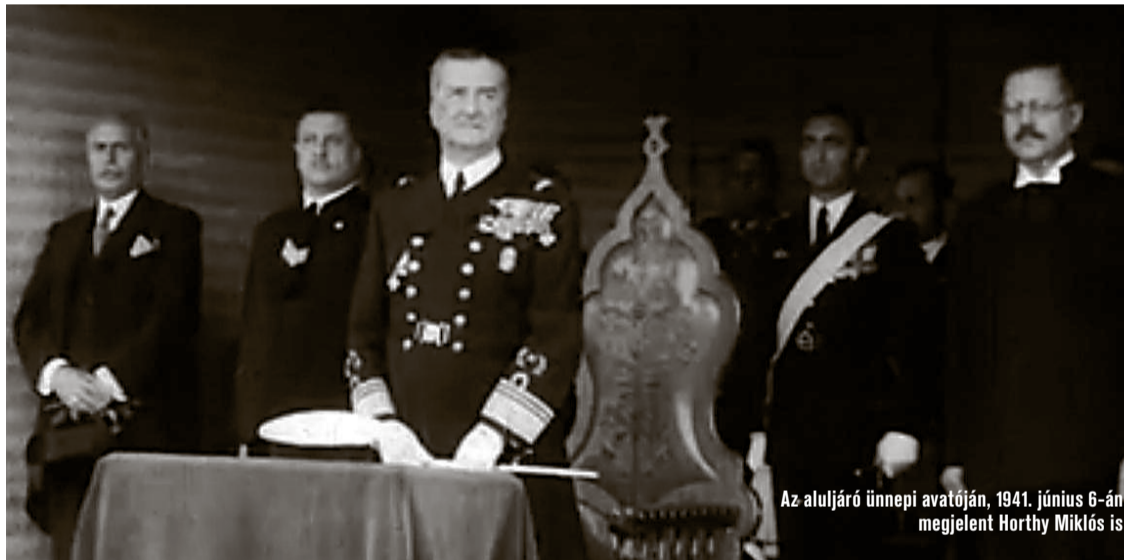
Az aluljáró ünnepi avatóján, 1941. június 6-án megjelent Horthy Miklós is

Az aluljárót eredetileg önműködő villanymotoros pompa védte egy esetleges zivatar okozta eláradástól. Az 1944 őszi Kecskemétre benyomuló szovjet erők már az első napokban leszerelték, és mint hadizsákmányt elszállították a motort és a pumpát. Azóta a vízvezető rendszer nem tud megbirkózni a nagy esőzések után hirtelen leszaladó esővízzel, rendszerint több-kevesebb víz kerül az aluljáróba. A probléma megoldására számos kísérlet történt – a Kereskedelmiügyi Minisztérium már 1946-ban felszólította a MÁV vezetőit, valamint a Városi Rendőrkapitányság illetékes osztályát, illetve a polgármestert az áldatlan, balesetveszélyes helyzet