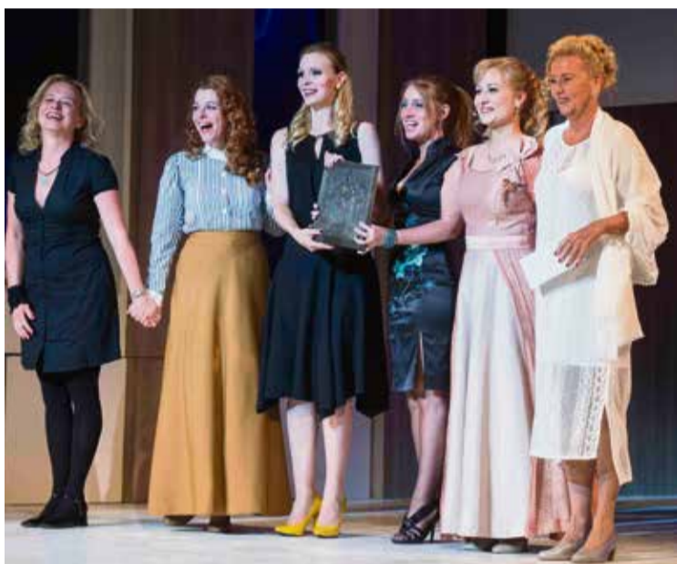
Izgalomban bővelkedő, rendkívül színvonalas gálaműsor keretében adták a Katona József Színházban a 2015/16-os évad LEG-jeinek díjait a közönség szavazatai alapján.

2009-ben rendezték az első évadzáró díjátadót, amit azóta is nagy izgalommal vár a szakma és a közönség egyaránt. Az elismerés presztízsét jelzi az is, hogy évről évre jelentős támogatók állnak a kezdeményezés mögé. Ezúttal is a közönség döntött arról, mely darabok és színészek érdemelték ki a rangos elismerést. Idén új kategóriával bővült a LEG-ek sora, ugyanis ezúttal a Legjobb táncművészt is díjazták. Így összesen tíz kategóriában szavazhattak a nézők az idei évad legjobbjaira.