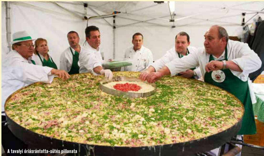
A tavalyi óriásrántotta-sütés pillanata

– Tavaly igazi programkavalkád várta a látogatókat a főtéren. Milyen volt a fogadtatása az első tojásfesztiválnak?