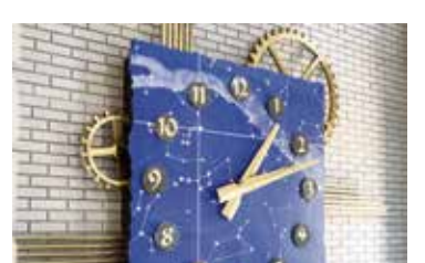
A megyei könyvtár épületében látható óra