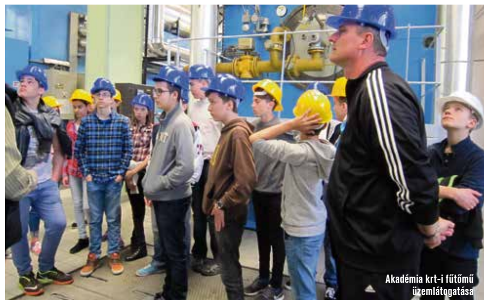
Akadémia krt-i fűtőmű üzemlátogatása