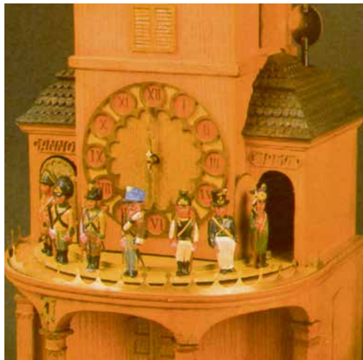
A Hány János toronyórájának makettje. Budapesti Történelmi Múzeum 1982. Kodály Zoltán kapta a Hány János 100. előadása alkalmából 1954-ben.