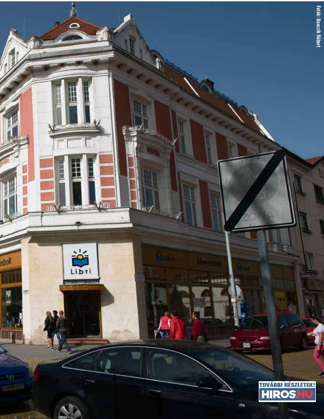
Foltók: Banczik Róbert