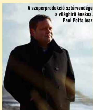
A szuperprodukciónak sztárvendége a világhírű énekes, Paul Potts lesz

A végtelen ábrázoló közeg nem feltétlenül kell, hogy a tenger legyen – meséli Szabó Máté, miért esett a galaktikus körülményekre a választásuk.