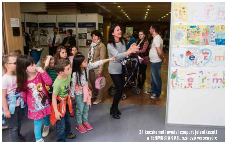
34 kecskeméti óvodai csoport jelentkezett a TERMOSTAR Kft. színező versenyére