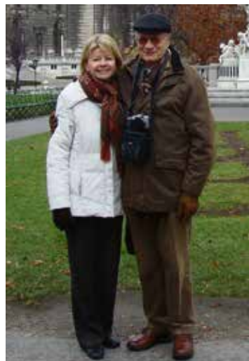
Párjával egy bécsi kiránduláson