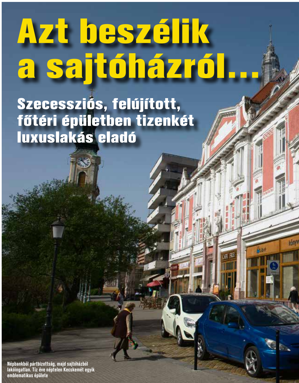
Népbankból pártbizottság, majd sajtóházból lakóingatlan. Tíz éve néptelen Kecskemét egyik emblematikus épülete

Szecessziós, felújított, főtéri épületben tizenkét luxuslakás eladó