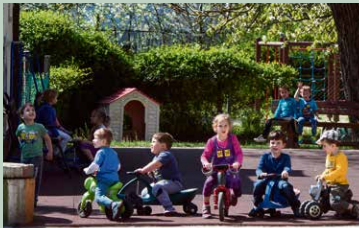
Egy városrész lakossága megtartásának vagy bővítésének záloga, hogy az ott élő gyermekek bölcsődei, óvodai, iskolai ellátása színvonalasan megvalósuljon.