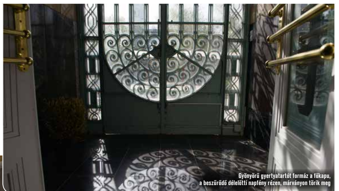
Gyönyörű gyertyatartót formáz a főkapu, a beszűrődő délelőtti napfény rézen, márványon török meg