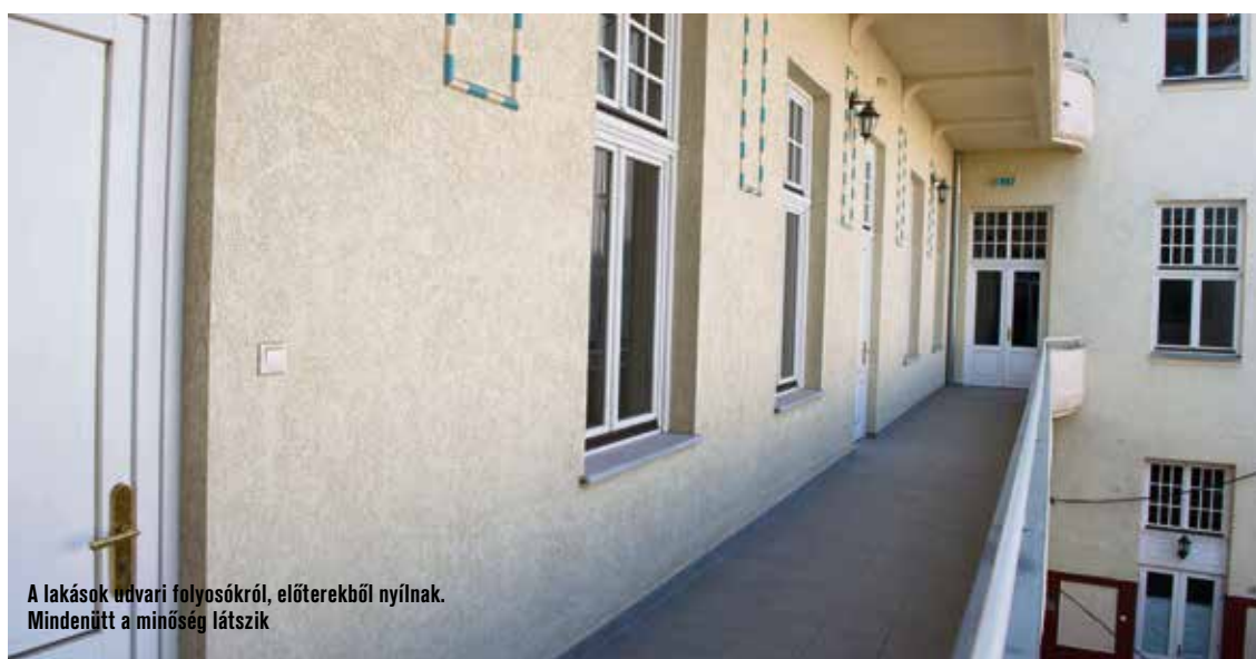
A lakások udvari folyosókról, előterekből nyílnak. Mindenütt a minőség látszik