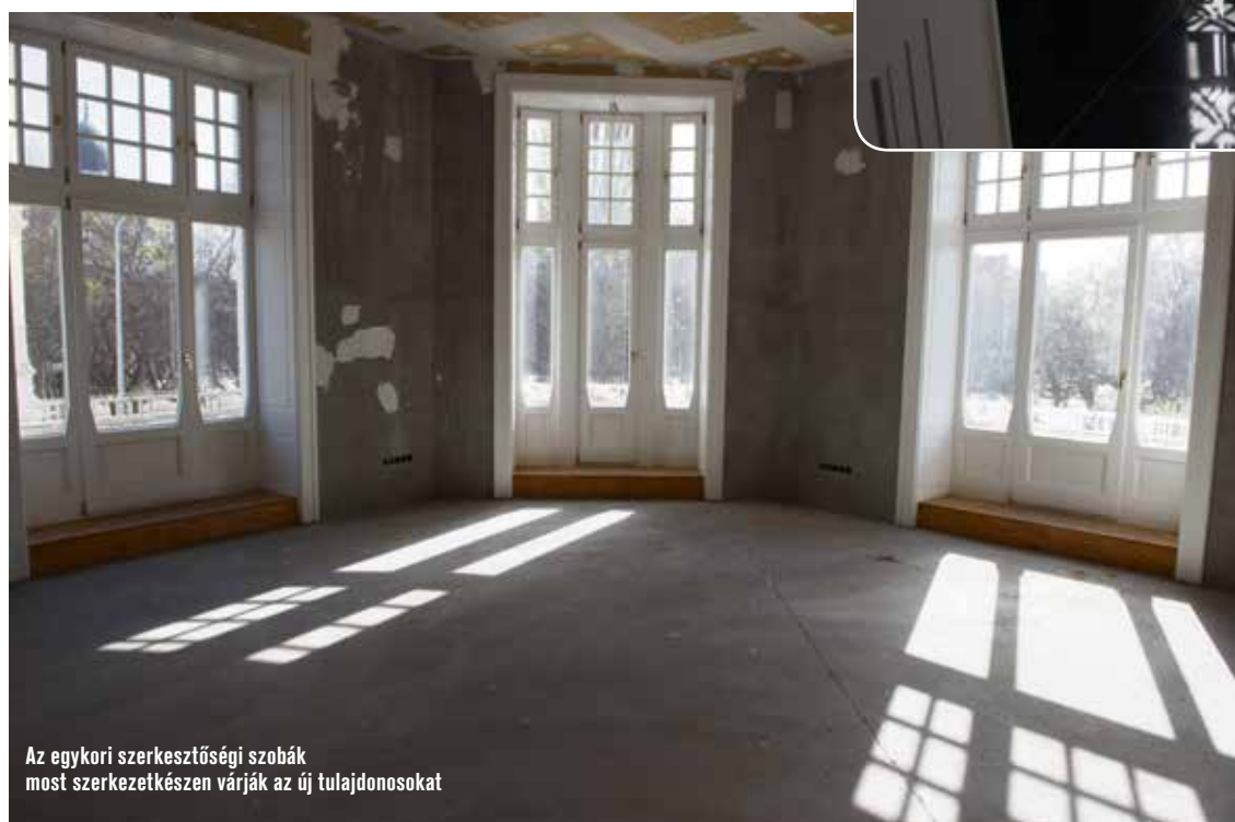
Az egykori szerkesztőségi szobák most szerkezetkész várják az új tulajdonosokat