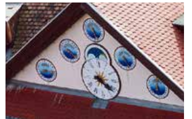
A világora New Yorktól Moszkváig mutatja a pontos időt

– Ne is mondja! Szerintem teljesen felesleges ez a téli-nyári időszámítás. Semmit nem használ, és senkinek nem is tesz jót. Nekem jobban tetszene, ha nem állítgatnánk. Szerintem maradjunk a nyáriban, mert az mindenkinek jobb.