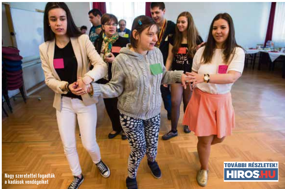
Nagy szeretettel fogadták a kadások vendégeiket