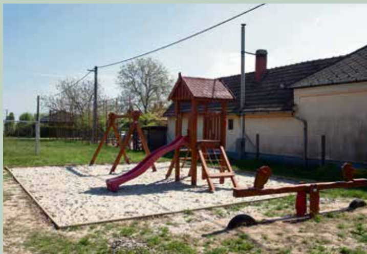
A Törekvés-lakótelepen létrejött vadonatúj játszótér és sportpálya kikapcsolódást nyújt akár a Kossuth-lakótelepről idelátogató szülők és gyermekek számára is.