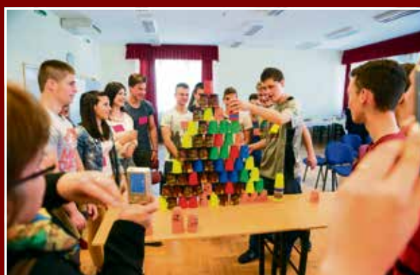
Így pakolja a poharakat egy világbajnok