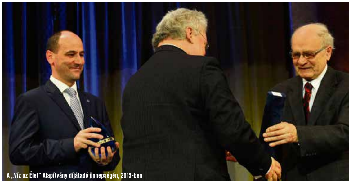
A „Víz az Élet” Alapítvány díjátadó ünnepségén, 2015-ben