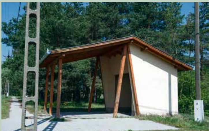
A Ménteleken álló felújított buszmegálló évek óta türelmesen várja, hogy a településközpont fejlesztése után végre megkapja eredeti funkcióját.