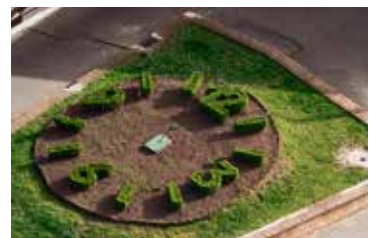
A virágóra hamarosan új színekben tündököl