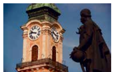
A nagytemplom órájával kezdődött minden