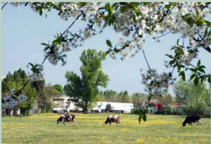
A Katonatelepi Sportegyesület 2016-ban 3,5 millió forintból gazdálkodhat, ennek fele részönkormányzati keret. Új helyen jöhet létre hamarosan a sportpálya.