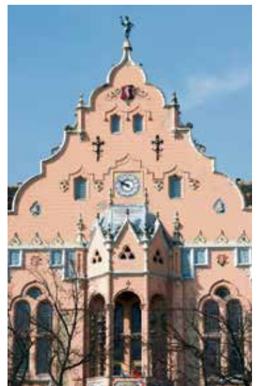
A bábjátékra kiszemelt négy ablak a Városháza homlokzatán