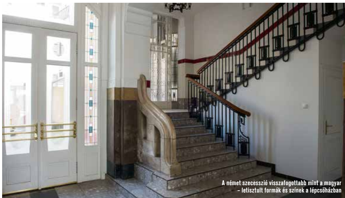
A német szecesszió visszafogottabb mint a magyar – letisztult formák és színek a lépcsőházban