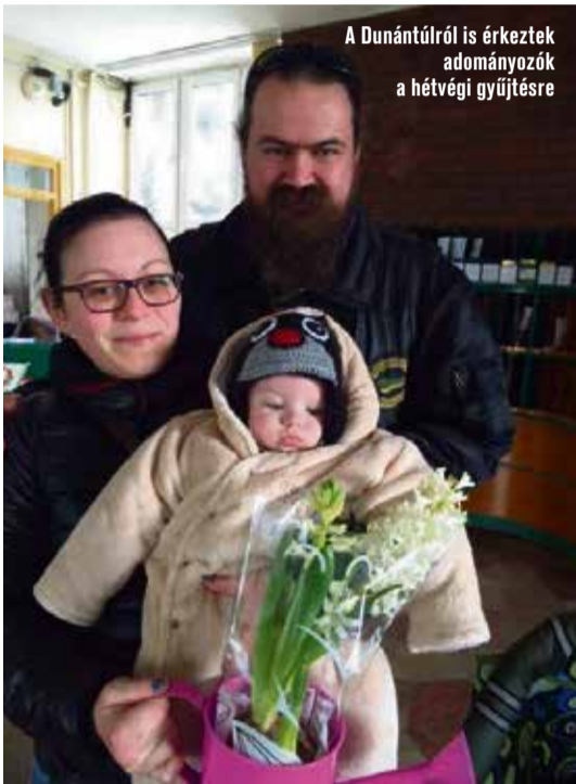
A Dunántúlról is érkeztek adományozók a hétvégi gyűjtésre