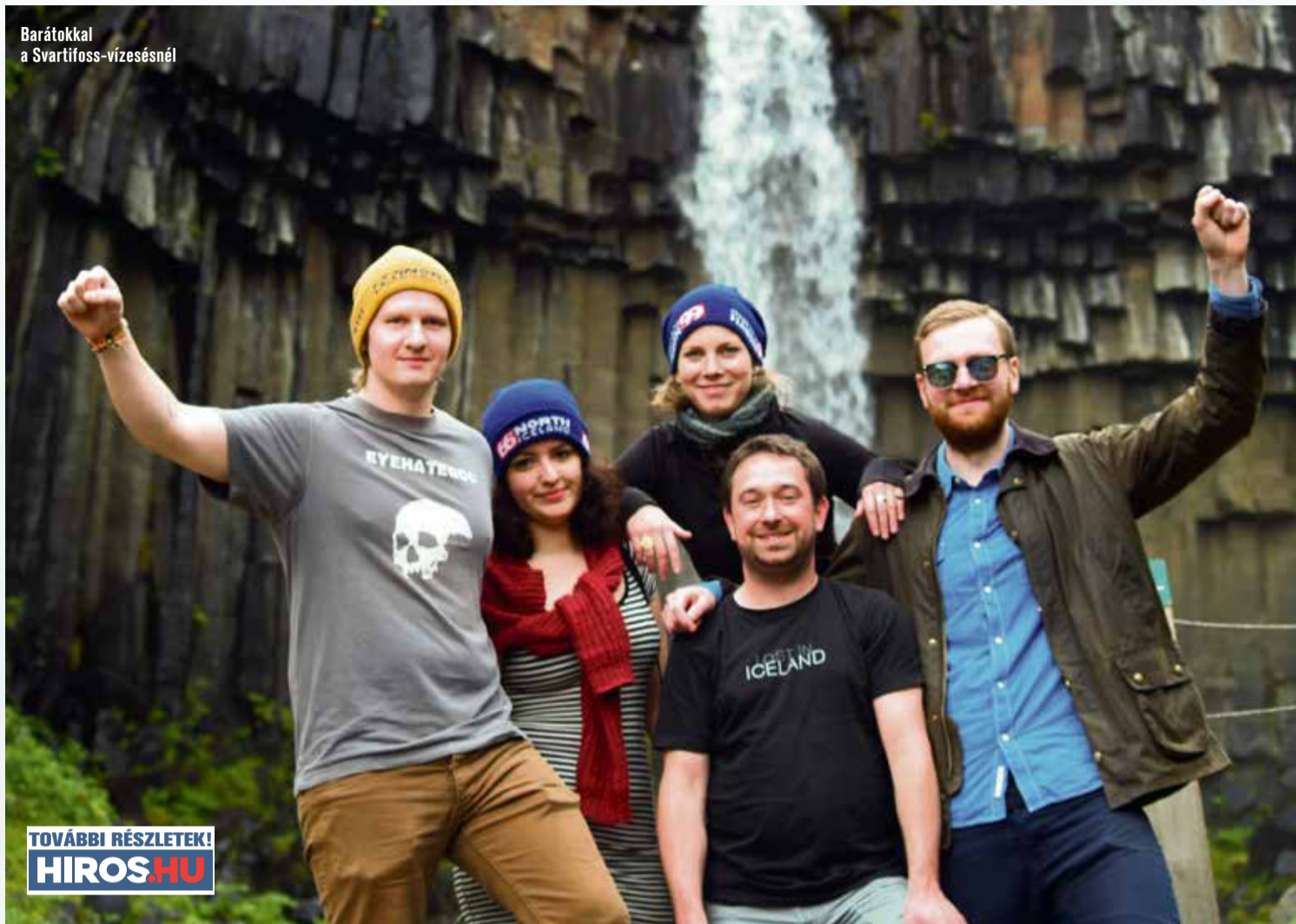
Barátokkal a Svartifoss-vízesésnél

Született: Kecskemét Hol él: Izland, 2014 márciusa óta Iskolai végzettség: egyetem Foglalkozás: tanuló