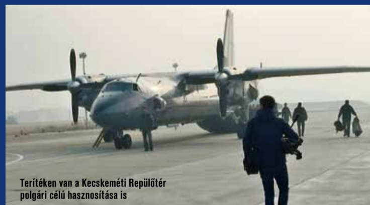
Terítéken van a Kecskeméti Repülőter polgári célú hasznosítása is

Wass Albert tiszteletére a magyarlakta területeken – immár hetedik éve – egy időben, településenként egy helyszínen felolvasnak műveiből. A Hírös Rovó kör invitál minden kedves érdeklődőt, szombaton 10-től 19 óráig a Hírös Agórába, hogy hallgassa meg és ha felolvasni is szeretne, akkor olvasson fel kedves részletet bármely Wass Albert műből.