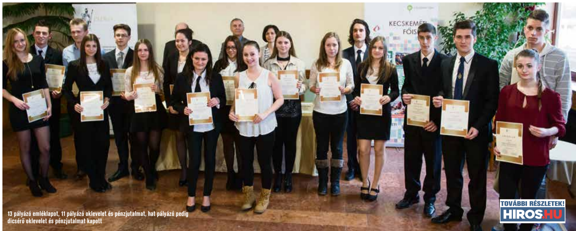
13 pályázó emléklapot, 11 pályázó oklevelet és pénzzutalmat, hat pályázó pedig dicséret oklevelet és pénzzutalmat kapott