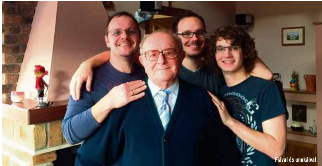
Fiaival és unokáival