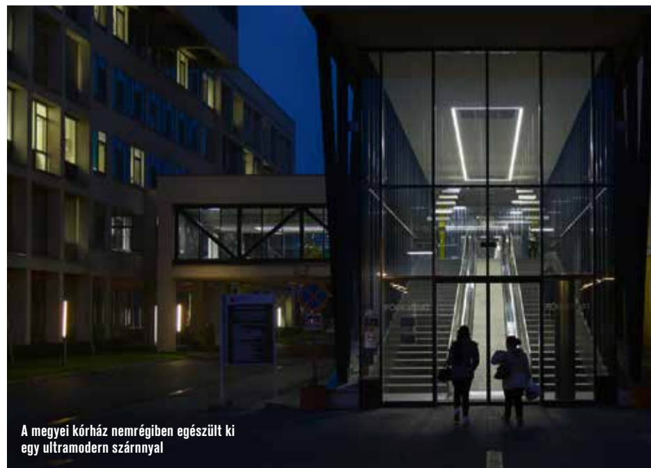
A megyei kórház nemrégiben egészült ki egy ultramodern szárnyal