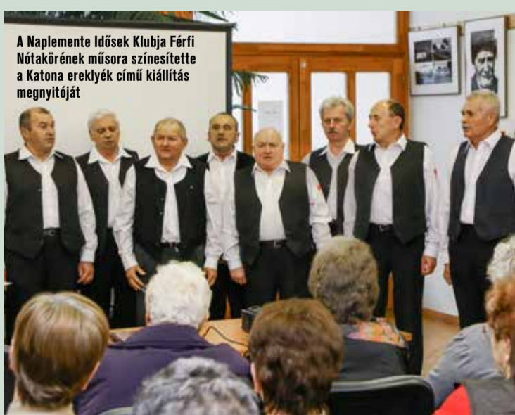
A Naplemente Idősek Klubja Férfi Nótakörének műsora színesítette a Katona ereklyék című kiállítás megnyitóját

– Mi a helyzet a nyári programokkal, amikor minden iskolás itthon van?