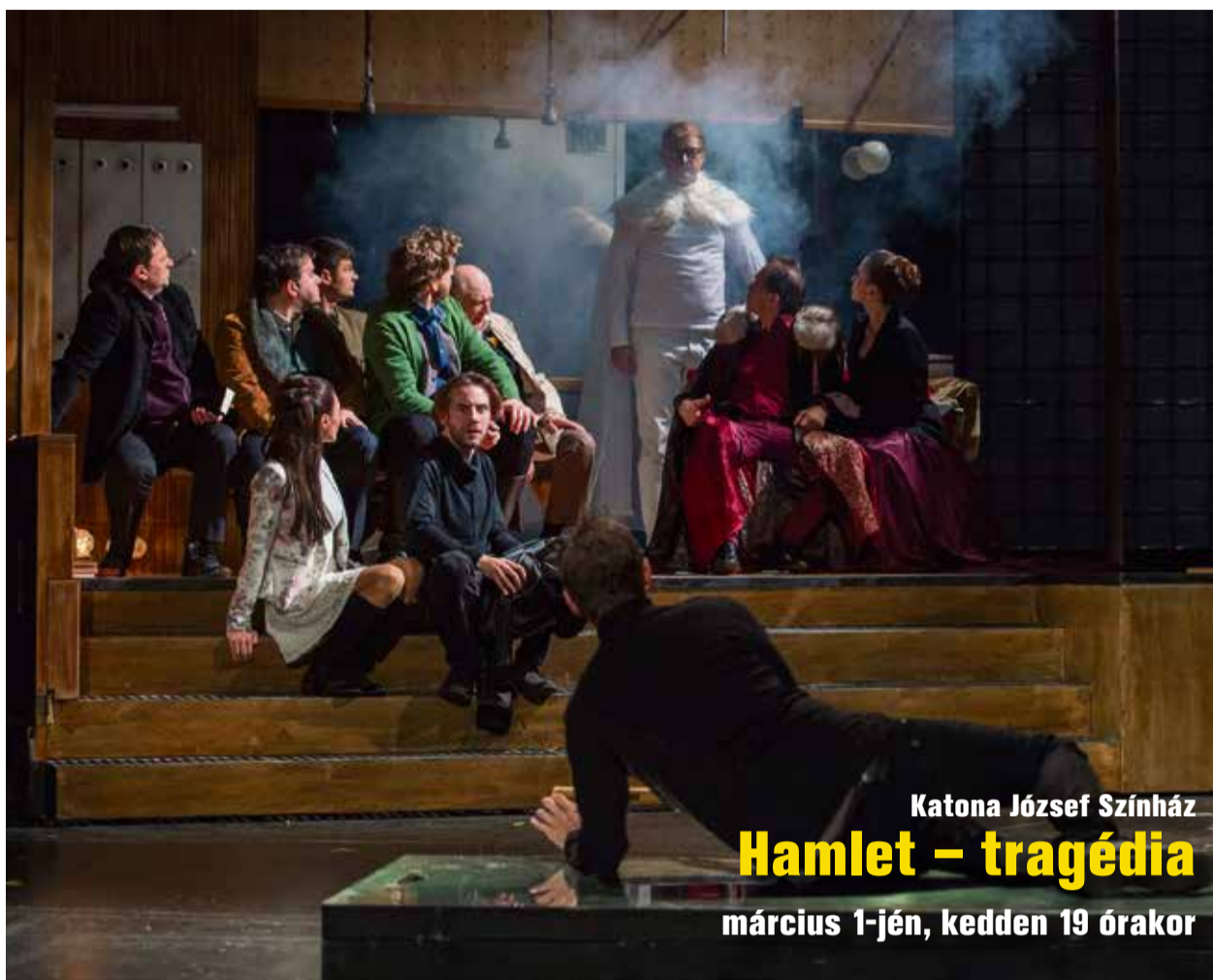
Katona József Színház Hamlet – tragédia március 1-jén, kedden 19 órakor