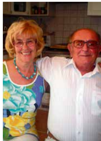
Feleségével kecskeméti otthonukban

a sajtó gyakori híradásaiból tudok a fővárosi és más kórházak elképesztő gondjairól, saját tapasztalataim alapján mégis elmondhatom: kórházunk felszereltségét és az orvosok szaktudását tekintve mi, kecskemétiék nagyon jó helyzetben vagyunk.