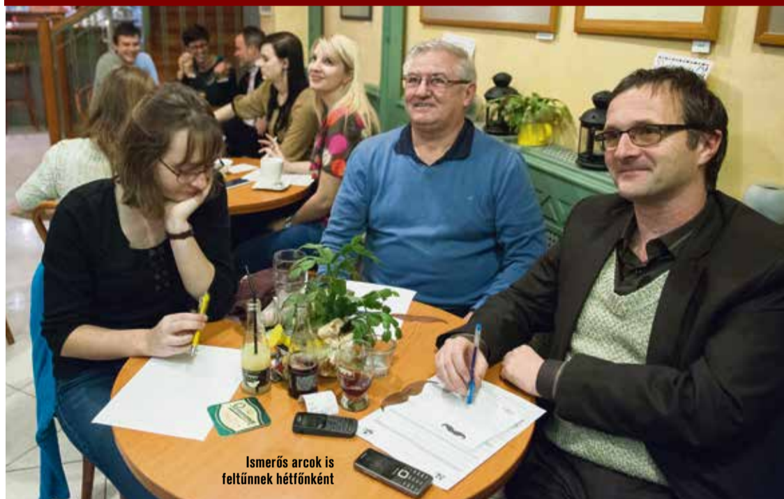
Ismerős arcok is feltűnnek hétfőnként

– A központi kérdéseken felül milyen elemek vannak?