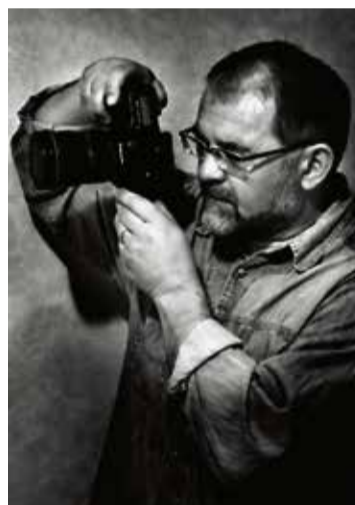
Az új szenvedély: fotózás közben

nyien jóval idősebbek voltak nálam, nyugdíjba mentek, én azonban egy érdekes szituációba kerültem. 2010 januárjában nem volt fix állásom, és ajánlatot sem akart igazán tenni senki sem. Nem kellett sokat töprengnem ahhoz, hogy tudjam, egyetlen út áll előttem: önálló vállalkozást kell indítanom, ahol az addig szerzett tapasztalataimat, tudásomat tanácsadóként kamatoztathatom.