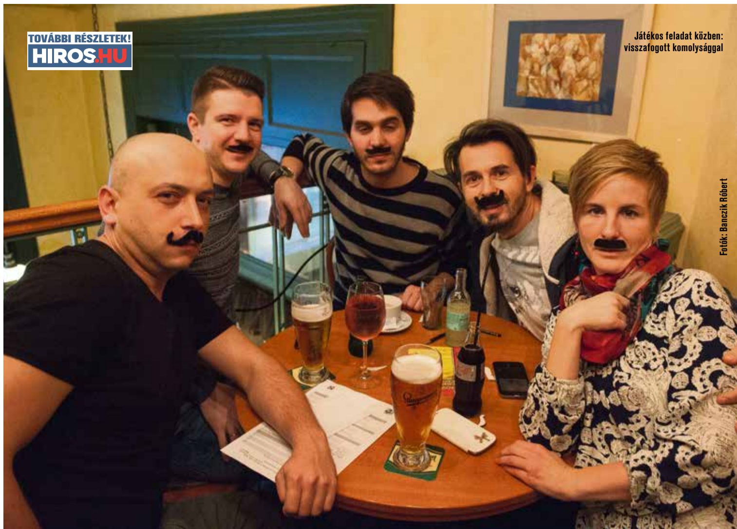
Játékos feladat közben: visszafogott komolysággal

– Már az indulás évének decemberében 6-7 csapatra bővült az induló három. Azóta 9 vagy 10 regisztrált csapat van, átlagban 7 szokott jelen lenni. Csapatonként eddig öt fő volt a limit, most hatra emelkedett. Ez persze nem jelenti azt, hogy minden csapatban ennyi embernek kell lennie: nyertek már csapatok úgy is, hogy csak 2-3 fő jött össze az adott este.