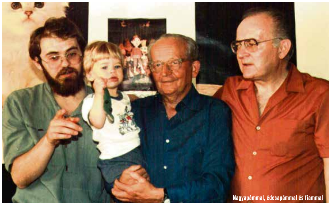
Nagyapámmal, édesapámmal és fiammal