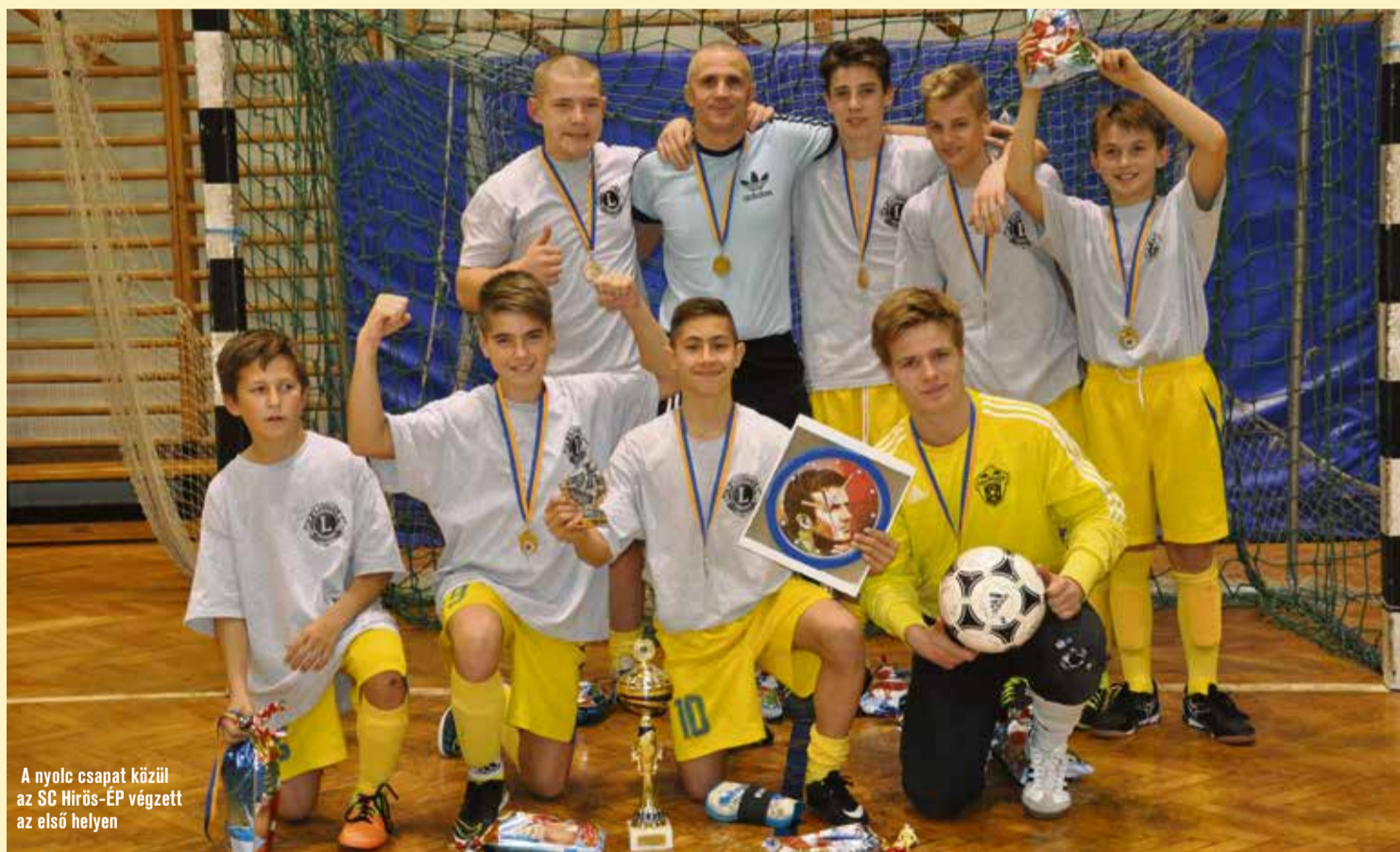
A nyolc csapat közül az SC Hirös-ÉP végzett az első helyen

A kecskeméti Szent László Lions Klub november 29-én tizennyolcadik alkalommal rendezte meg az SOS Lions Nemzetközi Gyermekek Teremlabdarúgó Tornát. A versenyt ezúttal is a 11-13 év közötti gyerekek részére hirdették meg. A nyolc csapat közül az SC Hirös-ÉP végzett az első helyen, második lett a kőszegi együttes, a harmadik helyet pedig az oromhegyesiek szerezték meg.