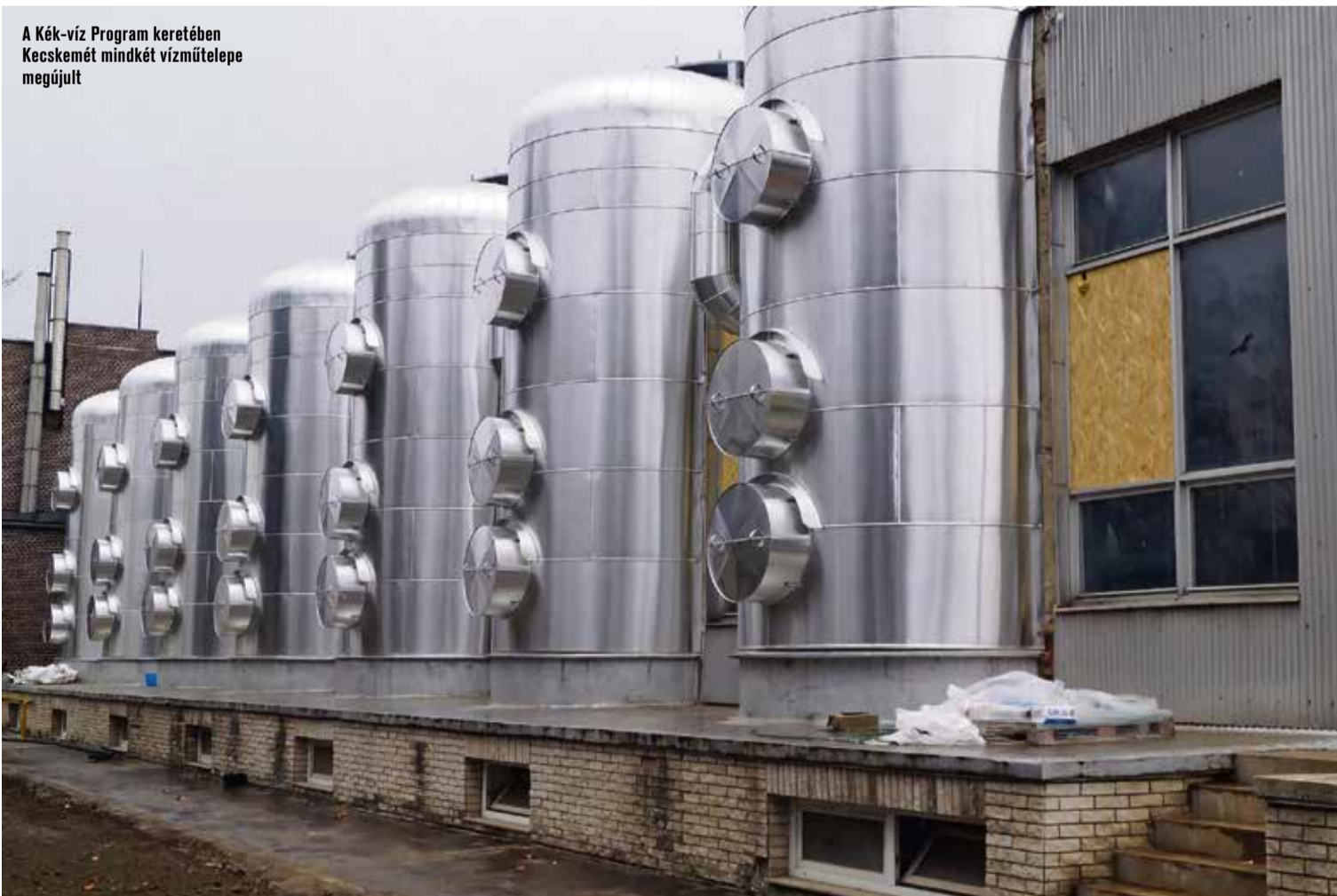
A Kék-víz Program keretében Kecskemét mindkét vízműtelepe megújult

– Az eddig elmondottak mellett sikerült a ceglédi üzemmemórség integrációját is végrehajtani. Ez jelenti egyrészt az ottani üzemeltetési folyamatok átvételét, a munkatársak integrálását a szervezeti kultúrába, és más szervezeti egységekkel való kapcsolata-