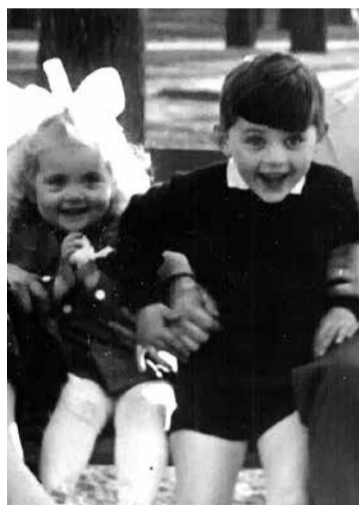
Gyermekkori kép húgammal