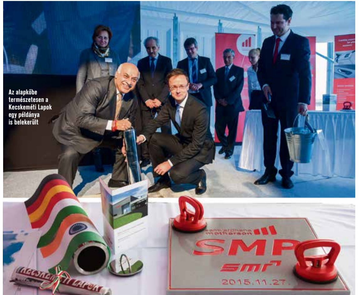
Az alapköve természetesen a Kecskeméti Lapok egy példányára is belekerült