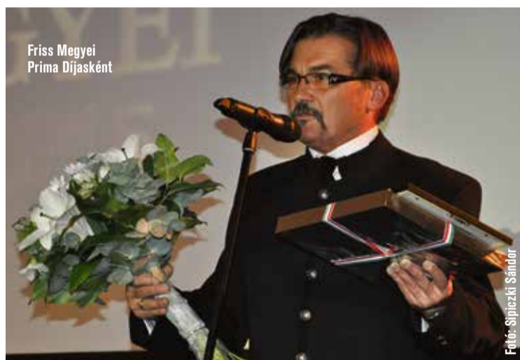
Friss Megyei Prima Díjasként