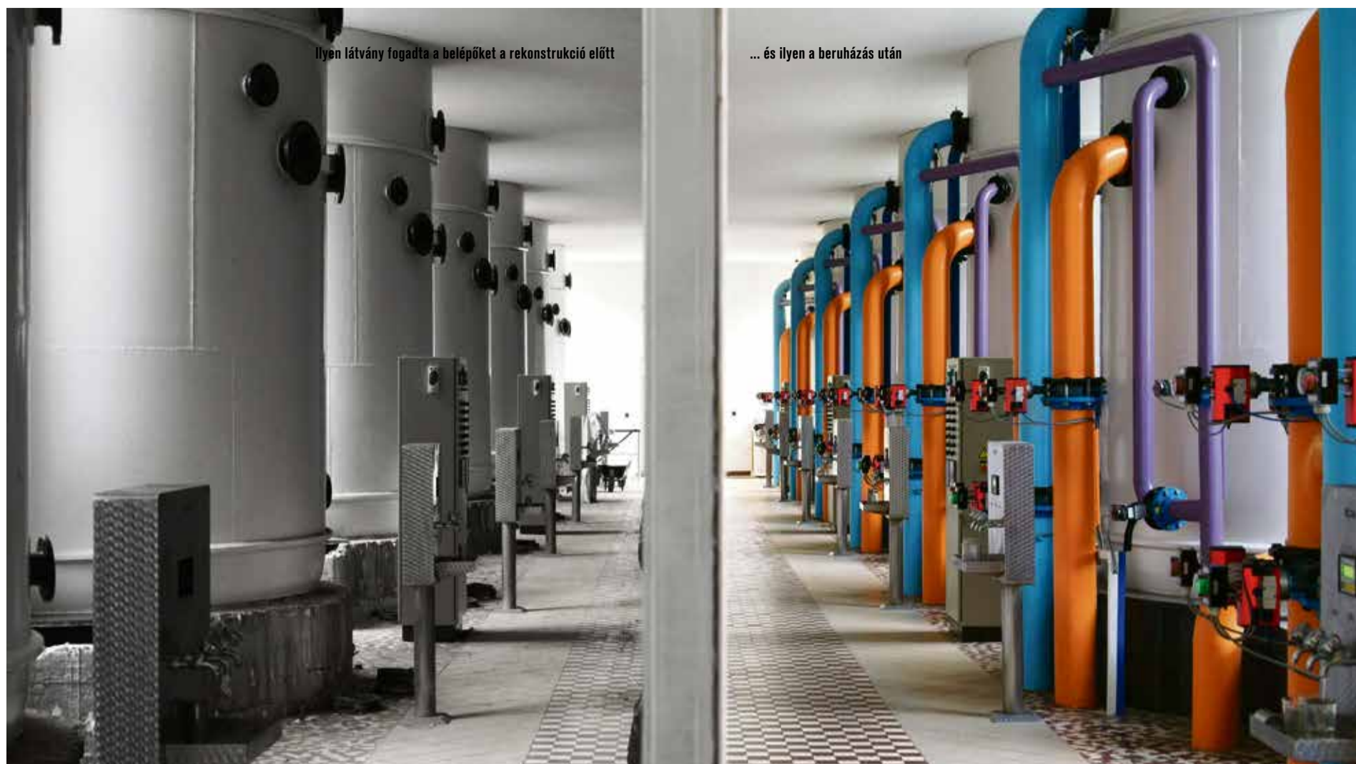
Ilyen látvány fogadta a belépőket a rekonstrukció előtt