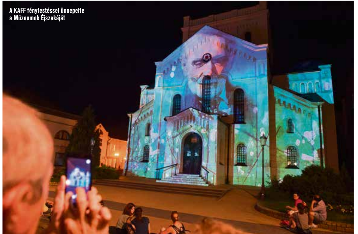
A KAFF fényfestéssel ünnepelte a Múzeumok Éjszakáját