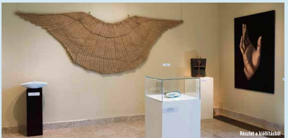
Részlet a kiállításból

A gyűjteményalapító szakember elmondta, 2000-ben úgy döntött, hogy elindít egy olyan kiállítás-sorozatot, amely a kortárs magyar képző- és iparművészetben belül a keresztény tematikát részesíti előnyben. Olyan – egyre inkább mellőzött – területek művelésére adva ezzel esélyt és lehetőséget, mint a keresztény-, vallásos-, szakrális-, egyházi- és liturgikus művészet. A Kortárs Keresztény Ikonográfiai Biennálé első nyolc alkalma során összesen 980 alkotást állítottak ki a mindenkori zsűri után a Cifrapalotában, ami jól mutatja, hogy mennyire hiányzott egy ilyen sorozat a magyarországi