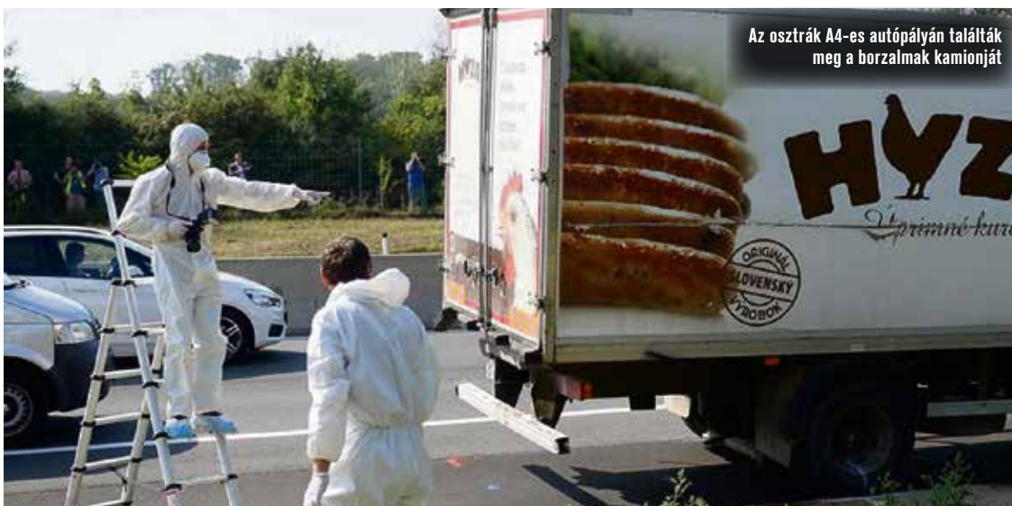
Az osztrák A4-es autópályán találták meg a borzalmas kamionját

A korábbi tájékoztatás szerint a vádirat 88 oldal, az ügyben 284 tanú és 15 szakértő szerepel. Pastu, bolgár, arab, német és szerb nyelvű tolmácsra lesz szükség a bírósági eljárásban. Ez jelentősen növelheti az eljárás időtartamát, melynek becsült költsége meghaladhatja a 100 millió forintot. Ez magába foglalja a tolmácsolás, szakértői és védői díjakat, tanú költségeket. A tárgyalásra a Kecskeméti Törvényszék dísztermében folyik, tolmácsfülkék, rendkívüli biztonsági intézkedések igénybevétele és jelentős nemzetközi sajtóérdeklődés mellett.