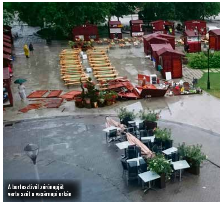
A borfesztivál zárónapját verte szét a vasárnapi orkán