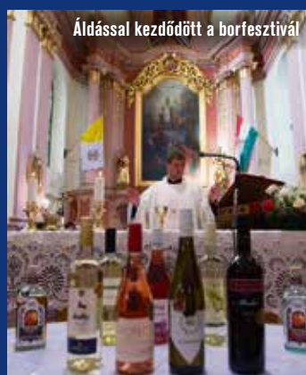
Áldással kezdődött a borfesztivál