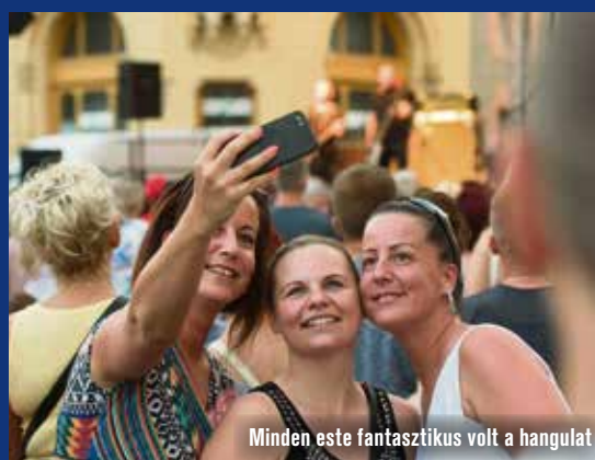
Minden este fantasztikus volt a hangulat