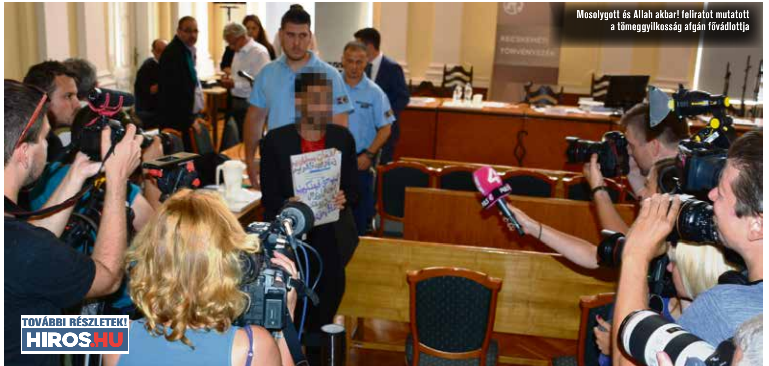
Mosolygott és Allah akbar! feliratot mutatott a tömeggyilkosság afgán fővádlottja