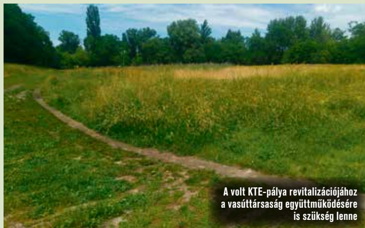
A volt KTE-pálya revitalizációjához a vasúttársaság együttműködésére is szükség lenne

A legkritikusabb pont a Szolnoki úti aluljáró: nyáron ázik, télen lefagy. A MÁV forgalombiztonsági okok miatt vet el minden elképzelést, ami az érin-