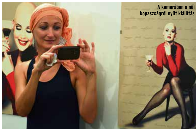
A kamarában a női kopaszságról nyílt kiállítás

betegség következtében. A KaTARzis kiállítás alkalmi modelljei – akik a Magyar Alopecia Areata Közösség nevű önszegítő csoport tagjai – azzal a céllal vállalták a fotózást, hogy a képek hatására az emberek másképp tekintsenek a női kopaszságra. A kiállítás megtekinthető július 21-ig a Bács-Kiskun Megyei Kereskedelmi és Iparkamarában.