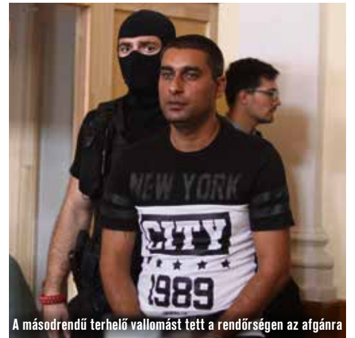
A másodrendű terhelő vallomást tett a rendőrségen az afgánra

A másfél éves nyomozás alatt 52 ezer oldal nyomozati irat keletkezett, a nyomozóhatóságok 16 gépjárművet foglaltak le, 1500 óra kamera felvételt elemeztek ki és számos szakértői véleményt kértek be. A magyar ügyészség képviselői korábban rendkívül sikeres nemzetközi együttműködésről is beszámoltak, úgy a rendőrségi, mint ügyészségi szinten kiváló volt a kapcsolat a német, osztrák, bolgár és