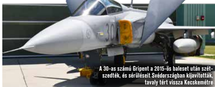
A 30-as számú Gripen a 2015-ös baleset után szét-szedték, és sérüléseit Svédországban kijavították, tavaly tért vissza Kecskemétre