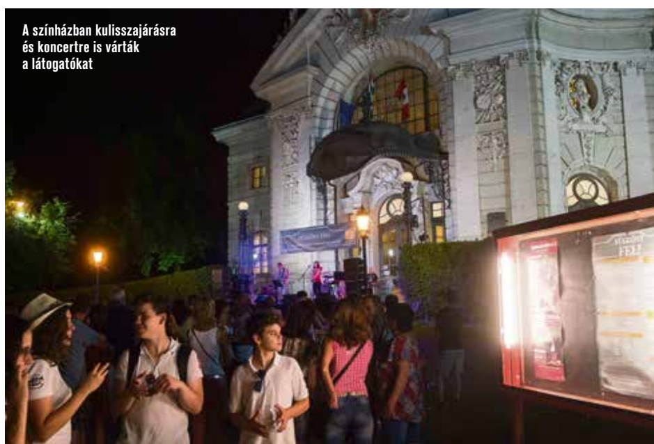
A színházban kulisszajárásra és koncertre is várták a látogatókat