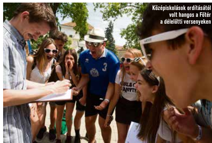
Középiskolások ordításától volt hangos a Főtér a délelőtti versenyeken