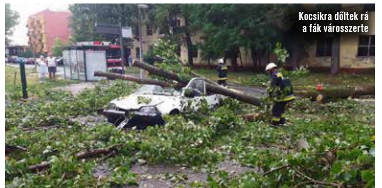
Kocsikra dőltek rá a fák városszerte