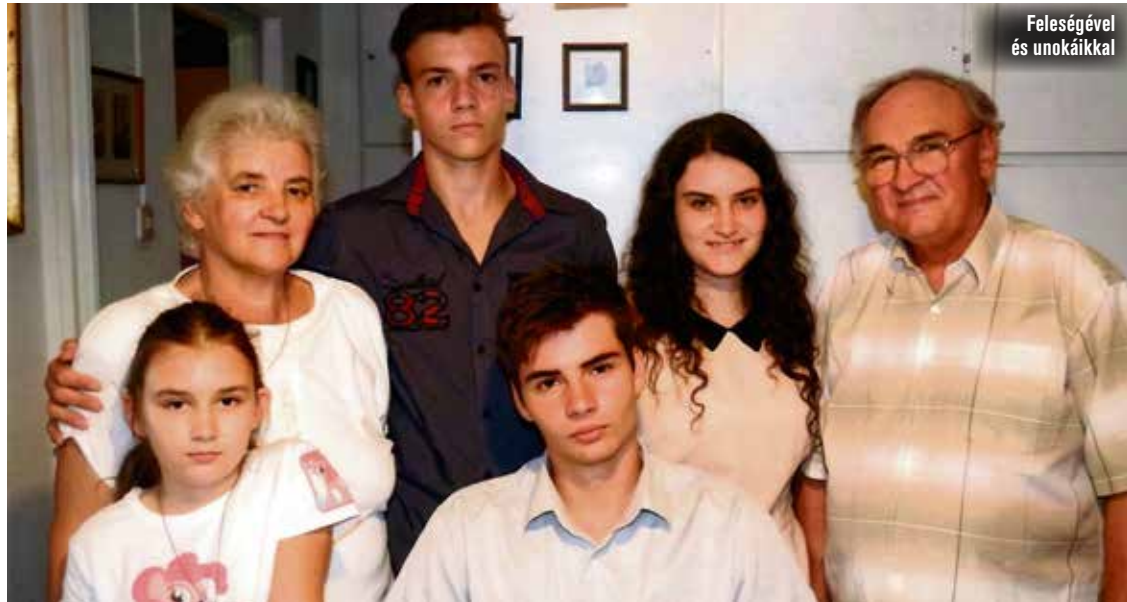
Feleségével és unokáikkal