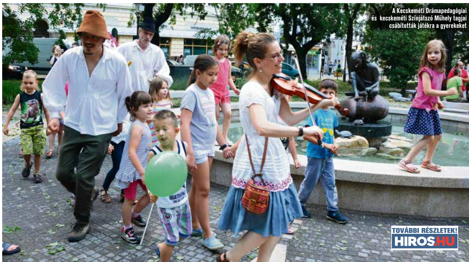
A Kecskeméti Drámapedagógiai és Kecskeméti Színjátszó Műhely tagjai csábították játéka a gyerekeket

A játékvezetők a Kecskeméti Drámapedagógiai és a Kecskeméti Színjátszó Műhely tagjai voltak, a prog-