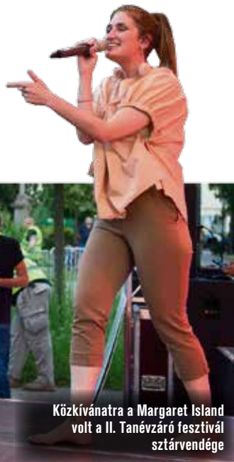
Középvárosra a Margaret Island volt a II. Tanévváró fesztivál sztárvendége

– Természetesen kiértékeljük a rendezvény tapasztalatait és igyekszünk a következő alkalomra a hibákat orvosolni. Azt szeretnénk elérni, hogy minél több középiskola csatlakozzon ehhez a rendezvényhez. Ezáltal városi rangra emelkedne a tanév búcsúztatása – mondta a Kecskeméti Lapoknak a képviselő.