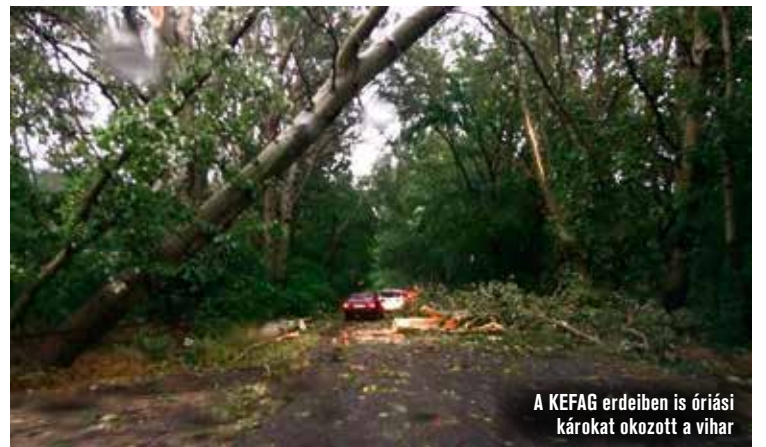
A KEFAG erdeiben is óriási károkat okozott a vihar