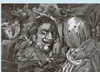
Orosz István: Dalí és a Szent család, 1988