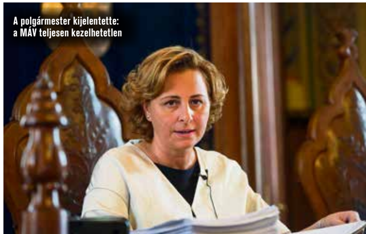
A polgármester kijelentette: a MÁV teljesen kezelhetetlen

Hulladékgyazdálkodási társulás létrehozásáról, a helyi közösségi közlekedés menetrendjének módosításáról, új pályázatokról döntött egyebek között Kecskemét közgyűlése.