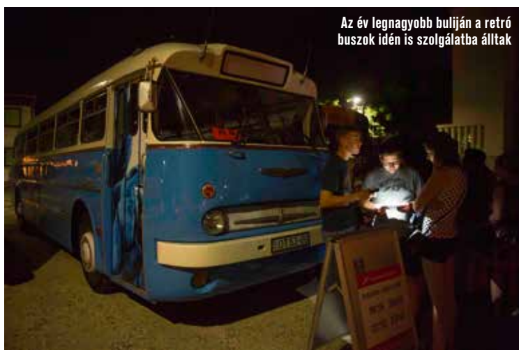
Az év legnagyobb buliján a retró buszok idén is szolgálatba álltak