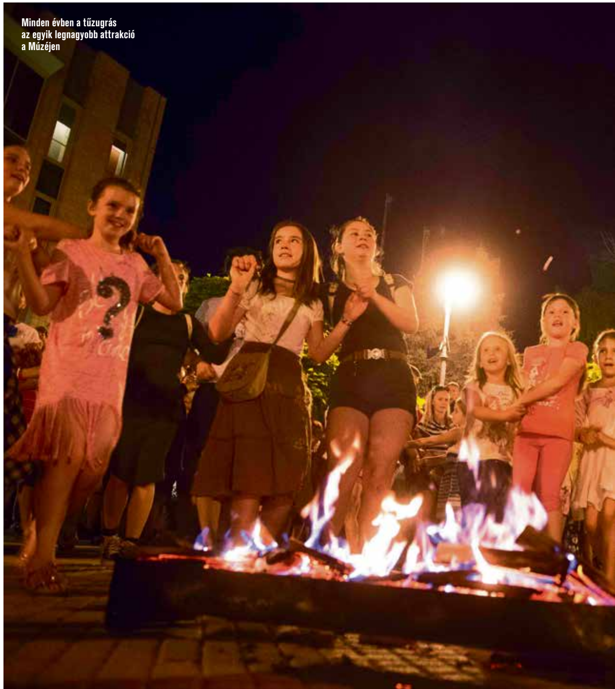
Minden évben a tűzgrás az egyik legnagyobb attrakció a Múzejen

A főtéren a legbátrabbak tüzet ugorhattak a Kecskemét Táncegyüttes tag-