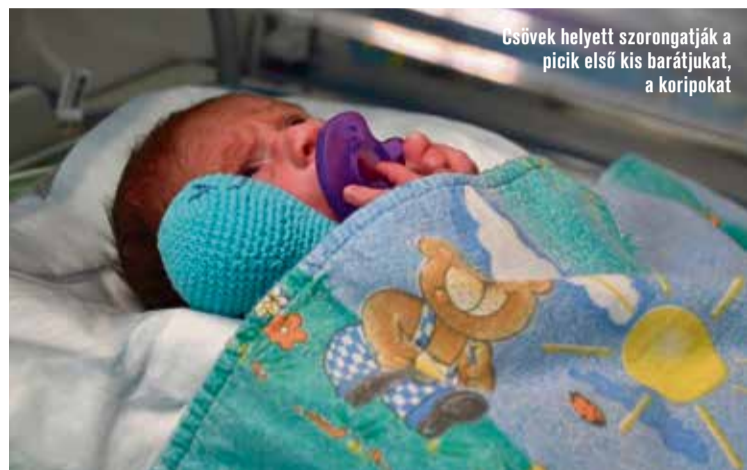
Csövek helyett szorongatják a picik első kis barátjukat, a koripokat

Az ötlet Dániából ered. Ott egy csapat önkéntes koraszülött babák számára kis polipokat kezdett el horgolni. A polipkák karjai mellett, hogy az