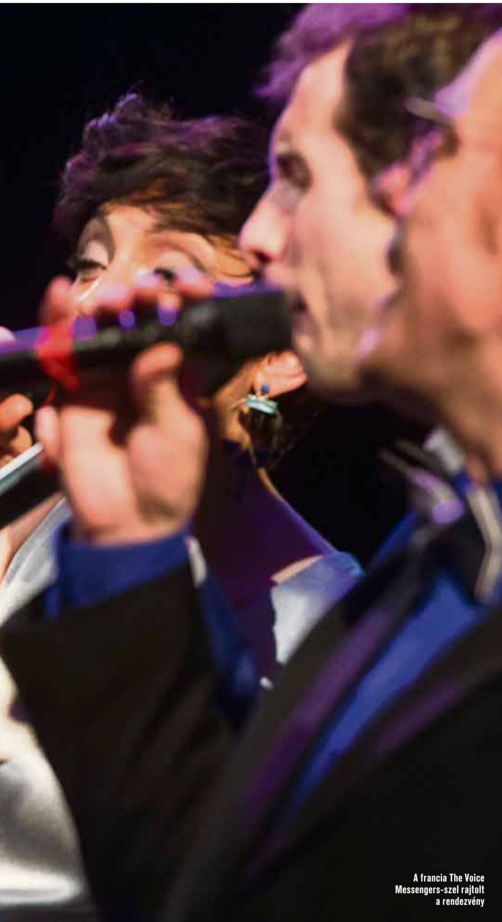
A francia The Voice Messengers-szel rajtolt a rendezvény