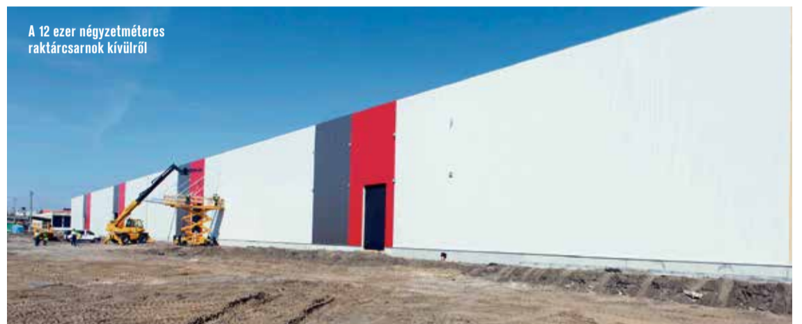
A 12 ezer négyzetméteres raktárcsarnok kívülről