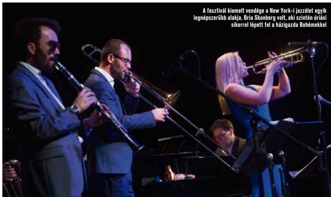
A fesztivál kiemelt vendége a New York-i jazzélet egyik legnépszerűbb alakja, Bria Skonberg volt, aki szintén óriási sikerrel lépett fel a házigazda Bohémekkel

Az ünnep keretében a fellépők többek között a 100 éve született Ella Fitzgerald-ra is emlékeztek, vasárnap pedig fergeteges örömmel zárult a fesztivál.