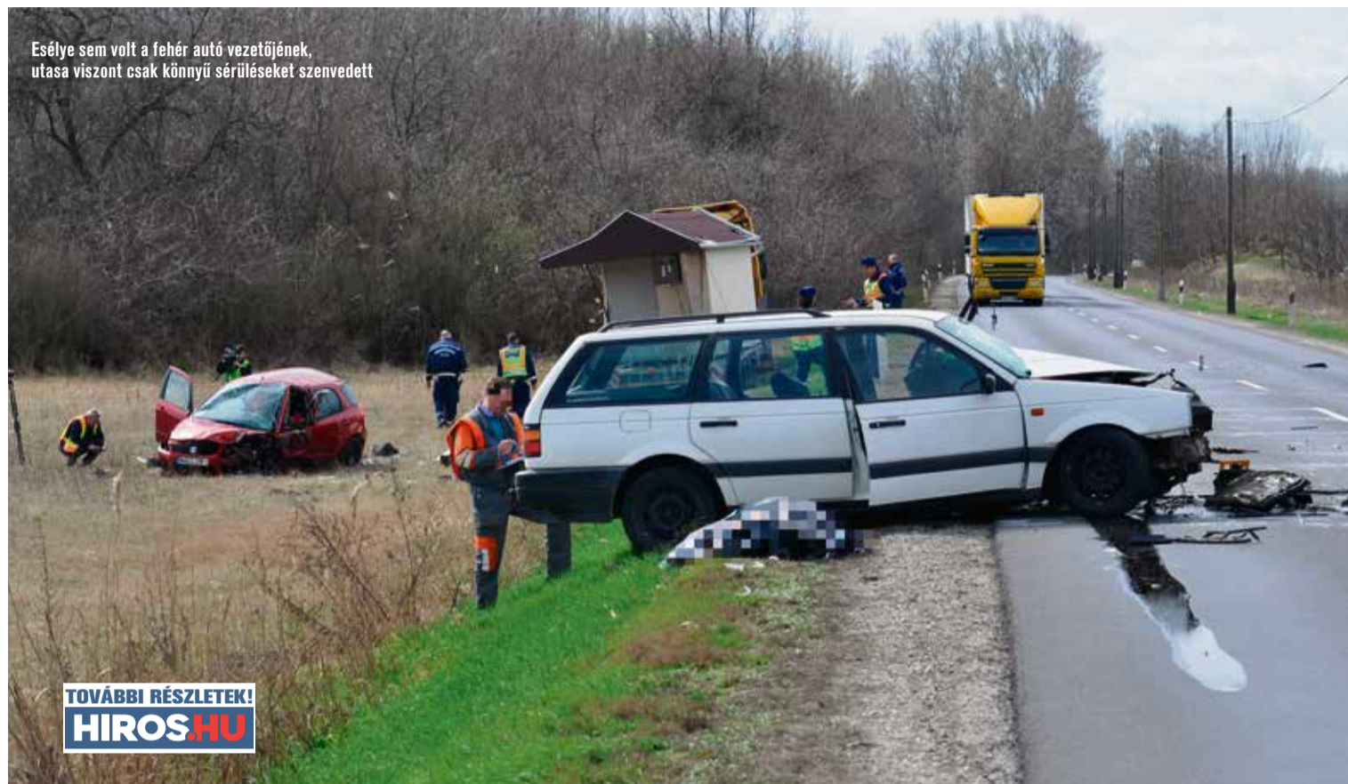
Esélye sem volt a fehér autó vezetőjének, utasa viszont csak könnyű sérüléseket szenvedett