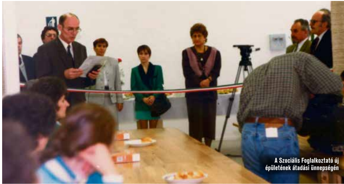
A Szociális Foglalkoztató új épületének átadási ünnepségén