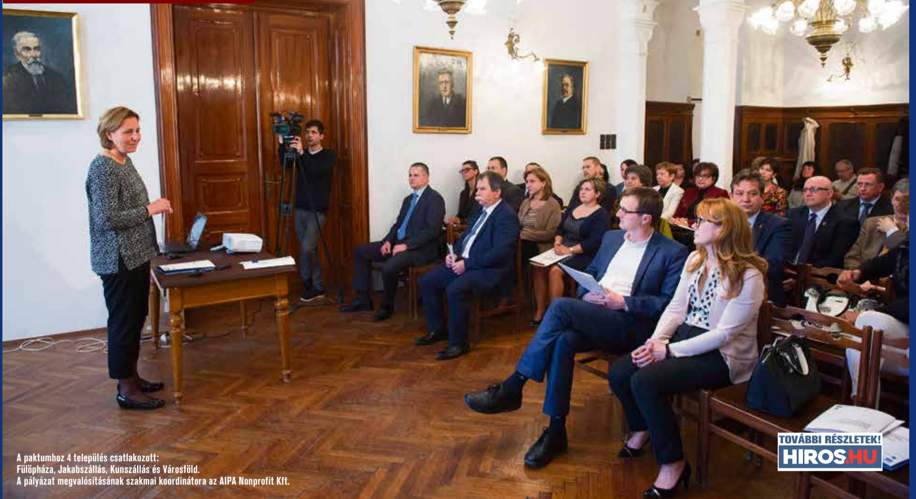
A paktumhoz 4 település csatlakozott: Fülöpháza, Jakabszállás, Kunszállás és Városföld. A pályázat megvalósításának szakmai koordinátora az AIPA Nonprofit Kft.