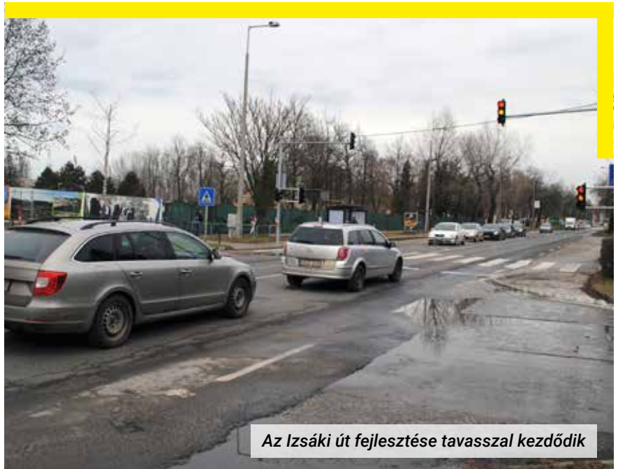
Az Izsáki út fejlesztése tavasszal kezdődik