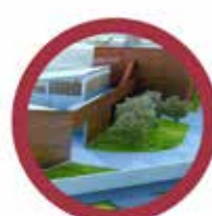
Faapríték alapú hőtermelés