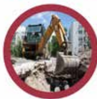
Korszerű távvezeték építése