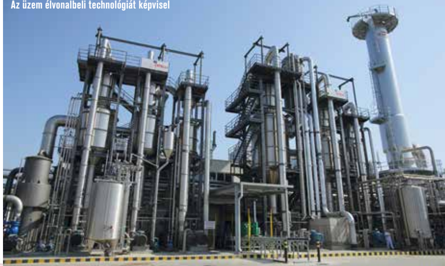
Az üzem élvonalbeli technológiáját képvisel

Univer Product Zrt.: Az 1948-ban alapított, kecskeméti székhelyű, 100%-ban magyar tulajdonban lévő Univer Product Zrt. Magyarország egyik meghatározó élelmiszer-ipari vállalata. A cég a 2016-os évet közel 21,5 milliárd forintos rekord nettó árbevétellel zárta, a 2017-re tervezett árbevétele eléri a 22,6 milliárd forintot. A vállalat alkalmazottainak száma meghaladja a 660 főt. Az Univer termékei a következő termékcsoporthoz sorolhatók: nedves ételízesítők (majonéz, mustár, ketchup, salátaöntetek és asztali szószok), magyaros ételízesítők (a 2016-ban a Hungarikumok Gyűjteményébe felvett Piros Arany és Erős Pista, valamint Haragos Pista, Gulyáskrém és hagymakrémek), sűrített paradicsom, bébiételek, lekvárok, zöldségkrémek, gyümölcs italok, sütőipari és gasztronómiai termékek. Az Univer a majonéz, mustár és magyaros ételízesítő termékkategóriákban tartósan piacvezető. Az Univer Product Zrt. a 2018-ban fennállásának 70. évfordulóját ünneplő Univer-csoport tagja. A holding érdekeltségi körébe tartozik továbbá a kereskedelmi egységeket tömörítő Univer Coop Zrt. és a régió egyik nagy múltú bevásárlóközpontja, a kecskeméti Alföld Áruház. Az Univer közvetlen célja a magyar termékek és ezáltal a magyar munkaerő elismertségének és tekintélyének növelése. Így tevékenységükkel mindent megtesznek a magyar gazdaság fellendítése és az új munkahelyek teremtése érdekében. További információk a www.univer.hu honlapon, valamint a www.facebook.com/univeretlizesito oldalon.