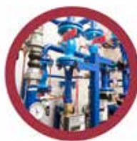
Felhasználói hőközpontok kialakítása