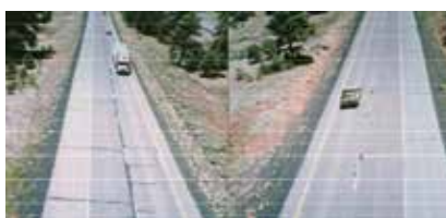
Normál bitumennel épített út