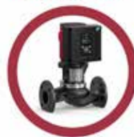
Fűtőművek modernizálása II.

nincs lehetőség. Ezzel szemben a fogyasztói hőközpontnál – amelyek a társasházak földszinti közös helyiségeiben vannak – akár arra is adtak a feltételek, hogy 1-2 társasház, az ott élők közös elhatározásának megfelelően, egyedileg dönthet például arról, hogy mikor szeretnék beindítani a fűtést, és milyen fűtési alapértékeket határozzanak meg. Ez a komfortérzetre és természetesen a költségekre is pozitív hatással lesz.