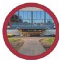
Új fogyasztók távhőre csatlakozása

– A fejlesztési pályázat eredményeképpen lehetőség nyílik új fogyasztók távhőellátásba való bekapcsolására a megyeszékhely négy fő területén, emellett szivattyúcserekkel, új vezetékek építésével, valamint a fogyasztói hőközpontok számának bővítésével korszerűsítjük a TERMOSTAR Kft. jelenlegi rendszerét. Ahol már működik ilyen hőközpont, ott egyértelmű tapasztalat, hogy a szolgáltatás rugalmasabbá vált. Miért? A szolgáltatói hőközpontokhoz akár 10-12 társasház is tartozhat. Vannak köztük fűtés korszerűsített, hőszigetelt társasházak, de akadnak olyanok is, amelyeknél ezek a munkák még nem történtek meg. Természetes, hogy egy jól szigetelt háznak egészen más a hőigénye, mint egy olyan épületé, ahol nincs korszerű szigetelés. A szolgáltatói hőközpont esetében ezeknek a különbségeknek a figyelembe vételére