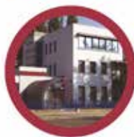
Fűtőművek modernizálása I.