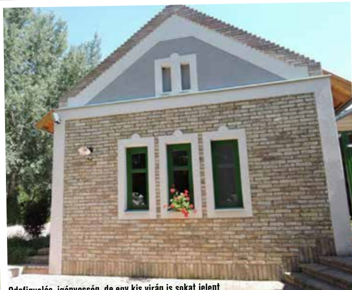
Odafigyelés, igényesség, de egy kis virág is sokat jelent

szállt rá a gazdaság újjáépítésének feladata, s az abszolút nulláról, a semmiből indulva, földeket visszaszerezve sikerült neki tizenkilenc év alatt felépíteni azt, amit a nagyapjától elvettek. Elmondta azonban azt is, hogy a kezdetek kezdetén még eszébe sem jutott, hogy egyszer ilyen eredményeket érhet el a birtokával. Amikor belefog az ember egy ilyen feladatba, még nem a díj lebeg a szeme előtt. Minden nap felkelt, csinálta a dolgát, s csak hosszas idő után arathatta le munkája gyümölcsét. Persze ilyenkor már sokan csak a csillogást látják, de aki valójában ismeri őt, az tudhatja, hogy mennyi energiát és időt fektetett bele a terület rendezésébe. Számára gyakorla-