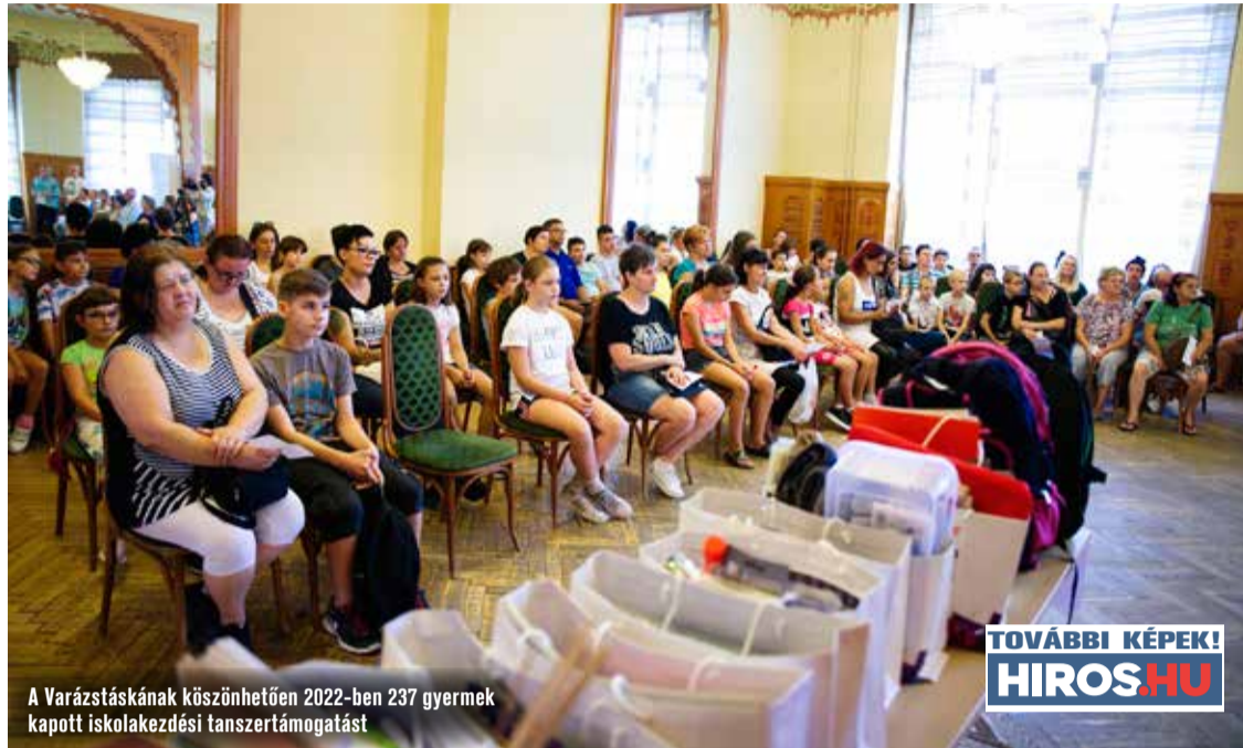
A Varázstáskának köszönhetően 2022-ben 237 gyermek kapott iskolakezdési tanszertámogatást