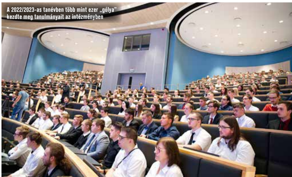
A 2022/2023-as tanévben több mint ezer „golya” kezdte meg tanulmányait az intézményben