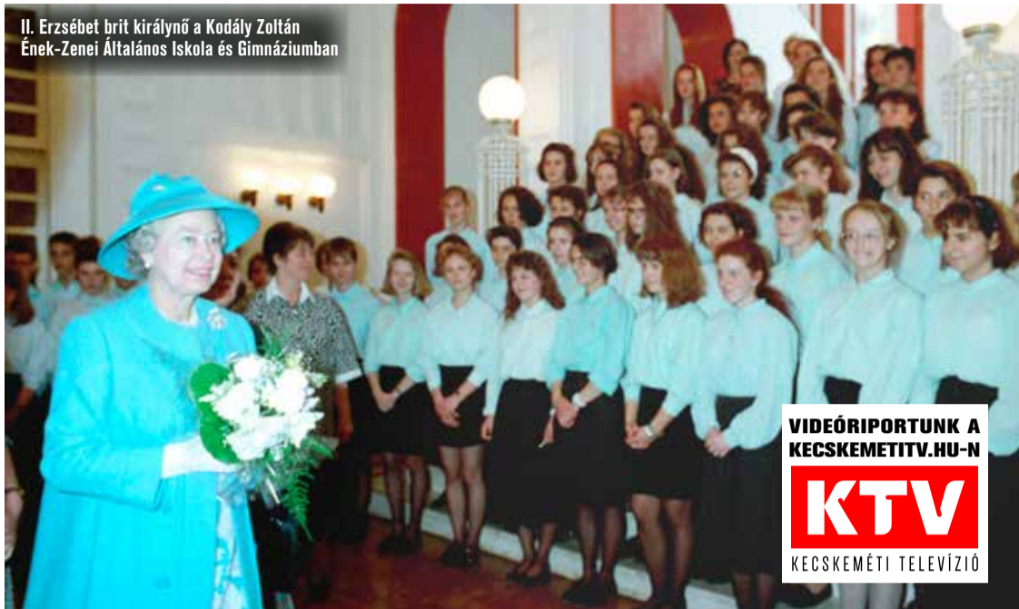
II. Erzsébet brit királynő a Kodály Zoltán Ének-Zenei Általános Iskola és Gimnáziumban

VIDEÓRIPORTUNK A KECSKEMETITV.HU-N KTV KECSKEMÉTI TELEVÍZIÓ