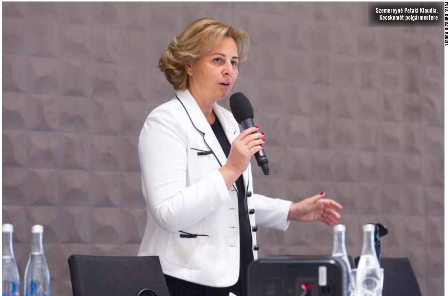
Szemereyné Pataki Klaudia, Kecskemét polgármestere