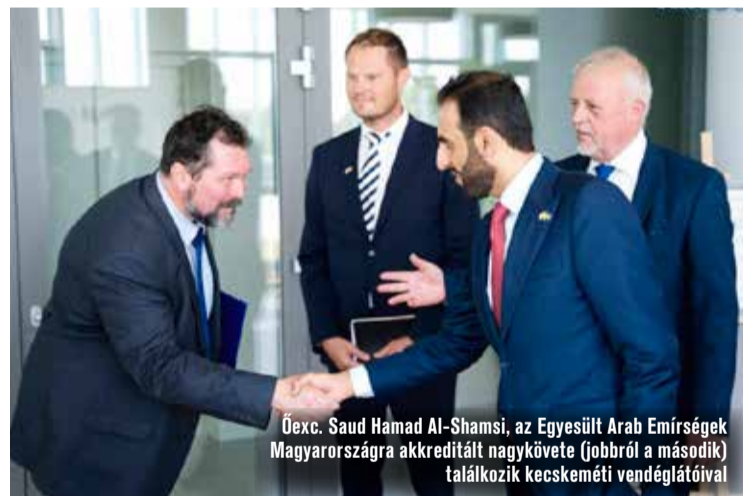
Öexc. Saud Hamad Al-Shamsi, az Egyesült Arab Emírségek Magyarországra akkreditált nagykövete (jobbról a második) találkozik kecskeméti vendéglátóival

Az egyetem vezetői bemutatták az intézményt és a folyamatban lévő kutatásokat, majd a felek a jövőbeli együttműködés lehetőségeiről egyeztettek. A megbeszélést követően a delegáció megtekintette a Campus Oktatási épületet.