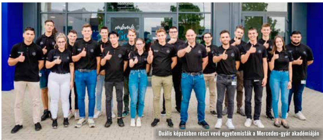
Duális képzésben részt vevő egyetemisták a Mercedes-gyár akadémiáján