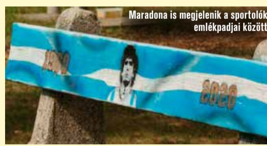
Maradona is megjelenik a sportolók emlékpadjai között

Puskás Ferencnek, Diego Maradonának, híres kosarasoknak és bokszolóknak állítanak emléket a Herman Ottó tér megújult padjai Hunyadivárosban. Civil kezdeményezés alapján a településrész tanácsadó testületének finanszírozásával és támogatásával válhatott a park sokkal színesebbé.