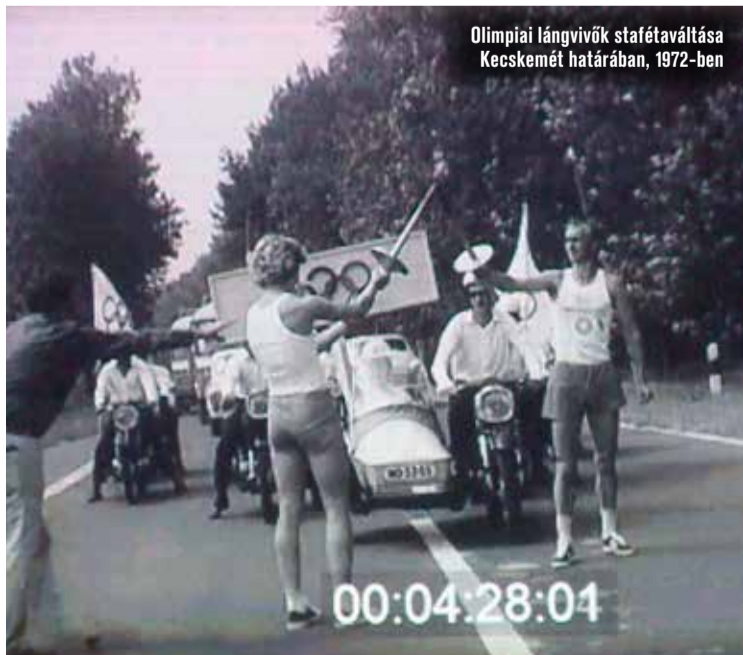
Olimpiai lángvívők stafétaváltása Kecskemét határában, 1972-ben

Az olimpiai fáklya egy évig látható lesz a kosárlabda akadémia bejáratánál, „hogy az oda járó fiatalok kelendő módon szembesüljenek a múlttal és azzal, amit ez a fáklya jelképez: a barátsággal és a békével, az olimpiai szellemiség két legfontosabb eszméjével” – fogalmazott dr. Bodóczy László.