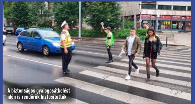
A biztonságos gyalogosátelést idén is rendőrök biztosították

A főigazgató kiemelte, hogy mind a pedagógusok, mind pedig a diákok örülnek annak, hogy újra együtt lehetnek.