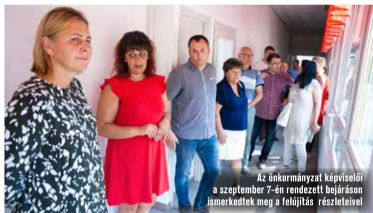
Az önkormányzat képviselői a szeptember 7-én rendezett bejáráson ismerkedtek meg a felújítás részleteivel

Az Izsáki út szélesítése érdekében végzett munkálatok és forgalomkorlátozások miatt a Gábor Dénes utca forgalma az utóbbi időben jelentősen megnövekedett. Ezért volt szükséges az utca karbantartása – közölte korábban az önkormányzat. A kátyúzással és az azt követő aszfaltréteggel újra sima útfelületen haladhatnak az autósok Homokbánya városrész, Kadafalva és Ballószög felé. Az útburkolati jeleket később festi majd fel egy másik cég, és egyelőre a sebességkorlátozó táblák is kint maradnak.