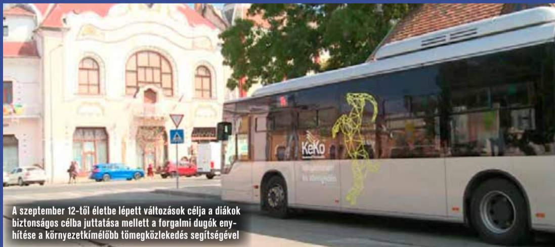
A szeptember 12-től életbe lépett változások célja a diákok biztonságos célba juttatása mellett a forgalmi dugók enyhítése a környezetkímélőbb tömegközlekedés segítségével

Mint megtudtuk, a cél az volt, hogy a gyerekek akár biztonságban utazva, egyedül is eljussanak az iskolákba, úgy, hogy ráadásul a környezettudatos közlekedési formákat használják. Ezzel párhuzamosan kevesebb autó közlekedik majd a forgalmas időszakokban az iskoláknál, így a tumultus is kisebb lehet.