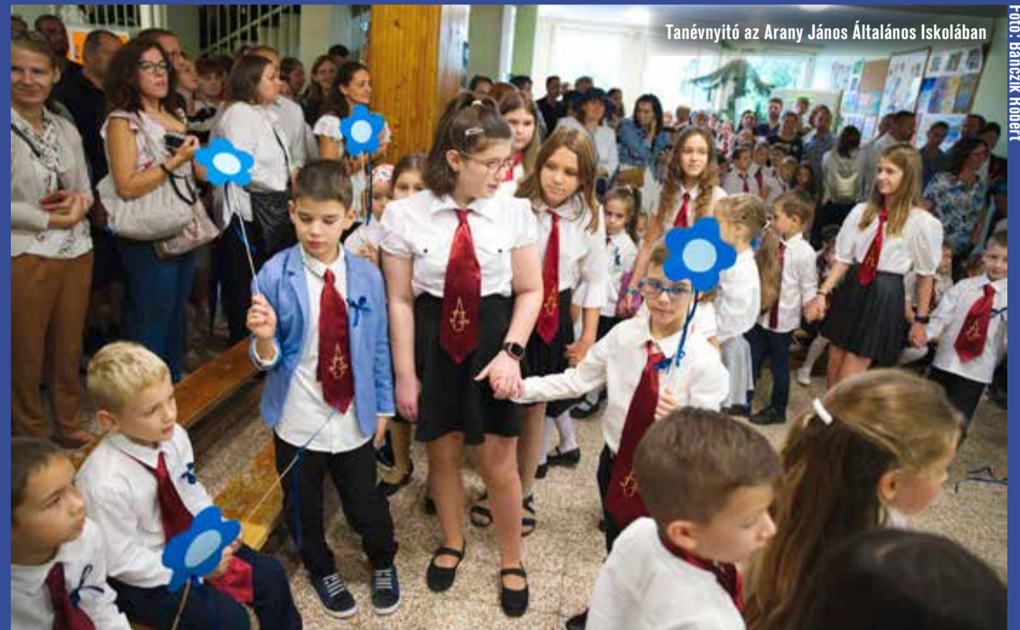
Tanévnyitó az Arany János Általános Iskolában