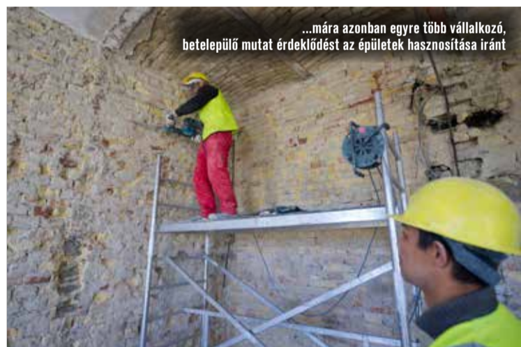
...mára azonban egyre több vállalkozó, betelepülő mutat érdeklődést az épületek hasznosítása iránt