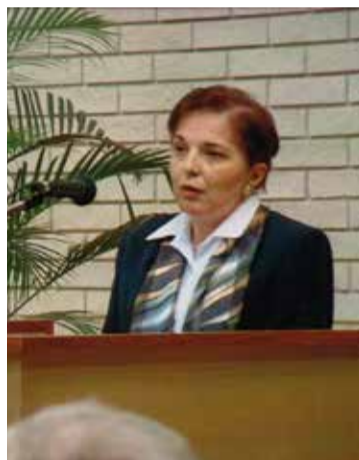
A megyei könyvtárban rendezett levéltári konferencia előadójaként