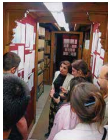
Diákokkal a megyei levéltár kecskeméti részlegében

ket én választok, amelyek kedvesek számomra.