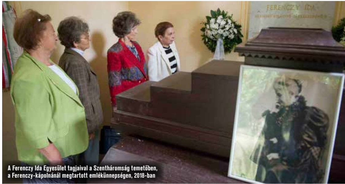
A Ferenczy Ida Egyesület tagjaival a Szentháromság temetőben, a Ferenczy-kápolnánál megtartott emlékkünnepségen, 2018-ban