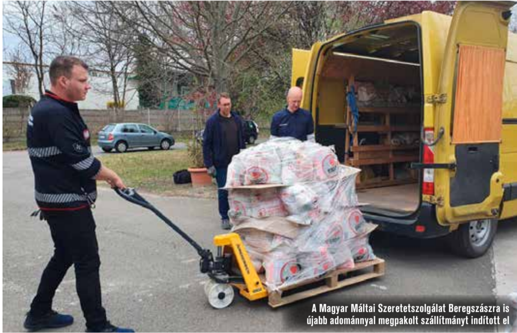
A Magyar Máltai Szeretetszolgálat Beregszászra is újabb adománnyal megpakolt szállítmányt indított el

nak élni, így számukra egyéb adományt, háztartási berendezéseket is küldtek.