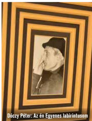
Dóczy Péter: Az én Egyenes labirintusom