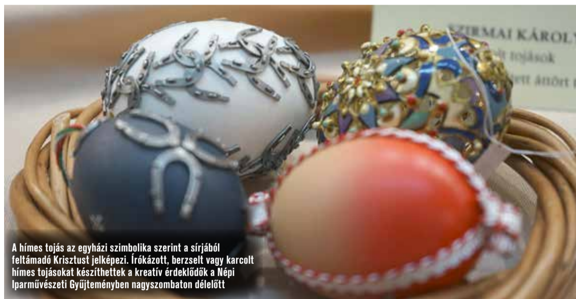
A hímes tojás az egyházi szimbolika szerint a sírjából feltámadó Krisztust jelképezi. Írókázott, berzselte vagy karcolt hímes tojásokat készíthettek a kreatív érdeklődők a Népi Iparművészeti Gyűjteményben nagyszombaton délelőtt