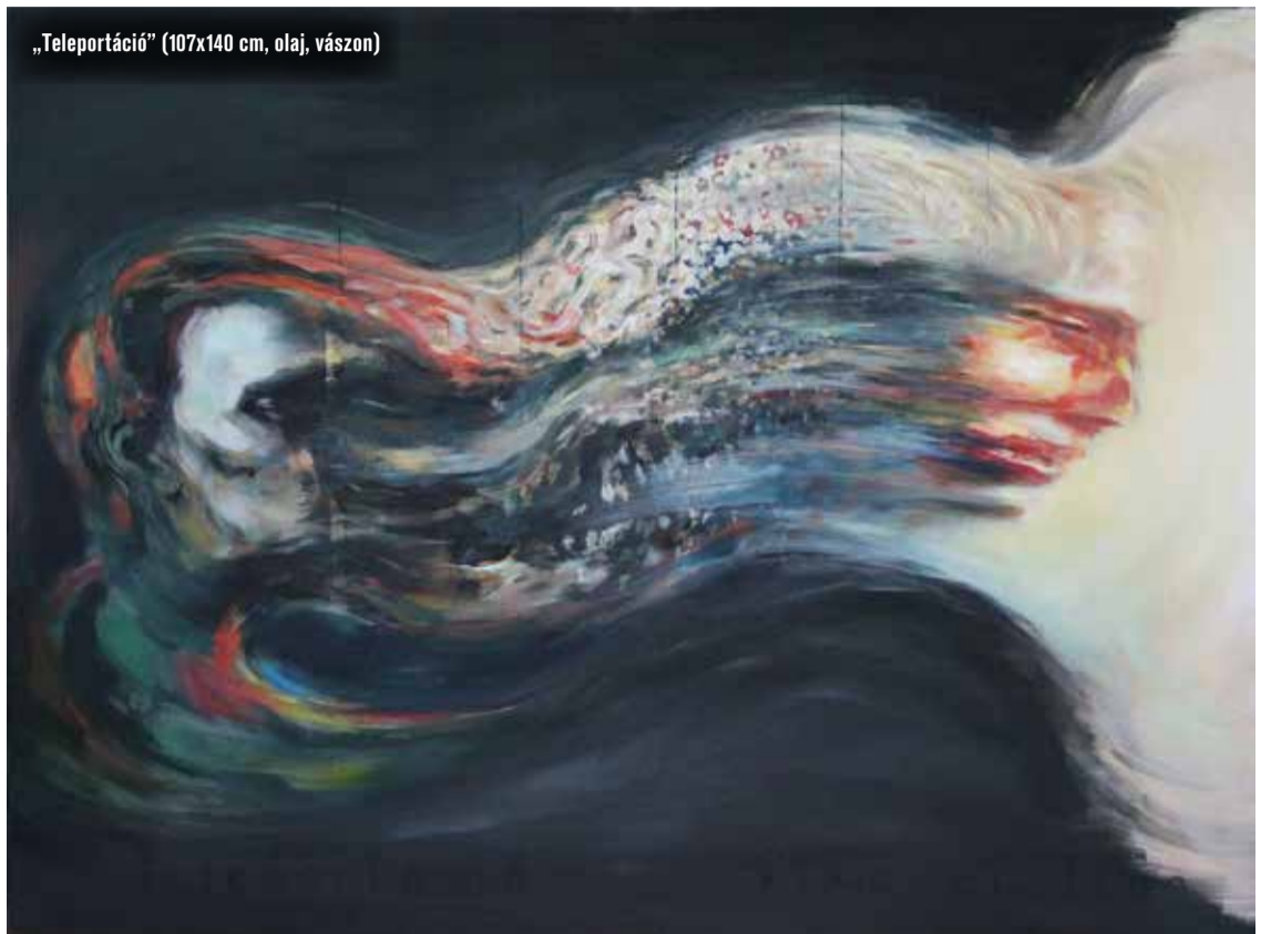
„Teleportáció” (107x140 cm, olaj, vászon)