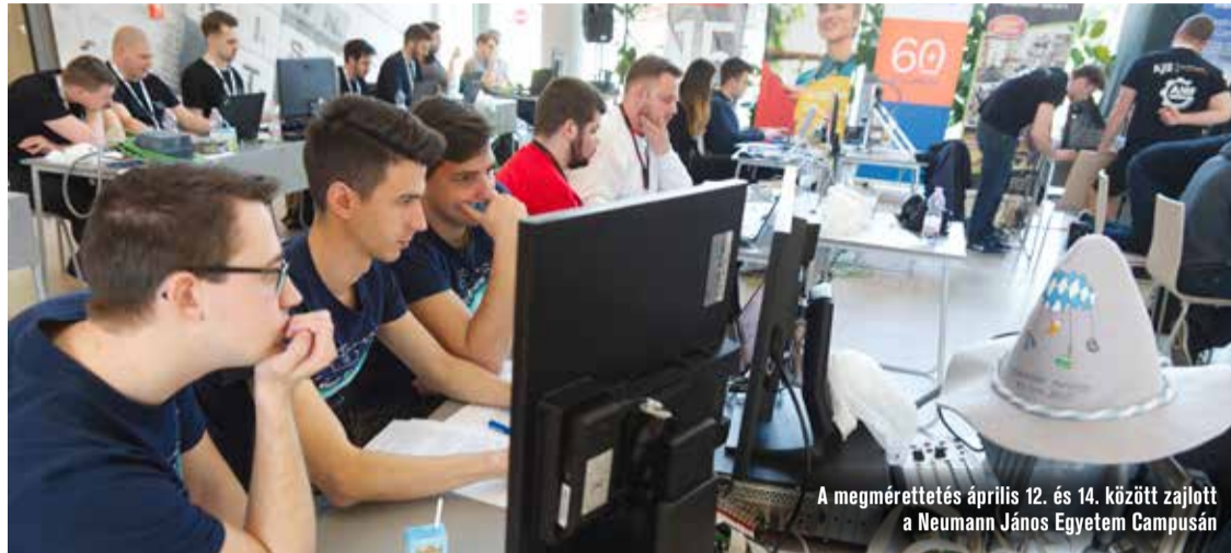
A megmérettetés április 12. és 14. között zajlott a Neumann János Egyetem Campusán