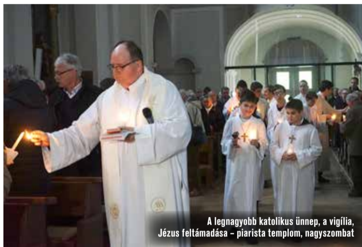
A legnagyobb katolikus ünnep, a vigília, Jézus feltámadása – piarista templom, nagyszombat

be ünnepélyesen a templomba. Ezt követően eléneklik a húsvéti örömeiket, keresztvizet szentelnek és megújítják keresztvási fogadalmukat a hívők, amit szentmise és feltámadási körmenet követ.