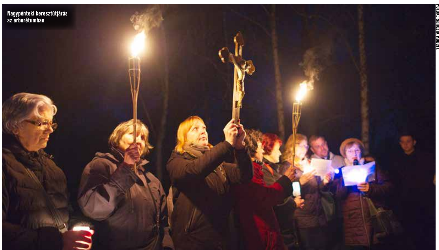
Nagypénteki keresztútjárás az arborétumban

A húsvéti vigília a tűzszenteléssel kezdődik, így történt ez a kecskeméti katolikus templomokban is. Ekkor áldják meg a húsvéti gyertyát és viszik