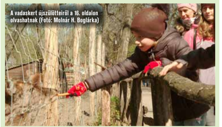
A vadaskert újszülötteiről a 16. oldalon olvashatnak

Szabadtéri, családi programokból sem volt hiány a húsvéti hosszú hétvégén Kecskeméten. A rendezvények gyermekek számára legfontosabb helyszíne az 50 éves vadaskert volt, ahol Káro, a bűvész, a látványvetések, a tojáskeresés, a bábelőadás és a bátorságpróba voltak a legnagyobb slágerek. A látogatók új jövevényekkel is találkozhattak, hiszen két muflon bárány született a nagyhéten.