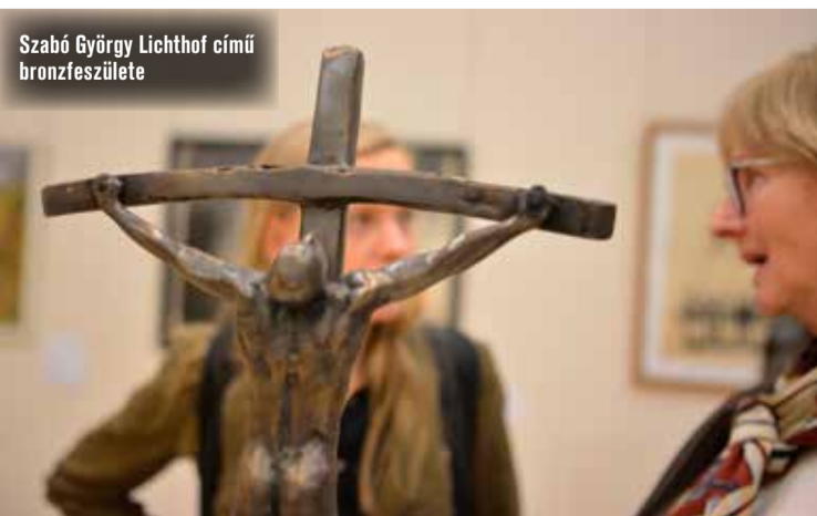
Szabó György Lichthof című bronzszülete

A kiállításon szereplő művek és a hozzájuk tartozó Pilinszky-versek egy kötetben is helyet kaptak, mely megvásárolható az agórában. Az INFINITIVUSZ című tárlat Szolnokról érkezett Kecskemétre, és május 6-ig látható városunkban.