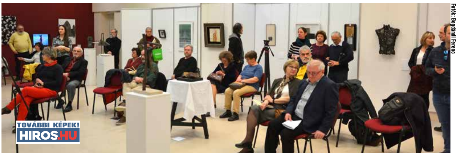
TOVÁBBI KÉPEK! HIROS.HU