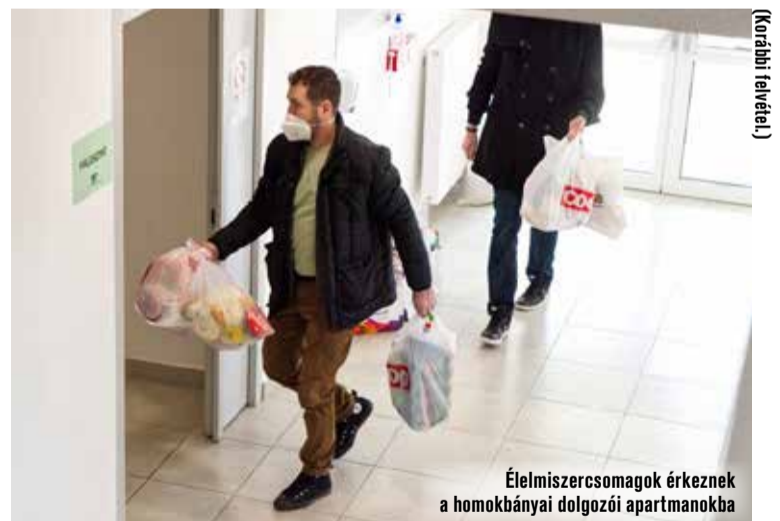
Élelmiszercsomagok érkeznek a homokbányai dolgozói apartmanokba

Ahogyan az országban mindenhol, úgy Kecskeméten is töretlenül segítik a menekülteket. A gyermekeknek oktatási intézményt biztosítanak, a felnőtteknek pedig cégekkel együttműködve igyekeznek munkát adni a kereskedelmi és iparkamara, hogy hosszú távon tudjanak maguknak lakhatást biztosítani.