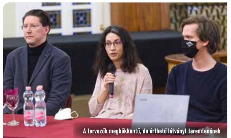
A tervezők meglepő, de érthető látványt teremtenének