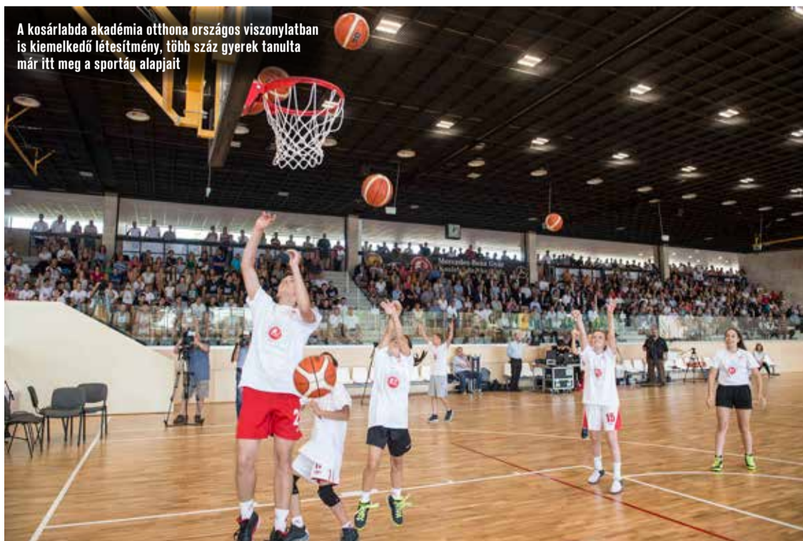
A kosárlabda akadémia otthona országos viszonylatban is kiemelkedő létesítmény, több száz gyerek tanulta már itt meg a sportág alapjait

Széchenyiváros, Kecskemét egyik legnagyobb lélekszámú területe. Itt is