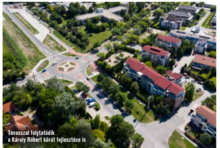
Tavasszal folytatódik a Károly Róbert körút fejlesztése is

– zárja a sportról folytatott beszélgetésünket az országgyűlési képviselő.