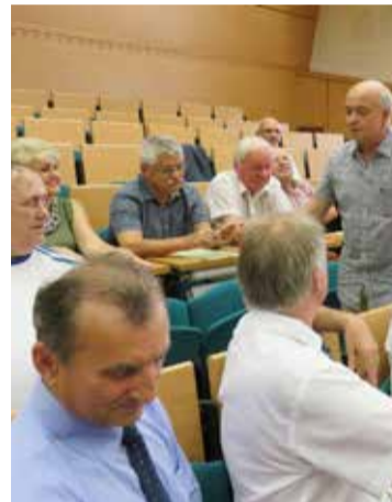
Öregdiákokkal, az első tankörében végzetekkel, 2019-ben