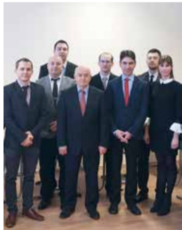
Államvizsga után a tanítványival, 2018-ban