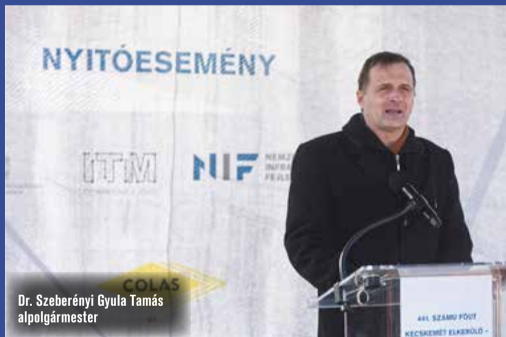
Dr. Szeberényi Gyula Tamás alpolgármester

A nettó 8,5 milliárd forint hazai forrásból megvalósuló projekt várhatóan 2023. év végén, 2024 elején fejeződik be.