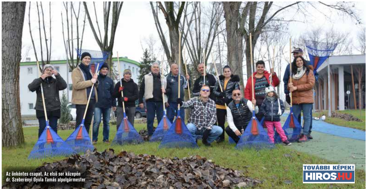
Az önkéntes csapat. Az első sor közepén dr. Szeberényi Gyula Tamás alpolgármester