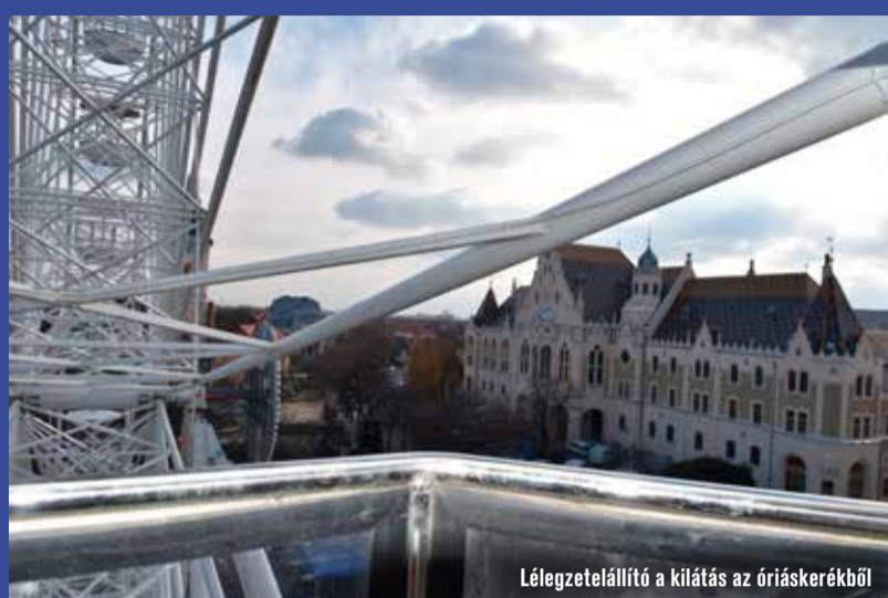
Lélegzetelállító a kilátás az óriáskerékből

Az első adventi hétfőjén csodálhattuk meg az ünnepi fényárba borult belvárost is. A főtéren mellett a Rá-