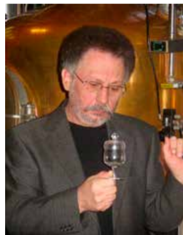
Illatolás közben a kecskeméti üzemben