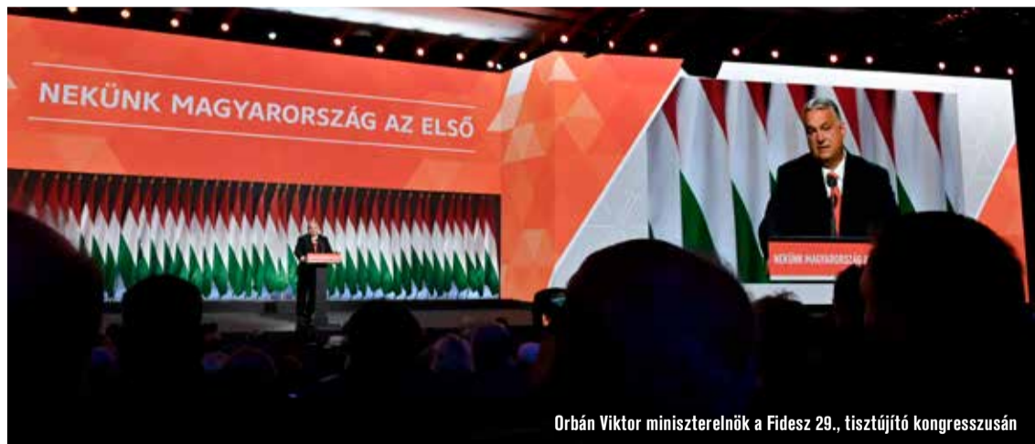
Orbán Viktor miniszterelnök a Fidesz 29., tisztújító kongresszusán

A következő hónapokban olyasmik történnek majd, amit még senki sem látott. Kezdődött a nyugdíjasoknak kifizetett 80 ezer forintos nyugdíjprémiummal. Folytatódik a 13. havi teljes nyugdíj kifizetésével – jelentette be Orbán Viktor miniszterelnök a Fidesz 29., tisztújító kongresszusán tartott beszédében november 14-én.