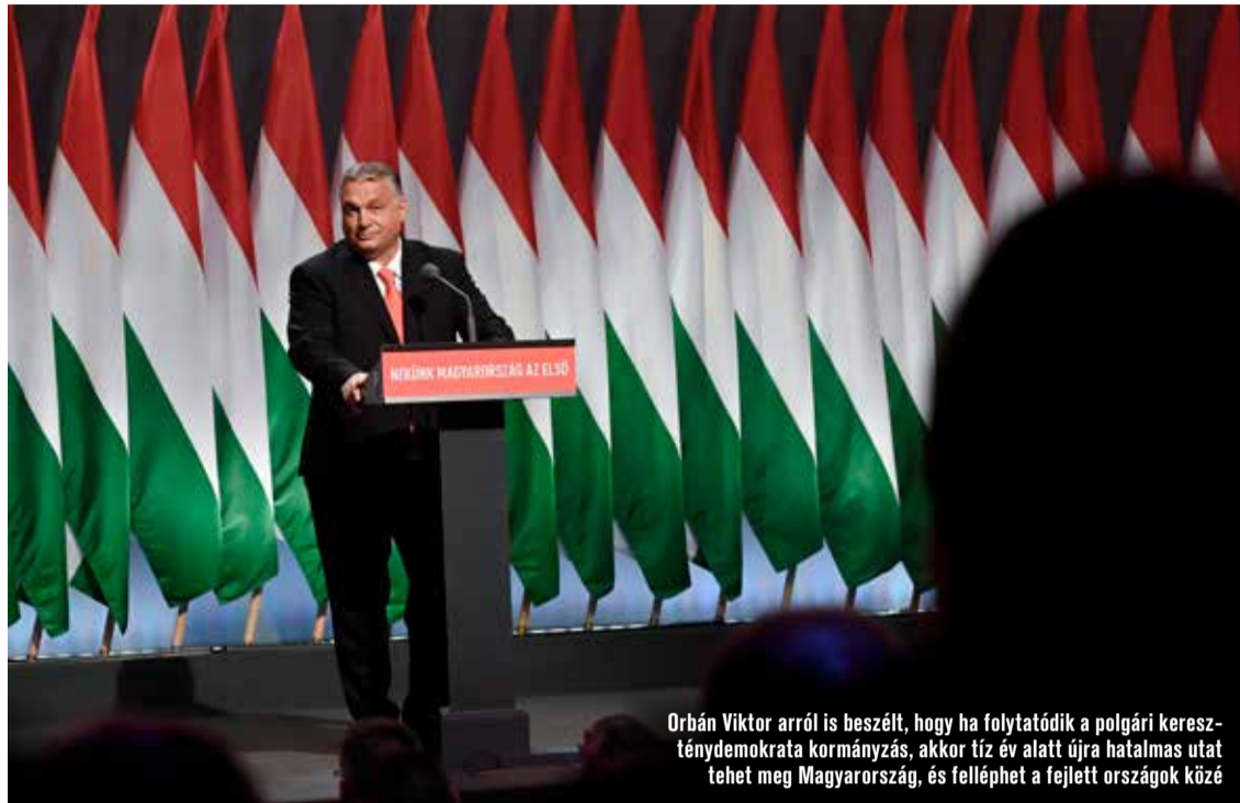
Orbán Viktor arról is beszélt, hogy ha folytatódik a polgári kereszténydemokrata kormányzás, akkor tíz év alatt újra hatalmas utat tehet meg Magyarország, és felléphet a fejlett országok közé

Kifejtette: világos célok nélkül nincs sikeres kormányzás, nincs sikeres ország, és nincs önmagával békében és boldogan élő nemzet sem. Tizenkét éve is egyenesen beszéltek, és világos céljaik voltak, tíz egyszerű és világos cél: egymillió munkahelyet teremtenek, nem lesznek adósrabszolgák, helyreállítják a közrendet és a közbiztonságot, megvédik a nyugdíjasokat és a nyugdíjak értékét, a