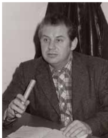
A GAMF tanáraként az 1980-as években