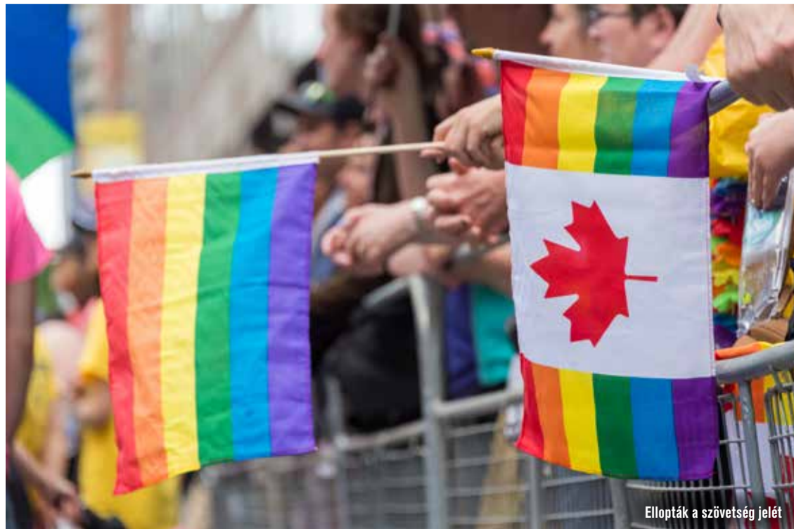
Ellopták a szövetség jelét

– Állandóan hazajárok. Legalább évente egyszer... Nem akarok LEMMING-emberré fajulni (izgalmában felborítja a flakont). Ezek a lemmingek Skandináviában élnek, s időről időre elszaporodnak. Akkor nekivágnak a tengerpartnak, hullámzanak mint a futószőnyeg. Teljes erővel belezúdulnak a tengerbe, s ott fulladnak meg tömegével...Nos, én nem leszek ilyen eszeveszett hadonász, nem adom fel magamat. Azért disszidáltam, mert attól tartottam, hogy a kommunizmusban át fognak alakítani. Ez elől sikerült elszökni. Most itt roskadozok ebben a szörnyű WOKE-Kanadában. Ugyanúgy el kell menekülnöm. Ha ennek az az ára, hogy nem kapok extra pénzt a nyugdíjam mellé, oké! Kering édesapámról egy híres anekdota. Valaki azzal mentegőzött a balliberális csödkormányzás idején, hogy „én el se mentem szavazni”. Apám erre ráförmedt: akkor fogja be a pófáját! Nos, én is ehhez tartom magam, apukámra emlékezve!