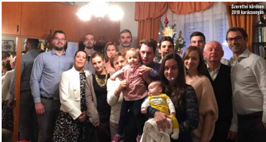
Szerettei körében 2019 karácsonyán