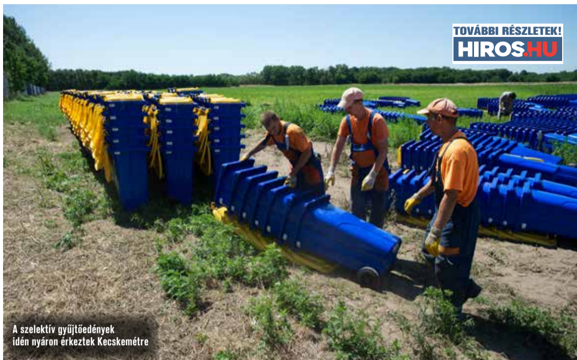
A szelektív gyűjtőedények idén nyáron érkeztek Kecskemétre

„Külön köszönet a Hunyadvárosi Tanácsadó Testület tagjainak, akik önkéntesként, ingyen vettek részt a munkában! Köszönet jár a DTkH dolgozóinak és a hunyadvárosi lakóknak a felelős, fegyelmezett magatartásukért és hogy fontosnak tartják a sze-