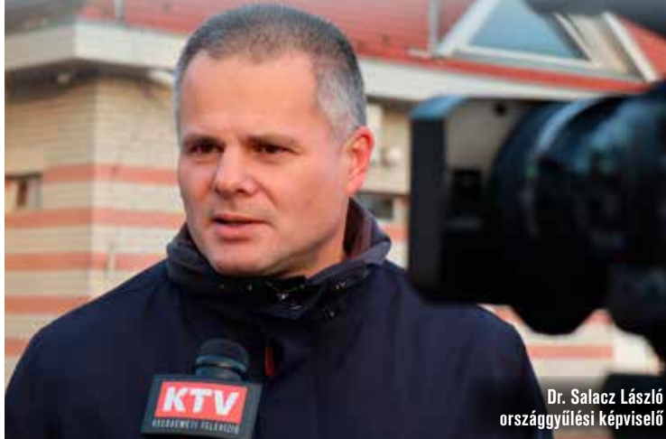
Dr. Salacz László országgyűlési képviselő

– Mindenkinél jó Magyarországon a benzinárak csökkentése, hiszen 2010 előtt a baloldali kormányok emelték a rezsit, a gázolaj és a villany árát is, ami elszegényítette a családokat – nyilatkozta a Kecskeméti Televízióknak Salacz László országgyűlési képviselő.