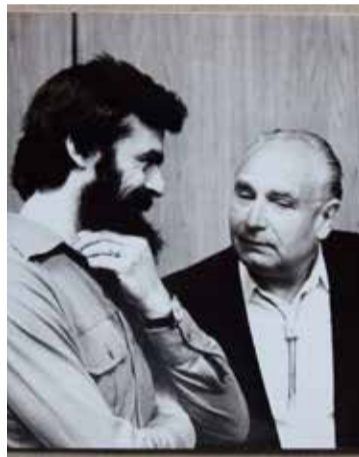
Goór Imre festőművésszel 1980 körül