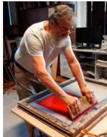
Szítanyomás a műteremben, 2021-ben