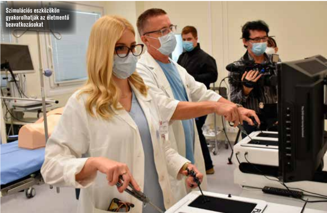
Szimulációs eszközökön gyakorolhatják az életmentő beavatkozásokat