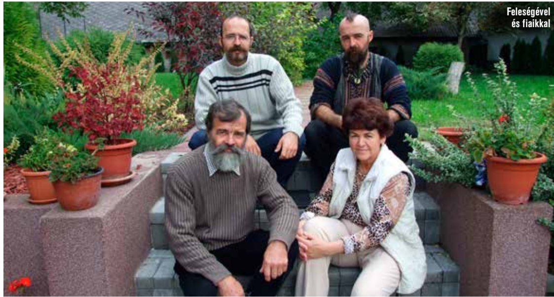
Feleségével és fiaikkal