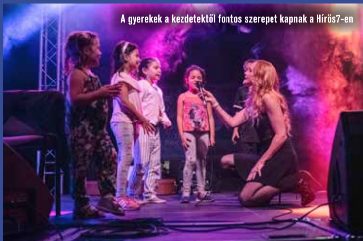
A gyerekek a kezdetektől fontos szerepet kapnak a Hírös7-en

amellyel elismerik és támogatják áldozatvállalásukat. Idén tíz család részesült az adományban, a szülők vállalták, hogy amikor már nincs