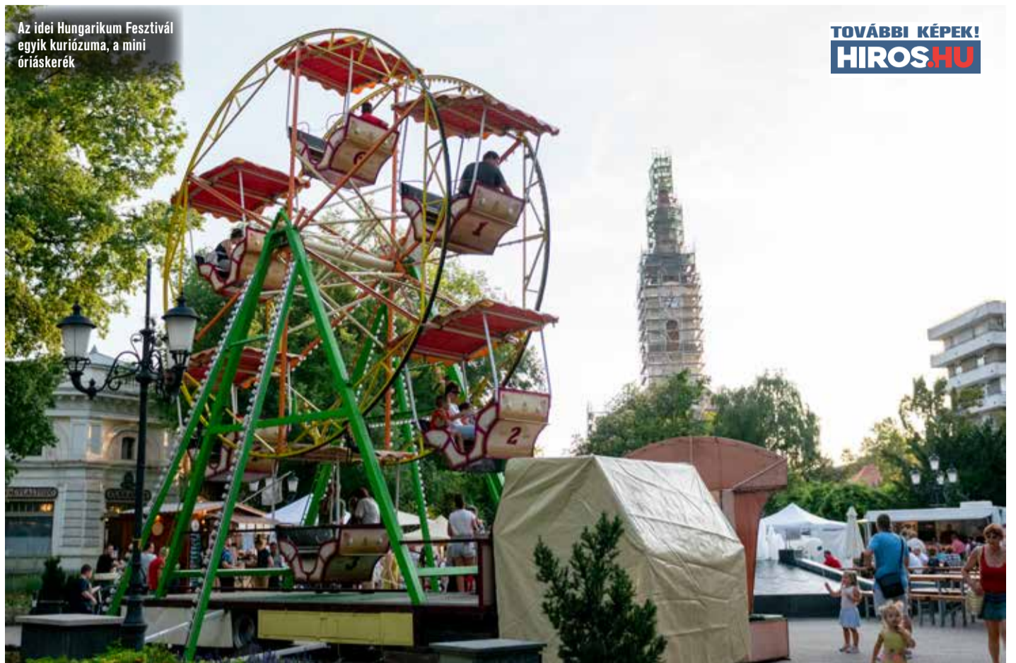
Az idei Hungarikum Fesztivál egyik kuriózuma, a mini óriáskerék