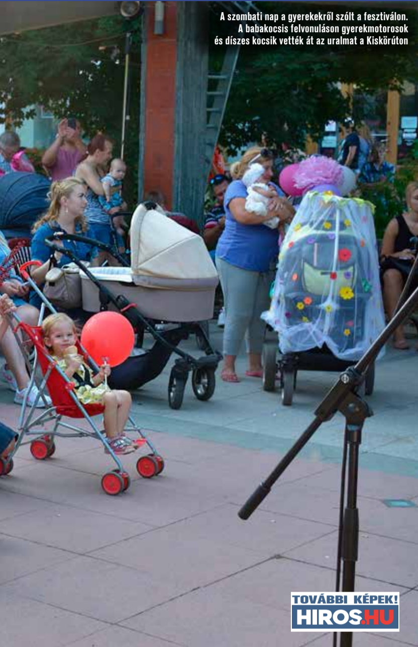
A szombati nap a gyerekekről szólt a fesztiválon. A babakocsis felvonuláson gyermekmotorosok és díszes kocsik vették át az uralmat a Kiskörúton