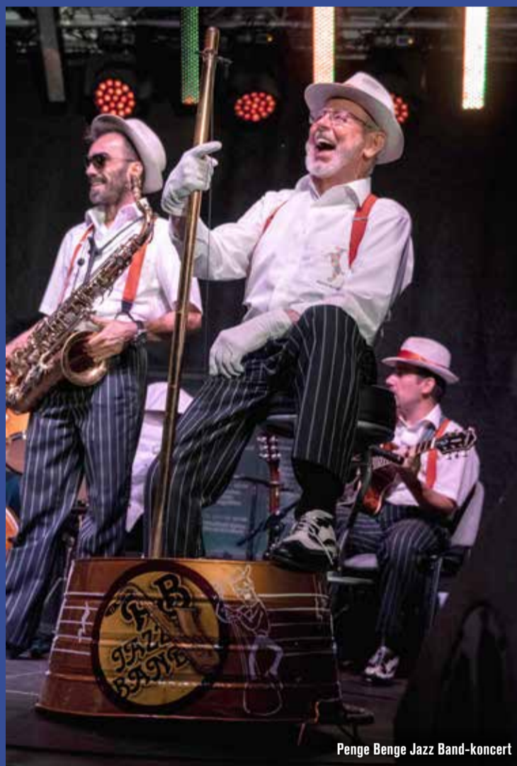
Penge Benge Jazz Band-koncert

Végül a jobbnál jobb klasszikus műsorelemek mellett pénteken, szombaton és vasárnap olyan nagy-ágyúk lépnek még fel, mint Zséda, a Blahalousiana vagy az Irie Maffia.