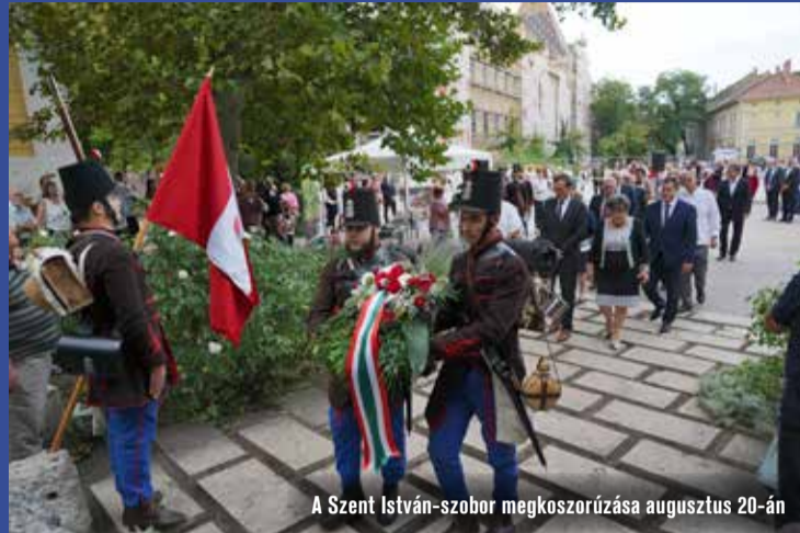
A Szent István-szobor megkoszorúzása augusztus 20-án