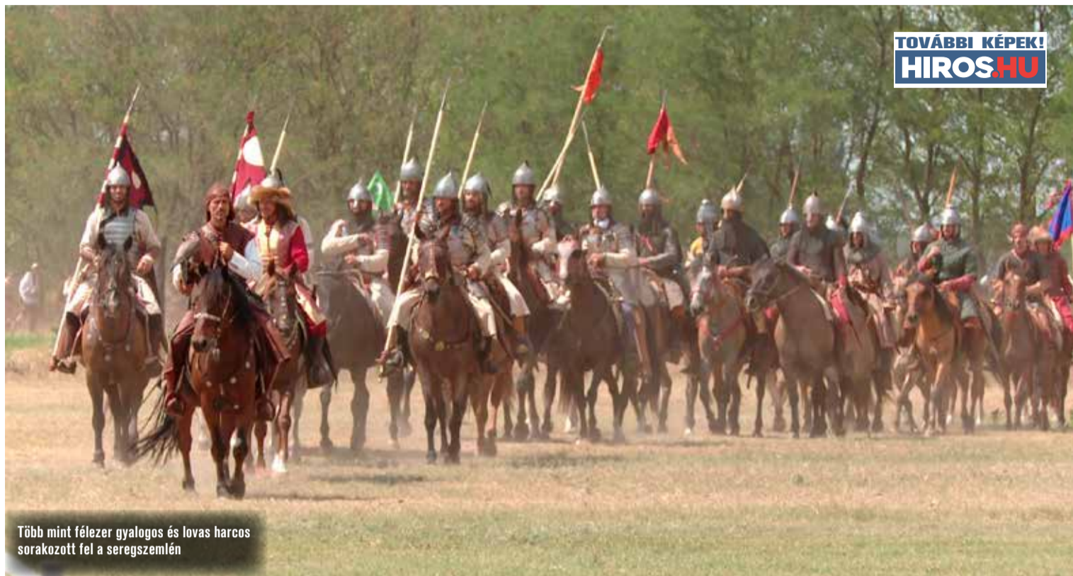
Több mint félezer gyalogos és lovas harcos sorakozott fel a seregszemlén