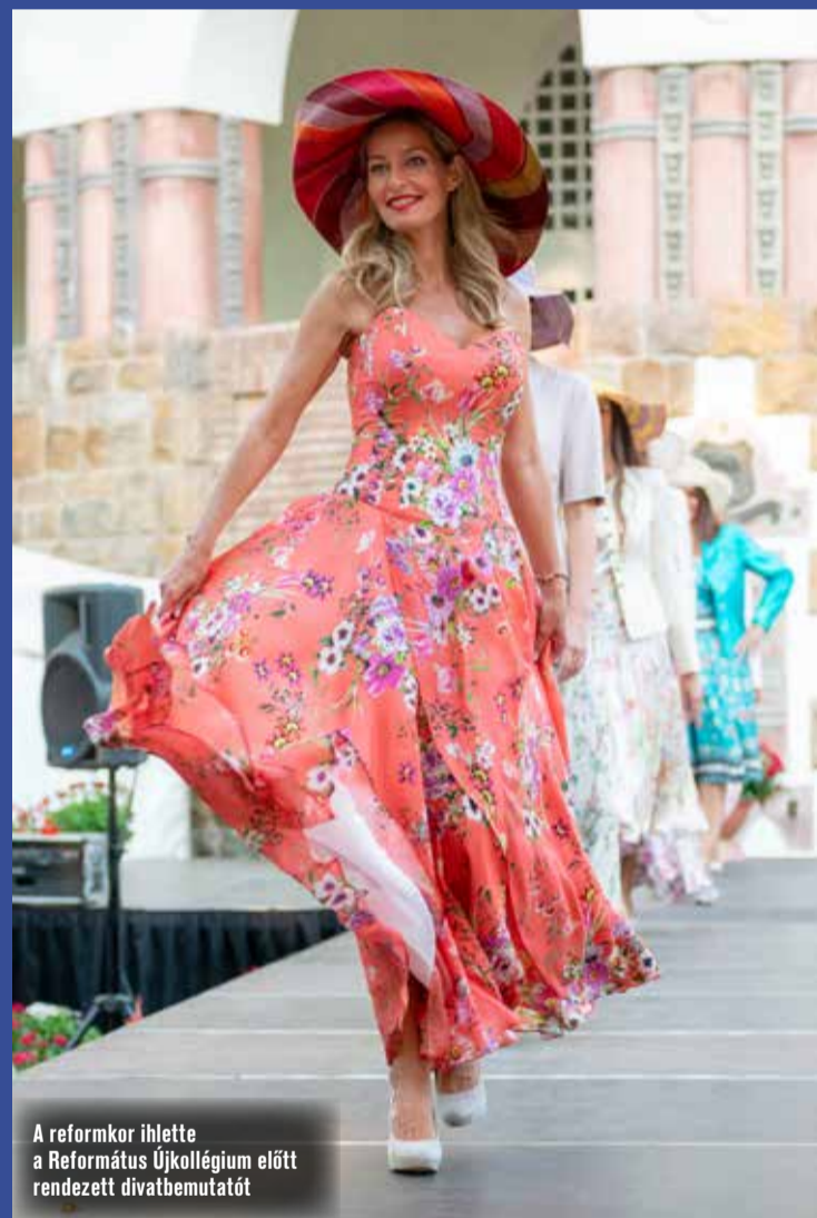
A reformkor ihlette a Református Újkollégium előtt rendezett divatbemutatót

ték a látványelemeket. A lézershow-t különleges hanghatásokkal tették még egyedibbé és felejthetetlenné, így egy olyan produkcióval zárult az augusztus 20-i ünnepség, ami minden várakozást felülmúlt. Ráadásul idén nem károsította a környezetet, és a kutyák nyugalmát, biztonságát sem veszélyeztette a műsor.