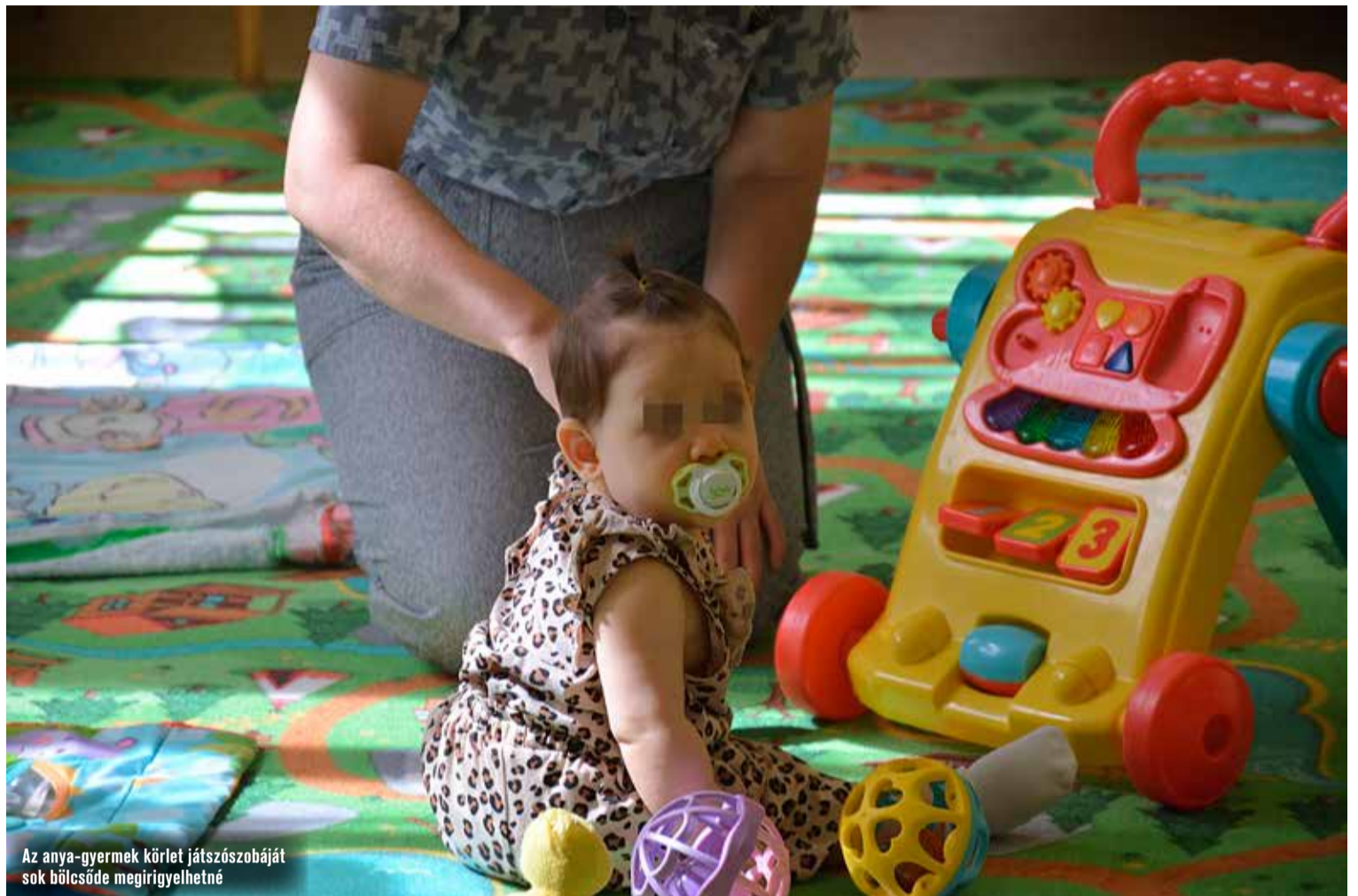
Az anya-gyermek körlet játszószojáját sok bölcsőde megirigyelhetné

anya, az elsődleges, hogy a gyermek egészsége, fizikai, mentális fejlődése biztosított legyen. Ehhez minden segítséget megadunk – mondja a zászlós. – Folyamatos szolgálatban csecsemőgondozó segít nekik, hetente jön gyermekorvos és a védőnő, aki kontrollálja a szoptatást, majd a hozzátáplálást, valamint a babák fejlődését. Ők gondoskodnak a vitaminok beviteléről, a kötelező oltásokról is. Emellett természetesen az anyáknak rendben kell tartaniuk a körletet, saját lakóhelyiségüket is.