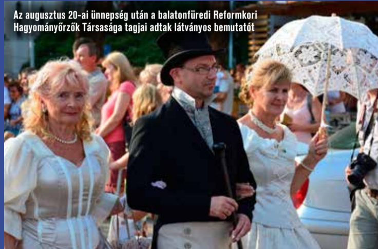
Az augusztus 20-ai ünnepség után a balatonfüredi Reformkori Hagyományőrök Társasága tagjai adtak látványos bemutatót