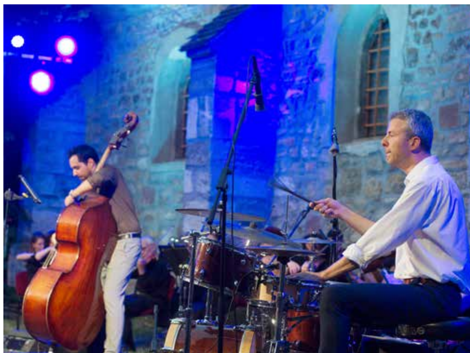
A Sárk Páter Trió különleges zenei élménnyel ajándékozta meg a közönséget: Beethoven műveit mutatta be jazzkötésben