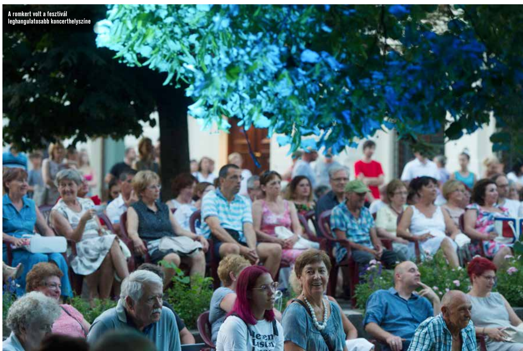
A romkert volt a fesztivál leghangulatosabb koncerthelyszíne