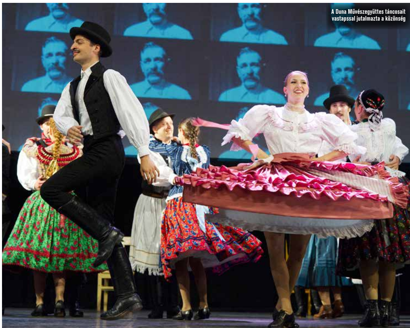
A Duna Művészegyüttes táncosait vastappsal jutalmazta a közönség