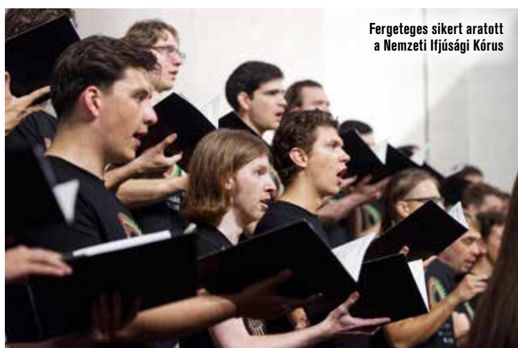
Fergeteges sikert aratott a Nemzeti Ifjúsági Kórus