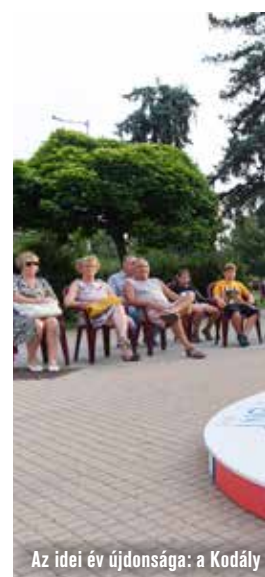
Az idei év újdonsága: a Kodály