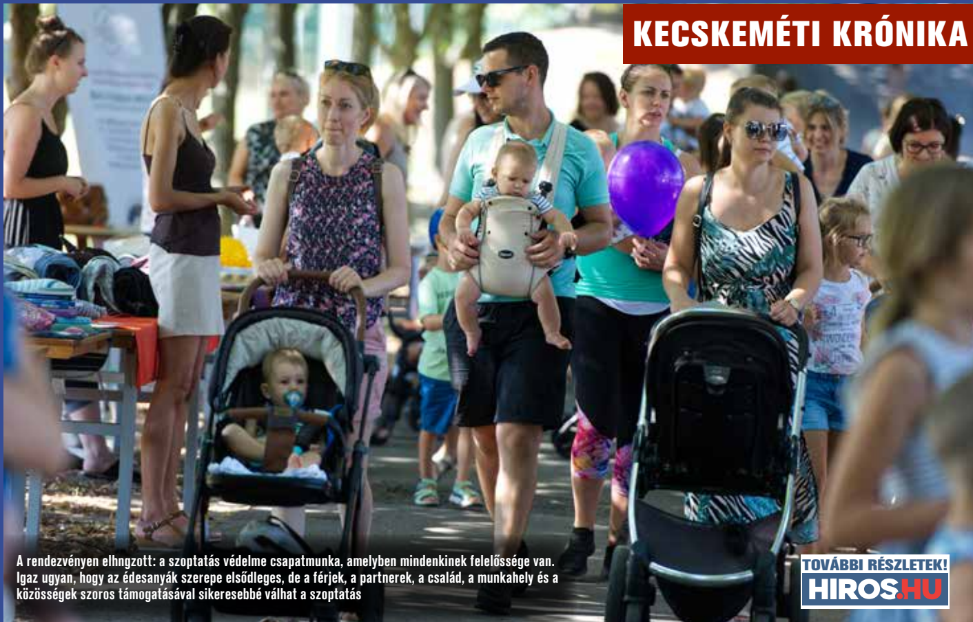
A rendezvényen elhangzott: a szoptatás védelme csapatmunka, amelyben mindenkinek felelőssége van. Igaz ugyan, hogy az édesanyák szerepe elsődleges, de a férjek, a partnerek, a család, a munkahely és a közösségek szoros támogatásával sikeresebbé válhat a szoptatás