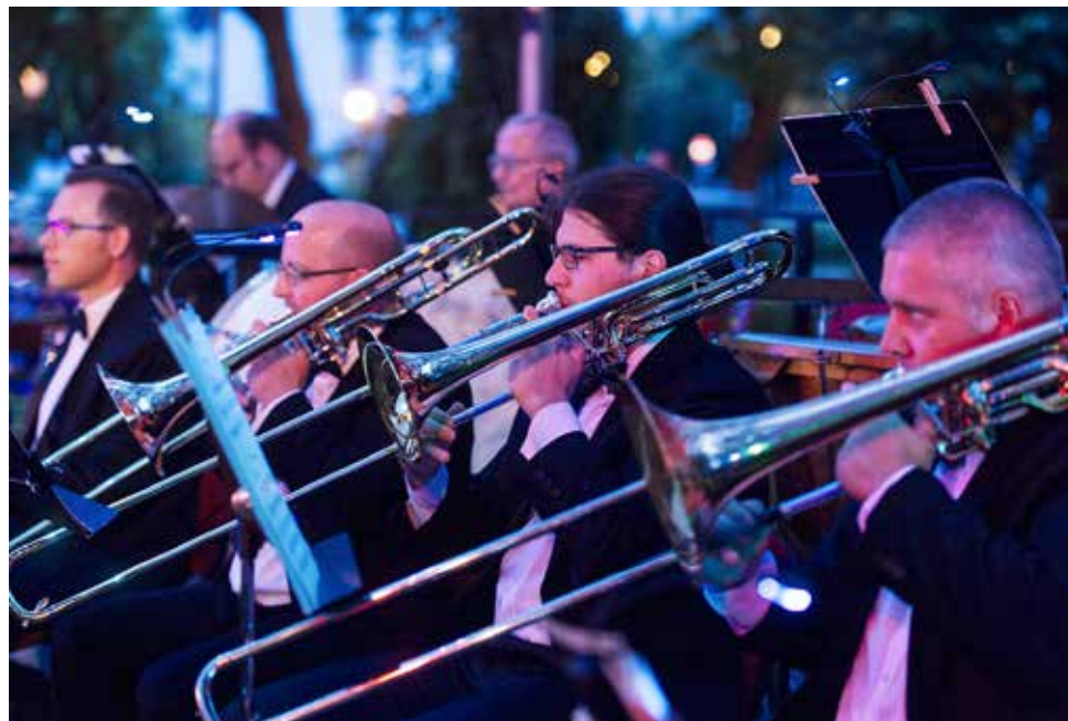
A fesztivál nyitókoncertjén idén is a Kecskeméti Szimfonikus Zenekar játékában gyönyörködhetek a zeneszeretők