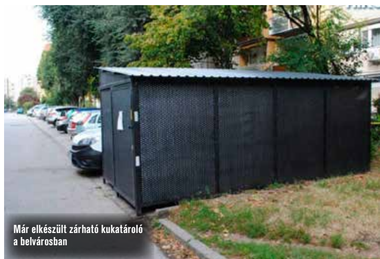
Már elkészült zárható kukatároló a belvárosban

VIDEÓRIPORTUNK A KECSKEMÉTI TV H-U-N KTV KECSKEMÉTI TELEVÍZIÓ