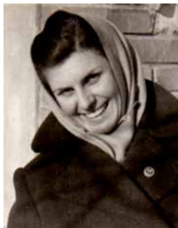
A Testnevelési Főiskola diákjaként