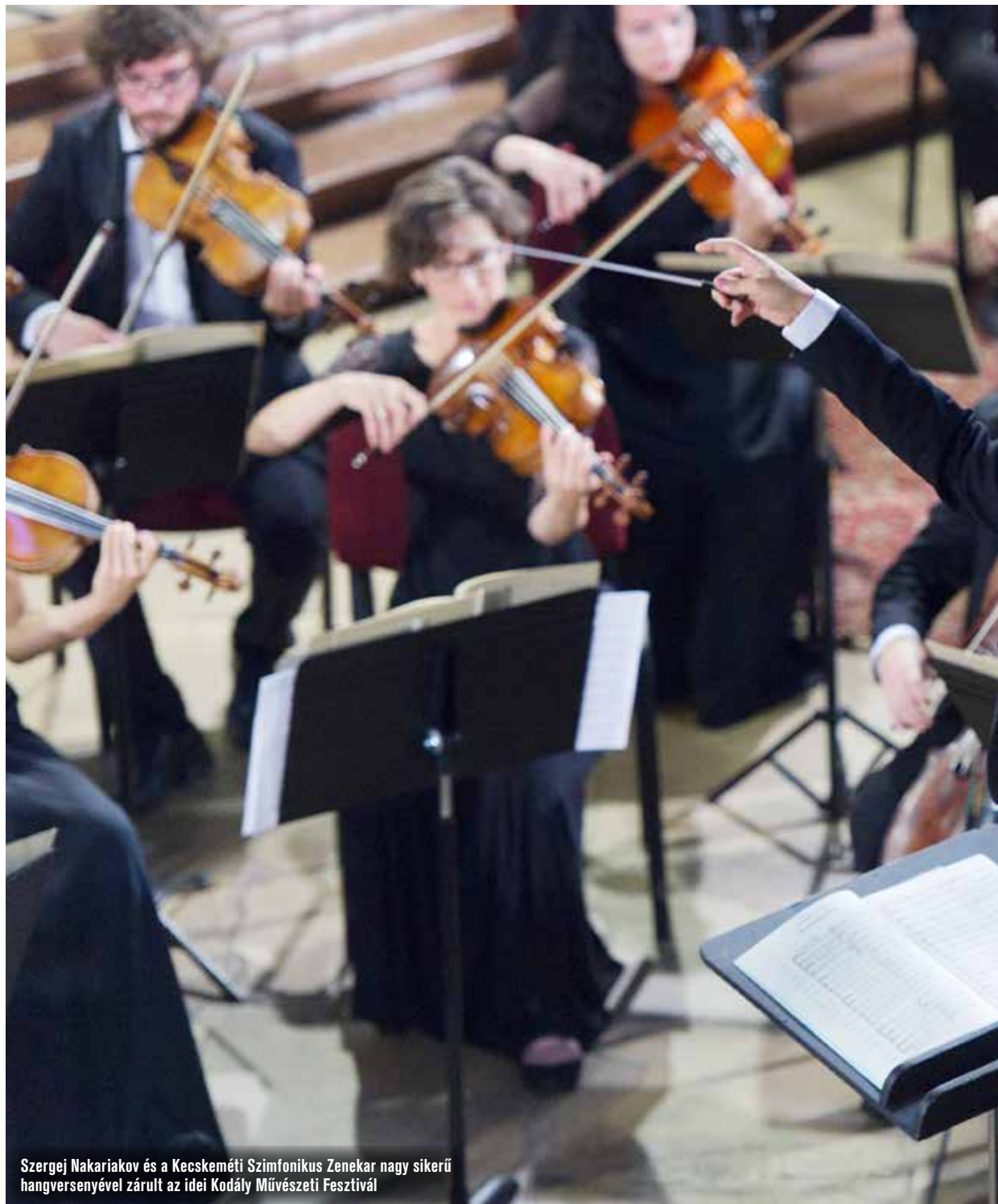
Szergej Nakariakov és a Kecskeméti Szimfonikus Zenekar nagy sikerű hangversenyével zárult az idei Kodály Művészeti Fesztivál

konceptió és a választott művek a piarista templom varázslatos akusztikájával kombinálva tökéletes egészet alkottak. A többi program is hasonlóan szép élményt jelentett. Így például a romkert dzsesszkoncert az előadók közvetlenségével és könnyedségével, és azzal, ahogyan ezt a műfajt nagyon finoman összekombinálták Beethoven zenéjével, teljesen megfogott, egy új perspektívát nyitott meg előttem. A Kodály Pont is – az a hely, ahol néhány percig bárki bármilyen műfajban zenélhet vagy elmondhatja életrészletét a zenével kapcsolatos élményeit-élményeit-benyomásait – egy kiváló ötlet, jómagam is elővettem a hegedűmet, és éltem a Hírös Agóra előtt kialakított lehetőséggel. Az elmúlt napokban nagyon megszerettem Kecskemétet, a város egy tünemény, itt mindenki barátságos és kedves, szívesen nagyon örülök, hogy itt lehetek!”