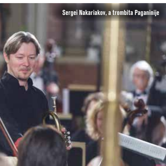
Sergei Nakariakov, a trombita Paganinije