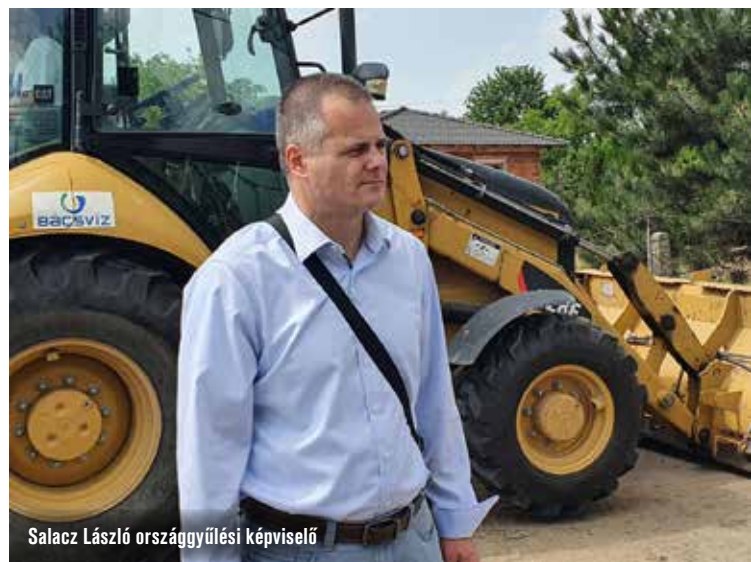
Salacz László országgyűlési képviselő

Kecskemét egyébként nem csak a hetényegyházi bekötőútra kapott komoly támogatást az államtól. További 1,7 milliárd forintot fordíthat a város több önkormányzati intézmény energetikai korszerűsítésére.