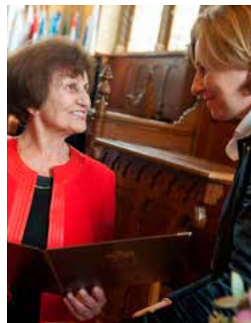
2015-ben a Kecskemét Városért Oktatási Díjat is átvehette

sokat segít nekem, néha egy keveset én is viszonzni tudok neki.