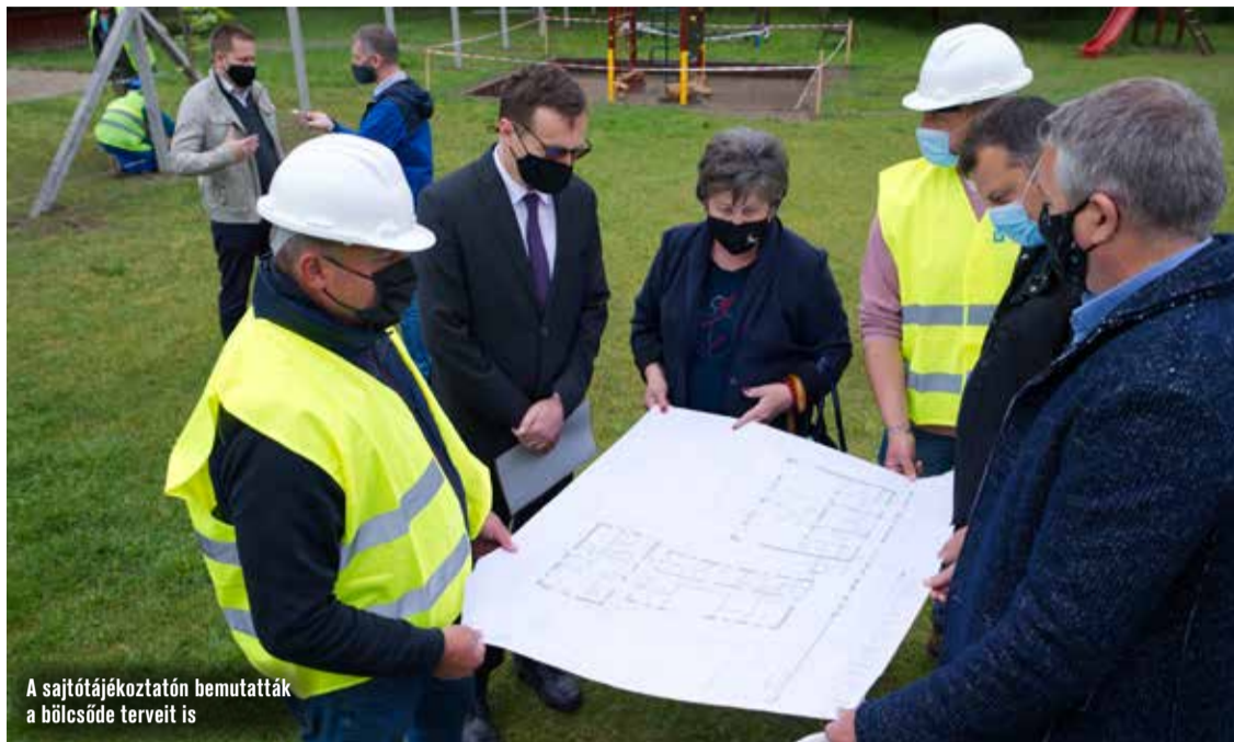
A sajtótájékoztatóon bemutatták a bölcsőde terveit is

– A csoknak köszönhetően sokan építkeznek a környéken, így megnőtt az igény a bölcsődei és az óvodai férőhelyek iránt. Az önkormányzat ezért vágott bele a bölcsődefejlesztésbe.