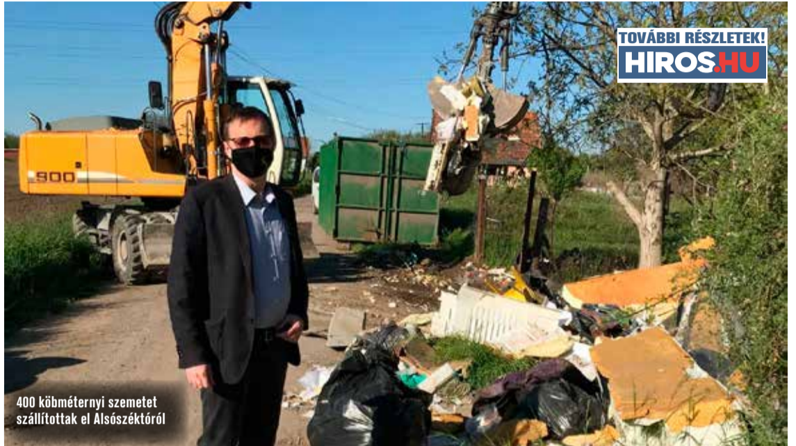
400 köbméternyi szeméttel szállították el Alsószéktőről