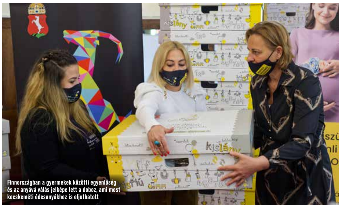
Finnországban a gyermekek közötti egyenlőség és az anyává válás jelképe lett a doboz, ami most kecskeméti édesanyákhoz is eljuthatott