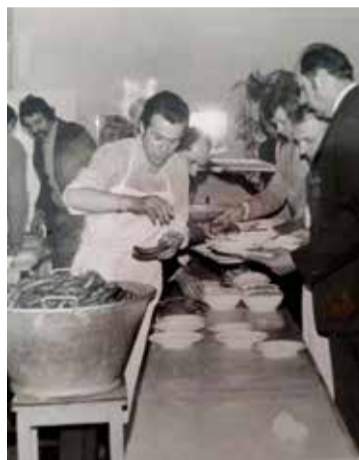
Nőnapra ünnepségen a Helvéciai Állami Gazdaságban