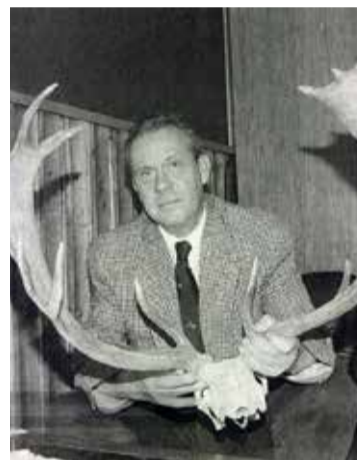
2007 óta a Bács-Kiskun Megyei Vadászszövetség ügyvezető fővadásza