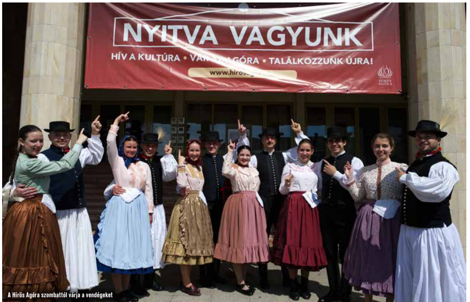
A Hírös Agóra szombattól várja a vendégeket

Május 14-én, pénteken nyitotta meg újra kapuit a Kecskeméti Fürdő, ahová az első három napon 1700-an látogattak el. A fürdő összes szolgáltatása igénybe vehető, természetesen csak védettségi igazolvány birtokában.