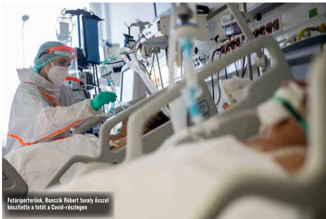
Fotóriporterünk, Banezik Róbert tavaly ősszel készítette a fotót a Covid-részlegen

– Ez az egy év fizikailag és mentálisan is hihetetlen megterhelést jelentett a kollégák számára. Egy éve még levegőt venni, beszélni is alig tudtunk az FFP-maszkokban, most pedig már megszokottá vált, gyakorlatilag ebben éljük az életünket. A nővérektől is hatalmas kitartást igényel, hisz az elmúlt egy évben alig voltak szabadságon. A lelki megterhelés azonban