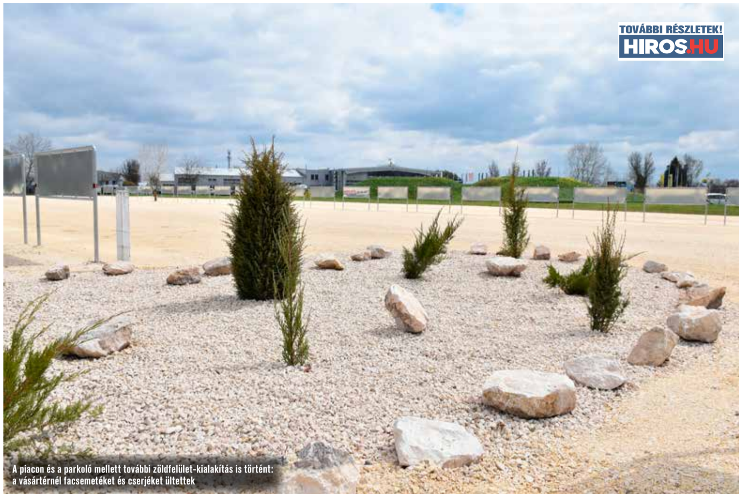
A piacon és a parkoló mellett további zöldfelület-kialakítás is történt: a vásártérnél facsemetéket és cserjéket ültettek

A piacon és a parkoló mellett további zöldfelület-kialakítás is történt. A vásártérnél facsemetéket és cserjéket ültettek. Először decemberben az „Ültess fát! Tegyük zölddebbé Kecskemétet!” program keretén belül, amely a Kecskeméti TERMOSTAR Hőszolgáltató Kft. és a 10 Millió Fa – Kecskemét