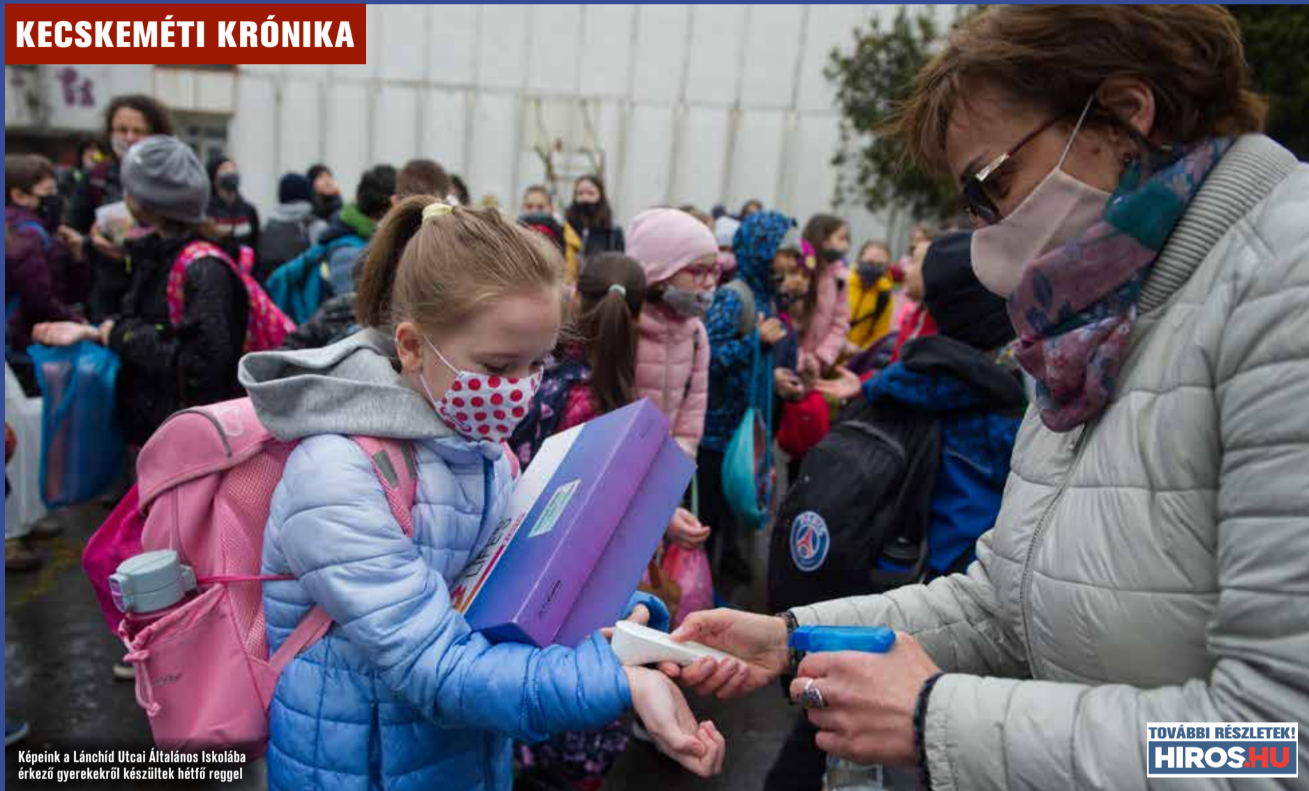
Képeink a Lánchíd Utcai Általános Iskolába érkező gyerekekről készültek hétfő reggel