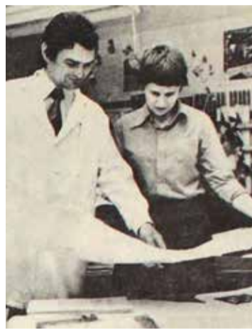
A BÁCSTERV igazgatójaként