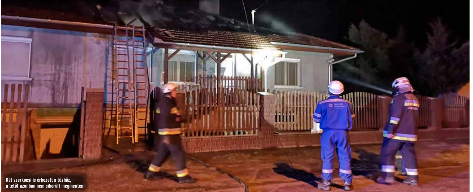
Két szerkocsi is érkezett a tűzhöz, a tetőt azonban nem sikerült megmenteni

Kigyulladt egy családi ház szombaton délután Kadafalván, a Mogyoró utcában. Bár a tűzoltóknak sikerült megfékezniük a lángokat, az épület lakhatatlanná vált. A tetőből semmi sem maradt, elégett a szigetelés, odalettek az új nyílászárók is. Biztosítás sajnos nem volt a házon, így csak az összefogás erejében bízik a család.