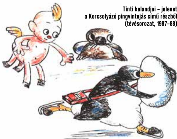
Tinti kalandjai - jelenet a Korcsolyázó pingvintojás című részből (tévé-sorozat, 1987-88)

A 83 éves Kossuth-díjas grafikusművészt, a magyar grafika „nagy generációjának” egyik képviselőjét március 16-án érte halál. Gyulai Líviuszt a Magyar Művészeti Akadémia saját halottjának tekinti.