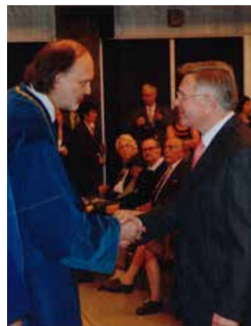
A jubileumi díszoklevél, az aranydiploma átvételekor, 2012-ben