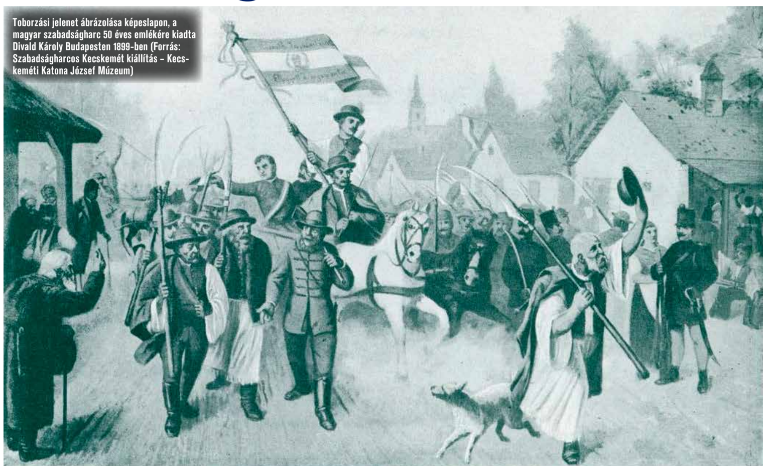
Toborzási jelenet ábrázolása képeslapon, a magyar szabadságharc 50 éves emlékére kiadta Divald Károly Budapesten 1899-ben

– A korabeli esküszövegek mindig az uralkodó nevére szóltak, az uralkodó személyének fogadtak hűséget. Ez sokak számára keserű dilemmává válik 1848-ban. Mogoly János, a pákozdi csata időszakában annak ellenére állította meg a Jellasics vezette császári-királyi sereget, hogy tudta, ez fegyelmi szempontból problémás, és magát mondta árulónak. Más példákat is lehet mondani. Ebből a szempontból szerencsés fordulat következett