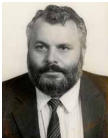
Az ÁFEOSZ-középszakok igazgatójaként