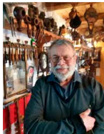
Néprajzi gyűjteménye több ezer darabból áll

tatom meg másoknak is, ha telefonon megkeresnek, akkor az érdeklődőket szívesen fogadom. Büszke vagyok arra, hogy magángyűjteményem a kerekegyházi értéktár része, s hogy a minimúzeumomat nemrég felvették a nemzeti értékek lajstromába.