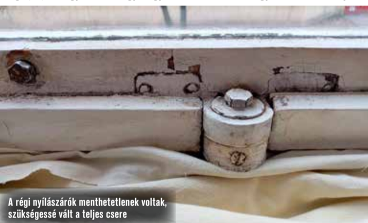
A régi nyílászárók menthetetlenek voltak, szükségessé vált a teljes csere