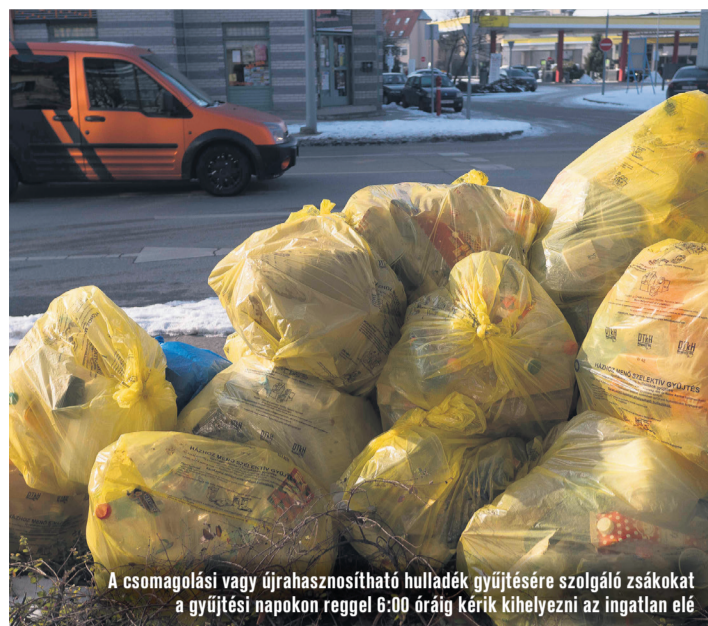
A csomagolási vagy újrahasznosítható hulladék gyűjtésére szolgáló zsákokat a gyűjtési napokon reggel 6:00 óráig kérjük kihelyezni az ingatlan elé

Az építési-bontási hulladék esetében kizárólag a beton, téglá, cserép és föld behozatala lehetsé-