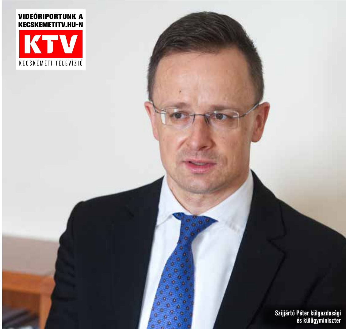
Sziijártó Péter külgazdasági és külügyminiszter

VIDEÓRIPORTUNK A KECSKEMÉTI TV. HU-N KTV KECSKEMÉTI TELEVÍZIO