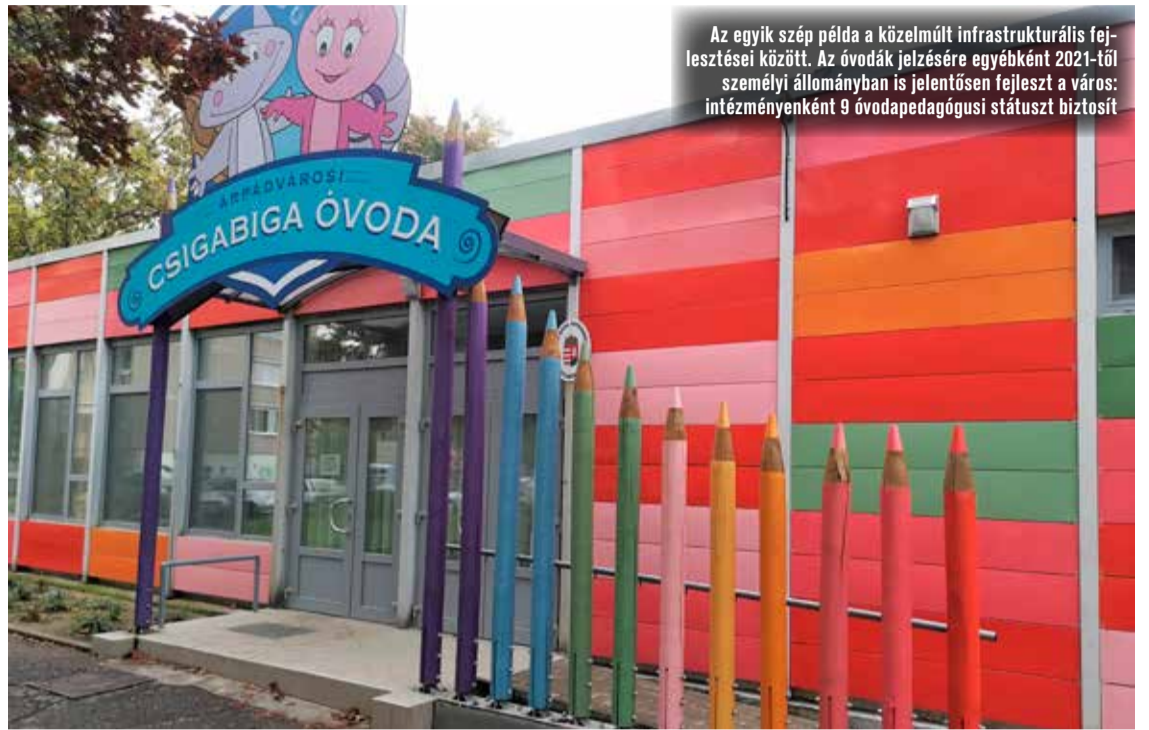
Az egyik szép példa a közelmúlt infrastrukturális fejlesztései között. Az óvodák jelzésére egyébként 2021-től személyi állományban is jelentősen fejleszt a város: intézményenként 9 óvodapedagógusi státuszt biztosít

a napokban egyeztetek külön-külön a bölcsődékkal, óvodákkal, idősekkel, fogyatékkal élőkkel, civilekkel annak érdekében, hogy rövid és hosszabb távon is lássam az igényeiket.