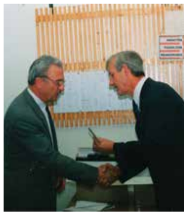
A széchenyivárosi energiaközpont üzembe helyezésekor