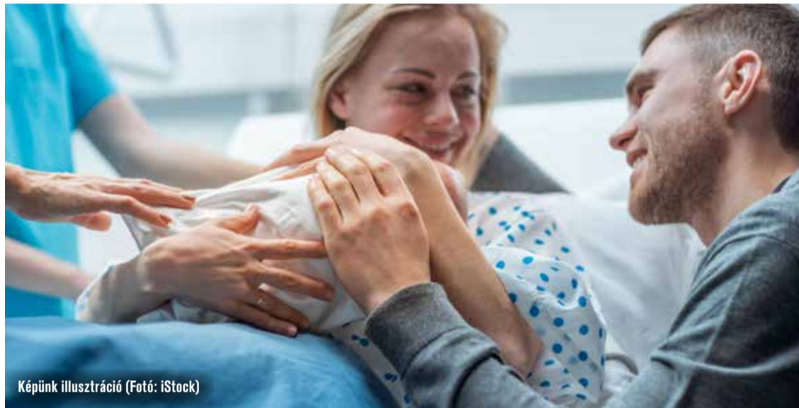
Képünk illusztráció

ben kellene rögzítenie, ki mire köteles, ezért mennyi pénzt kap az orvos vagy a kórház. A MOK vezetésének javaslata értelmében külön megállapodás esetén lehetne térítést kérni a szülésért, a szerződésben pedig tisztázhatók volnának az extra szolgáltatások is. Ha bármilyen komplikáció fellép, el kell térni a szerződéstől.