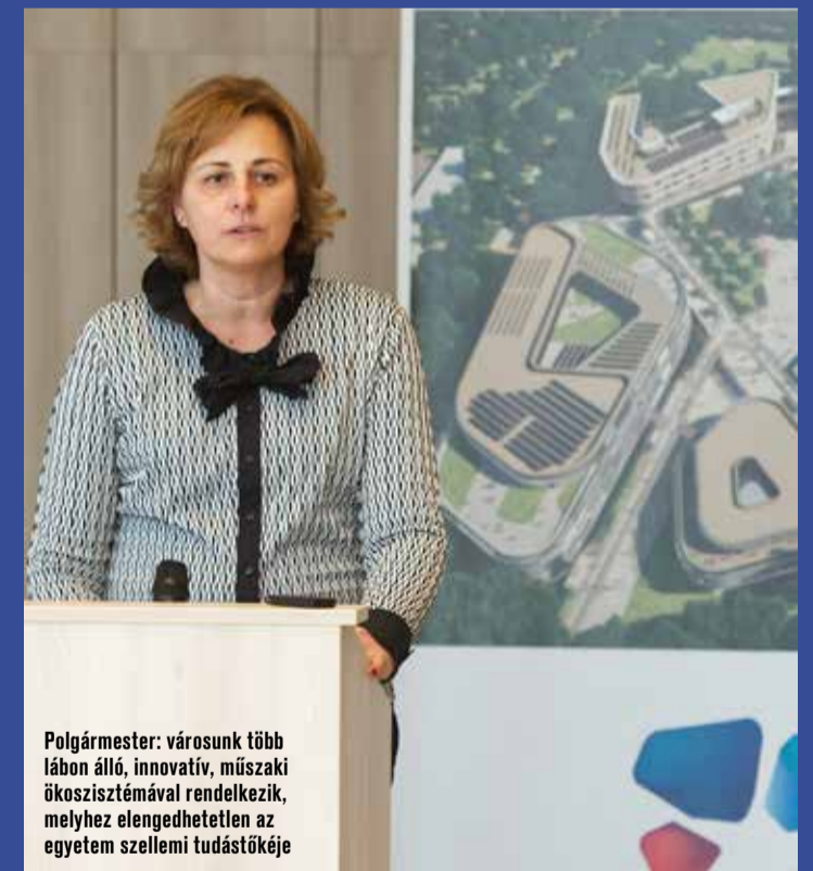
Polgármester: városunk több lábón álló, innovatív, műszaki ökoszisztémával rendelkezik, melyhez elengedhetetlen az egyetem szellemi tudástőkéje

– Egy új iparág, a védelemipar veheti meg a lábát Kecskeméten – emelte ki beszédében Szemereyné Pataki Klaudia polgármester. Elmondta, városunk több lábón álló, innovatív, műszaki ökoszisztémával rendelkezik, melyhez elengedhetetlen az a szellemi tudástőke, amit az egyetem jelent. A polgármester felhívta a figyelmet, az új egyetemi képzésnek köszönhetően munkahelyeket tudunk megőrizni és létrehozni, valamint adóbevételeinket is növelni tudjuk. Szemereyné Pataki Klaudia megköszönte egyetemi professzoraink, vezetőink nyitottságát, pozitív hozzáállását.