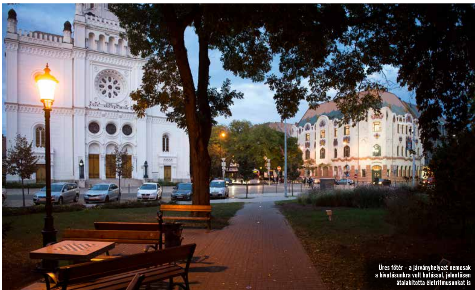
Üres főtér – a járványhelyzet nemcsak a hivatásunkra volt hatással, jelentősen átalakította életritmusunkat is

Számos fejlesztésünk közül kiemelkedik a 2021-ben induló, 8 milliárd forint értékű nagyberuházásunk, mellyel vállalatunk 12 ezer tonnára növeli, ezzel megduplázza magyaros ételkészítőinek gyártókapacitását. A beruházás eredményeként az Univer kecskeméti-hetényegyházi telephelyén a legkorszerűbb műszaki színvonalat képviselő új üzem gyártja majd a hungarikum Erős Pistát és Piros Aranyat. Azért dolgozunk, hogy az Univer Product Zrt. minden eddiginél fenntarthatóbb és modernebb karakterét mutathassa fogyasztóinak, partnereinek.