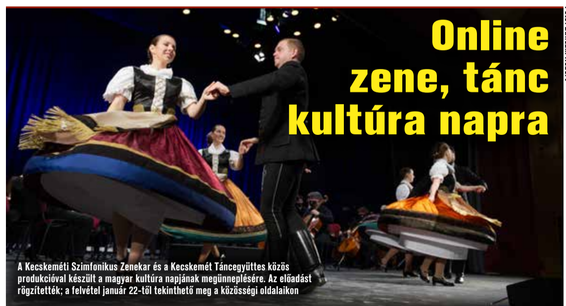
A Keckeméti Szimfonikus Zenekar és a Keckeméti Táncgyűttes közös produkciójával készült a magyar kultúra napjának megünneplésére. Az előadást rögzítették; a felvétel január 22-től tekinthető meg a közösségi oldalainkon

laktanya 3 milliárd 900 millió forintból valósul meg, és várhatóan 2023-ra készül el. A komplexumban tíz szeralást alakítanak ki a tűzoltók készenléti járművei számára. A szertár feletti szárnyban irodák, egy hírközpont, valamint raktározást, tárolást szolgáló helyiségek kapnak majd helyet.