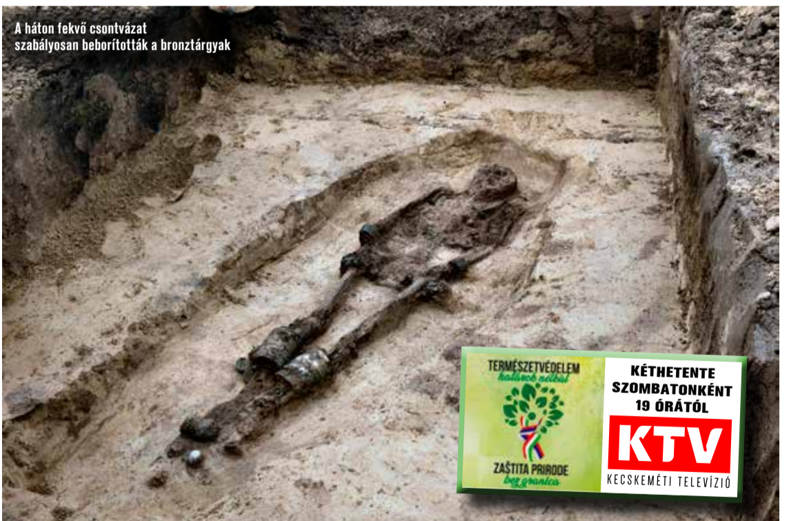
A háton fekvő csontvázat szabályosan beborították a bronztárgyak

A leletek arról árulkodnak, hogy a sír a bronzkor második felében, fel-