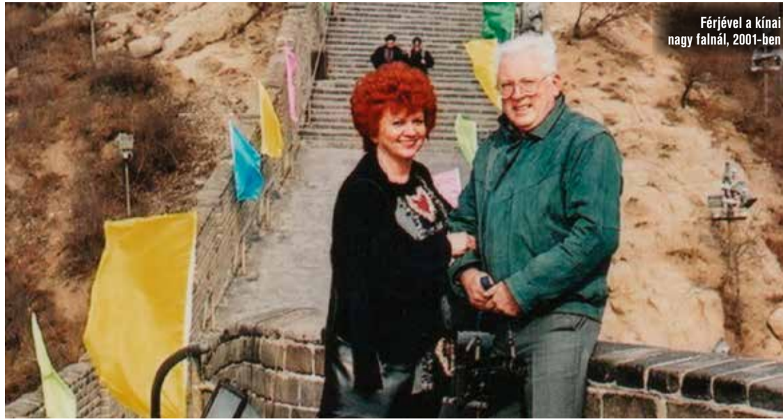
Férjével a kínai nagy falnál, 2001-ben