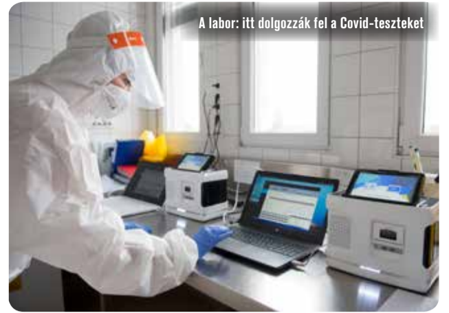
A labor: itt dolgozzák fel a Covid-teszteket

Szavak helyett a képek beszélnek összeállításunkban. A Bács-Kiskun Megyei Oktatókórház dolgozói a hagyományosnál szigorúbb egészségügyi-biztonsági intézkedések közepette gyógyítják és ápolják a betegeket. Különösen a Covid-intenzív osztályon megfeszített a munka. Banczik Róbert fotói november 13-án készültek