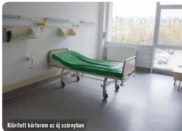
Kiürített kórterem az új szárnyban