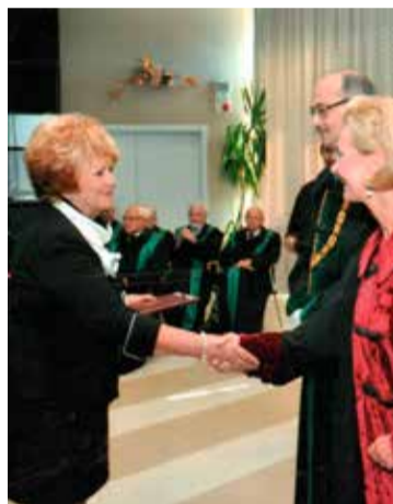
Aranydiplomája átvételekor a Szegei Tudományegyetemen, 2017-ben