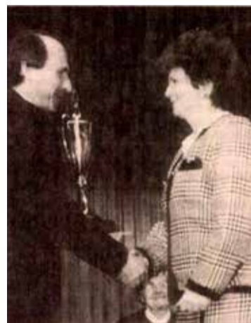
Az országos matematikaverseny vándorszerlegével, 1994-ben