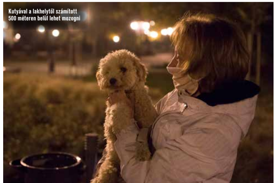
Kutyával a lakhelytől számított 500 méteren belül lehet mozogni