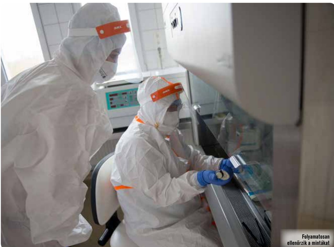
Folyamatosan ellenőrzik a mintákat