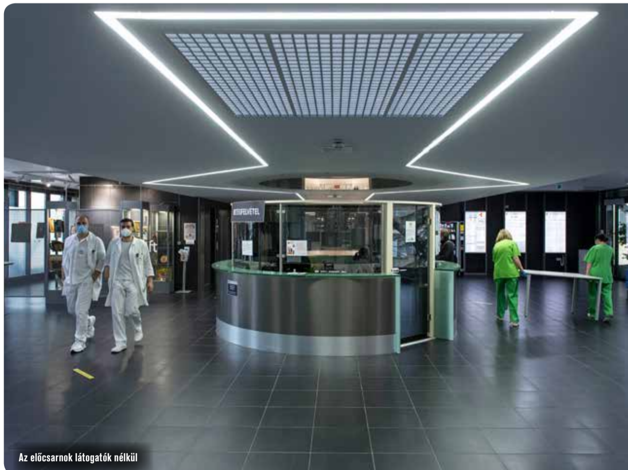
Az előcsarnok látogatók nélkül