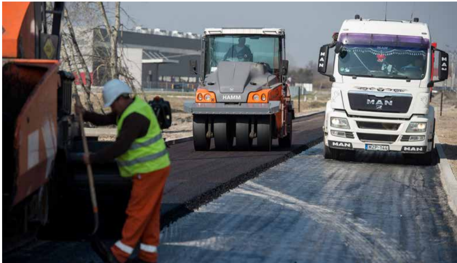
Képek illusztráció

kasz felújítása, valamint önkormányzati kezelésben lévő folytatásának felújítása a 44. számú Kecskemét–Békéscsaba–Gyula elsőrendű főútig, (Lakitelek, Széchenyi krt. belterületi szakasz a gázcserelepi úttal együtt); • 54102. jelű bekötőút 2+079 – 15+600 km szelvények közötti szakasz felújítása (Kiskunfélegyháza és Bugac közötti út); • 5405. jelű összekötő út 10+175 – 28+112 km szelvények közötti szakasz felújítása (Kiskunmajsa és Tázlár közötti út);