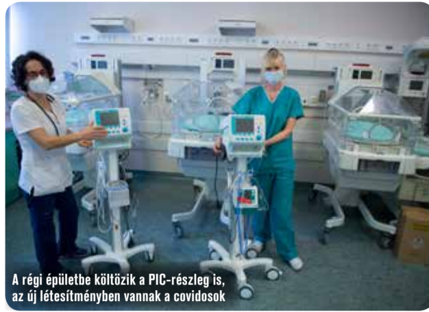
A régi épületbe költözik a PIC-részleg is, az új létesítményben vannak a covidosok

November 16-án a Bács-Kiskun Megyei Oktatókórházba is megérkeztek a honvédségtől azok a munkatársak, akik segítik a koronavírus-járvány elleni védekezést. A 19 honvéd feladatait civil végzettségük és tapasztalataik, illetve az eddig végzett feladataik figyelembevételével határozták meg. Ezek alapján elsősorban adminisztrációs területen, csomagszállításban, raktározási feladatokban, általános rendszertani feladatokban vesznek részt, illetve a belépő pontokon segítik a kórházba érkezőket.