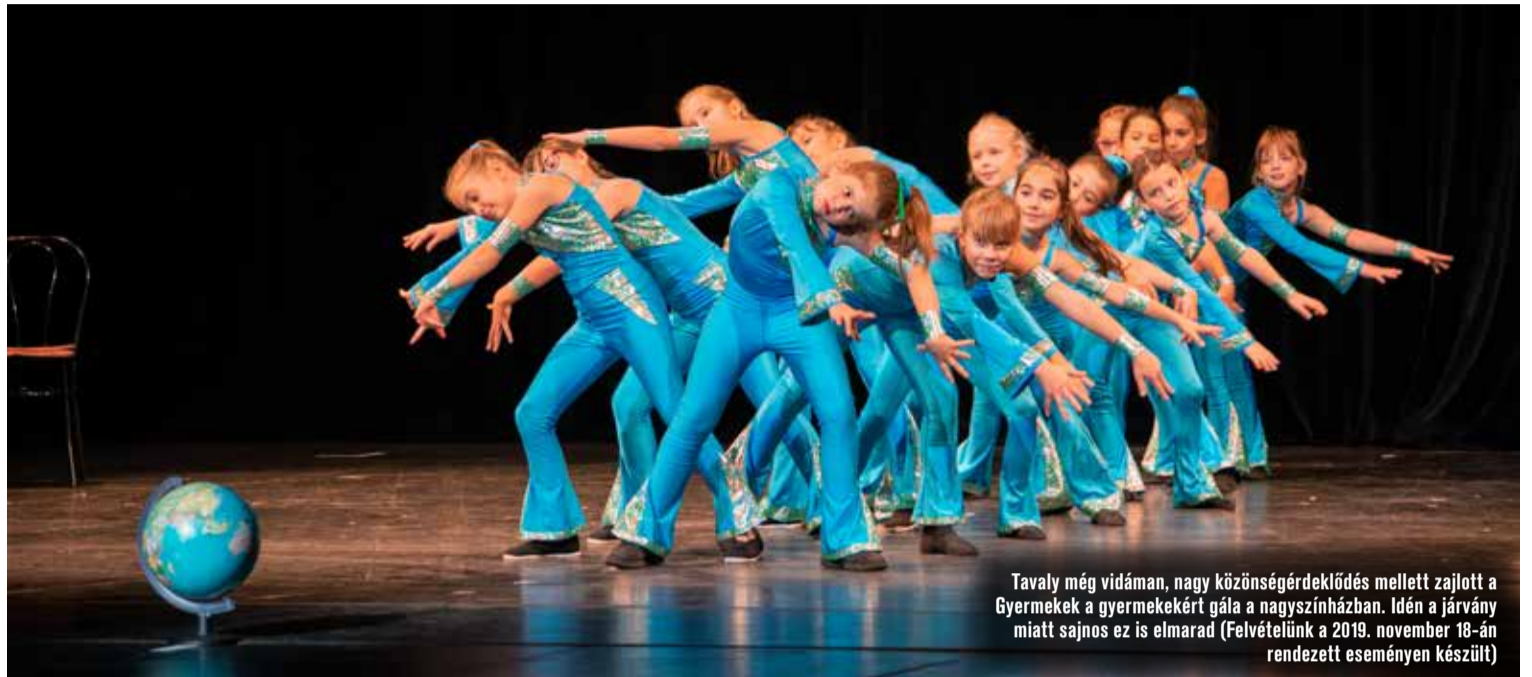
Tavaly még vidáman, nagy közönségérdeklődés mellett zajlott a Gyermek a gyermekért gála a nagyszínházban. Idén a járvány miatt sajnos ez is elmarad (Felvételünk a 2019. november 18-án rendezett eseményen készült)