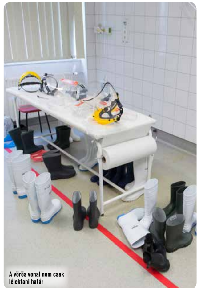
A vörös vonal nem csak lélektani határ