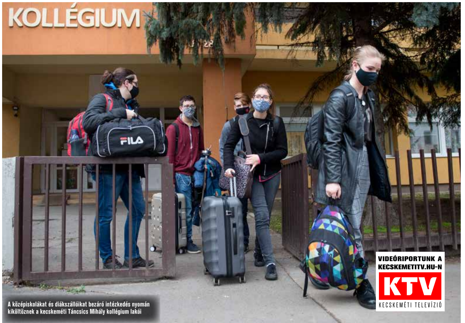
A középiskolákat és diákszállókat bezáró intézkedés nyomán kiköltöznek a kecskeméti Táncsics Mihály kollégium lakói

– Ha esetlegesen figyelmen kívül hagyják a maszkot, vagy nem tartják be a kötelező távolságtartás szabályait, azt felszólítás hatására azonnal pótolják – nyilatkozta