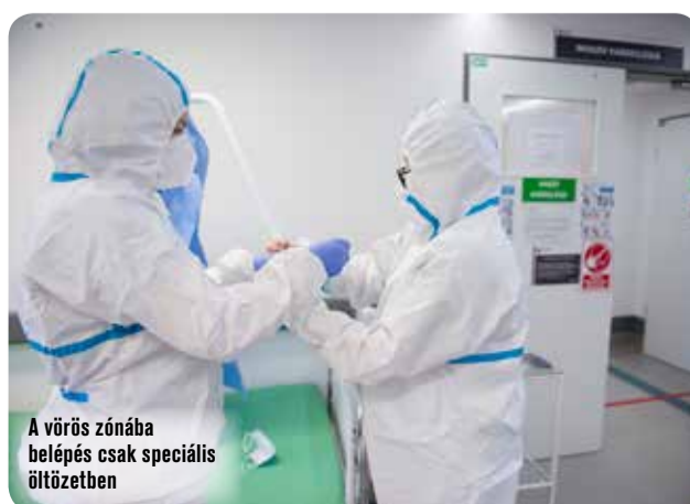
A vörös zónába belépés csak speciális öltözetben