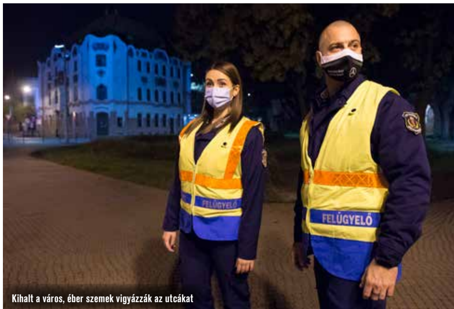
Kihalt a város, éber szemek vigyázzák az utcákat

Mindenki figyelmeztetéssel ússza meg a kalandot, de cserébe meg kell hallgatniuk, hogy miért fontos ennek a szabálynak a betartása, és legközelebb milyen súlyos következményekkel jár majd, ha nem veszik komolyan a kijárási tilalmat. 10.30-kor még egy nagyobb hullámban elvonul a Mercedes-gyár második műszakja, majd siri csend borul a városra. Egy lélek se mozdul reggelig.