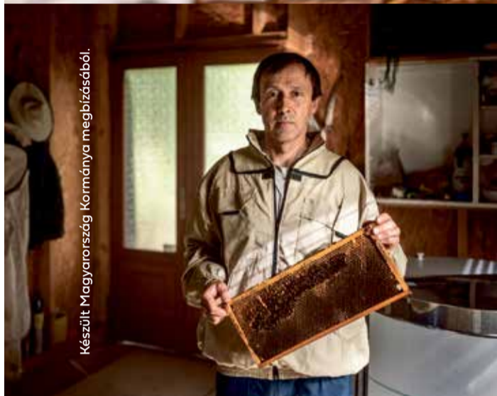
Készült Magyarország Kormányára megbízásból.