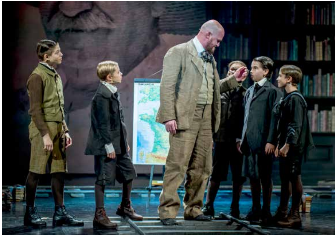
Fotó: Ujvári Sándor

vitték színre, szinte előre garantálható sikerrel. Nagy Viktor rendező szerint kézenfekvő a siker magyarázata: „Nagyon jó passzban volt a zeneszerző is meg a szövegíró is, amikor megírták ezt a darabot. Rettenetesen jól ráéreztek a hangulatára, nagyszerű dramaturgiája van, azt gondolom, hogy nem véletlenül játszották ezt az országban nagyon sok színház, vidéken is és a fővárosban egyaránt.”