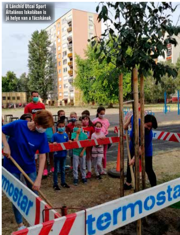
A Lánchíd Utcai Sport Általános Iskolában is jó helye van a fászkának

A csemetek osztására az időjárás függvényében, várhatóan október végétől kerül sor a KEFAG Zrt. Juniperus Parkerdesztében.