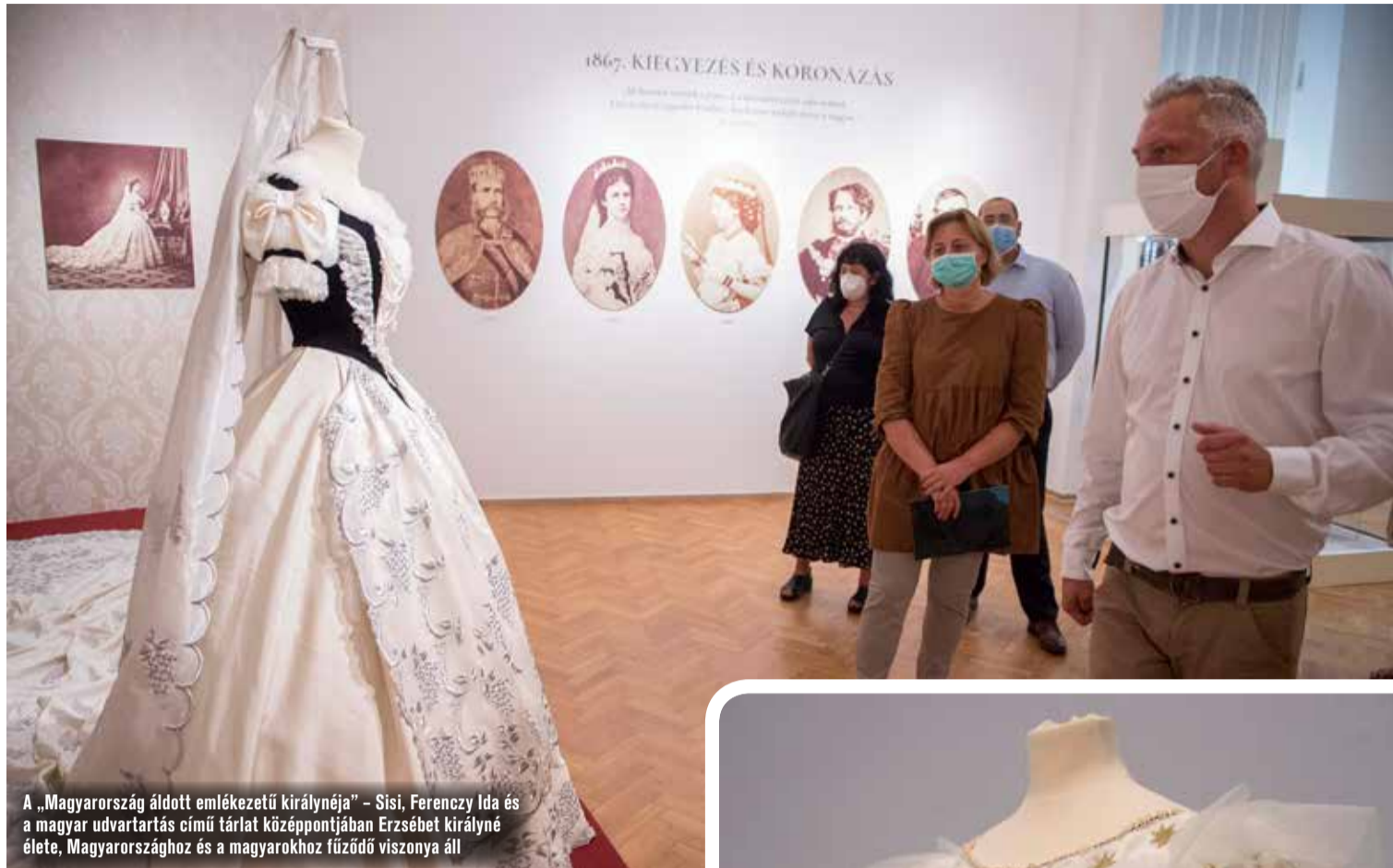
A „Magyarország áldott emlékeztető királynéja” – Sisi, Ferenczy Ida és a magyar udvartartás című tárlat középpontjában Erzsébet királyné élete, Magyarországhoz és a magyarokhoz fűződő viszonya áll

A tárlat nem pusztán történelmi kiállítás, hanem a királyi család és az