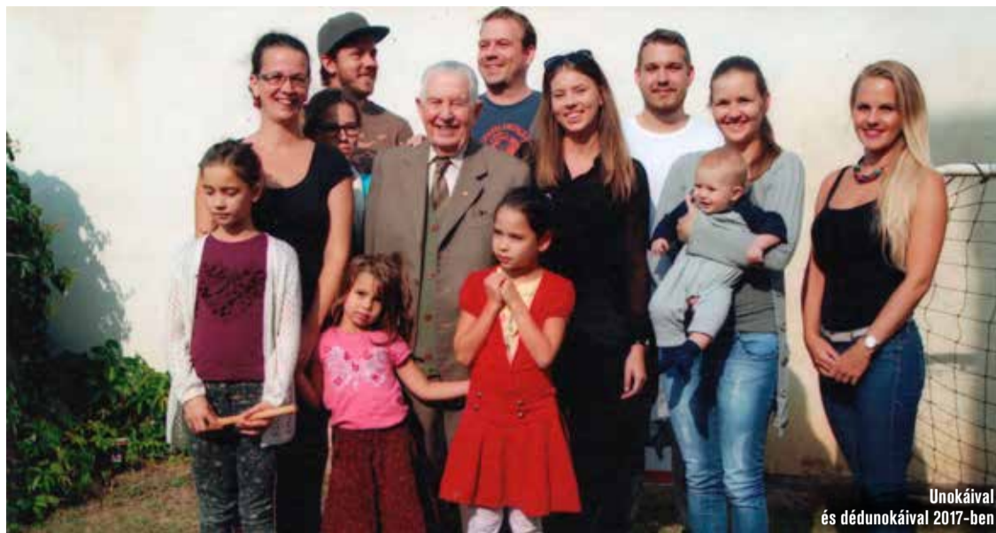
Unokáival és dédunokáival 2017-ben