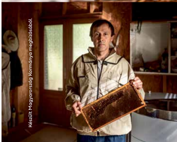
Készült Magyarország Kormányának megbízásából.