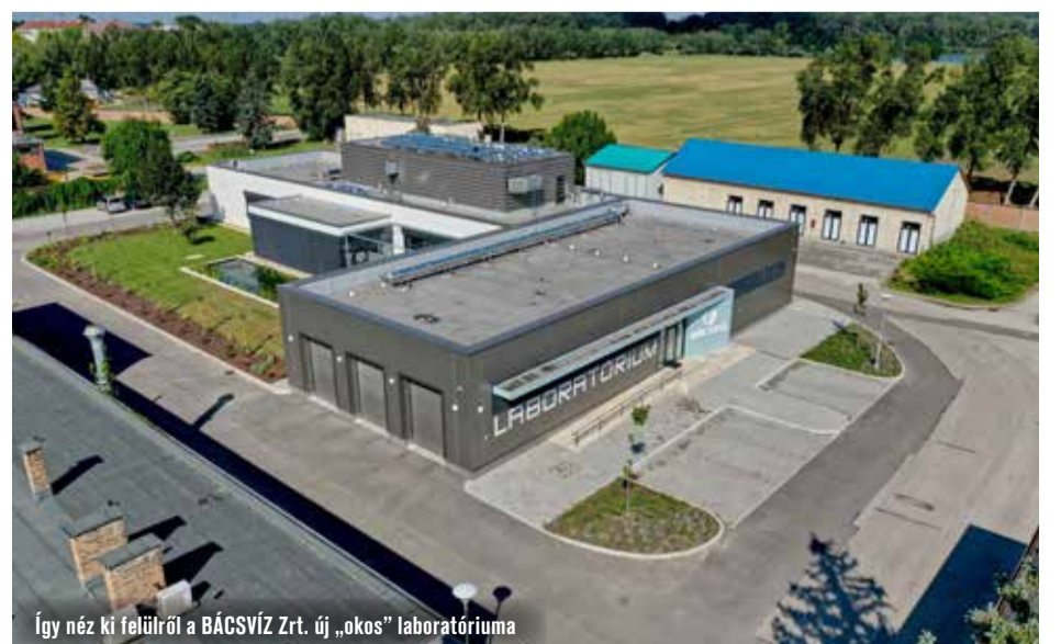
Így néz ki felülről a BÁCSVÍZ Zrt. új „okos” laboratóriuma