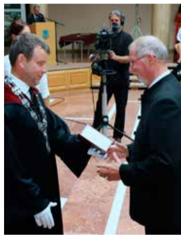
Aranydiplomáját 2019-ben vette át a Pannon Egyetemen

Közel állnak hozzám a 2007 óta működő Városi Civil Kerekasztal célkitűzései, idén társelnökként igyekszem az ott folyó munkát is erősíteni. Épp a napokban tartottuk meg immár 13. alkalommal az úgynevezett Városi Civil Korzót, a programsorozat keretein belül erősítettük meg a Kecskemét város vezetésével 10 évvel ezelőtt kötött együttműködési megállapodást is.