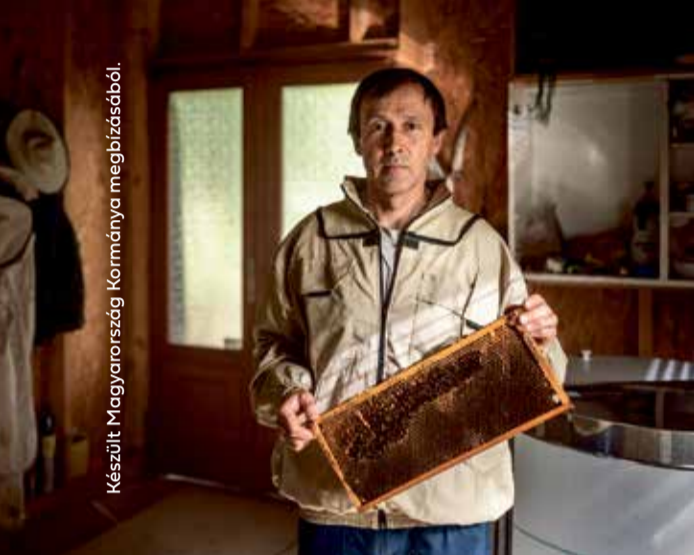
Készült Magyarország Kormányának megbízásából.