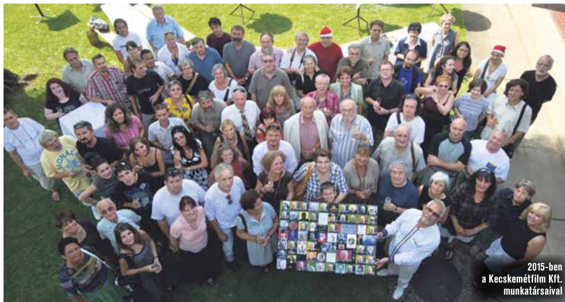
2015-ben a Kecskemétfilm Kft. munkatársaival