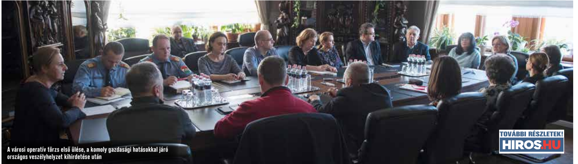
A városi operatív törzs első ülése, a komoly gazdasági hatásokkal járó országos veszélyhelyzet kihirdetése után