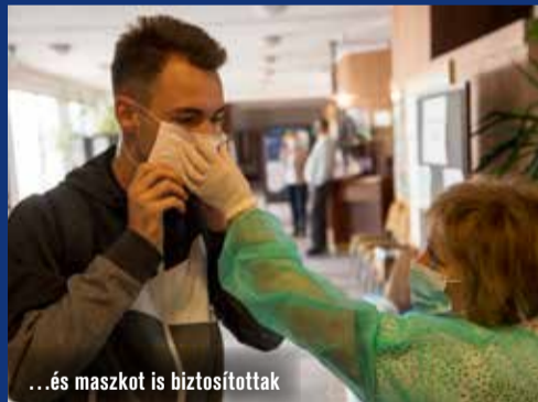
...és maszkot is biztosítottak