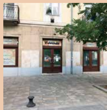
Kecskemét felújított főutcáján, a Rákóczi út 22. szám alatt 173 m 2 -es üzlethelyiség utcafronti bejárattal kiadó.