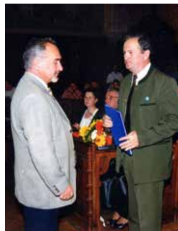
A Kecskemét Város Környezetvédelméért Díjat is átvehette