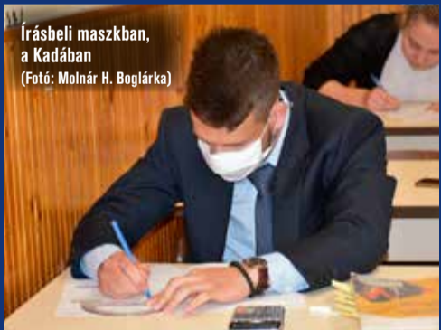
Írásbeli maszkban, a Kadában