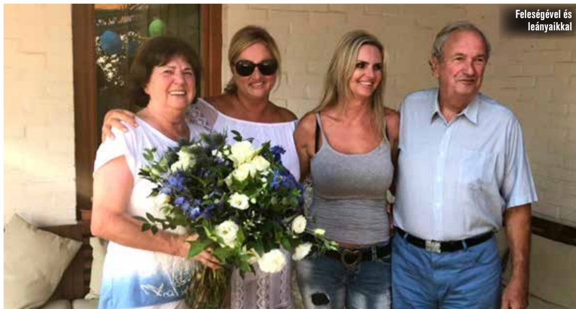
Feleségével és leányaikkal