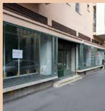
Kecskemét belvárosában, az Arany J. u. 8. szám alatt 136 nm-es üzlet, szociális helyiségekkel kiadó.