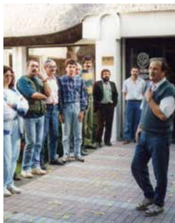
A Kiskunsági Nemzeti Park igazgatójaként, előadás közben