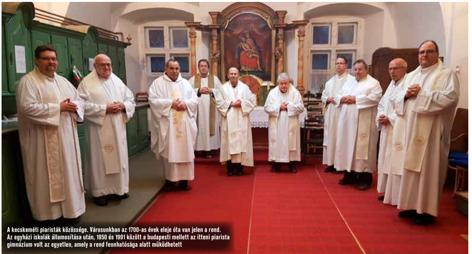
A kecskeméti piaristák közössége. Városunkban az 1700-as évek eleje óta van jelen a rend. Az egyházi iskolák államosítása után, 1950 és 1991 között a budapesti mellett az itteni piarista gimnázium volt az egyetlen, amely a rend fennhatósága alatt működhetett