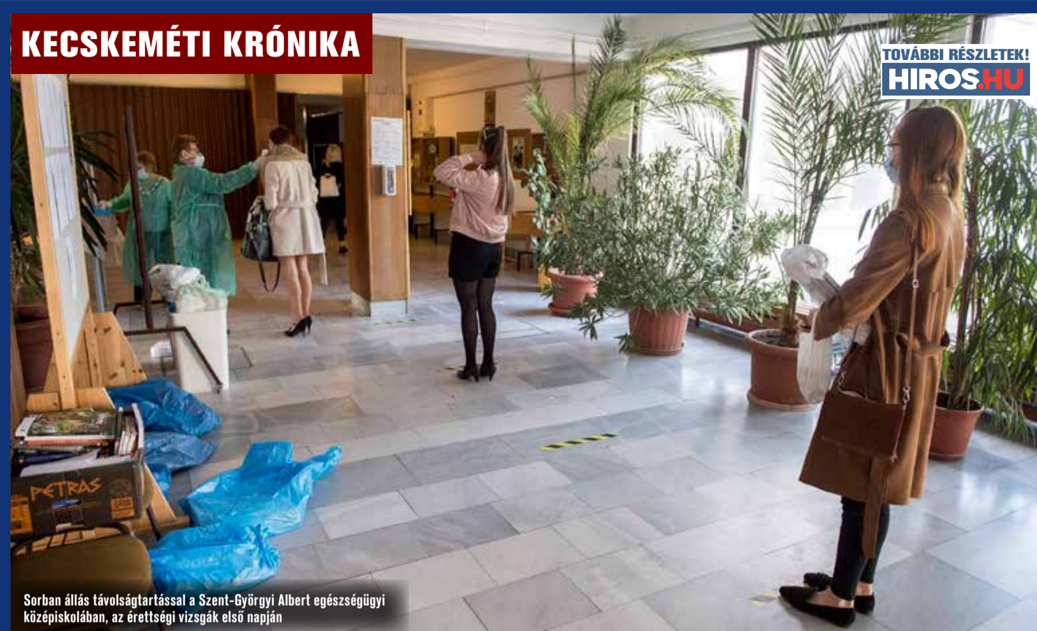
Sorban állás távolságtartással a Szent-Györgyi Albert egészségügyi középiskolában, az érettségi vizsgák első napján