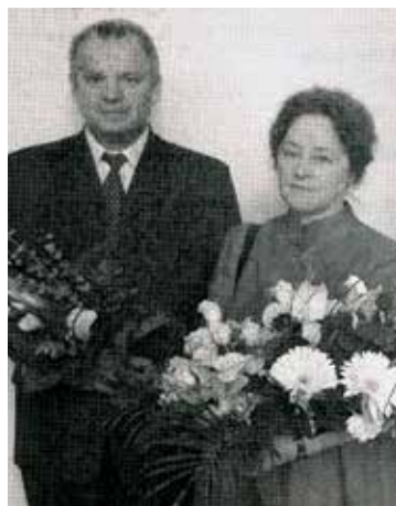
Az Év Kecskeméti Köztisztviselője cím átvétele után