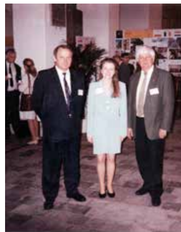
Hollandiában, egy PHARE-pályázat záró konferenciáján

megjelentek a vállalkozások, a multik. Az építetők személye is megváltozott. A városfejlesztés sokszereplőssé vált, de az építés tárgyában is fordulat állt be. Felerősödött a magántulajdon védelme, kialakult az önkormányzatiság. Ezek és még sok más tényező megkövetelte az önkormányzattól az új stratégiák, programok, tervek készítését, a munkamódszerek átalakítását.