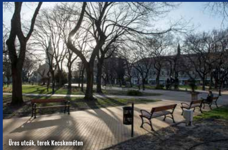
Üres utcák, terek Kecskeméten

A Városi Operatív Törzs további fontosabb döntései az 5. oldalon olvashatók.