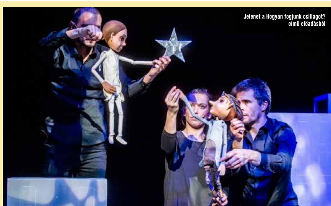
Jelenet a Hogyan fogjunk csillagot? című előadásból

Abban pedig biztosak lehetünk, hogy ameddig nem áll vissza a régi rend az életünkben, addig is számíthatunk kedvenc DJ-inkre, mint mondták, nincs megállás, a show tovább folytatódik.