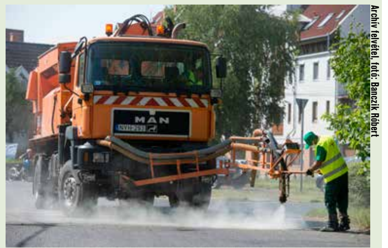
Archív felvétel, fotó: Banaszik Róbert

Széchenyi téri buszmegállónál. A városüzemeltetési cég emellett elvégzi majd a KRESZ-táblák karbantartását, illetve kihelyezését is a Szent Miklós utcában, de sor kerül az Ipoly utcai parkolók felfestésére is. A társaság április 3-ig tervezi ugyanakkor több földes útszakasz karbantartását is a Könyves Kálmán krt., Nyírfá utca (Talfája) térségében, a Reptér mögötti úton, a Julianus barát utcában, valamint a Nekcsei Demeter utcában.