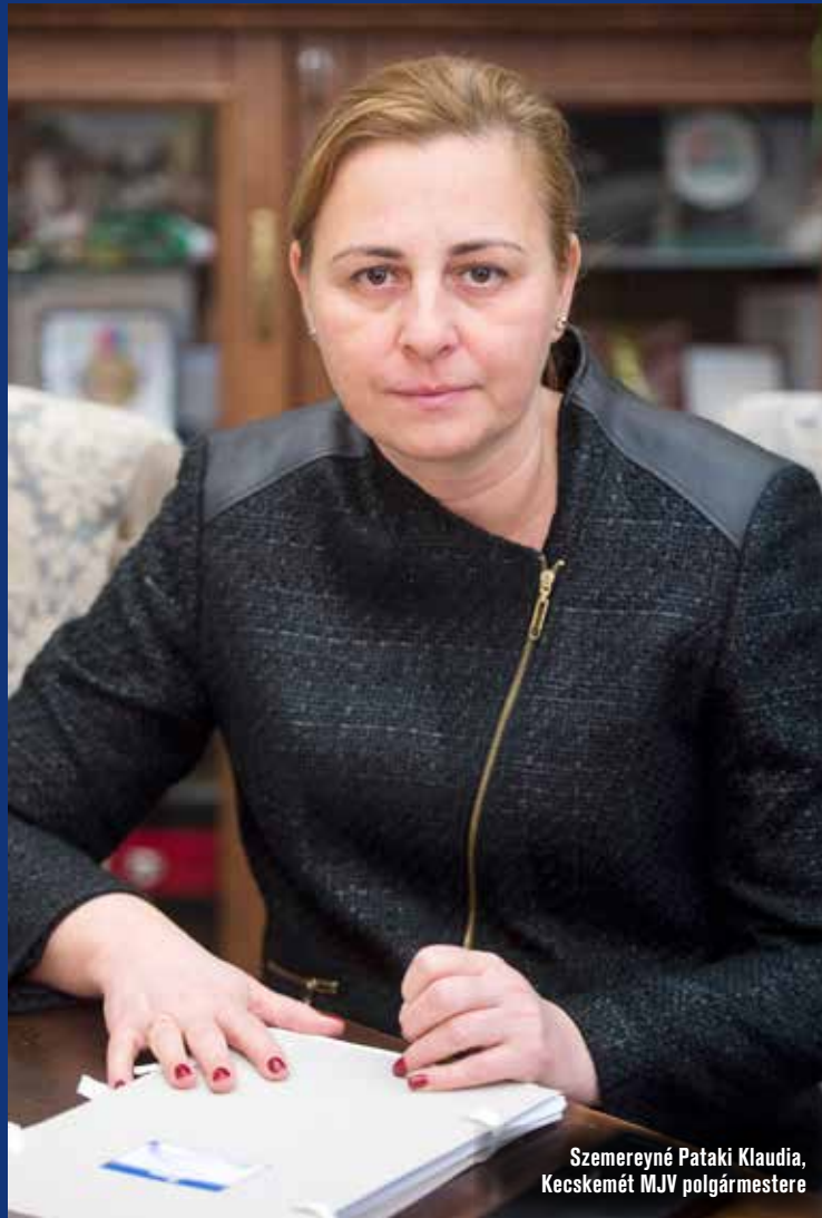
Szemereyné Pataki Klaudia, Kecskemét MJV polgármestere

A digitális oktatásról szólva a polgármester elmondta, mind a tanárokat, mind a diákokat dicséret illeti, hiszen példamutatónan kialakították Kecskeméten is a távoktatást. A Klebelsberg Központ által leadott igényeket felmérve az önkormányzat a hiányzó technikai eszközök beszerzéséről is gondoskodott.