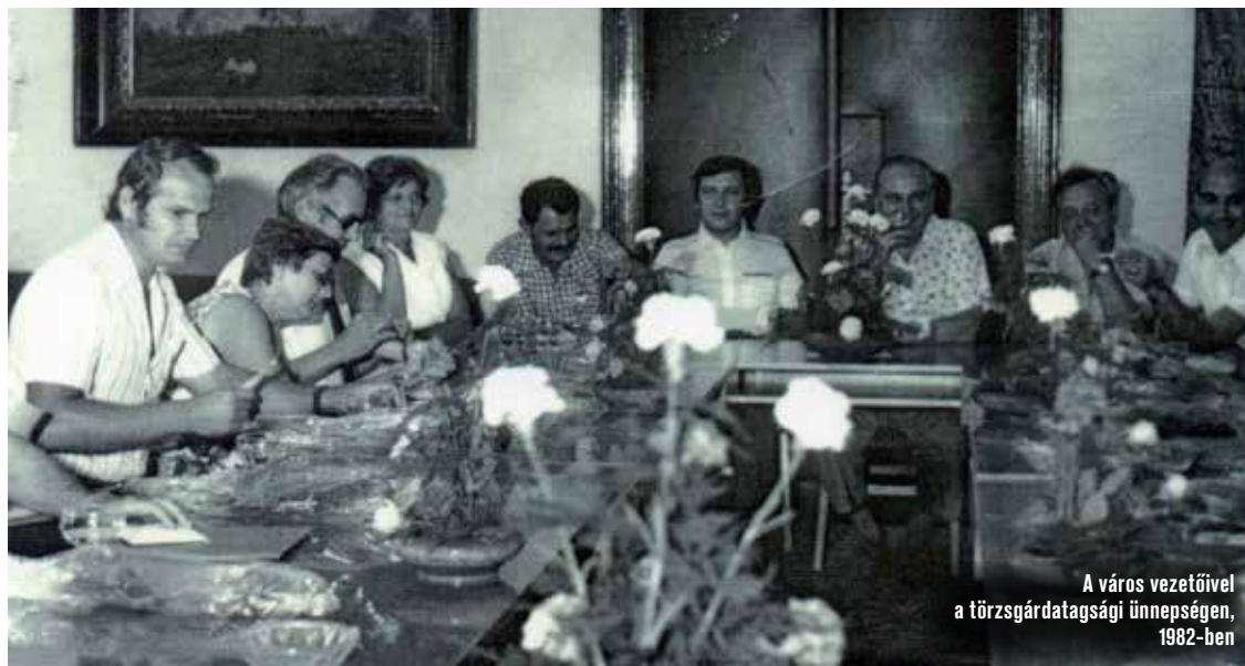
A város vezetőivel a törzsgárdatagsági ünnepségen, 1982-ben