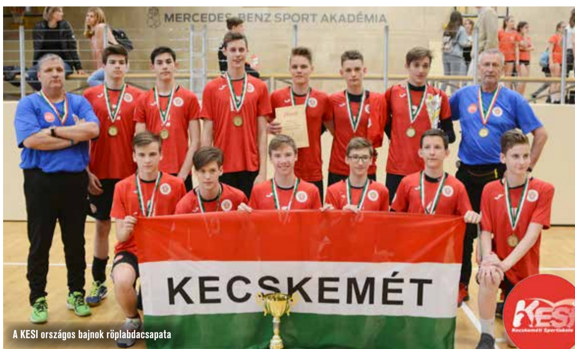
A KESI országos bajnok röplabdacsapata

A látvány csapatsportágak támogatását lehetővé tévő sportfejlesztési stratégia bevezetése jelentősen segí-