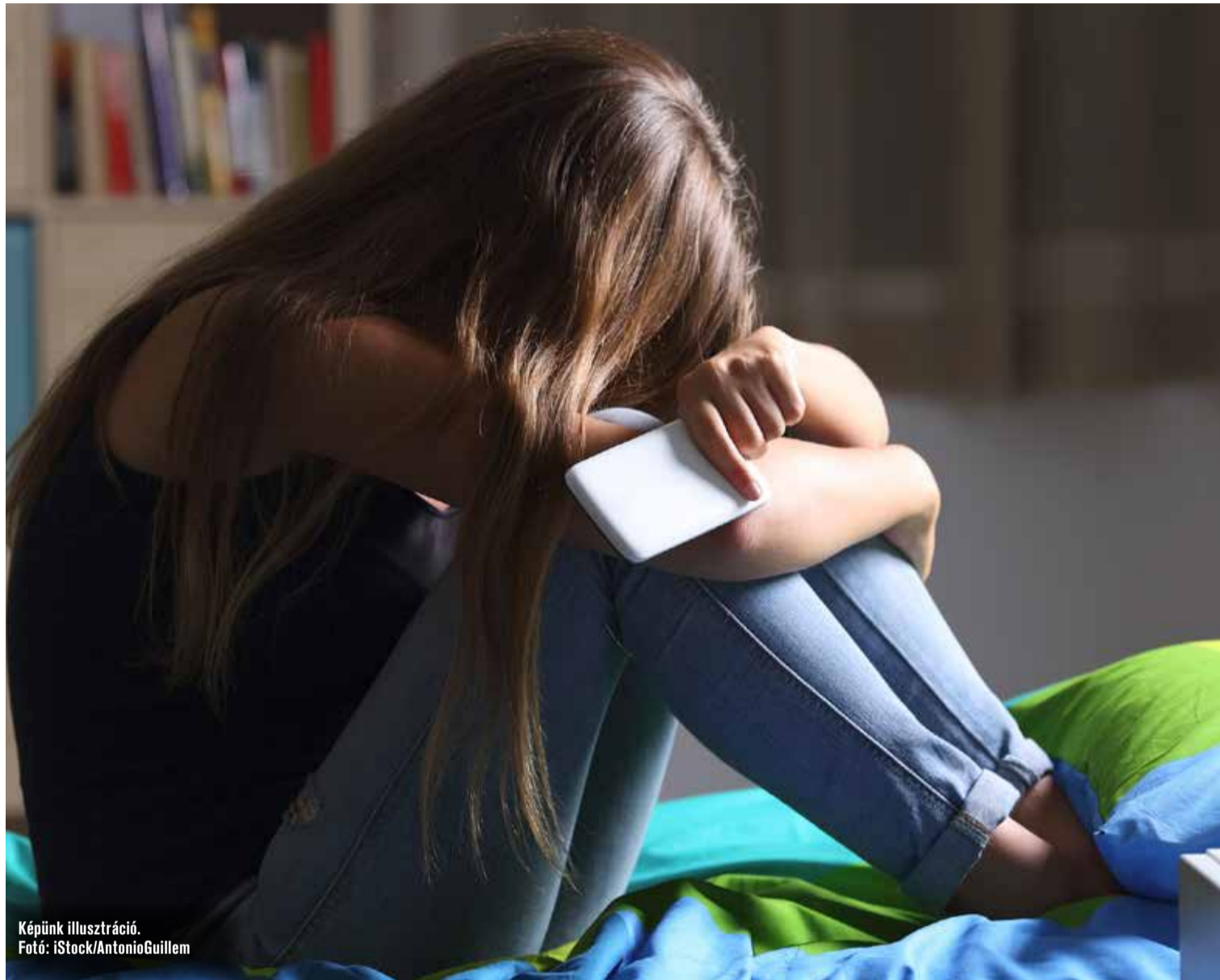
Képiünk illusztráció.

Budapestről költöztünk egy kis településre, lányom pedig szeretne volna a közösségi médián keresztül tartani a kapcsolatot ottani társával, barátaival. Közösen hoztuk létre Facebook-profilját, megbeszéltük, hogyan használhatja. Megbeszéltük azt is, amíg felnőtt nő nem lesz, bármikor bárholnan ránézhetek, és rá is néztem rendszeresen az adatlapjára, a beszélgetéseire. Az Instagram-regisztrációjához elég egy Facebook-belépés. Én pedig egyedül azzal nem voltam tisztában, hogy az Instagram is elindított egy csetes platformot, ami asztali gépről nem elérhető, pedig az ellenőrzéshez én csak azt használtam. Két héttel az indulás után így pedig már meg is történt a baj.