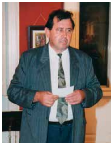
Az alkotóház egyik kiállításának megnyitóján