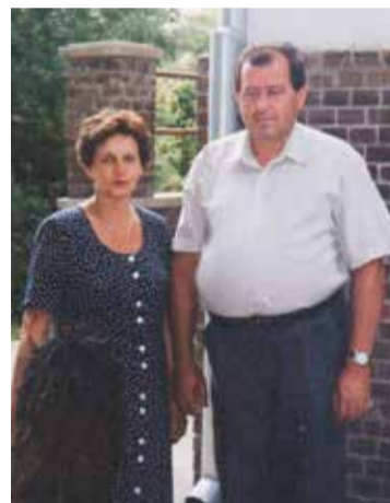
Feleségével az alkotóház épülete előtt