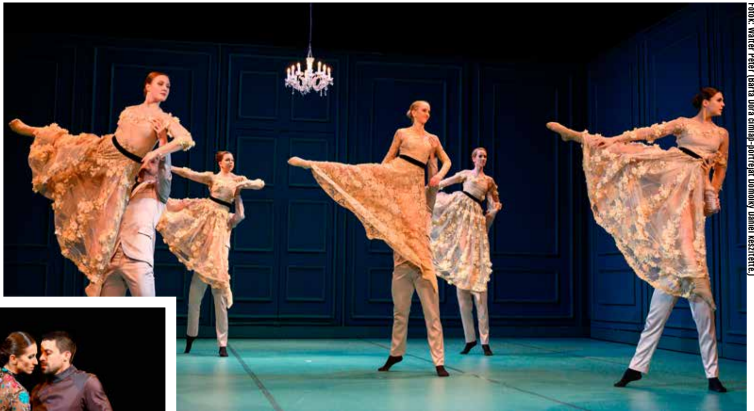
Fotók: Walter Péter (Barta Dóra a címlap-portróját Dömölky Daniel készítette.)

Nem először álmot merészt Barta Dóra, a Kecskemét City Balett vezetője. Ezúttal a nagyszínházi bérletso-