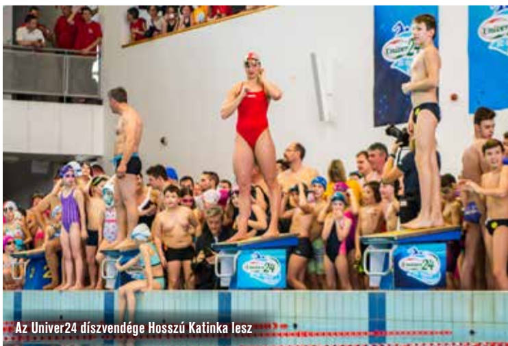
Az Univer24 díszvendége Hosszú Katinka lesz

Február 16-án, vasárnap Családi napra várják a kicsiket, és velük a nagyokat, 14-18 óra között. Ezen a napon nemcsak ingyenes programokon lehet részt venni, de egész nap kedvezményes áron kaphatók a családi belépők. Lesz itt minden, amitől szülő és gyermek igazán jól érzi magát: játékos ügyességi feladatok képzett játékanimatorokkal, sorversenyek, kézműves foglalkozások várnak mindenkit. Pardon, nem csak a parton és a gyerekmedencében zajlanak ám az események! A korlátlan vízben lubizolás mellett, a TST Tánc és World Jumping Stúdió jóvoltából aquafitness is várja a vendégeket.