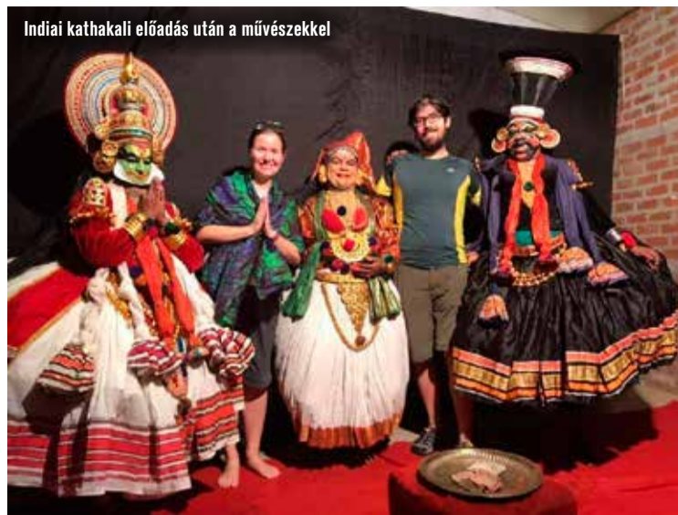
Indiai kathakali előadás után a művészekkel