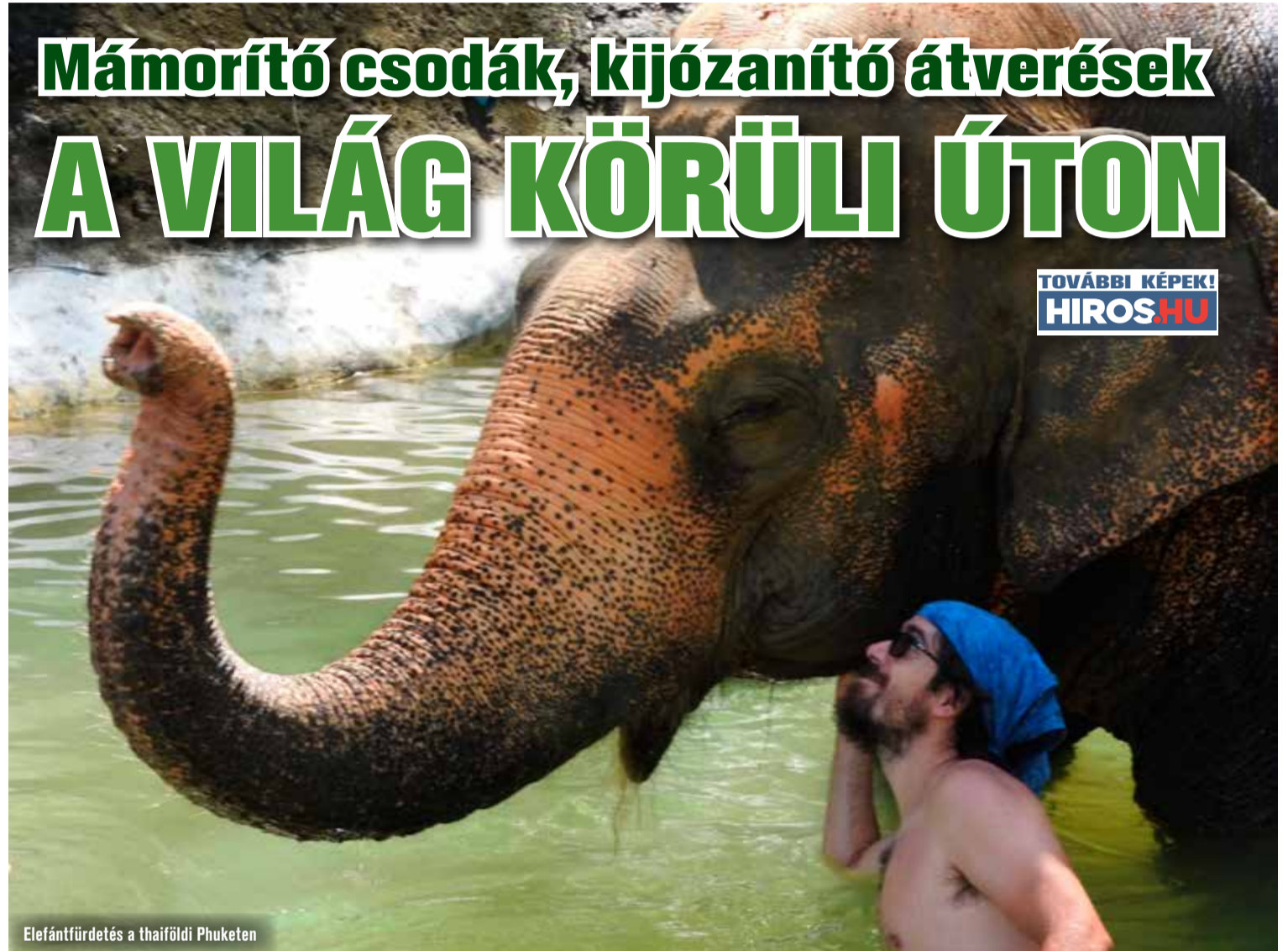
Elefántfürdetés a thaiföldi Phuketen

ták ezt az elképzelésünket, hogy ez a pár év nem karriertörés lesz, hanem csak gazdagabbak leszünk tőle. Bár még csak bő 160 napja utazunk, már érezzük az áldásos hatását az útnak és sokat tanulunk minden egyes nappól.