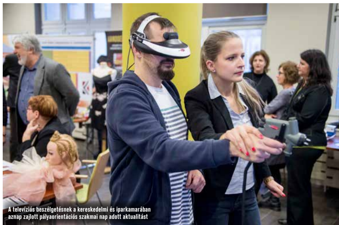
A televíziós beszélgetésnek a kereskedelmi és iparkamarában aznap zajlott pályaelemző szakmai nap adott aktualitást

Mind pénzben, mind pedig lehetőségekben is többet nyújt tehát a 2020/2021-es tanévtől a szakképzés. Érdemes minél több információt szerezni, és sokat beszélgetni a gyerekekkel céljaikról, elképzeléseikről, annak érdekében, hogy megalapozott döntést tudjanak hozni.