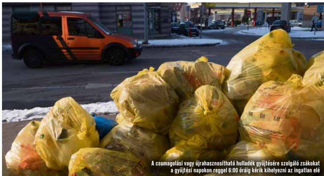
A csomagolási vagy újrahasznosítható hulladék gyűjtésére szolgáló zsákokat a gyűjtési napokon reggel 6:00 óráig kérjük kihelyezni az ingatlan elé

Zsákok begyűjtésének módja: A csomagolási hulladék gyűjtésére szolgáló zsákokat (újrahasznosítható hulladék) a gyűjtési napokon reggel 6:00 óráig szíveskedjen kihelyezni az ingatlan elé, mert a hulladékgyűjtő gépjármű elhaladása után kihelyezett zsákokat nem áll módunkban elszállítani! Amennyiben háztartási vegyes hulladék, lom, üveg vagy nem megfelelő típusú, illetve szennyezett hulladék kerül kihelyezésre, Társaságunk jogosult megtagadni annak elszállítását. A mindenkori begyűjtéssel egyidejűleg munkatársaink annyi cserezsákot adnak, amennyi kihelyezésre