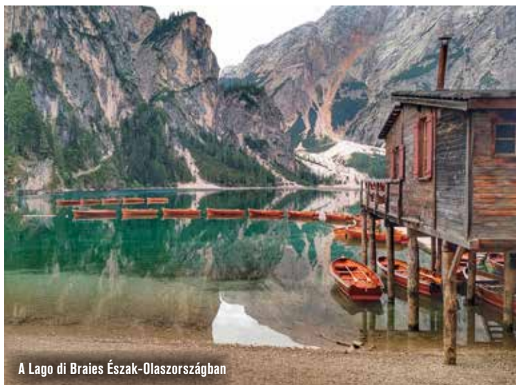
A Lago di Braies Észak-Olaszországban