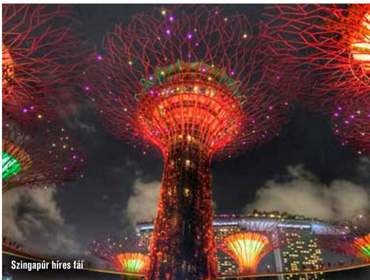
Szingapúr híres fá