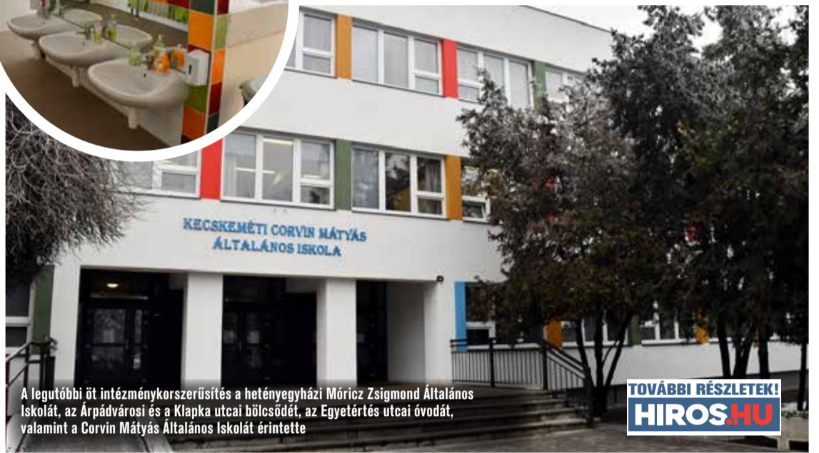
A legutóbbi öt intézménykorszerűsítés a hetényegyházi Móróc Zsigmond Általános Iskolát, az Árpádvárosi és a Klapka utcai bölcsődét, az Egyetértés utcai óvodát, valamint a Corvin Mátyas Általános Iskolát érintette