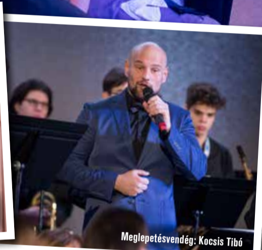
Meglepetésvendég: Kocsis Tibor