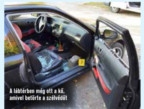
A lábtérben még ott a kő, amivel betörte a szélvédőt

vitt el semmit. Ezt követően a motorháztetőt nyitotta fel, azonban a benne lévő akkumulátort nem sikerült eltulajdonítania. A gyanúsított még ugyanezen a napon két másik személygépkocsi ablakát is betörte, majd az egyik autóból 16 ezer forint összegben motorolajat és három adathordozót vitt el, míg a másiktól a kalaptartó felfeszítését és a csomagtartó átkutatását követően sem tulajdonított el semmit. Néhány nap múlva ismét betörte egy autó szélvédőjét és egy 10 ezer forint értékű rádiómagnó-fejegyiséget lopott el. A gyanúsított a