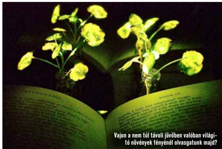
Vajon a nem túl távoli jövőben valóban világitó növények fényénél olvasgatunk majd?

adatát előadásában Frankó Csuba Dea –, hogy mit jelent embernek lenni a mesterséges intelligencia, a robotika, a szintetikus biológia korában, akkor, amikor a megszerzett tudás elavulási ideje mindössze öt év. A mintáink ugyanis, amelyeket döntően a 20. századból vagy még korábbról hozunk magunkkal, nem fognak működni a következő évtizedekben, mint ahogyan sok esetben már most sem működnek.