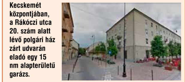
Kecskemét központjában, a Rákóczi utca 20. szám alatt lévő polgári ház zárt udvarán eladó egy 15 nm alapterületű garázs. További információ a www.kikfor.hu weboldalon, az „ELADÓ INGATLANOK” menüpont alatt érhető el.