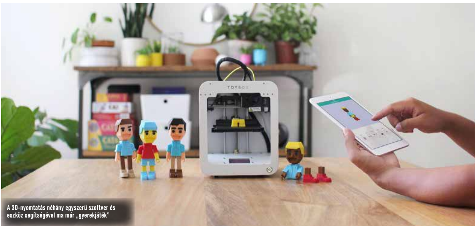
A 3D-nyomatás néhány egyszerű szoftver és eszköz segítségével ma már „gyerekjáték”