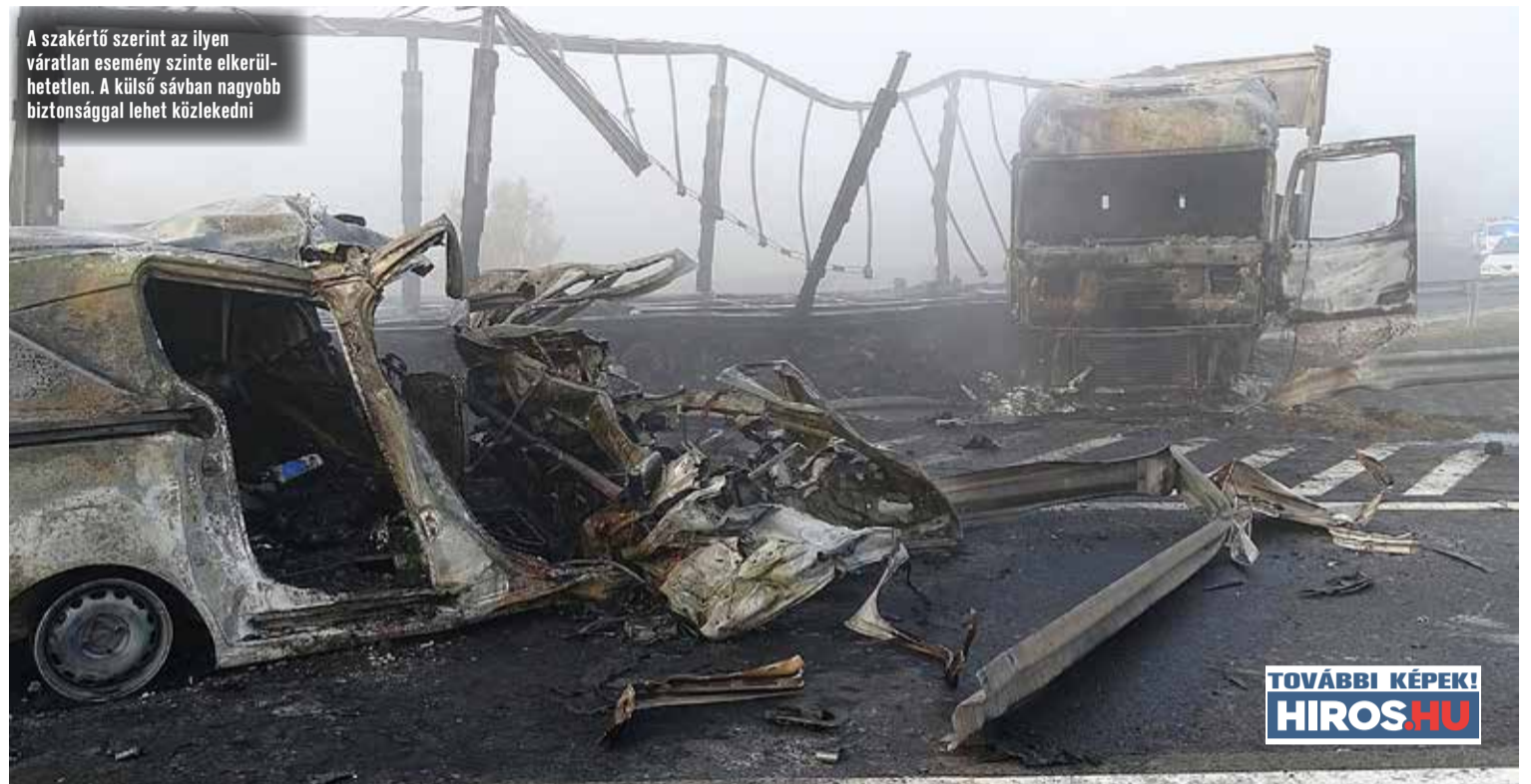
A szakértő szerint az ilyen váratlan esemény szinte elkerülhetetlen. A külső sávban nagyobb biztonsággal lehet közlekedni

MŰSZAKI HIBA OKOZHATTA A HÉTFŐ HAJNALI KAMIONOS BALESETET