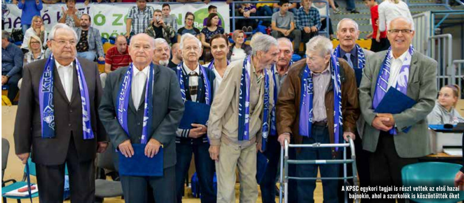
A KPSC egykori tagjai is részt vettek az első hazai bajnokin, ahol a szurkolók is köszöntötték őket

Múlt hét pénteken volt 55 éve, hogy a Kecskeméti Petőfi Sport Club feljutott a férfi kosárlabda élvonalába. Ennek alkalmából a KTE Kosárlabda Klub Kft. múltidéző találkozót rendezett.