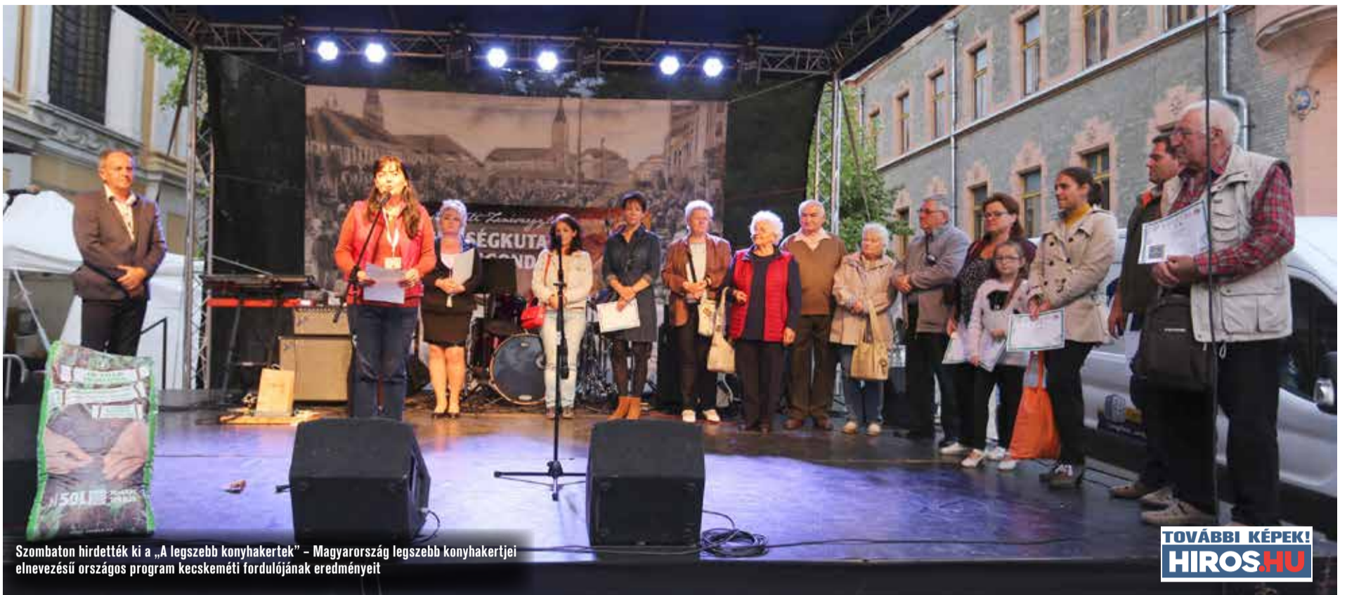
Szombaton hirdették ki a „A legszebb konyhakertek” – Magyarország legszebb konyhakertjei elnevezésű országos program kecskeméti fordulójának eredményeit