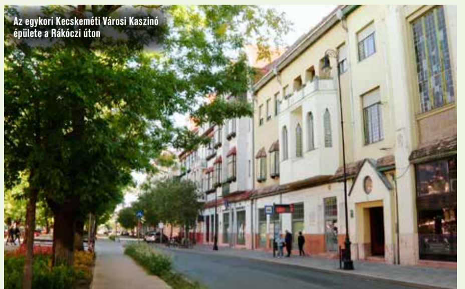
Az egykori Kecskeméti Városi Kaszinó épülete a Rákóczi úton