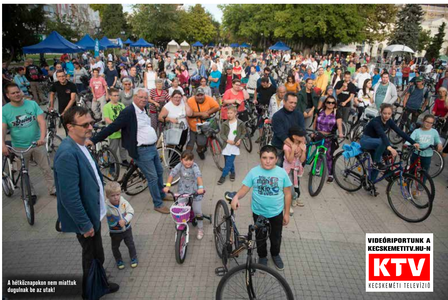
A hétköznapokon nem miattuk dugulnak be az utak!