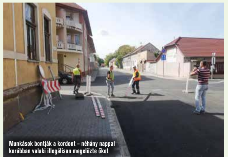
Munkások bontják a kordont – néhány nappal korábban valaki illegálisan megelőzte őket

Szeptember 19-én délután azonban immár a munkások nyitották meg az autók előtt az útszakaszt, amelyen azóta is zavartalan a forgalom. Tudósítónk épp a helyszínen volt, így megörökíthette az utca megnyitását. Az utolsó léceket és útakadályokat is eltávolították a Bem utca végéről. A munkások a forgalmi-rend-változást jelző táblákat is leszerelték, így az autók szabályosan