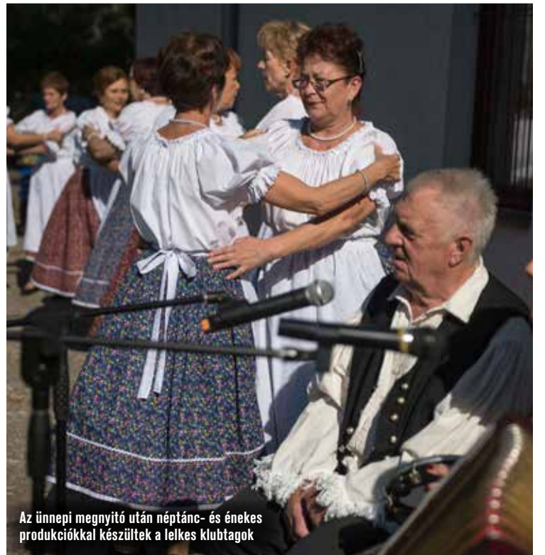
Az ünnepi megnyitó után néptánc- és énekes produkciókkal készültek a lelkes klubtagok

Az ünnepi megnyitó után néptánc- és énekes produkciókkal készültek a lelkes klubtagok. A nap folyamán pedig külön egészségügyi tanácsadón és vérnyomásmérésen vehettek részt a látogatók. A szervezők szeretettel várják a Margaréta Idősök Otthona melletti Nyitnikék Klubba azokat, akik sokat töltenek egyedül az időt, szívesen járnának gyakrabban társaságba, szeretnék aktívan tölteni napjaikat.