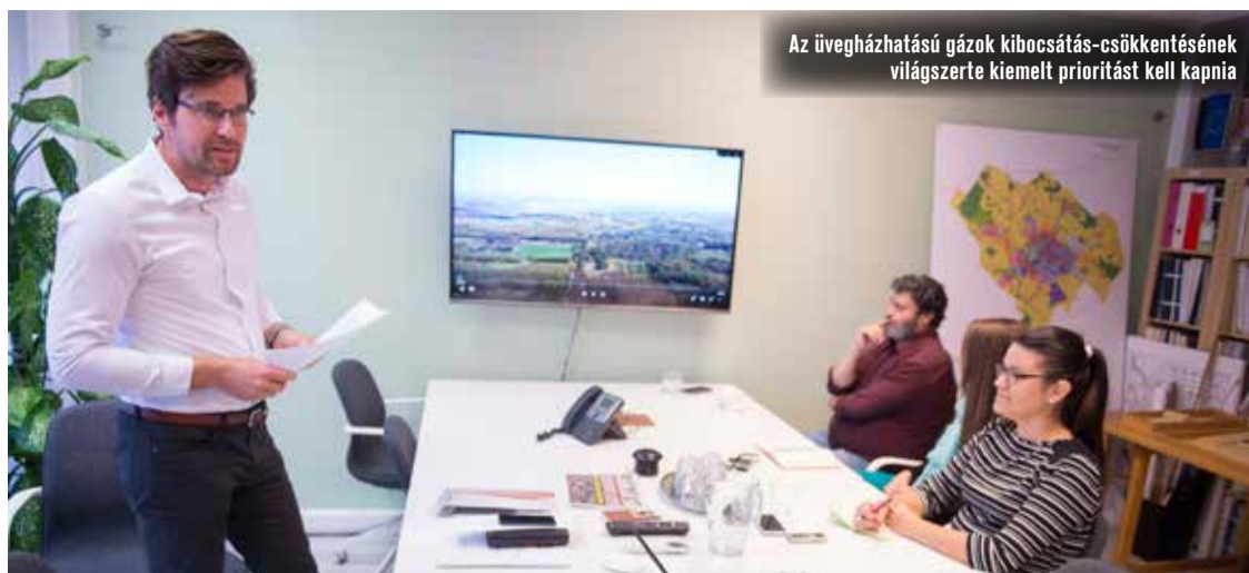
Az üvegházhatású gázok kibocsátás-csökkentésének világszerte kiemelt prioritást kell kapnia