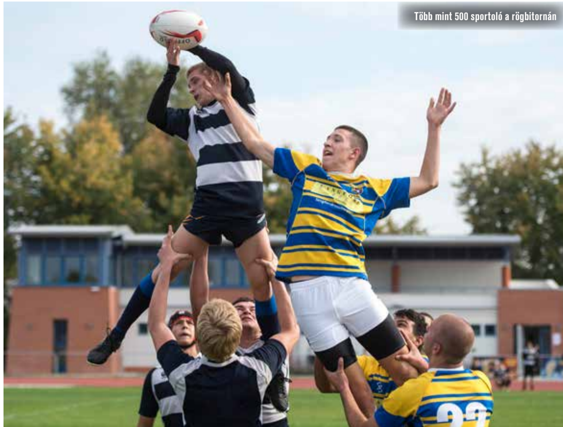
Több mint 500 sportoló a rögbitorán

– Több mint 500 játékos jött el a tornára, mi a tapasztalat, mennyire volt nehéz létrehozni ezt a tornát?