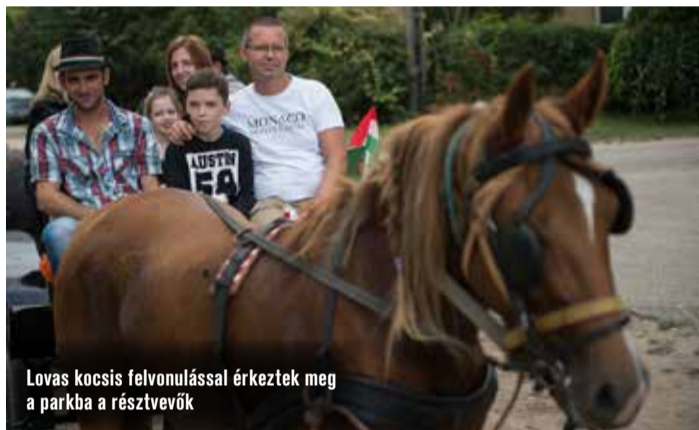
Lovas kocsis felvonulással érkeztek meg a parkba a résztvevők