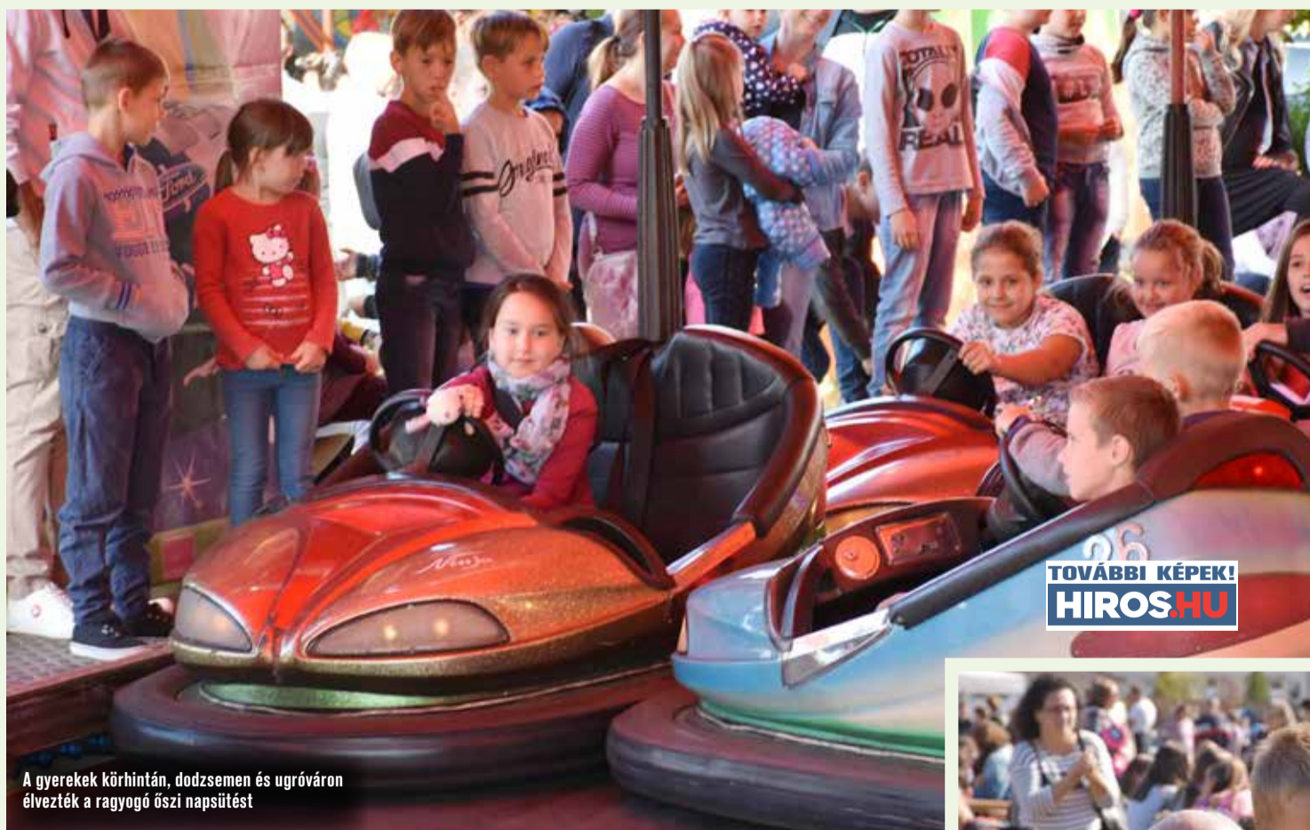
A gyerekek körhintán, dodzsemen és ugróváron élvezték a ragyogó őszi napsütést

rekek pedig a körhintán, dodzsemen és ugróváron élvezték az őszi ragyogó napsütést. A nap további részében is izgalmas programmal várták a mulatság látogatóit. Volt szüreti olimpia, ügyességi játékok, versenyek, óriás fajték, veteránjárműkiállítás és táncbemutató. Az egész napos programokat koncertek és tűzijáték zárta.