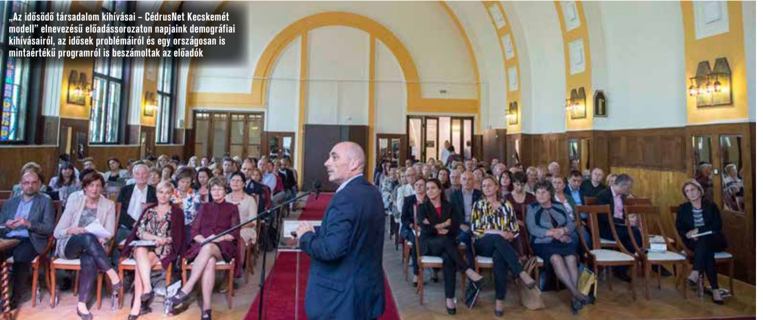
„Az idősödő társadalom kihívásai – CédusNet Kecskemét modell” elnevezésű előadássorozaton napjaink demográfiai kihívásairól, az idősök problémáiról és egy országosan is mintaértékű programról is beszámoltak az előadók

– Amikor családpolitikáról beszélünk, leggyakrabban a gyermekvállalás oldaláról közelítünk a kérdéshez. De egy család barát ország számára a generációk békés, egymást segítő együttélése is fontos – hangsúlyozta az államtitkár.