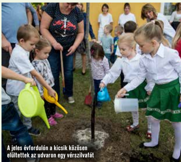
A jeles évfordulón a kicsik közösen elültették az udvaron egy vérszilvafát