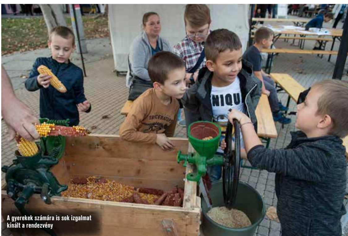
A gyerekek számára is sok izgalmat kínált a rendezvény

tevékenységük meghatározó állomásait, közben különböző foglalkozásokra várták a gyerekeket. A Lakótelepi Gyerekekért Alapítvány és a Gyerkócök Alapítvány környezetvédelmi témákkal készült, a kecskeméti Nyugdíjasok Klubjainak Megyei Jogú Városi Szövetsége baracklekvárfőzésre és kóstolásra invitálta a résztvevőket. A Széktői Nyugi Klub tagjai által a helyszínen főzött baracklekvárt palacsintába töltve kóstolhatták meg a látogatók. A Nemzeti Művelődési Intézet Bács-Kiskun Megyei Igazgatósága a családokat, gyermekeket kívánta megszólítani; óriási kirakóval, értékpiramissal, memóriajátékkal, színezővel készült a programra. A Honvéd Hagyományörző Egyesület jóvoltából pedig a honvéd hagyományörzessel, valamint a kecskeméti repülés- és hadtörténettel ismerkedhettek az érdeklődők.