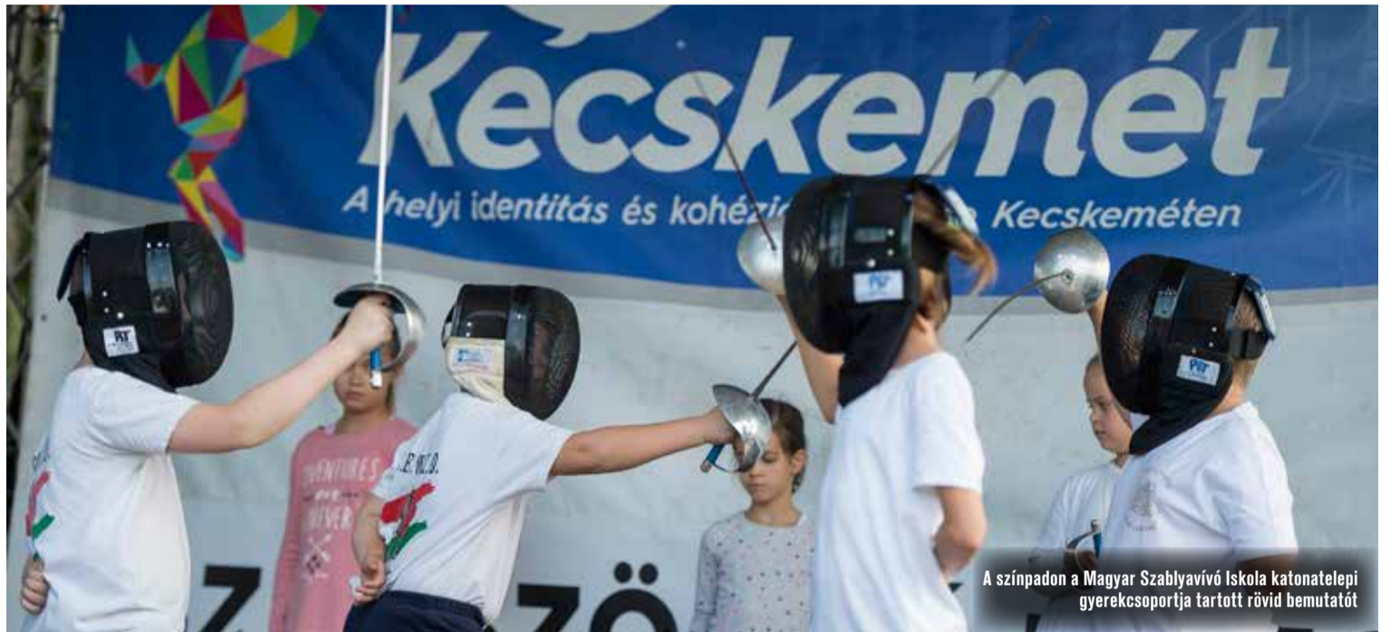
A színpadon a Magyar Szablyavívó Iskola katonatelepi gyereksportja tartott rövid bemutatót