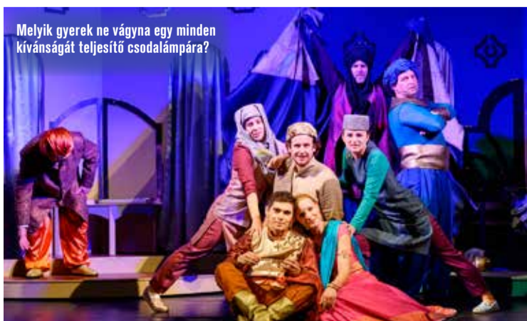
Melyik gyerek ne vágyna egy minden kívánságát teljesítő csodalámpára?

Az Ezeregyéjszaka világába csöppentek a gyerekek szeptember 18-án a kecskeméti Katona József Színházban. A teátrum idei évadának első gyerekelőadását, az Aladdin és a csodalámpát tekinthették meg a kicsik, amelyet