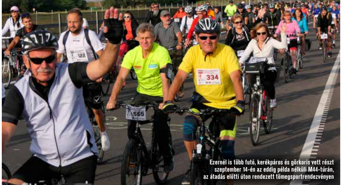
Ezernél is több futó, kerékpáros és görkoris vett részt szeptember 14-én az eddigi példa nélküli M44-túrán, az átadás előtti úton rendezett tömegsportrendezvényen

nus végére, a fűrjesi csomópont pedig 2021 elejére készül el.