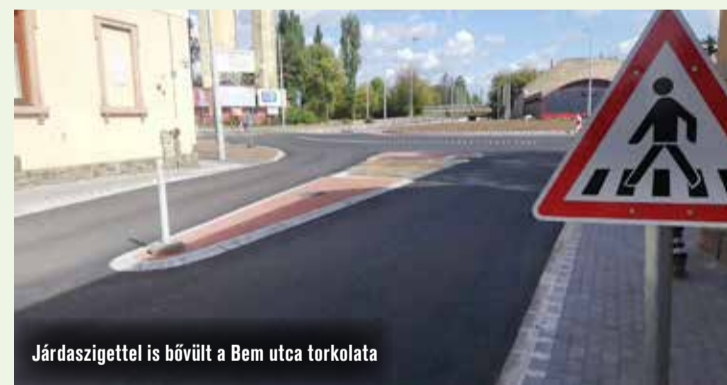
Járdaszíggel is bővült a Bem utca torkolata

Mikor a járókelők kérdőre vonták, azt mondta, hogy a közút embere és az út már készen van. Arról, hogy miért járt el önkényesen, senki nem tudott biztosat. Hivatalosan csak szeptember 19-én nyitották meg a Bem utca új turbókörforgalom felőli végét. Az autósoknak érdemes figyelni a gyalogosokra is, hiszen eggyel több gyalogátkelő jött létre a kereszteződésben.