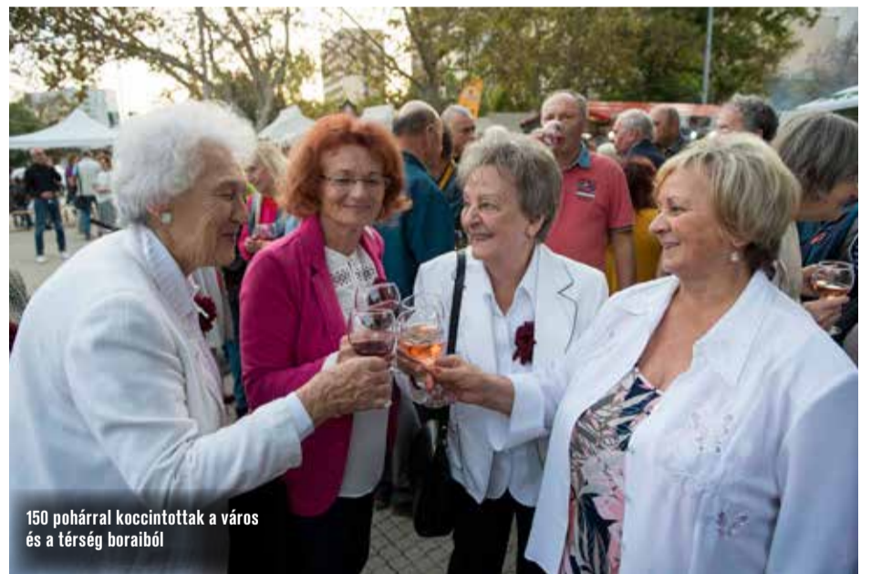
150 pohárral koccintottak a város és a térség boraiból