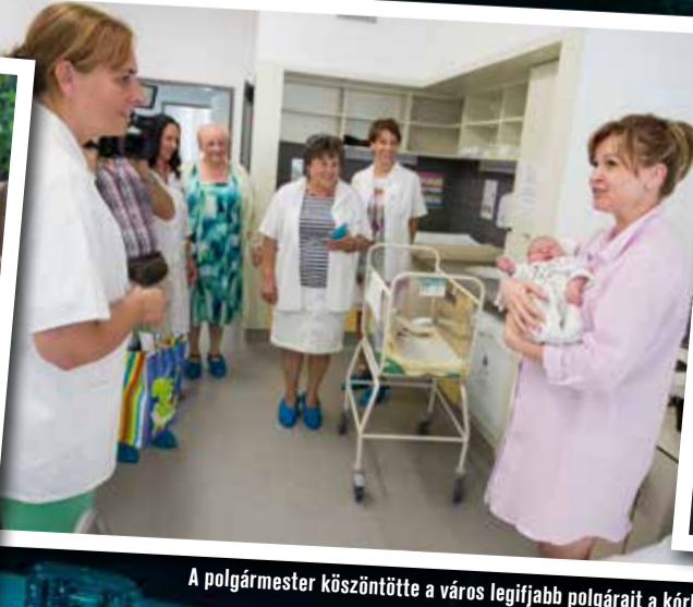
A polgármester köszöntötte a város legifjabb polgárait a kórházban