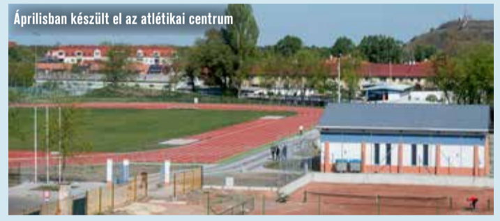
Áprilisban készült el az atlétikai centrum