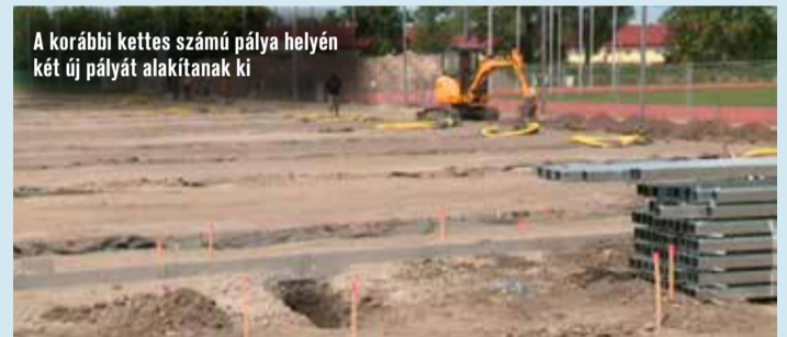
A korábbi kettős számú pálya helyén két új pályát alakítanak ki

földet távolították el munkagé- pek segítségével. A pályákat a már meglévő műfüves területtel tették párhuzamossá, melyből az egyik szintén mesterséges felületű lesz. A pályák megépülése Kecskemét Megyei Jogú város Önkormányzata és a TAO támogatása által jöhetett létre. Ennek köszönhetően pedig a kecskeméti labdarúgók még szín- vonalasabb körülmények között fejlődhetnek.