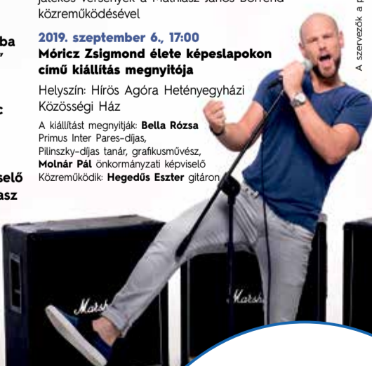
A szervezők a program változtatás jogát fenntartják.