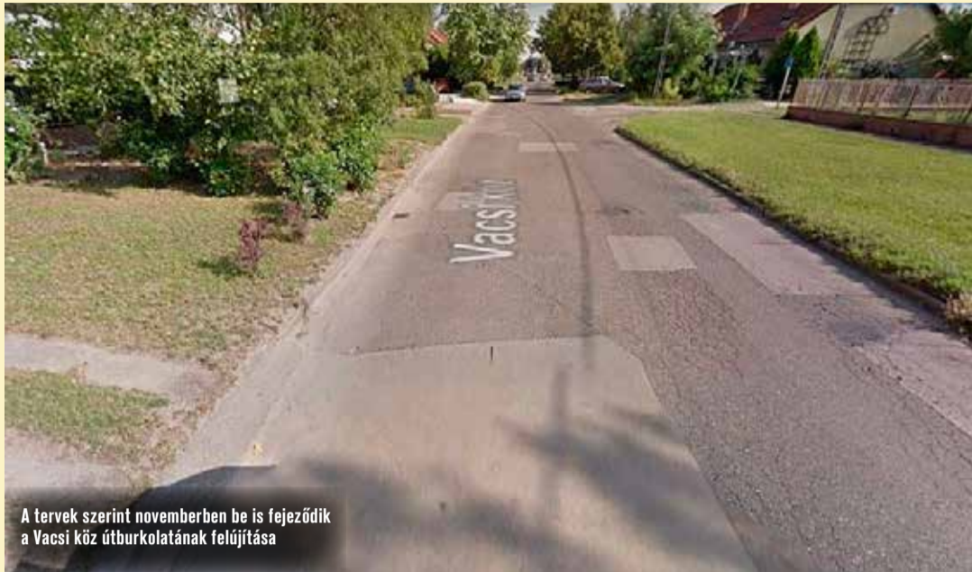
A tervek szerint novemberben be is fejeződik a Vacsi köz útburkolatának felújítása

Augusztus 27-én elkezdődött a Vacsi köz útburkolatának felújítása a Bethlen körúttól a Sosztakovics utcáig, 1055 méter hosszon. A városi szinten is emblematikus jelentőségű beruházást régen várja az északi városrész közössége, közlekedői. Jó hír számukra, hogy még a tél előtt megújul az útszakasz.