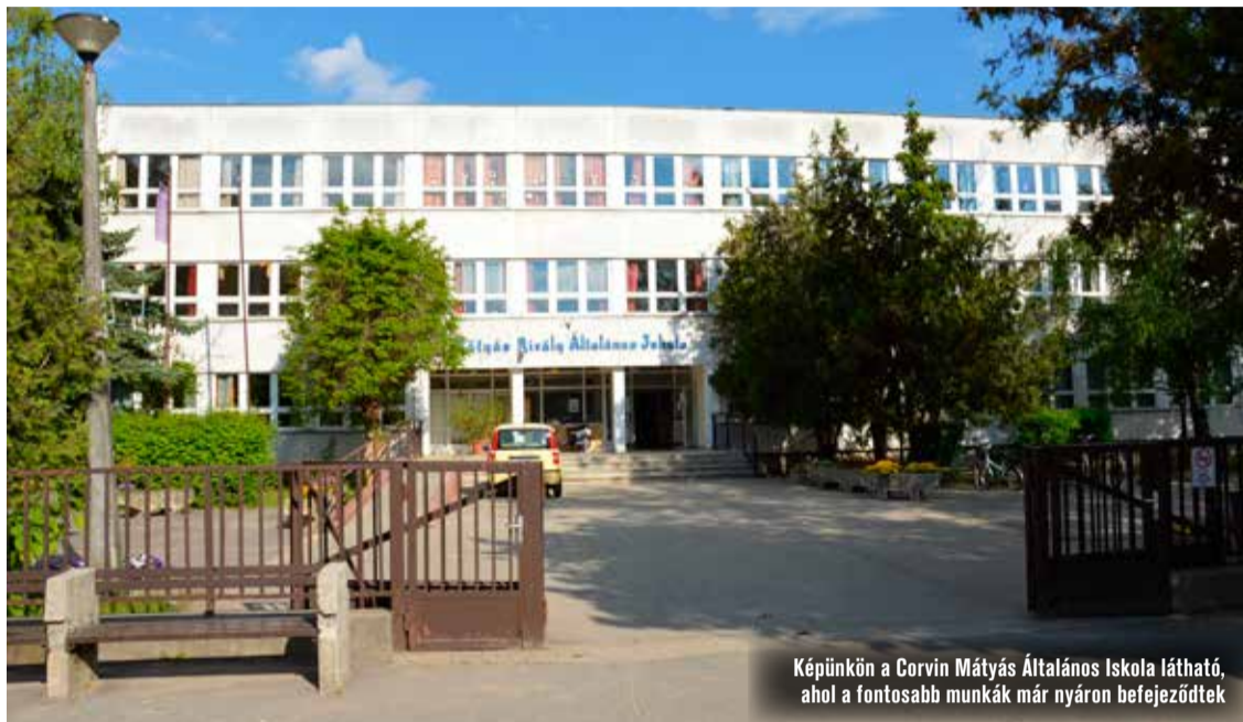
Képiükön a Corvin Mátyas Általános Iskola látható, ahol a fontosabb munkák már nyáron befejeződtek

Kilenc iskola összesen több mint 2 milliárdos felújítása zajlik jelenleg Kecskeméten. A projektekre uniós forrásokat nyert az önkormányzat, de a kivitelezési költségek emelkedése miatt a városi költségvetésnek is jelentős plusz forrásokkal kell hozzájárulnia a munkálatokhoz. Szemereyné Pataki Klaudia polgármester szerint az iskolarekonstrukciók célja, hogy az intézmények megfeleljenek a gyökeresen átalakuló oktatási rendszer feltételeinek.