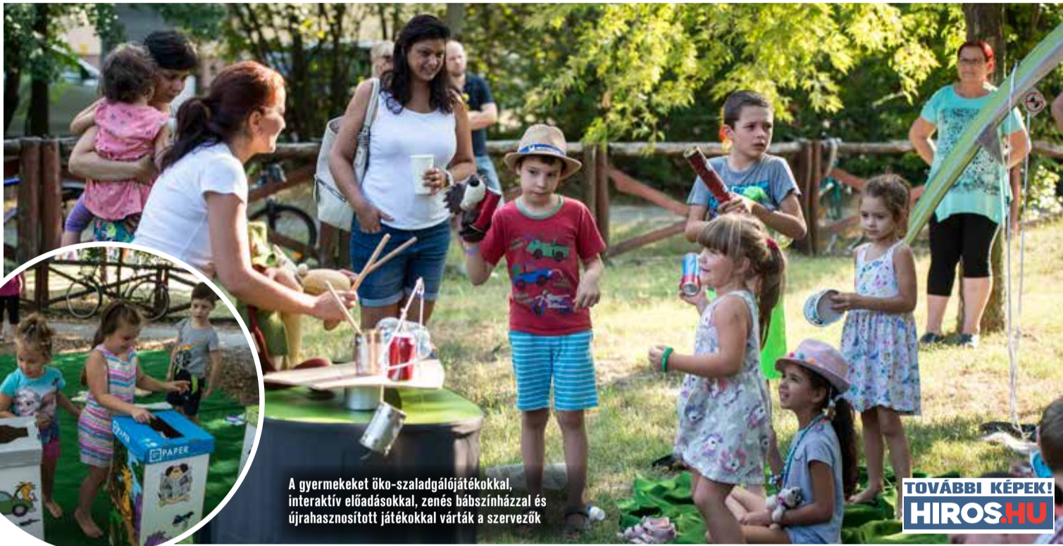
A gyermekeket öko-szaladgálójátékokkal, interaktív előadásokkal, zenés bábszínházzal és újrahasznosított játékokkal várták a szervezők