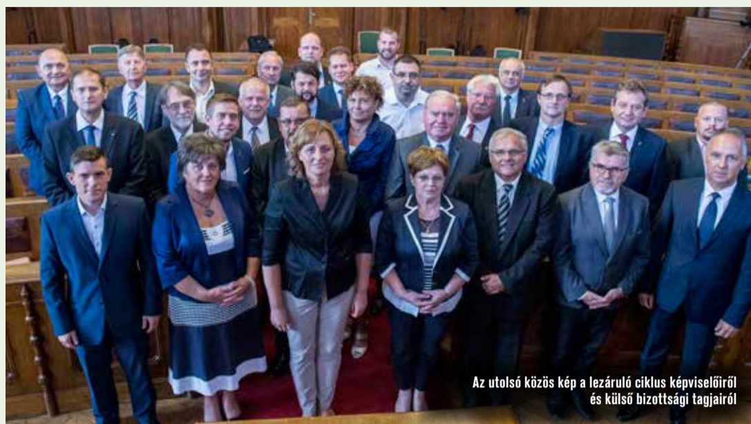
Az utolsó közös kép a lezáruló ciklus képviselőiről és külső bizottsági tagjairól

Az augusztus 22-éi ünnepi közgyűlés végén elbúcsúzott egymástól a 2014–2019-es választási ciklus kecskeméti önkormányzati képviselő-testülete. A polgármester szerint mindannyian, kivétel nélkül hittel, szívvvel dolgoztak a városért.