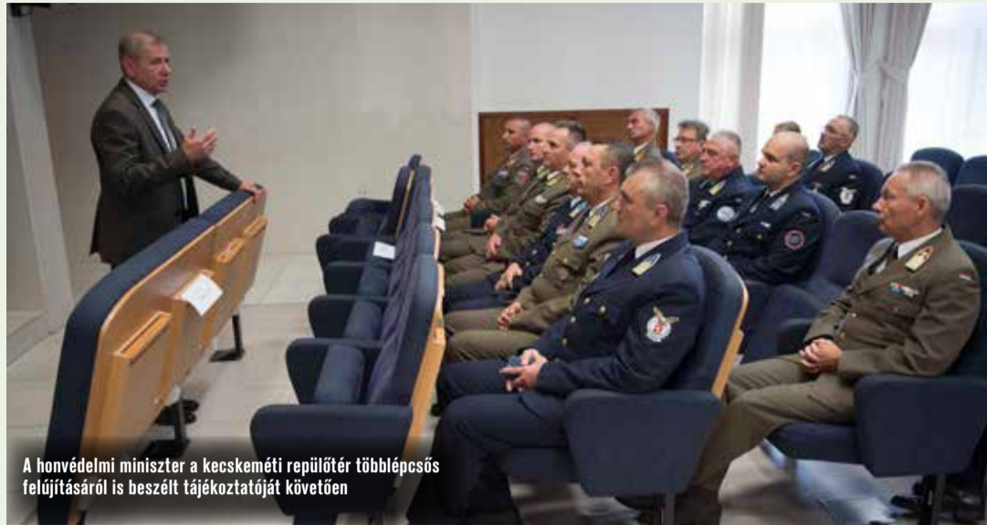
A honvédelmi miniszter a kecskeméti repülőtér többlépcsős felújításáról is beszélt tájékoztatóját követően

Kecskeméten tartott előadást Benkő Tibor honvédelmi miniszter a „Zrínyi 2026” elnevezésű haderő-fejlesztési programról kedden délelőtt. A rendezvény után a kecskeméti vonatkozások is szóba kerültek.