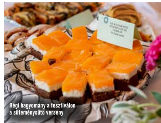
Régi hagyomány a fesztiválon a süteménysütő verseny