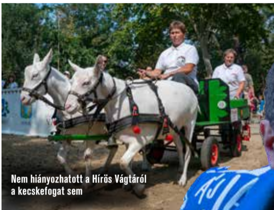
Nem hiányozhatott a Hírös Vágtáról a kecskefogat sem