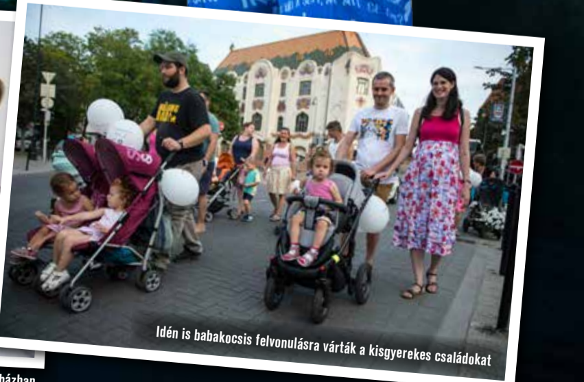
Idén is babakocsis felvonulásra várták a kismgyerekes családokat