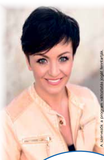
A szervezők a program változtatás jogát fenntartják.