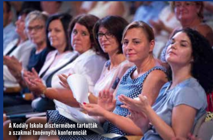
A Kodály Iskola dísztermében tartották a szakmai tanévnyitó konferenciát