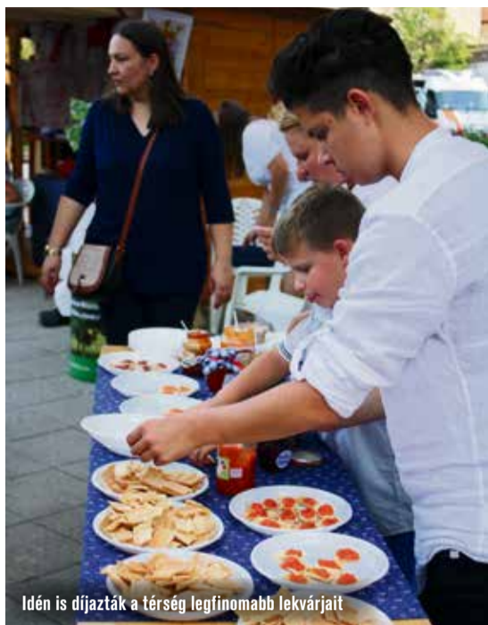
Idén is díjazták a térség legfinomabb lekvárjait