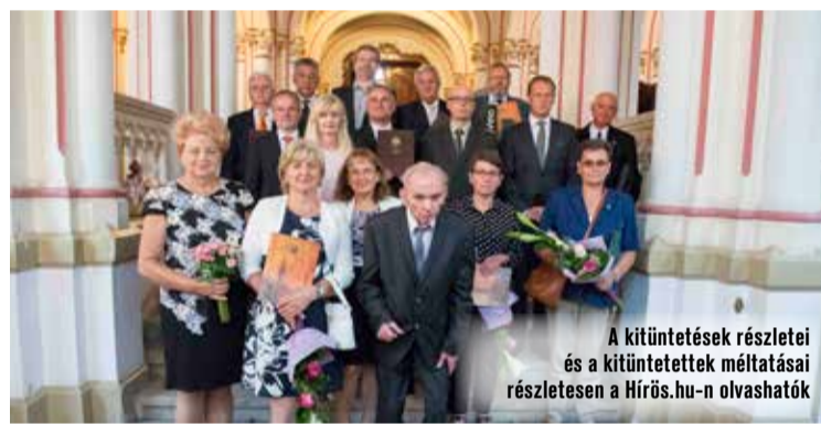
A kitüntetettek részletei és a kitüntetettek méltatásai részletesen a Hírös.hu-n olvashatók