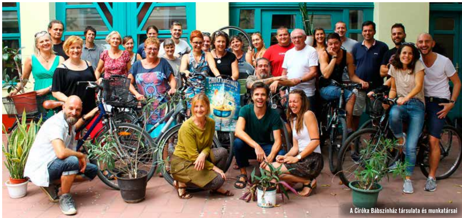
A Círóka Bábszínház társulata és munkatársai