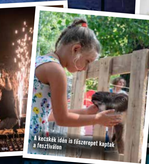
A kecskék idén is főszerepet kaptak a fesztiválon