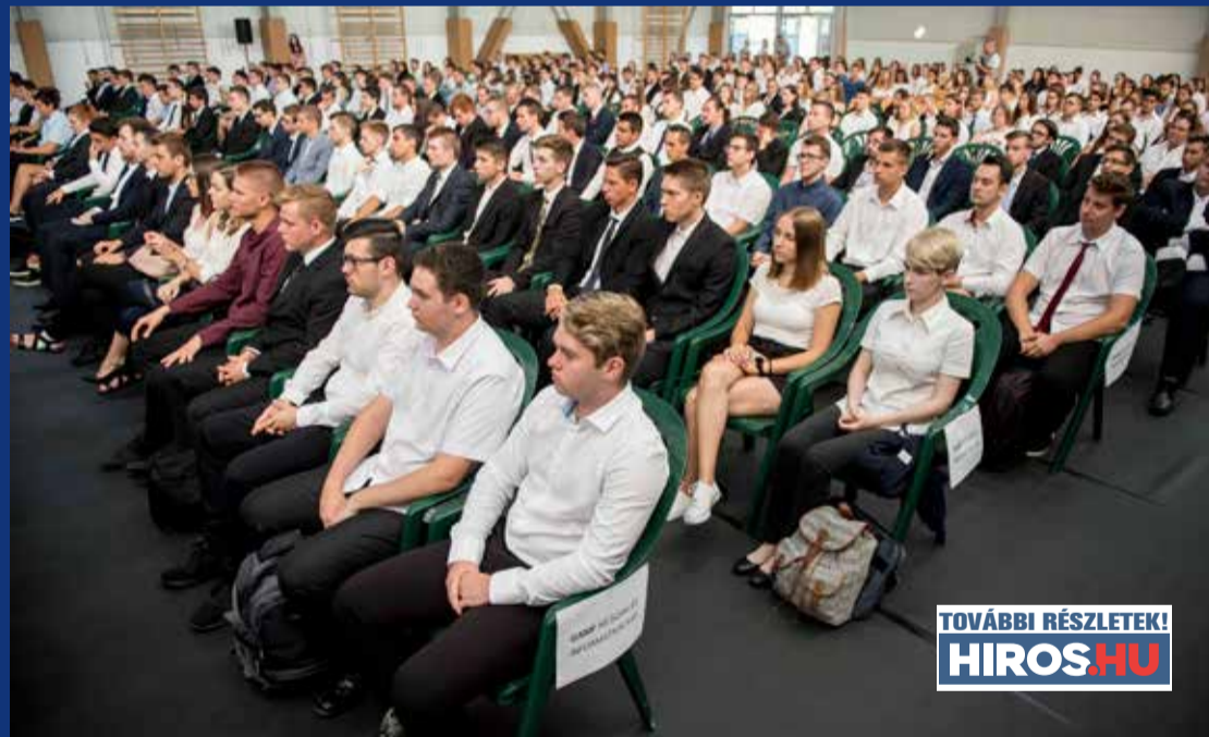
TOVÁBBI RÉSZLETEK! HIROSHU

A próbaterhelés befejeztével, előreláthatóan 2019. szeptember 20-án körül megkezdődik a Neumann János Egyetem Gazdaságtudományi Kara oktatóinak és dolgozóinak átköltözése, majd szeptember végén a hallgatók is birtokba vehetik az épületet.