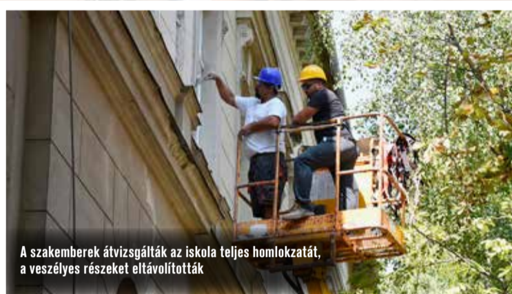
A szakemberek átvizgálták az iskola teljes homlokzatát, a veszélyes részeket eltávolították