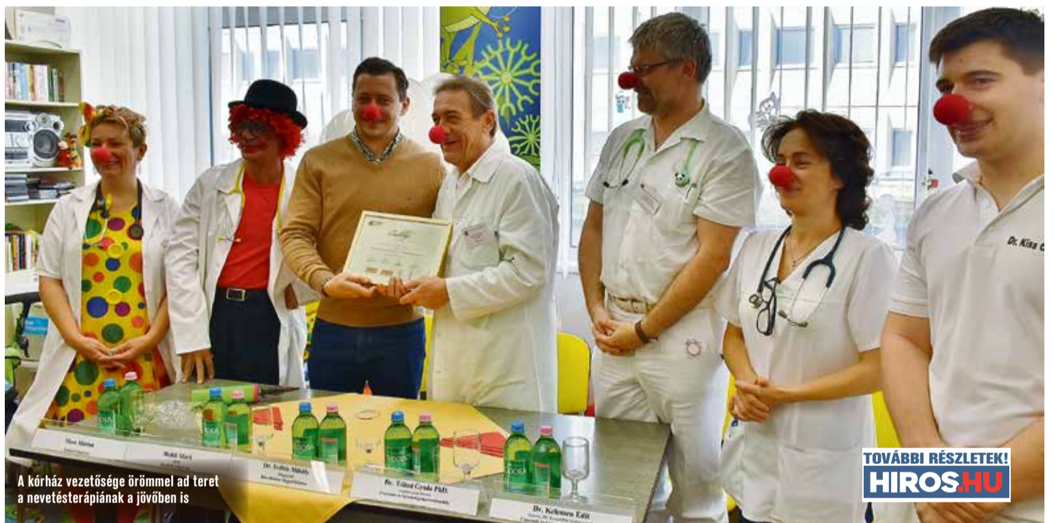
A kórház vezetősége örömmel ad teret a nevetésterápiának a jövőben is