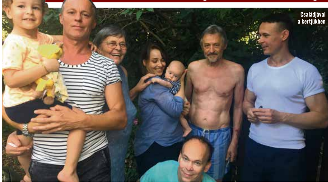
Családjával a kertjükben