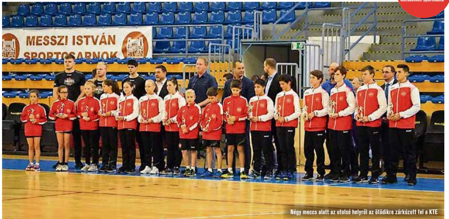
Négy meccs alatt az utolsó helyről az ötödikre zárkózott fel a KTE

– Célunk volt, hogy egyre jobb minőségi és szakmai körülmények között sportolhassanak a fiatalok. Vazul