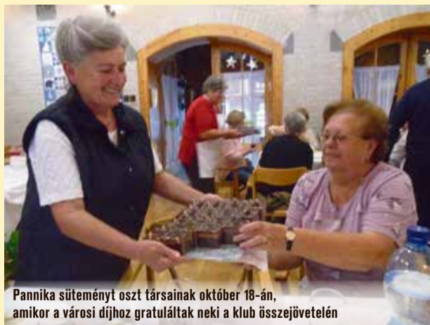
Pannika süteményt oszt társainak október 18-án, amikor a városi díjhoz gratuláltak neki a klub összejövetelén