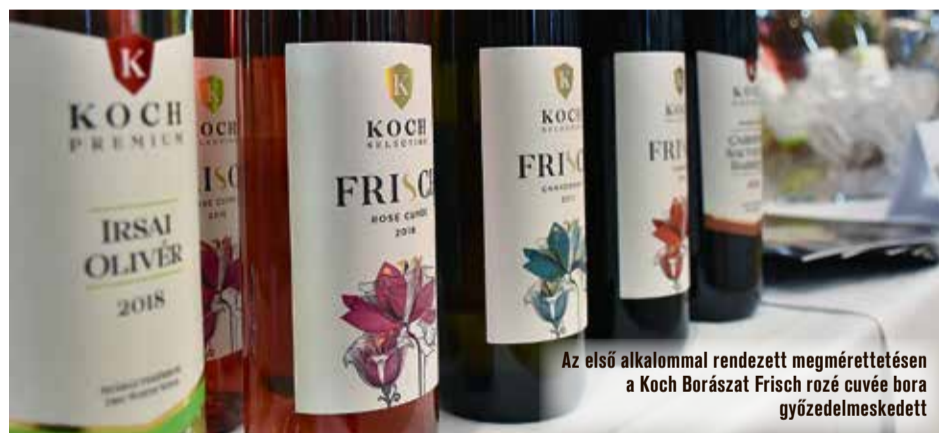
Az első alkalommal rendezett megmérettetésen a Koch Borászat Frisch rozé cuvée bora győzedelmeskedett

A megyei önkormányzat idén új kezdeményezést indított útjára. A Bács-Kiskun Megyei Bormustrát múlt pénteken tartották meg a Four Points by Sheratonban. A legkiválóbb borászok, pincészetek lehetőséget kaptak, hogy megmutassák a Duna-Tisza közének legkiválóbb boraikat. A rendezvényen borárverést is rendeztek, melynek eredményeképpen több százezer forinttal támogatták a gyergyószárhegyi gyermekotthon gépjárműbeszerzését.