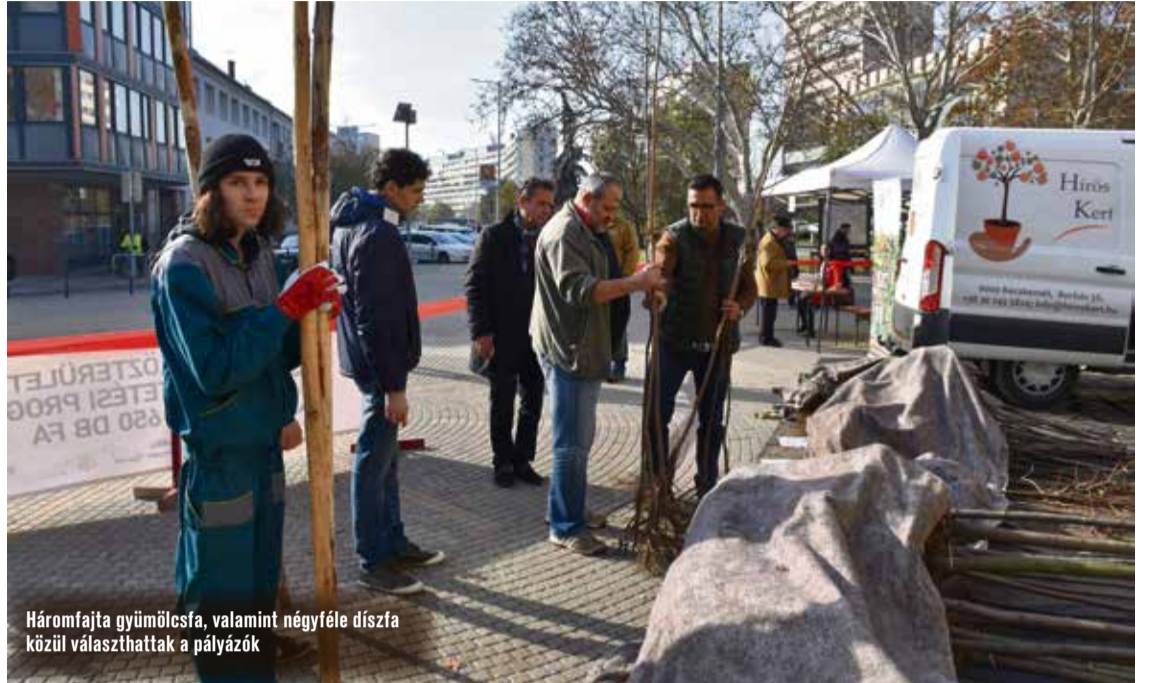
Háromfajta gyümölcsfa, valamint négyféle díszfa közül választhattak a pályázók

Háromfajta gyümölcsfa – kajszli, szilva és meggy –, valamint négyféle díszfa – gömbakác, hárs, tatárjuhar és korai juhar – közül választhattak a pályázók, akik vállalták, hogy nemcsak elültetik, de a jövőben gondozzák is azokat.