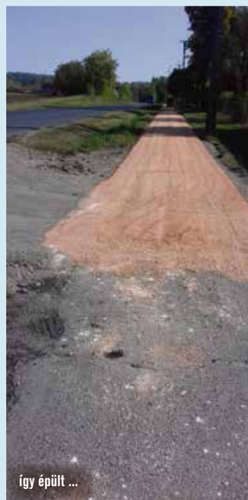
így épült ...