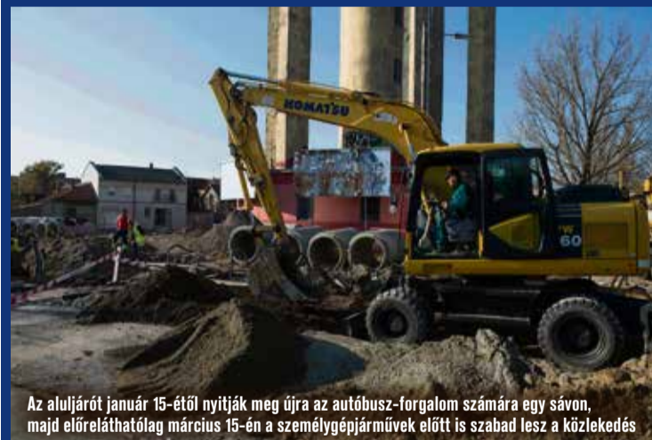
Az aluljárót január 15-étől nyitják meg újra az autóbusz-forgalom számára egy sávon, majd előreláthatólag március 15-én a személygépjárművek előtt is szabad lesz a közlekedés

A fórumon a résztvevők számos kérdést vetettek fel. Vitatémát adott például az új buszjárat eddigiektől eltérő útvonala és megnövekedő menetideje vagy a Rákóczi út elkerülése, amelyek nehézséget jelenthetnek néhány környéken lakó gyermek közlekedésében.