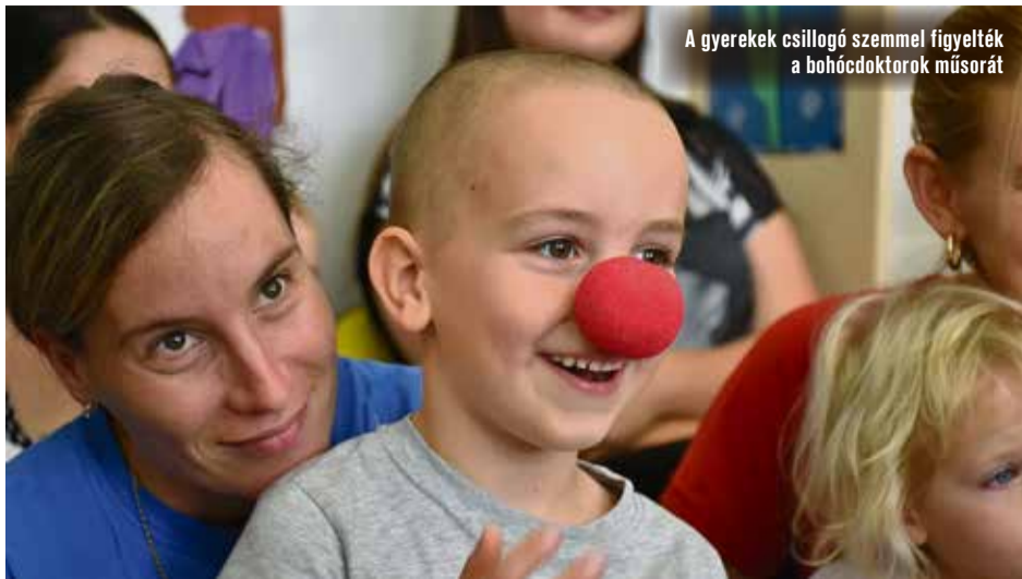
A gyerekek csillogó szemmel figyelték a bohócdoktorok műsorát