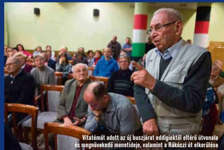
Vitatémát adott az új buszjárat eddigiektől eltérő útvonala és megnövekedő menetideje, valamint a Rákóczi út elkerülése