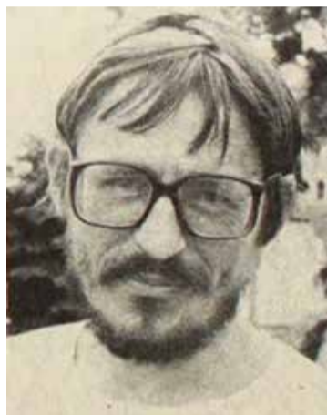
1983-ban, a Kecskeméti Szemle alapításakor