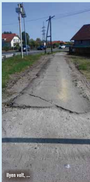
Ilyen volt, ...

an, a Hullám vendéglőtől egészen a hetényi S-kanyarig készült el ősze. A kerékpárút építése előtt a Kefag Zrt.-nek rendeznie kellett az út melletti véderdősáv növényzetét. A felújítással a Vízmű utcai útfelújítást is meg kellett várni, mert a két beruházás nagyon sok terelessel járt volna egyszerre. Mivel a forgalom miatt lehetetlen lett volna egyszerre végezni a munkálatokat, ezután helyezték át a hangsúlyt a kerékpárútra, amit egy hónapja már teljes hosszában használnak a bringások. A 3 km kerékpárút rekonstrukciója 160 millió forintos önkormányzati beruházásból valósult meg.