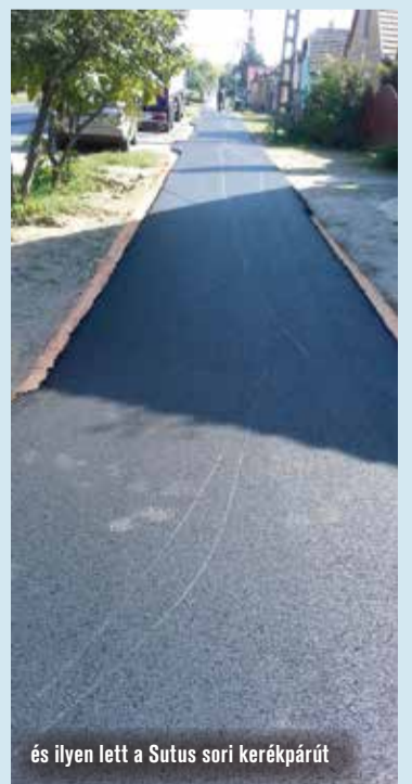
és ilyen lett a Sutus sori kerékpárút