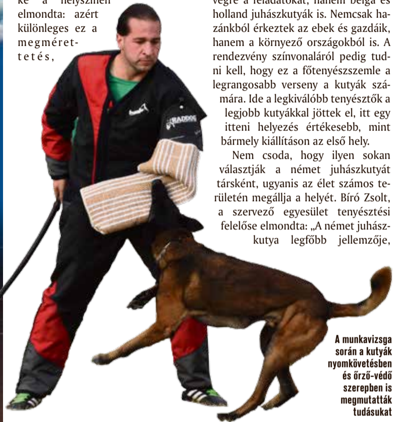
A munkavizsga során a kutyák nyomkövetésben és őrző-védő szerepben is megmutatták tudásukat