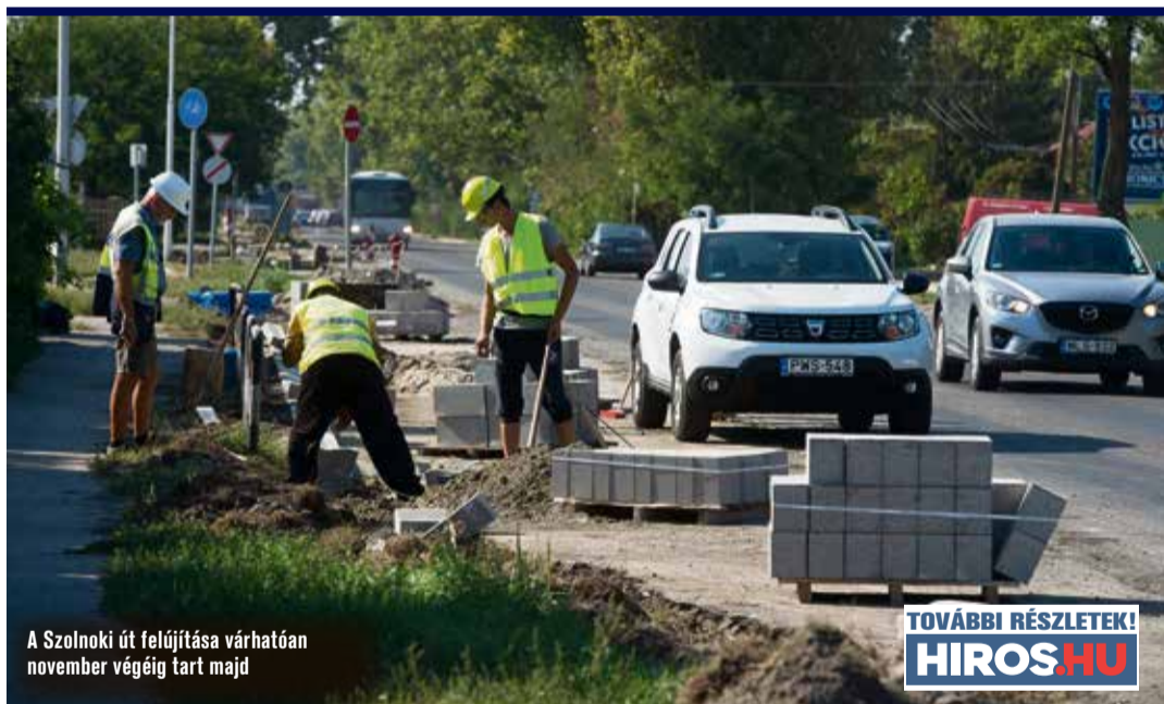
A Szolnoki út felújítása várhatóan november végéig tart majd

A polgármester elmondta, hogy ezzel egy időben a déli iparterület négy, nagy forgalmú útszakaszának (Búzahalász utca, Mindszenti körút, Kiskőrösi út és Szent László körút) újjáépítése is megkezdődik. Az összesen 5,3 kilométer hosszú szakasz rekonstrukciója egy sikeres pályázat révén mintegy 1,2 milliárd forintból valósul meg. A várhatóan az év végéig tartó munkálatok keretében lemarják az aszfaltburkolat felső rétegét, szükség szerint megerősítik az útalapot, új aszfaltréteget terítenek le, a kapubehajtokat szintre emelik, a csapadékvíz elvezetésére pedig nyílt árok épül majd a területen.