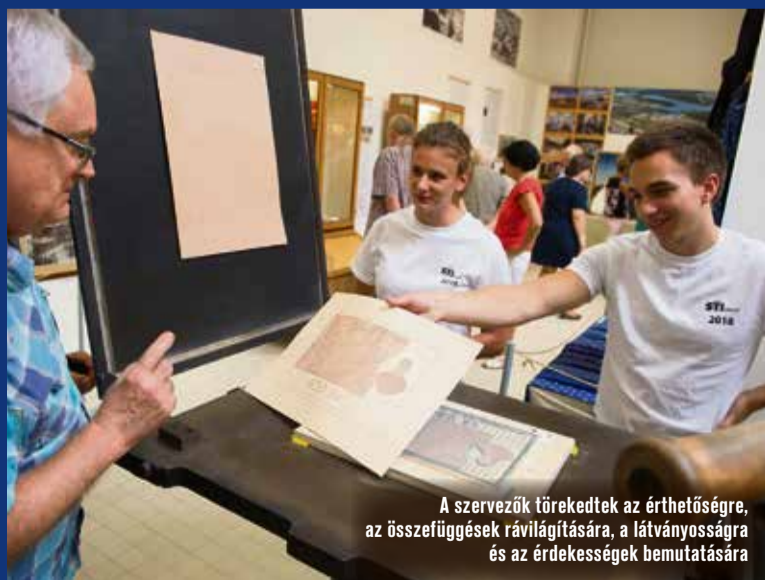
A szervezők törekedtek az érthetőségre, az összefüggések rávilágítására, a látványosságra és az érdekességek bemutatására