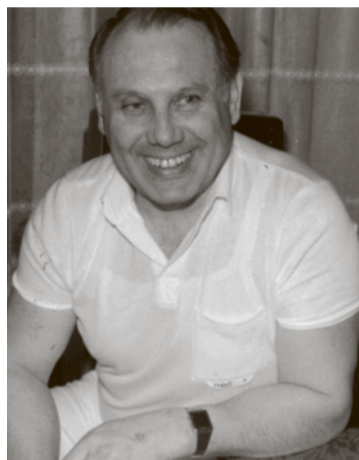
A Kecskeméti Honvédkórház főigazgatójaként