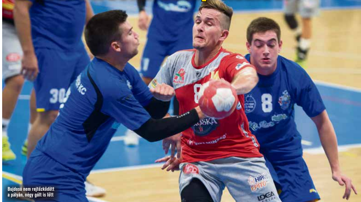
Bujdosó nem rejtőzködött a pályán, négy gólt is lőtt

27-19-re győzött a KTE-Piroska Szörp férfi kézilabdacsapata a Békés-Drén KC ellen múlt pénteken a Messzi István Sportszarnokban. Ezzel továbbjutott a Magyar Kupában.