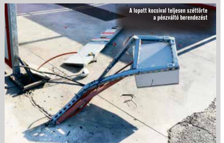
A lopott kocsival teljesen szétörte a pénzváltó berendezést

A gyanúsított a benzinkút pénzváltó berendezésébe a gépjárművel több alkalommal behajtott, a berendezés annyira megrongálódott, hogy a gyanúsított a pénzkazettához hozzáfért és ellopta azt. Ezt követően a gyanúsított egy másik töltőállomásra hajtott, ahol 10.000 Ft értékben üzemanyagot tankolt, majd fizetés nélkül távozott.