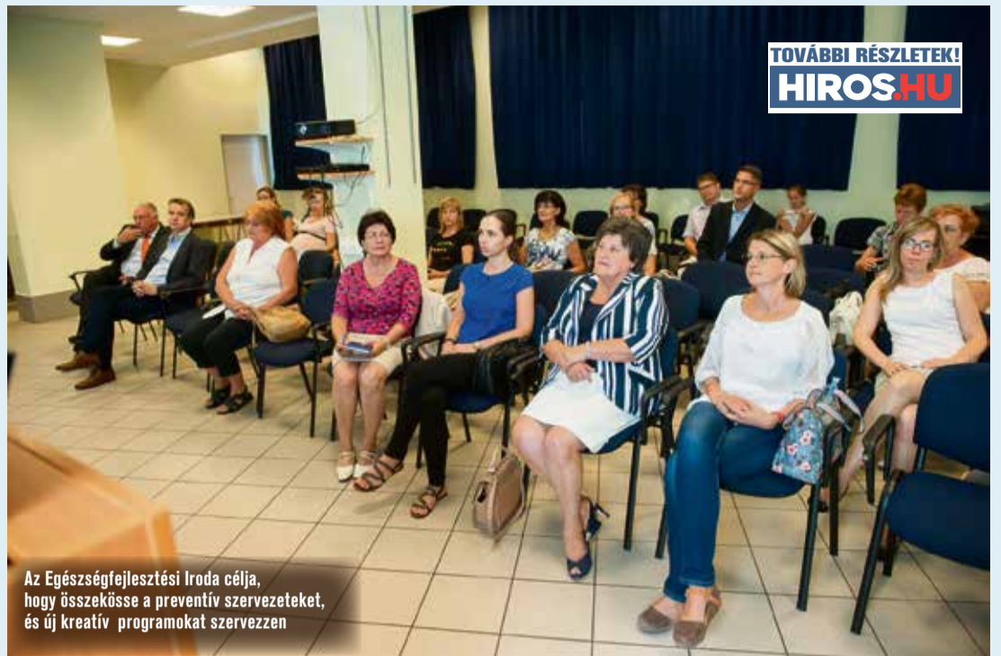
Az Egészségfejlesztési Iroda célja, hogy összekösse a preventív szervezeteket, és új kreatív programokat szervezzen

Interaktív kiállításokat és előadásokat szervez majd az iroda. De az egyedibb ötletek sorából nem hiányozhat egy tornaszoba és egy mintakonyha berendezése és kialakítása