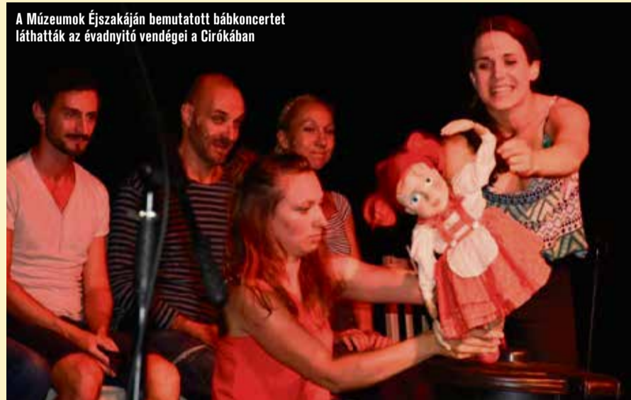
A Múzeumok Éjszakáján bemutatott bábkonzertet láthatták az évadnyitó vendégei a Cirókában

Kihagyhatatlannak bizonyult a Farkas és Piroskából a jó és rossz Piroška dala, az Aranyhalacska, a kecskeméti épületeket megjelenítő Tündér ballonkabátban, valamint az egyik legújabb történet, a Max és Móric két csirkefogójának közös éneke. Végére pedig a Ludas Matyi fináléját hagyták, amely tökéletes befejezésnek bizonyult. A műsor után stílszerűen egy kis szabadszedéses megvendéglésre invitálták a kicsiket, ahol gyümölcsöt és piszkótát falatozhattak. Hát íme, elkezdődött egy újabb kalandos évad a Cirókában.