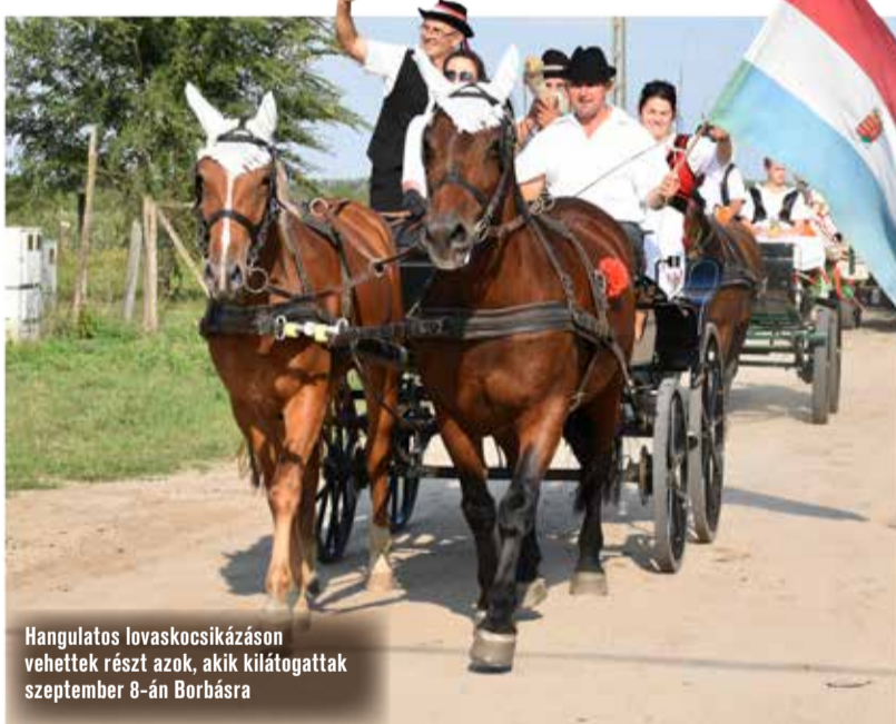
Hangulatos lovaskocsikázáson vehettek részt azok, akik kilátogattak szeptember 8-án Borbásra

A délután további része a szőlőről szól: szüreteltek, mustot készítettek és kóstoltak, venyigedobó és hordógurító versenyekkel, íjászattal ütötték el az időt. Este pedig egy igazi szüreti bállal zárták a napot, ahol csöszleányokkal és csöszfiúkkal is találkozhatott a vigadó társaság.