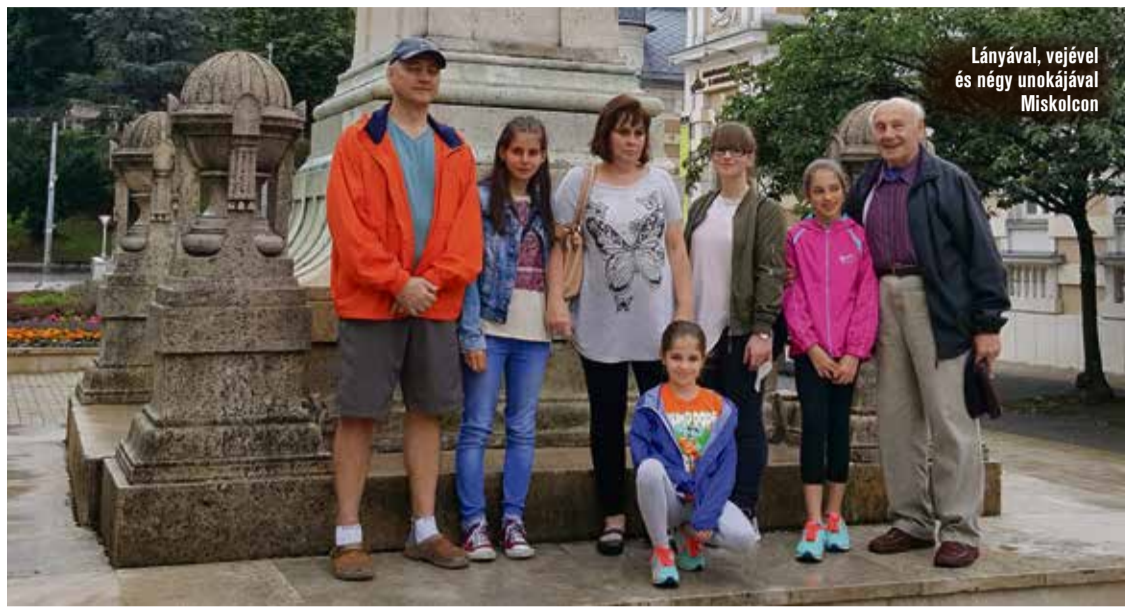
Lányával, vejevel és négy unokájával Miskolcon