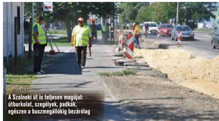
A Szolnoki út is teljesen megújul: útburkolat, szegélyek, padkák, egészen a buszmegállóig bezárólag