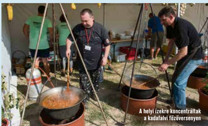
A helyi ízekre koncentráltak a kadafalvi főzőversenyen