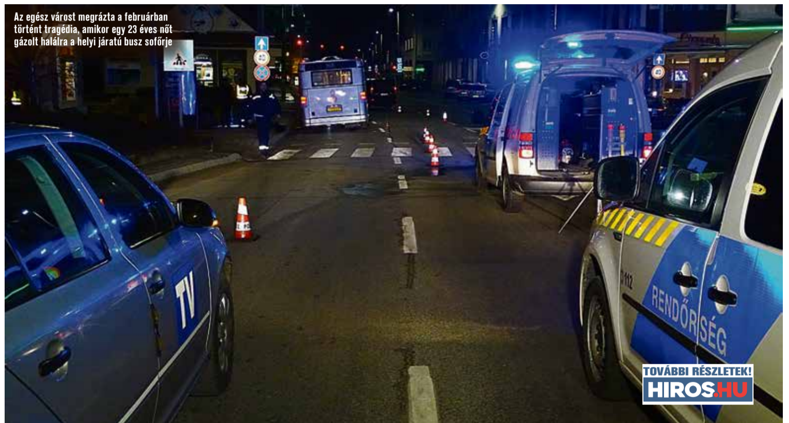
Az egész várost megrázta a februárban történt tragédia, amikor egy 23 éves nőt gázolt halálra a helyi járatú busz sofőrje