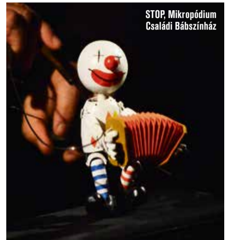
STOP, Mikropódium Családi Bábszínház