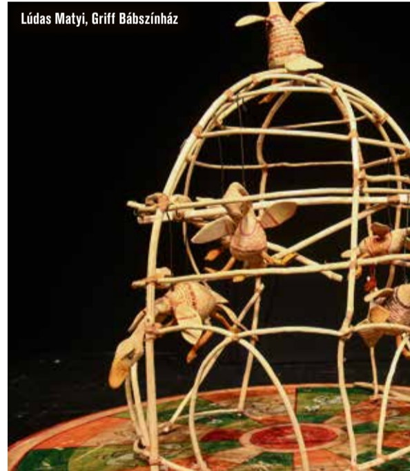
Lúdas Matyi, Griff Bábszínház

remélhetőleg minden korosztály igényeit ki tudjuk majd elégíteni. Lesz népmese és kortárs mese, klasszikus történet és vásári játék, bravúros technikai megoldásokat felvonultató parányi bábszínház és varázslatos cirkuszi produkció.