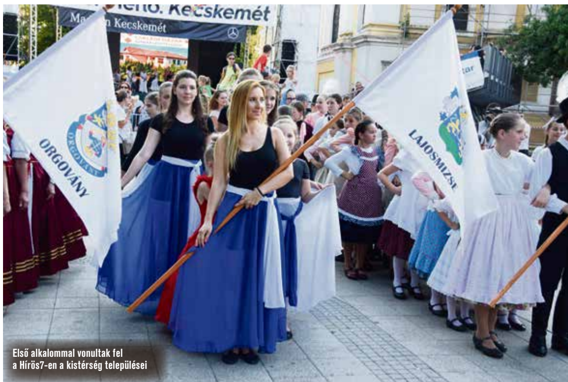
Első alkalommal vonultak fel a Hírös7-en a kistérség települései

mesítők találkozzanak és értékeljék a mögöttük álló esztendőt.