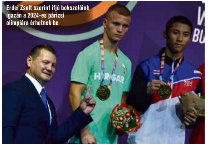
Erdei Zsolt szerint ifjú bokszolóink igazán a 2024-es párizsi olimpiára érhetnek be

elfáradt. Nem az izomzat fáradt el, hanem agyban. Négy kemény meccsen volt túl, egy kirgiz, egy ukrán, egy üzbegisztáni és egy egyiptomi ellen. Ezek az ázsiaiak első-harmadik