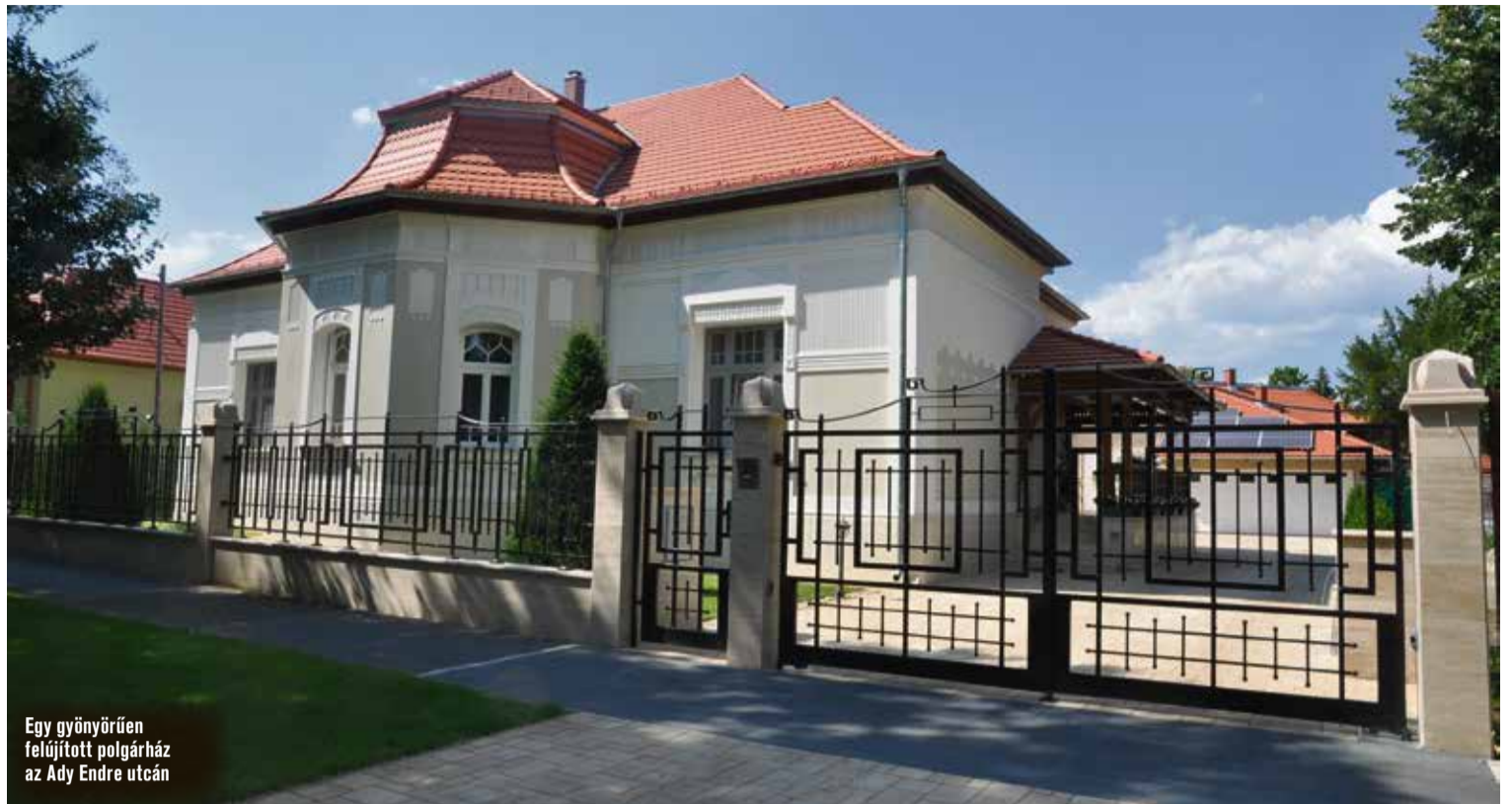
Egy gyönyörűen felújított polgárház az Ady Endre utcán

Ezért az idei évtől – a tavalyi 6 millió után – már 10 millió forint áll rendelkezésre a városnál a helyi védett épületek felújításának tulajdonosi pályázataira.