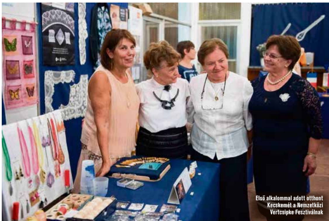
Első alkalommal adott otthont Kecskemét a Nemzetközi Vertesipke Fesztiválnak