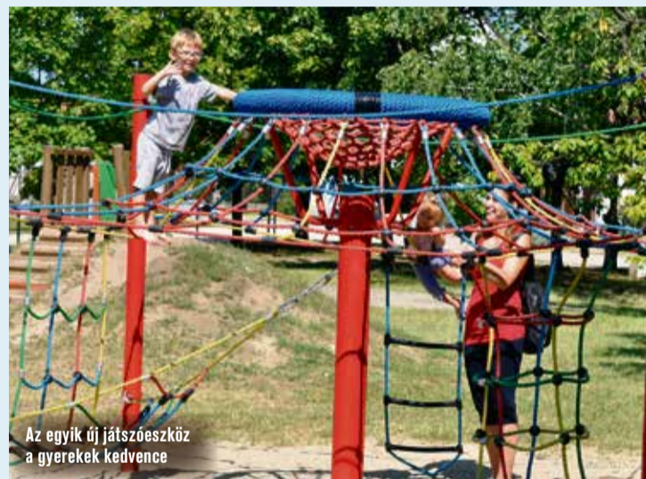
Az egyik új játszóeszköz a gyerekek kedvence

Emellett gondolnak a sportfunkcióra is, így az elavult, balesetveszélyes kosárpánc helyett új streetball-pánc készül majd – remélhetőleg – sportburkolattal együtt, valamint a focipályát is fejlesztik a gyepfelület rendezésével. A megvalósítás a következő években jöhet létre, és egy uniós által finanszírozott pályázat keretében történik.