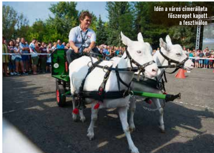
Idén a város címerállata főszerepet kapott a fesztiválon