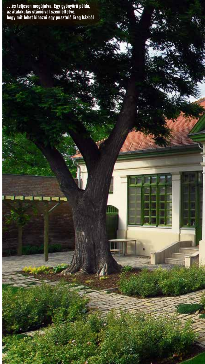
...és teljesen megújulva. Egy gyönyörű példa, az átalakulás stációjával szemlélítve, hogy mit lehet kihozni egy pusztuló öreg házból

Valószínűleg mindenki táplál magában valamilyen gyengéd érzést a régi Kecskemét hangulata iránt. Az ódon belvárosi házak nagyapáink örökségét, patinás családok emlékét, a polgári ízlést, az eklektikus és szecessziós motívumok világát árasztják felénk. Valamint salétromszagot... És a tehetetlenség érzését, amint napról napra látjuk, hogy a „boldog békeidők” utolsó zárványai csendben pusztulnak. Vajon általános ez a tendencia?