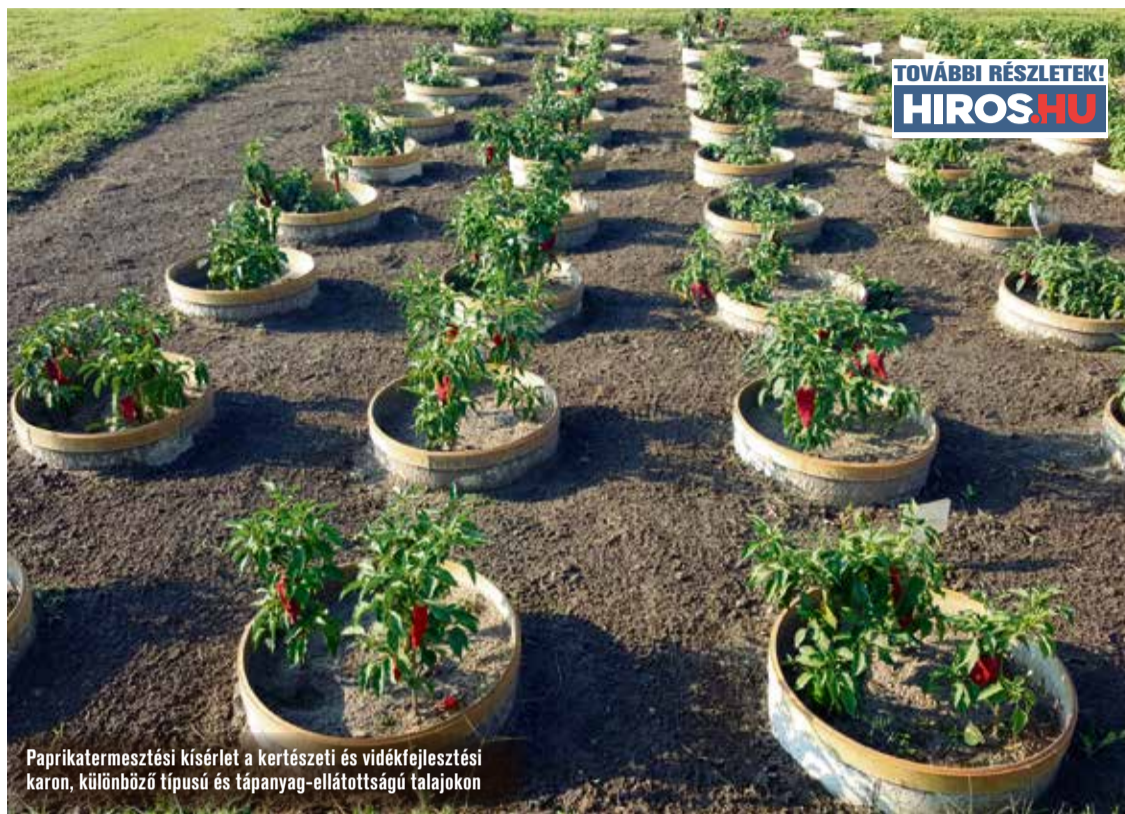
Paprikatermesztési kísérlet a kertészeti és vidékfejlesztési karon, különböző típusú és tápanyag-ellátottságú talajokon

– Ami viszont nagyon érdekes – tette hozzá –, hogy az elmúlt húsz évben végzet agrármérnökök közül nem nagyon hallottam olyat, hogy valaki munkanélküli lett volna. Szerintem ez a szakma nagyon piacképes tudást ad, hiszen a gyógyszeriparról az élelmiszeripari üzemeken és a nagy agrár zrt-ken át a családi, magán gazdaságokig mindenütt tárt karokkal várják a friss diplomásokat.