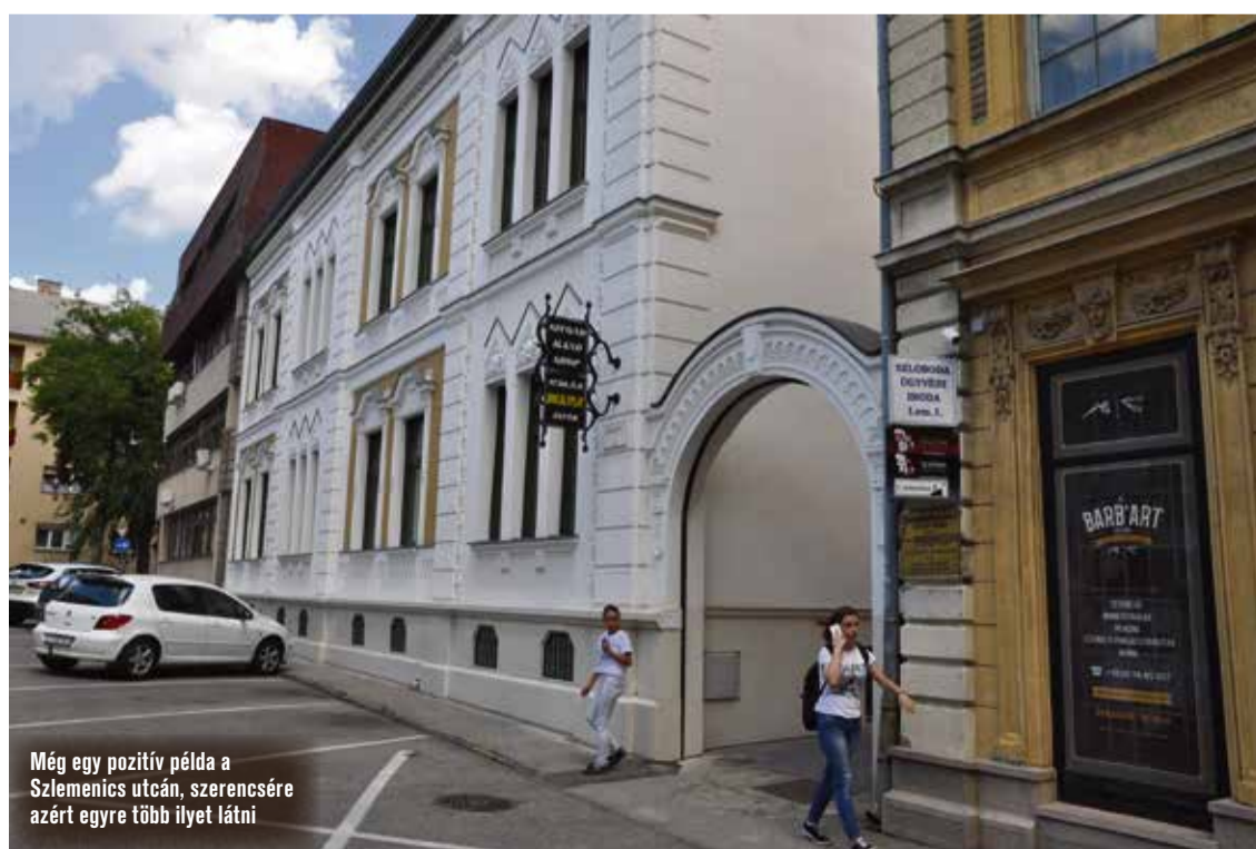
Még egy pozitív példa a Szlemenics utcán, szerencsére azért egyre több ilyen látni

Vizont ami érték, az érték, meg kell maradnia. Öveges főépítész szerint azért nem szabad megfélemlkezni a helyi védett épületekről, mert a város építészeti gyökerét képezik: „Vannak köztük olyanok, amelyek megteremtették Kecskemét léptékét, és amelyek léte garancia arra, hogy ez a város ilyen léptékben is folytatódjék. Mindig a folyamatosság a lényeg, amihez elengedhetetlen, hogy legyen mihez viszonyulni. Ha ezeket kiirtjuk, akkor gyökeretelenné válunk. Még jobban beszüremlik az internacionalista építészeti, a globalizált kultúra, vagy radikálisabban fogalmazva: az amerikai filmkultúra. Nekünk azonban van mit továbbvinnünk Kecskeméten. Belvárosi utcaszerkezetünket, a jellegzetes eklektikus, szecessziós, nem feltétlenül drámai erejű, ám mégis karakteresen értékes építészeti örökségünket, kedves apró motívumaival, nyílászáróival, kapuzatokkal, palánkkerítésekkel, vakolatdíszekkel, tetőformákkal. Ezeket érdemes megvédeni.