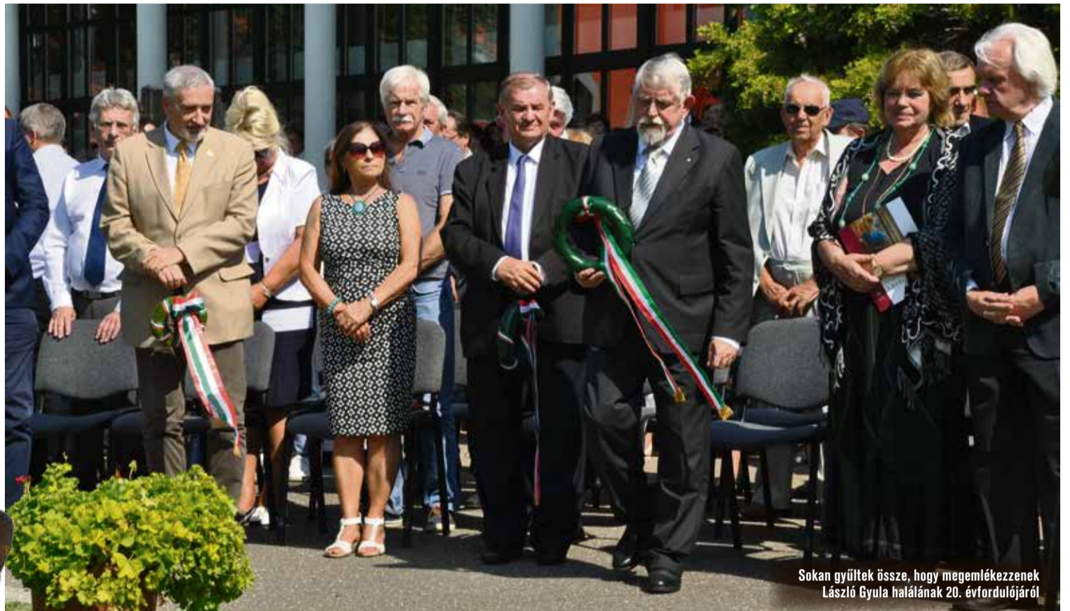
Sokan gyűltek össze, hogy megemlékezzenek László Gyula halálának 20. évfordulójáról