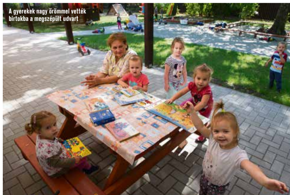
A gyerekek nagy örömmel vették birtokba a megszépült udvart