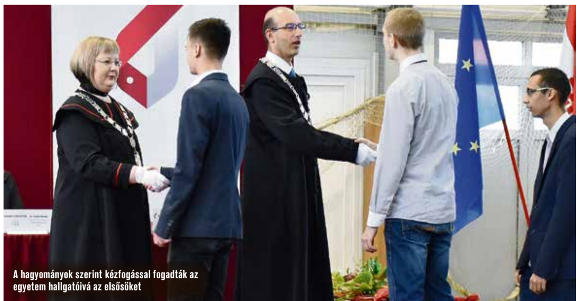
A hagyományok szerint kézfogással fogadták az egyetem hallgatóit az elsősöket