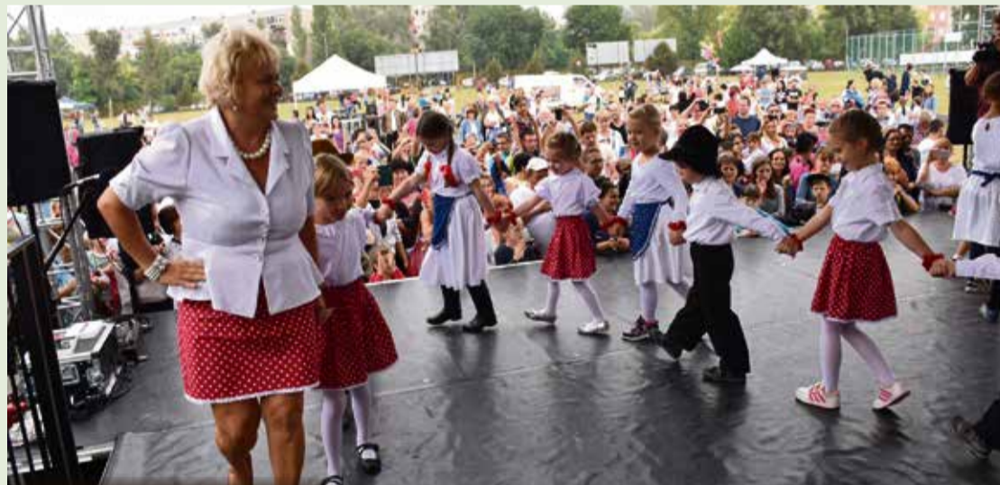
A színpadon a sztárok mellett műsort adnak a városrész intézményei is, és nem maradhat el a főzőverseny sem

A Széchenyiváros kiépülésének, növekedésének és életének történetéből villant fel emlékezetes pil-