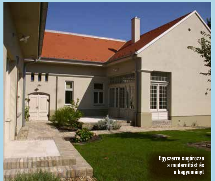
Egyszerre sugározza a modernitást és a hagyományt

– A Mária utca sarkán – folytatja –, a Malommal szemben áll egy szép épület, homlokzatán tábla: „eladó”. Nem akarok megmondóember lenni, de aki árulja, úgy hirdeti, hogy arra a területre társasházat lehet felhúzni. Ha azt lebontják, akkor Kecskemét