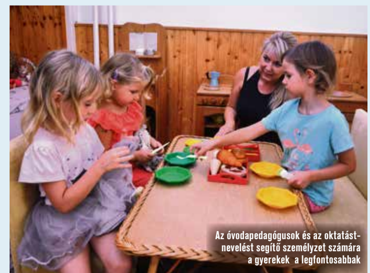
Az óvodapedagógusok és az oktatást-nevelést segítő személyzet számára a gyerekek a legfontosabbak

– Azt gondolom, ha az óvodáinkról beszélünk, meg kell említeni a pedagógusokat, akik jelentősen hozzáteszik a maguk részét a sikerhez mindkét intézményben – emelte ki a vezető. – Olyan pedagógus kollégák dolgoznak mindkét óvodában, akik tényleg a gyermekekért élnek, a gyermek a legfontosabb a számukra. Meg kell még említeni az oktatást-nevelést segítő személyzetet, a dajka néneket is. Számukra is a gyerekek a legfontosabbak. Mindenki nagyon jó kapcsolatot ápol a szülőkkel, azt gondolom, hogy egy nagyon családias, nyugodt légkörben tudják nevelni a rájuk bízott gyermekeket.