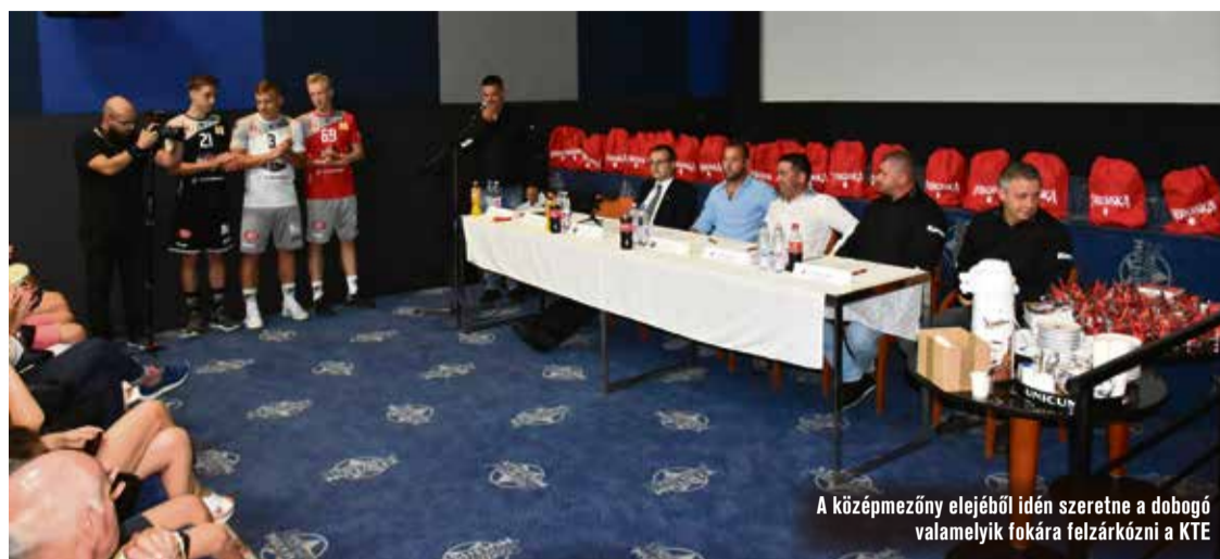
A középmezőny elejéből idén szeretne a dobogó valamelyik fokára felzárkózni a KTE