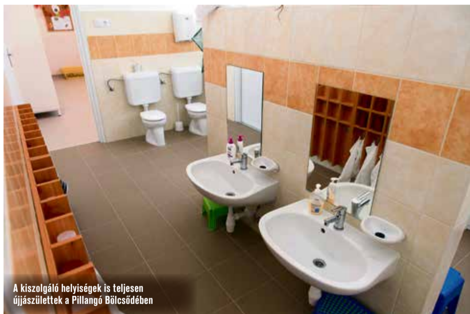
A kiszolgáló helyiségek is teljesen újjászülettek a Pillangó Bölcsődében

Mindezek miatt több mint egy évig tartott a felújítás. 2017 májusában költöztették át a gyerekeket a Budai utcára, az egyetem gyakorló iskolájának épületébe, majd idén júliusban vehették birtokba a megújult Pillangó Bölcsődét.