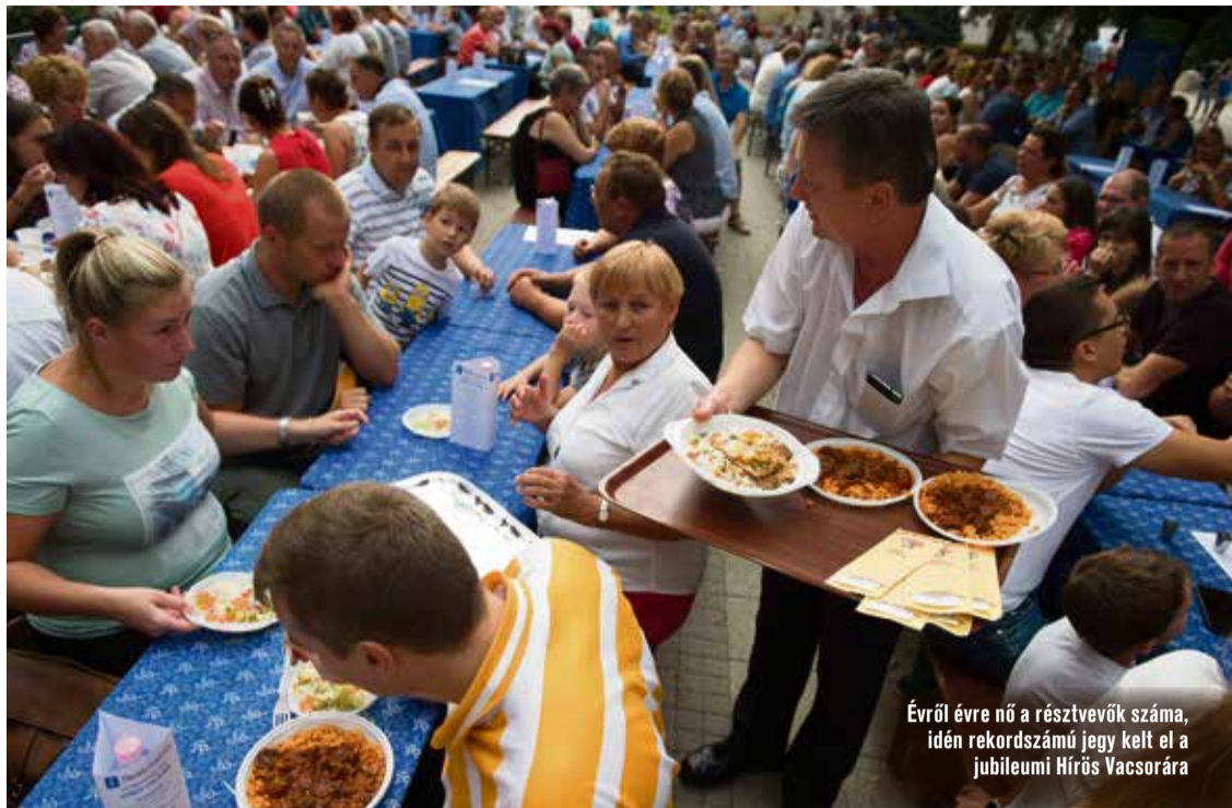
Évről évre nő a résztvevők száma, idén rekordszámú jegy kelt el a jubileumi Hírös Vacsorára

A Hírös7 Fesztivál ideje alatt tartották a Városháza előtti területen a 10. Hírös Vacsorát. Sajnos, az időjárás nem kedvezett a rendezvénynek, de a borús idő ellenére idén is több százan falatoztak a főtéren, amivel nemes ügyet támogattak.