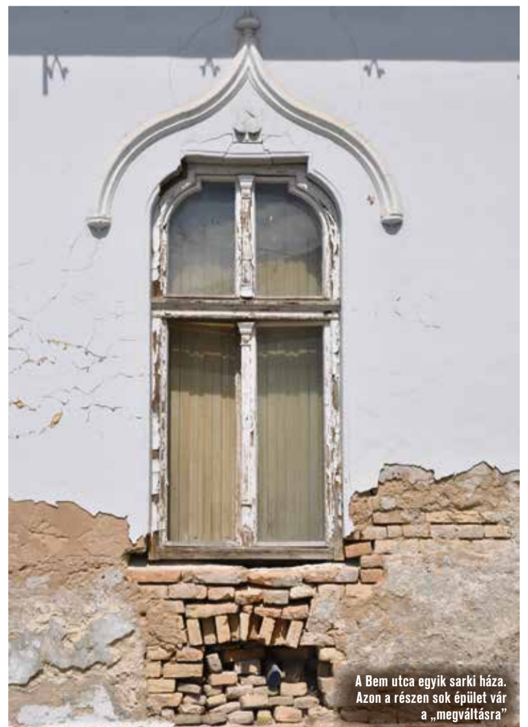
A Bem utca egyik sarkí háza. Azon a részen sok épület vár a „megváltásra”