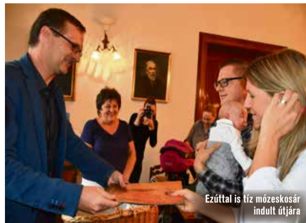
Ezúttal is tíz mózeskosár indult útjára

Tíz kisbaba családját várták a Városházára, hogy megajándékozzák őket egy-egy fonott mózeskosárral. A Nők a Nemzet Jövőjéért Egyesület egyedülálló kezdeményezésének köszönhetően ezekkel együtt már 110 mózeskosár jár körbe Kecskeméten és a város környékén.