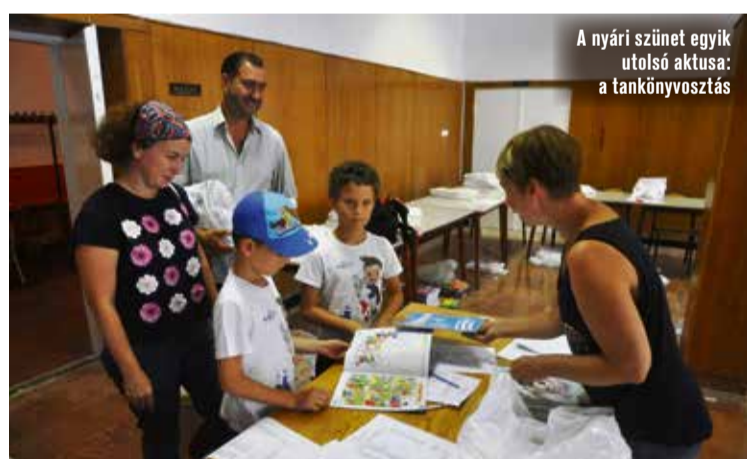
A nyári szünet egyik utolsó aktsza: a tankönyvosztás

Befejezéséhez közeledik „A tanulást segítő terek infrastrukturális fejlesztése a Neumann János Egyetem Petőfi Sándor Gyakorló Általános Iskolában” nevű projekt, melynek eredményeként korszerű és esztétikus belső terek várják a tanulókat. Az intézmény öt osztállyal bővült is ebben az évben.