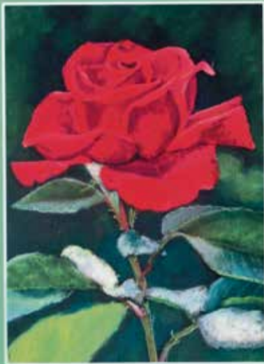
A MONTÁZSMAGAZIN ANTOLÓGIÁJA 2018