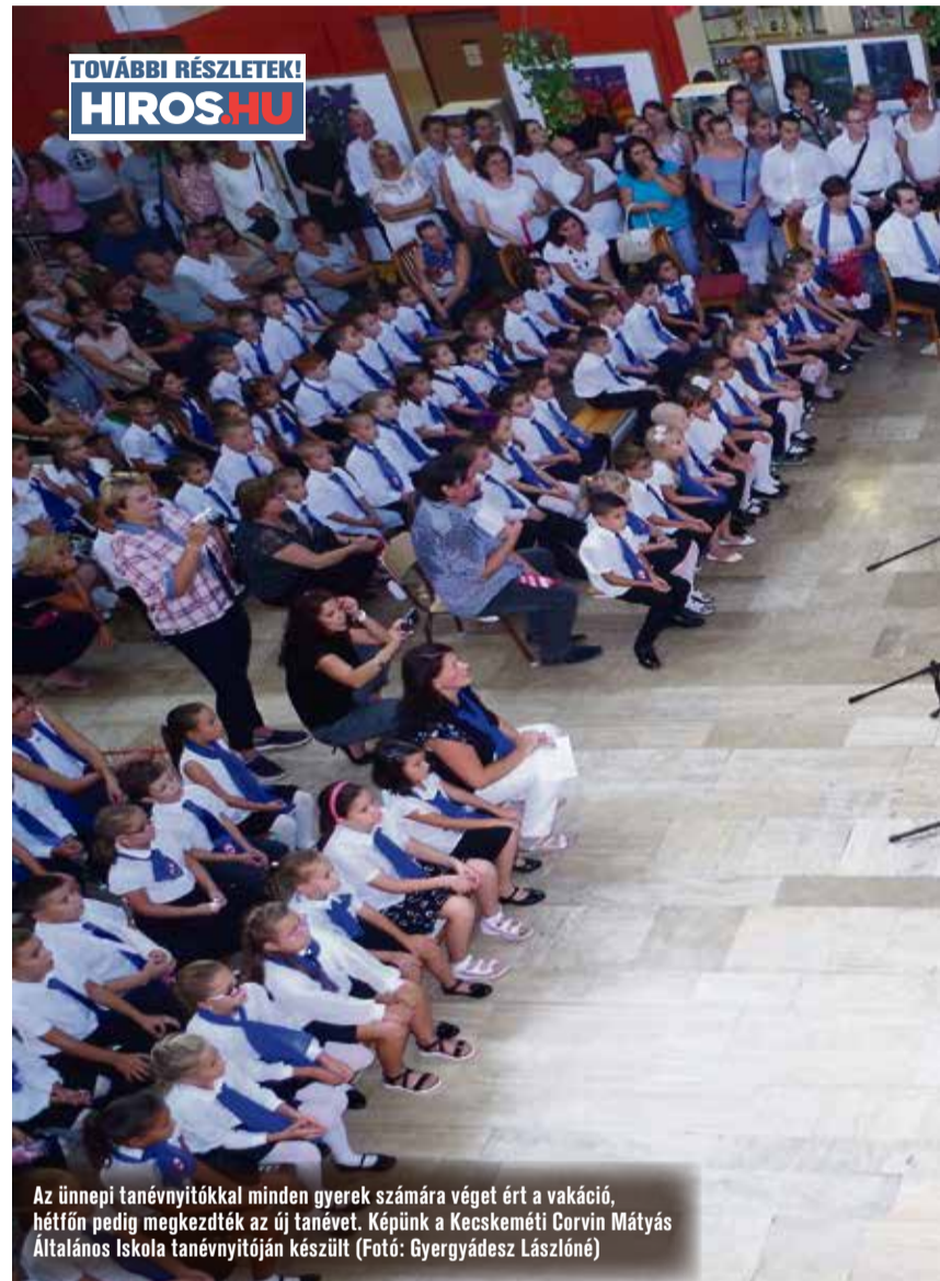
Az ünnepi tanévnyitókával minden gyerek számára véget ért a vakáció, hétfőn pedig megkezdtek az új tanévét. Képünk a Kecskeméti Corvin Mátyás Általános Iskola tanévnyitóján készült

Szeptember 3-án reggel tartották a Neumann János Egyetem tanévnyitó ünnepi szenátusi ülését a GAMF Kar Törös Olga Sportsarnokában. Ezzel