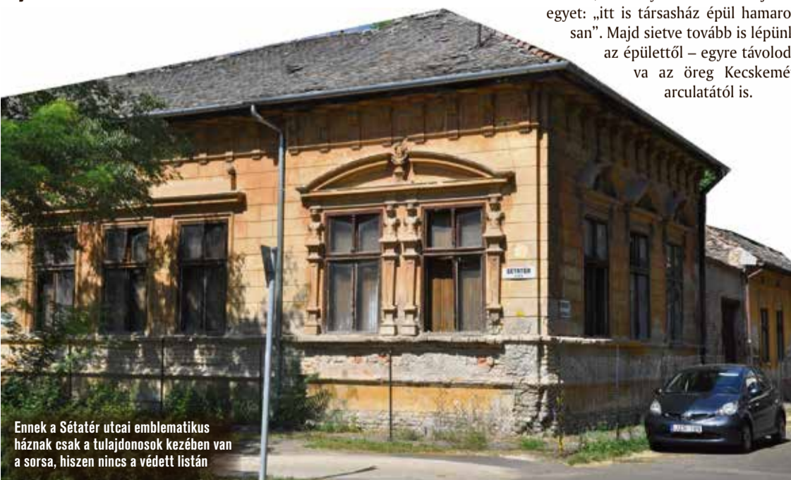
Ennek a Sétatér utcai emblemikus háznak csak a tulajdonosok kezében van a sorsa, hiszen nincs a védett listán